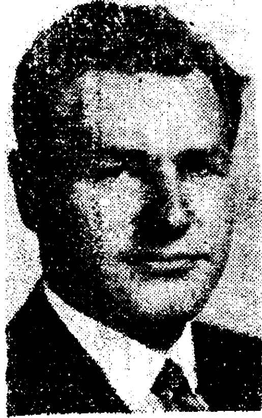
Nelson A. Rockefeller

Pondo em prática essa realização, o senhor Rockefeller durante sua recente visita ao Brasil iniciou a nova associação e dentre inumeras idéias postas, em discussão optou ele por tres projetos primordiais na realização dos quais se propõe a American International Association trabalhar em