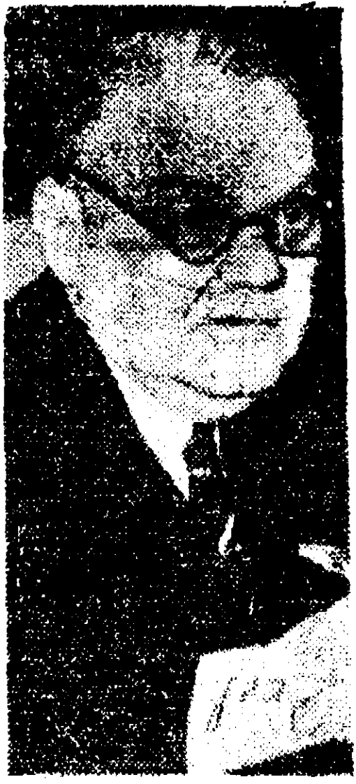
MINISTRO JOSÉ LINHARES.

RIO, 8 — AN — Sob a presidência do Ministro José Linhares, reuniu-se hoje o Tribunal Superior Eleitoral, para consulta do Tribunal Regional do Rio Grande do Norte sobre se os tribunais regionais são competentes para processar e julgar os crimes eleitorais. O Tribunal Superior respondeu que cabe aos mesmos processar e julgar os crimes eleitorais. Ainda a sessão o presidente Linhares falando aos jornalistas fez o protesto contra a notícia publicada hoje num matutino em torno dos boatos referentes ao adiamento das eleições. Declarou que a crítica é injusta e precipitada. Acrescentou sua excitação, não ter motivos para haver adiamento das eleições, e tomará todas as providências para o envio de material necessário a esse fim. Todos os Tribunais Regionais desde trinta e um de dezembro último estavam supridos do material eleitoral. O ministro da Justiça vem sendo informado constantemente das providências tomadas nesse sentido — concluiu o ministro José Linhares.