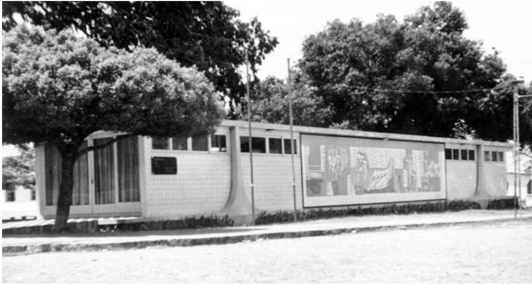
FIGURA 06 – Galeria de Arte da praça de cultura André de Albuquerque.