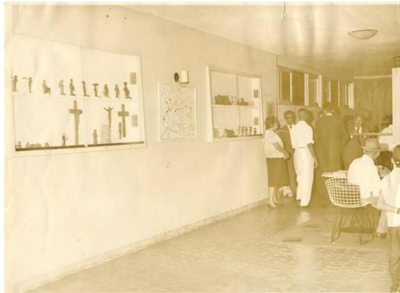
FIGURA 08 – Interior da Galeria de Arte.