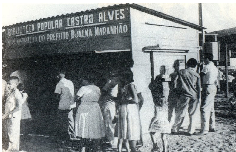
FIGURA 05 – Biblioteca Popular Castro Alves. Na lateral da biblioteca estava o mural.

Em 1963, na praça André de Albuquerque foi instalada a Biblioteca Popular José de Alencar, entretanto, nesta não eram efetuados empréstimos de livros, havia em frente a biblioteca mesas ao ar livre para a prática de leitura. Segundo Moacyr de Góes, as homenagens prestadas a José de Alencar, Castro Alves e Monteiro Lobato, como patronos das bibliotecas populares, tinham suas raízes nas lutas de emancipação da cultura do povo brasileiro. José de Alencar, o nativismo; Castro Alves, o social; Monteiro Lobato, o econômico. “Eram os alicerces do Plano de Democratização da Cultura ganhando profundidade na consciência 281 do povo”.