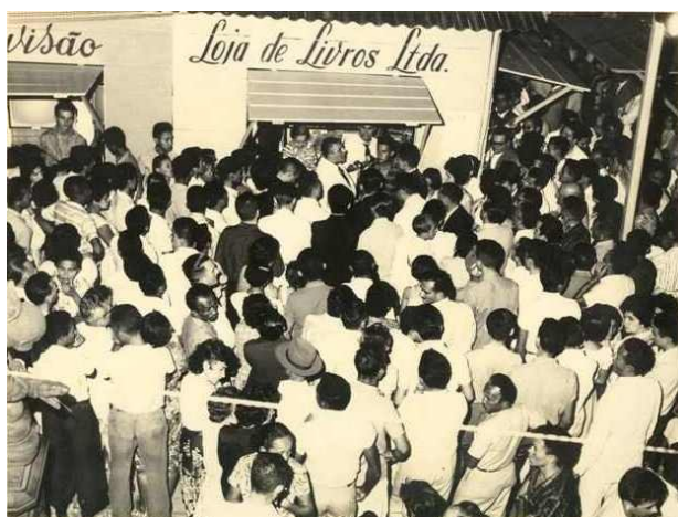
FIGURA 03 – I Praça de Cultura. Os livros eram expostos nas lojas de livros.