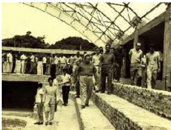
FIGURA 01- Ginásio municipal na época de sua construção. Atual Ginásio Djalma Maranhão, localizado na Praça Pedro Velho, no bairro de Petrópolis.

modernos passeios de nossa capital”; construção da Praça de Desportos e do parque infantil, no Bairro de Dix-sept Rosado), construção da praça Tomaz Araújo, no bairro da Cidade alta, quadra do Hospital Colônia; parques infantis, localizados junto às quadras nos bairros de Nova Descoberta, na Praça João Galvão, no Bairro de Petrópolis; no Bairro das Quintas, na Vila de Sargentos do Exército, restauração da Praça Augusto Severo e a construção do Palácio dos Esportes na Praça Pedro Velho. 229