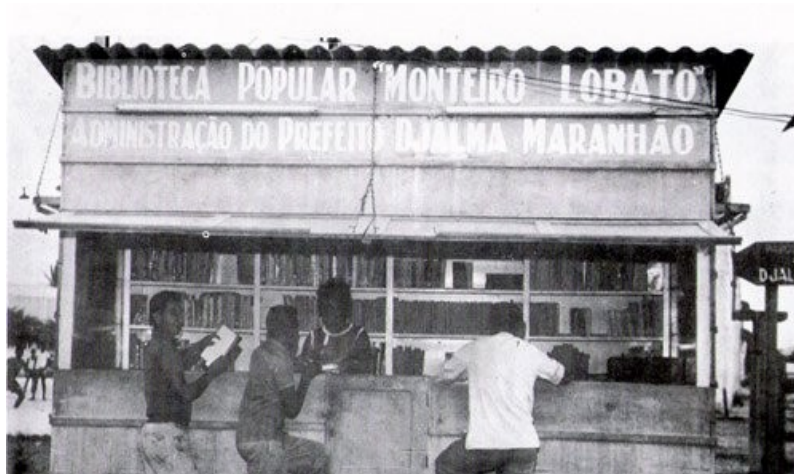
FIGURA 04 – Biblioteca Popular Monteiro Lobato.