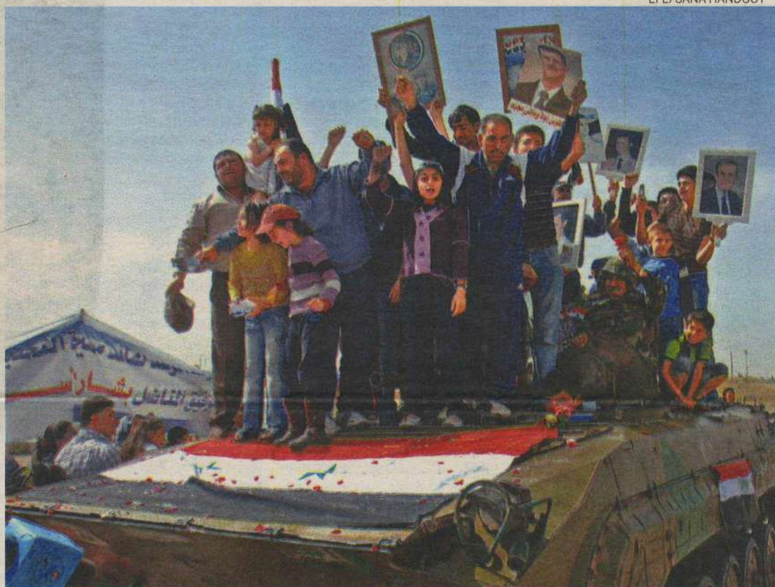
Síria vivencia um clima perigoso de "guerra civil" e a repressão do governo tem sido violenta contra os protestos

Com sede em Genebra, o Conselho de Direitos Humanos é formado por 47 países e tem o ob-