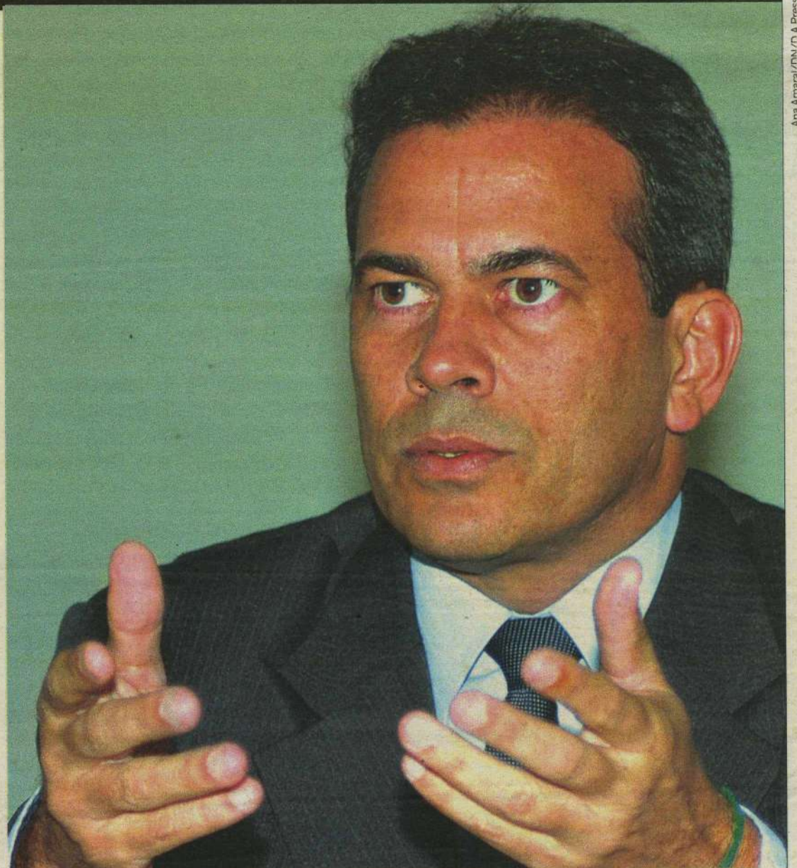
Nome do parlamentar para substituir Clóvis Emídio foi lançado pelo Conselho Deliberativo alvirrubro

sempre estarei ajudando do América", afirmou o deputado.