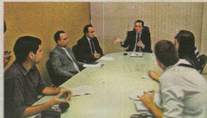
Medidas anunciadas foram consideradas insuficientes pelos policiais civis