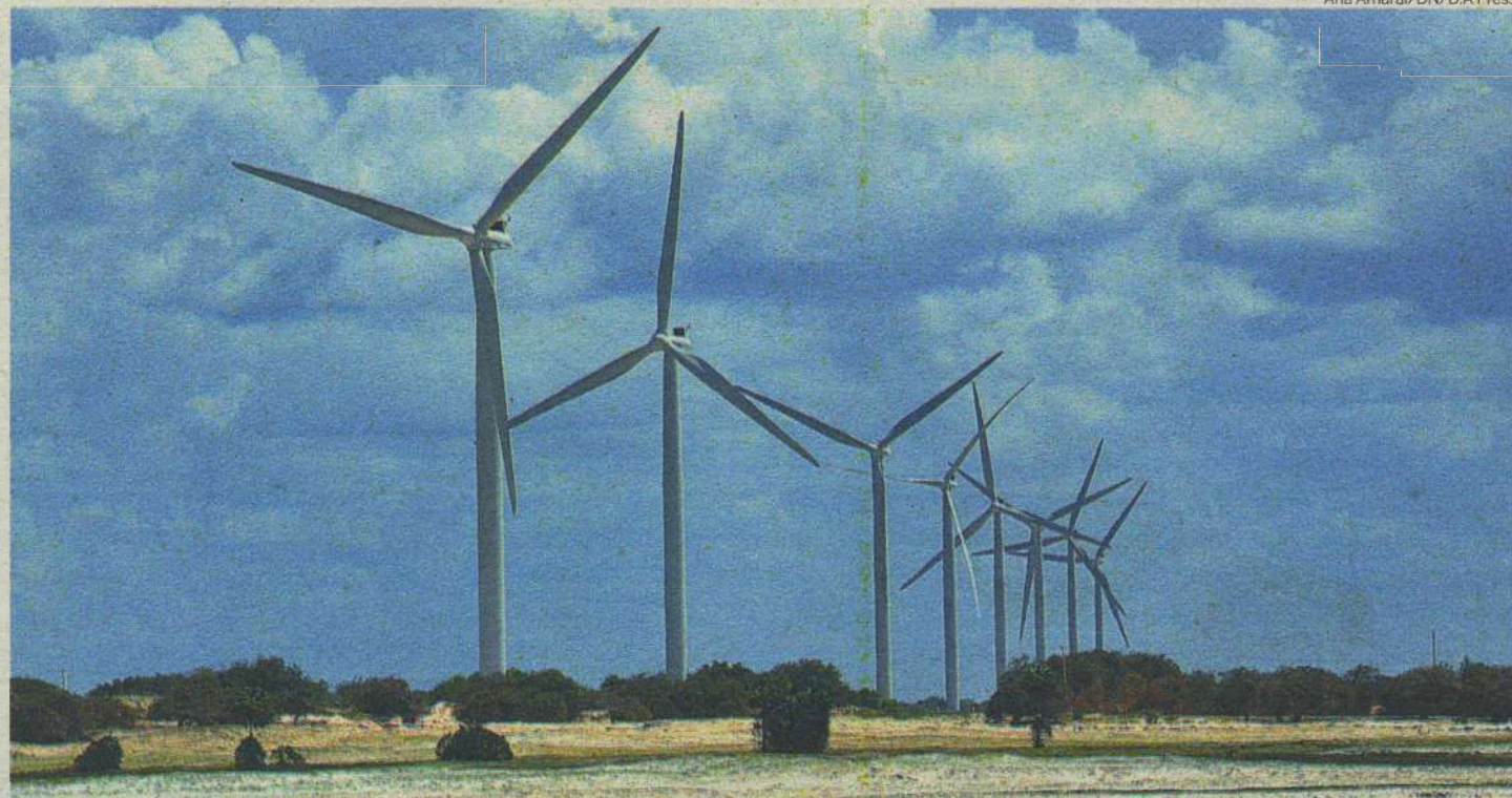
15 das 24 propostas aprovadas pela Sudene estão no RN. Empreendimentos serão financiados com recursos do Fundo de Desenvolvimento do Nordeste (FDNE)