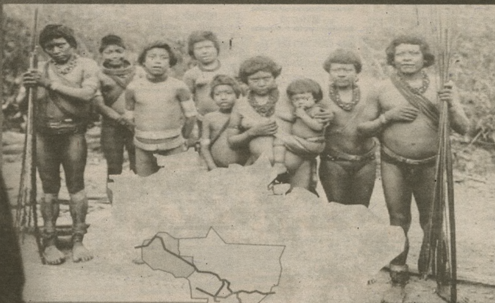
Acervo Museu do Índio/FUNAI, índios Urumi. Foto Trüba.