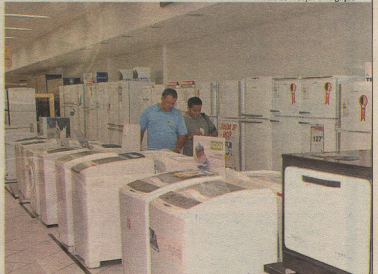
Preços estarão mais baixos nas lojas por pelo menos três meses

Para os carros “mil”, depois de setembro, o imposto voltará a aumentar gradualmente, voltando ao patamar de 7% em janeiro.