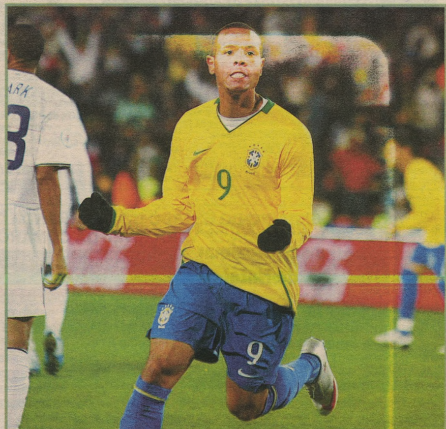
LUÍS FABIANO MARCOU DOIS GOLS NA VIRADA HISTÓRICA EM CIMA DOS AFOITOS NORTE-AMERICANOS