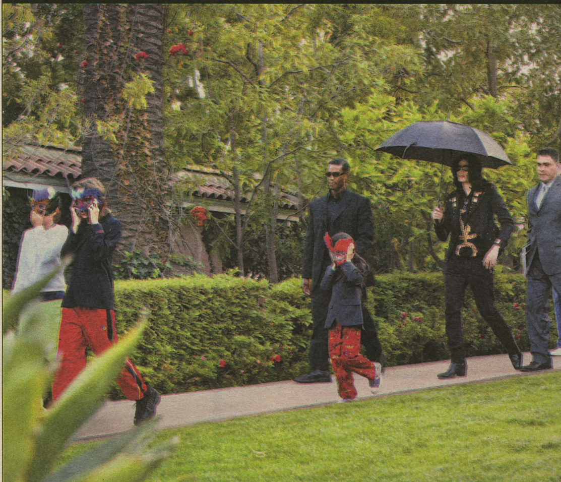
Juiz antecipou a análise do processo, marcada para o começo de agosto. Os herdeiros do cantor têm 7, 11 e 12 anos