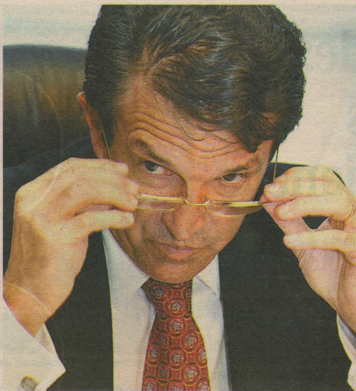
Maia (foto) e a funcionária nomeada devem ser ouvidos esta semana

O Senado deve anunciar ainda nesta semana procedimento ad-