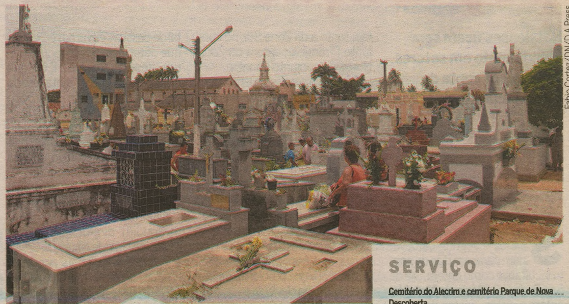
Cemitério do Alecrim é um dos que têm jazigos irregulares na capital

Os documentos necessários para obter a licença são: cópias do registro de óbito, casamento ou nascimento do familiar, identidade, CPF e a certidão negativa do município. Para maiores informações, o cidadão deve procurar o Departamento de Cemitérios da