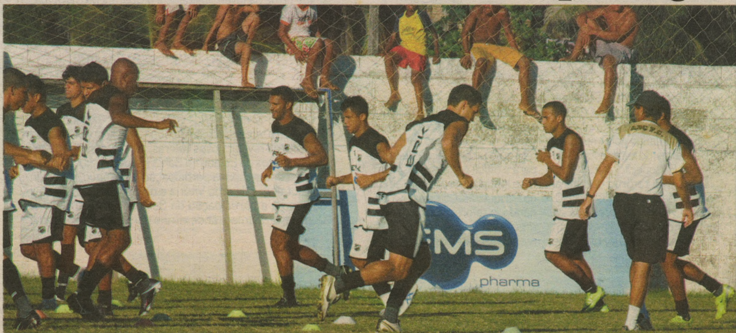
Depois da péssima derrota para o Atlético de Goiânia, plantel promete a recuperação na próxima rodada contra os mineiros no estádio Frasqueirão