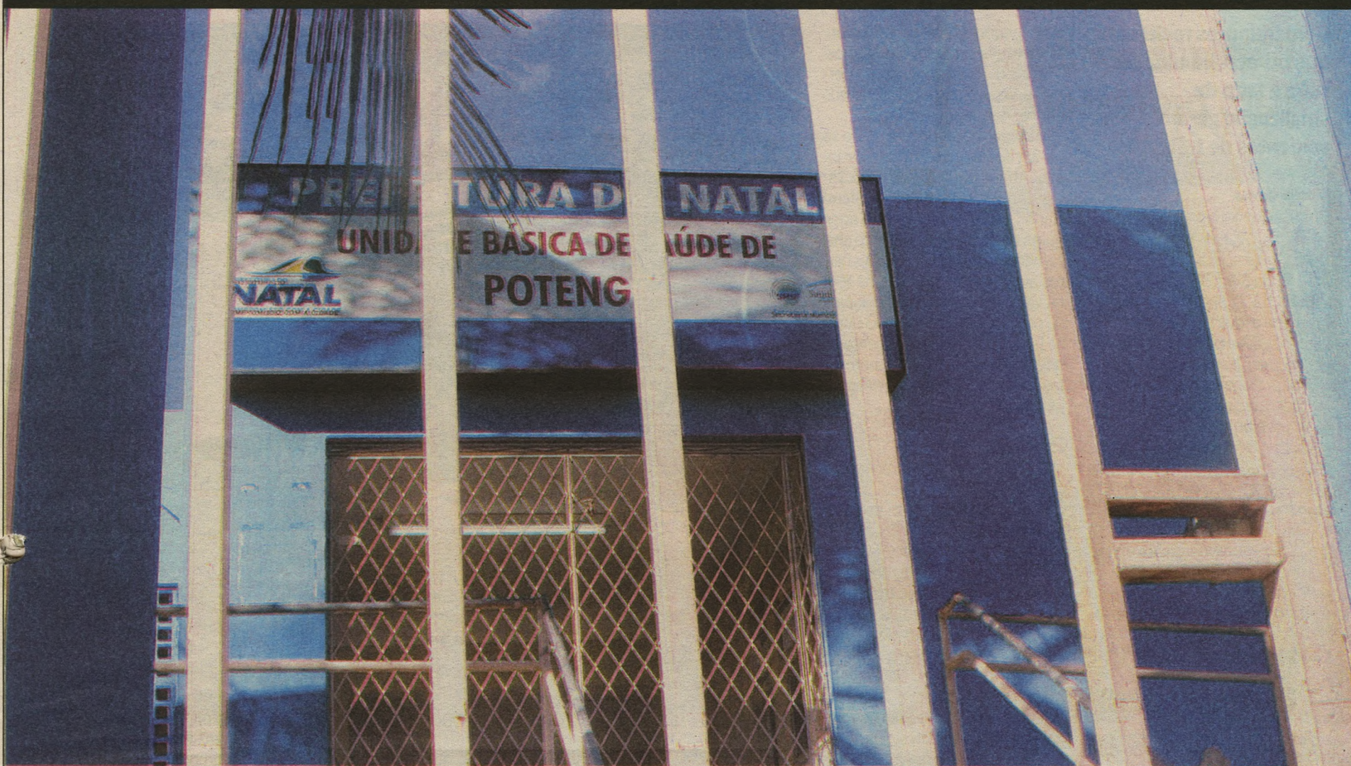
Unidade de saúde em Santarém ficou fechada. A estudante Celi (abaixo) procurou ajuda médica nas Rocas, sem sucesso