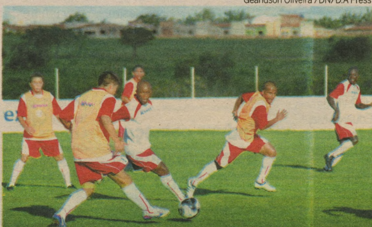
Equipe rubra se prepara para o próximo desafio contra o lanterna Campinense