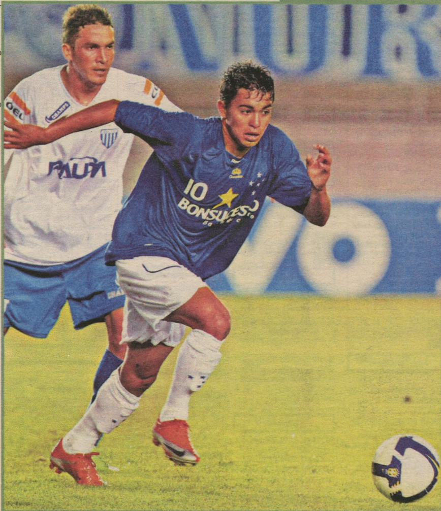
TIME DO CRUZEIRO DERROTOU O FRACO AVAÍ PELO PLACAR DE 1X0, NO ESTÁDIO DO MINEIRÃO