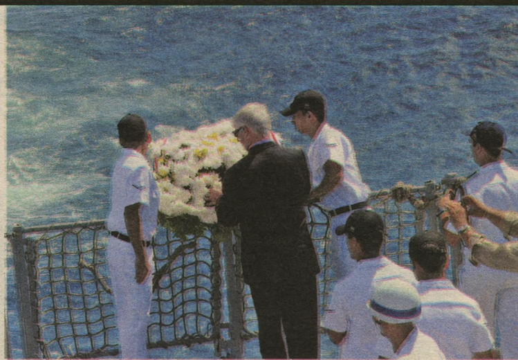
Marinheiros atiraram coroas de flores a 14 quilômetros da costa brasileira