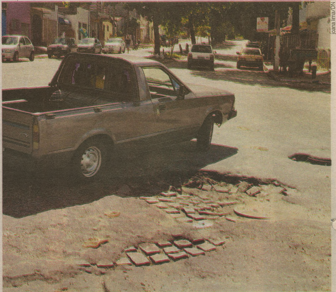
Extenso buraco é apenas um dos perigos que elevam risco de acidentes na rua do bairro de Dix-Sept Rosado