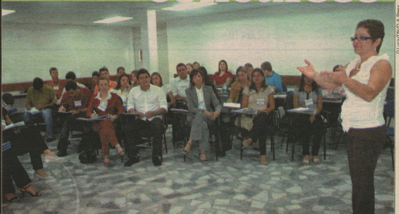
Instituição oferece o treinamento nos dois prédios em Natal - em Lagoa Nova (sede) e na Zona Norte - e nas demais do interior