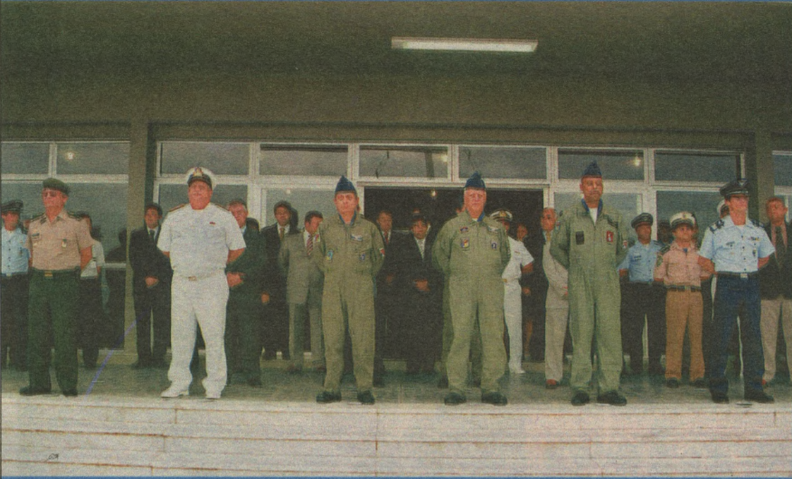
Contei, ontem, como foi a despedida do brigadeiro Holanda e a posse do brigadeiro Botelho. O fotógrafo Arimatéia mostra dois flagrantes especiais da solenidade

e-mail: paulomacedo.rn@diariosassociados.com.br