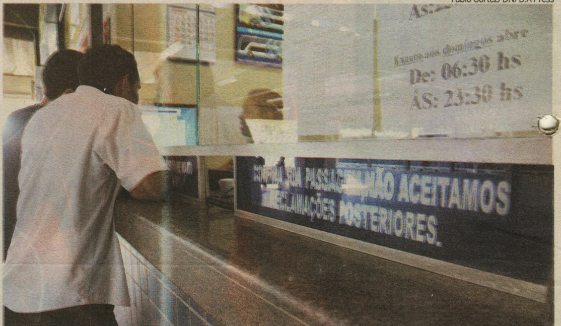
Guichê da Rodoviária Nova, na Cidade da Esperança: passageiros e empresas não acreditam em redução da demanda

A partir desta quarta-feira, quem quiser viajar de ônibus para outros estados pagará mais caro pela passagem. A Agência Nacional de Transportes Terrestres (ANTT) autorizou ontem um aumento de 7,05% sobre o coeficiente tarifário dos serviços prestados pelas empresas. O reajuste das tarifas para transporte rodoviário interestadual e internacional de passageiros foi publicado por meio de resolução no Diário Oficial da União, que entra em vigor a partir da 0h de amanhã, 1º julho, e cita a "necessidade de manter o equilíbrio econômico-financeiro das permissionárias do transporte rodoviário". Os passageiros que utilizam as linhas interestaduais concordam que o aumento no preço da