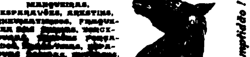
Efeito e promptidão!

Cura certa de: MANGONHAS, ESPRAVOS, RESOVAS, INFLAMTAÇÕES, FURÚNCULOS, FERIDAS, etc.