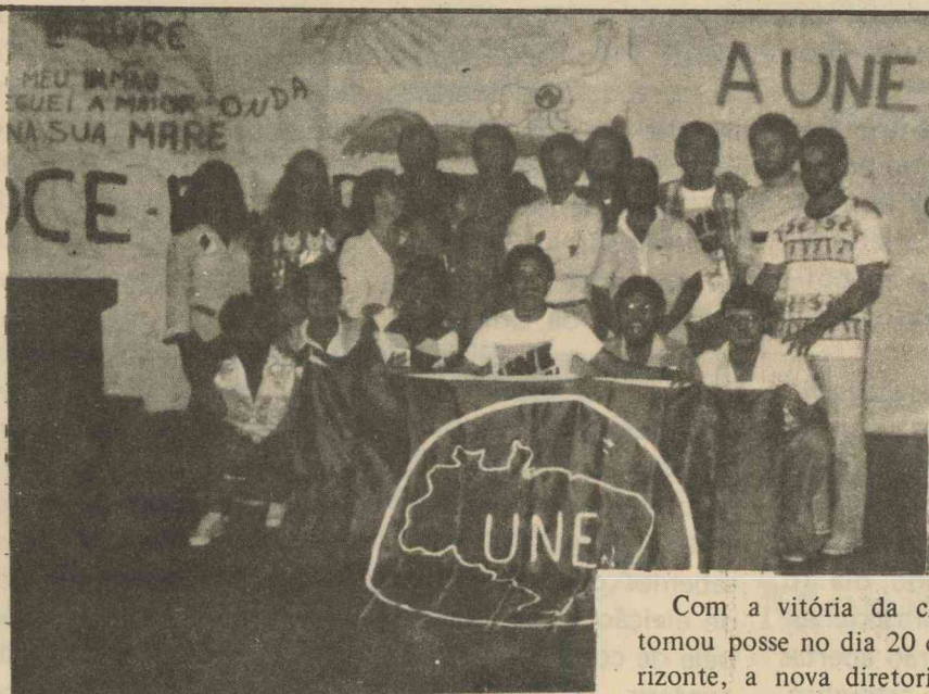
Componentes da Diretoria

Com a vitória da chapa "UNE LIVRE", tomou posse no dia 20 de junho, em Belo Horizonte, a nova diretoria da UNE. Estiveram presentes várias entidades de todo o Brasil, inclusive o DCE — UFRN.