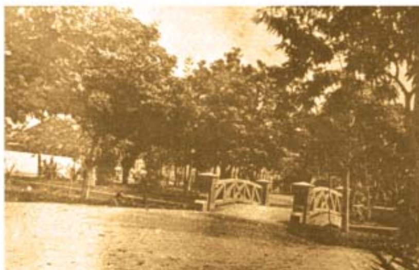
Foto ao lado. Praça Augusto Severo . Outro ângulo da ponte rústica e canal.