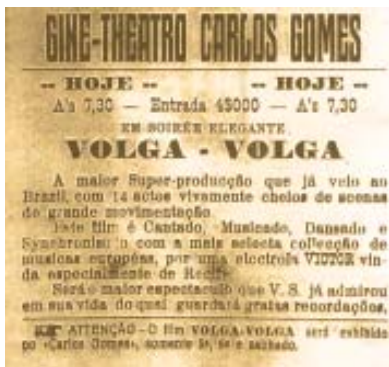
Anúncio do Cine-Theatro Carlos Gomes. A República, 8 maio 1930.