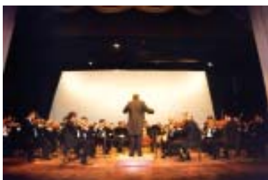
Orquestra Sinfônica do RN: concerto oficial.

O novo regente estreou em concerto realizado no Palácio da Cultura, a 29 de julho; no TAM, teve seu primeiro concerto oficial a 31 de agosto.