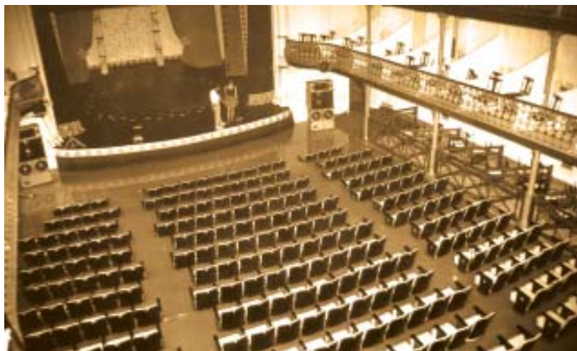
Alagamentos; chuvas de 5 de abril de 1992; interior do TAM.