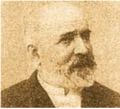
Mathurin Moreau, autor da estátua da Arte. Foto em Nos Peintres et Sculpteurs, Paris, 1897.

Faleceu em Paris, a 14 de fevereiro de 1912. Recebeu a Legião de Honra como Cavaleiro em 1885; exerceu a função de maire (administrador) do XIX ème arrondissement , (19º distrito administrativo) na capital francesa; ali, uma grande avenida tem o seu nome.