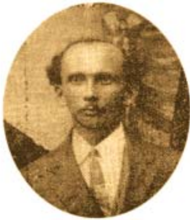
Ferreira Itajubá, um dos destacados poetas do Rio Grande do Norte, também teve seu momento de teatrólogo.

Já o DIÁRIO DO NATAL (1907), do mesmo dia, foi um pouco mais longe em sua crítica: