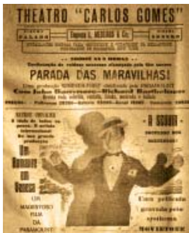
Cine-Theatro Carlos Gomes, 9 de junho de 1931. Início de atividades com "A Parada das Maravilhas".