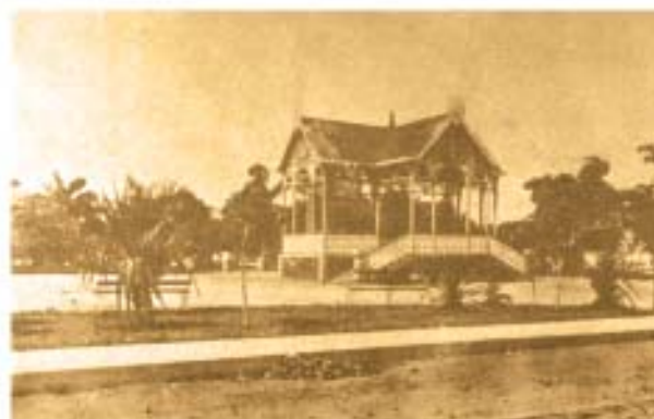
Foto acima/direita. Praça Augusto Severo. Coreto, demolido.