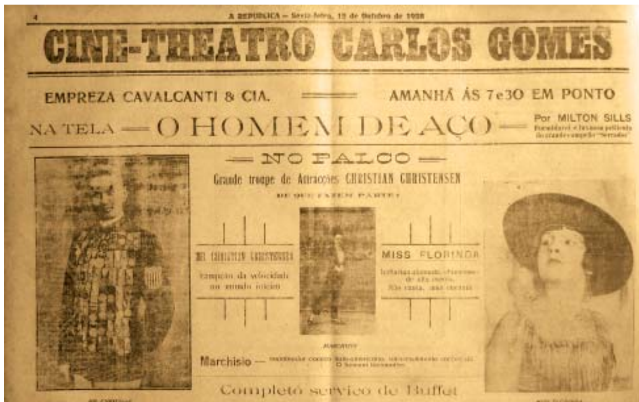
Inauguração do Cine-Theatro Carlos Gomes, com o filme “O Homem de Aço”, 13 de outubro de 1928.

de 1930, devendo os arrendatários pagar por ano ao Governo a importância de cinco contos e seiscentos mil réis e, no último ano, sete contos e seiscentos mil réis.