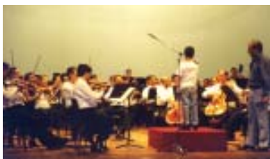
Orquestra Sinfônica do RN: concerto educativo.