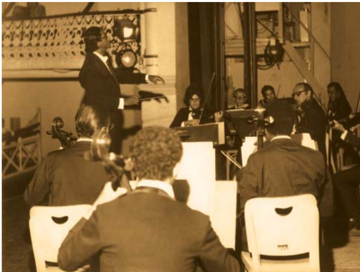
Orquestra Sinfônica do RN: primeiro concerto (11 de março de 1977).

cidade, elaborou um projeto para a implantação de uma pequena orquestra que seria transformada depois em sinfônica, a ser financiada pelo Governo do Estado. Encaminhado aos setores competentes, o projeto foi esquecido numa gaveta burocrática qualquer.