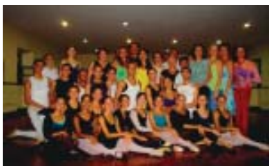
Escola de Dança do Teatro Alberto Maranhão: Companhia de Dança, diretores, professores e funcionários.