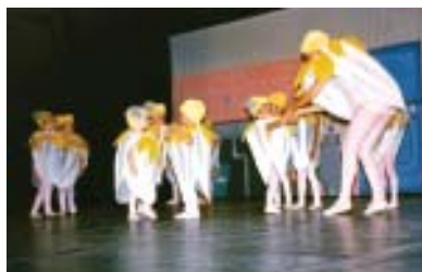
Escola de Dança do TAM Espetáculo “Deu a louca na cozinha”, (6 e 9 de novembro de 1986).