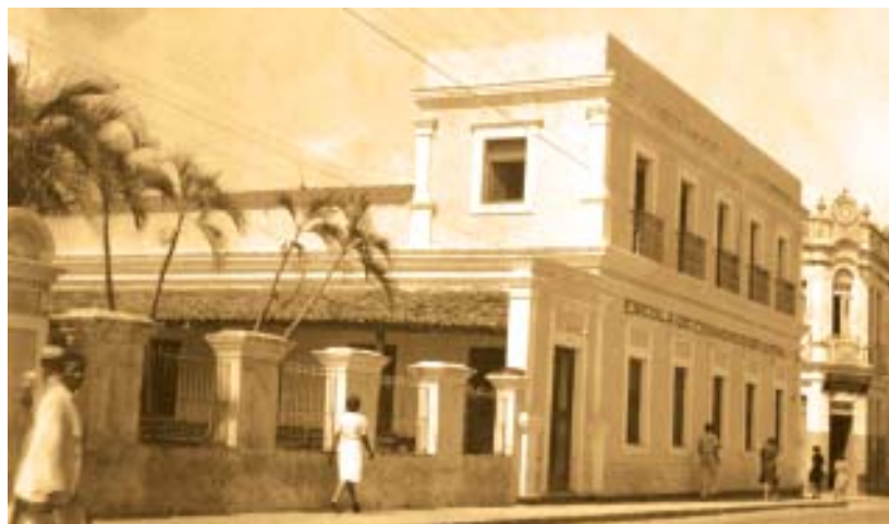
Antigo prédio da Escola Técnica de Comércio de Natal, atual Rádio Nordeste, onde se localizava o Teatro Santa Cruz.