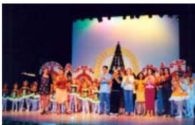
Escola de Dança do TAM Espetáculo “Luzes de Natal”, 2001.