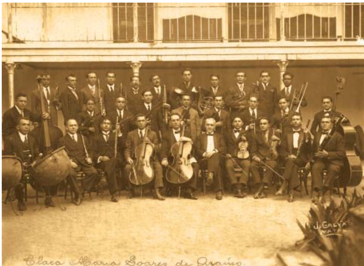
Orquestra do Theatro Carlos Gomes, nas comemorações do Centenário da Independência (1922).