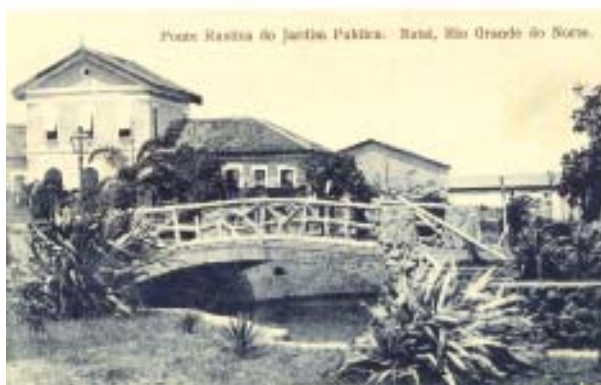
Foto acima/esquerda. Praça Augusto Severo vendo-se a ponte rústica e o canal.