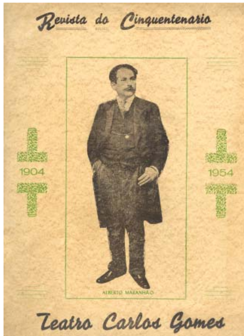
Revista do Cinquentenário, publicada em 1954.