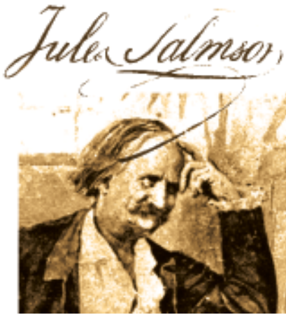
Jean-Jules Salmson, desenho da capa do seu livro Entre deux coups de ciseau. Souvenirs d'un sculpteur . Paris, Genève, 1892.

87. Entre deux coups de ciseau. Souvenirs d'un sculpteur . Paris, Genève, 1892.