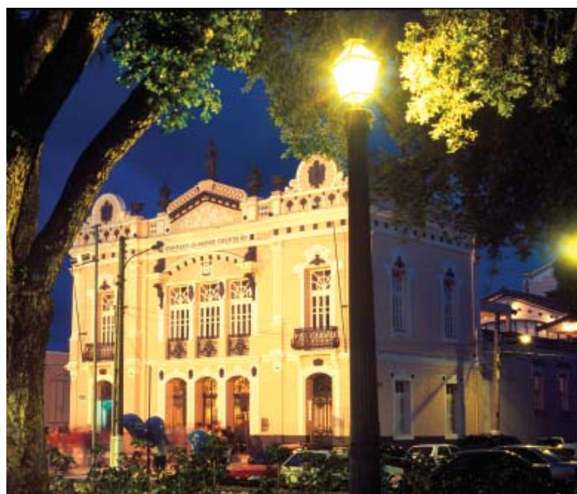
Fachada do Teatro Alberto Maranhão.