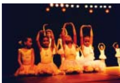
Espectáculo infantil. Escola de dança do TAM.