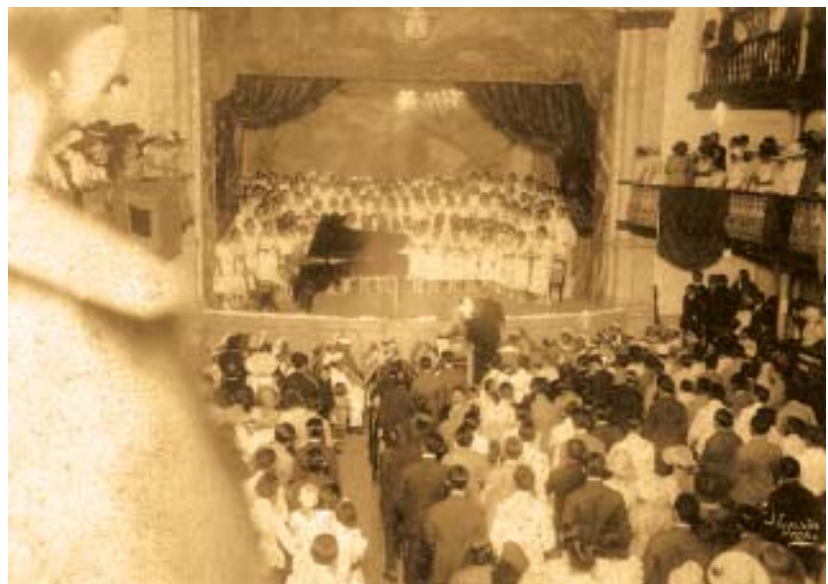
Foto ao lado. Público lotando a platéia. Centenário da Independência (1922).