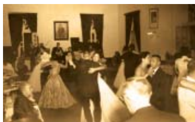
Reabertura do Salão Nobre do TCG. Baile a rigor.

A partir de 1912 passou a ser o local preferido para grande número dos mais diversos eventos.