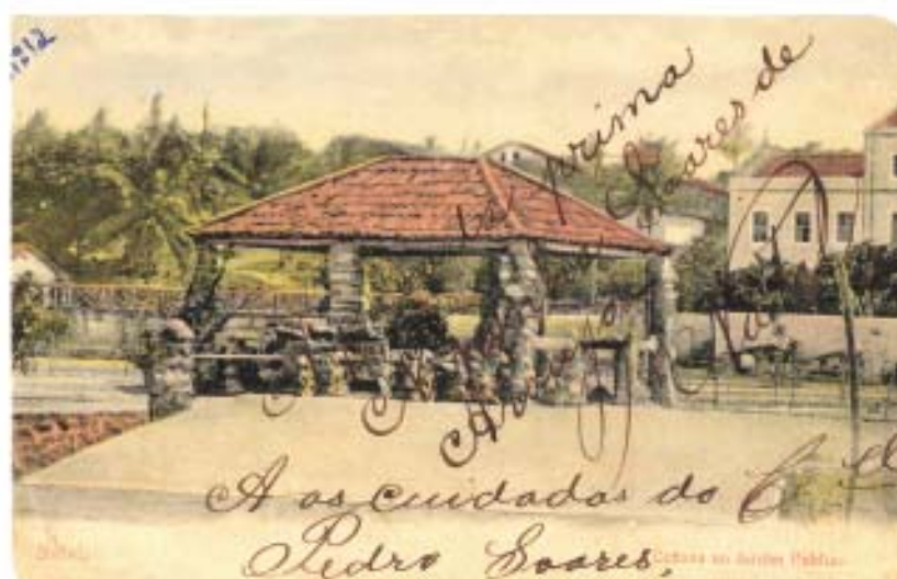
Foto ao lado. Detalhe da Praça Augusto Severo. Foto de Bilhete Postal, sem identificação e data. Coleção Clara Soares de Araújo. Arquivo do Diário de Natal.

Foto acima. Local onde seria construído o Jardim Público, atual Praça Augusto Severo. Foto de Bilhete Postal, sem identificação e data. Coleção Clara Soares de Araújo. Arquivo do Diário de Natal.