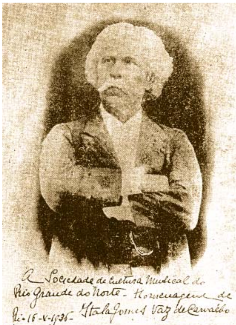
Maestro Carlos Gomes. Foto da capa da revista SOM, Natal, 1939.

No dia 12 foi inaugurada a Praça Carlos Gomes, com discurso do Prefeito Gentil Ferreira de Souza e distribuição ao público de 10 mil fotografias do compositor. Os membros do Centro Estudantil Potiguar convidaram Waldemar de Almeida para ministrar uma conferência sobre Carlos Gomes, o que se verificou na tarde daquele dia, seguindo-se uma passeata composta de estudantes, que percorreu a cidade portando bandeiras e proferindo ovações ao compositor.