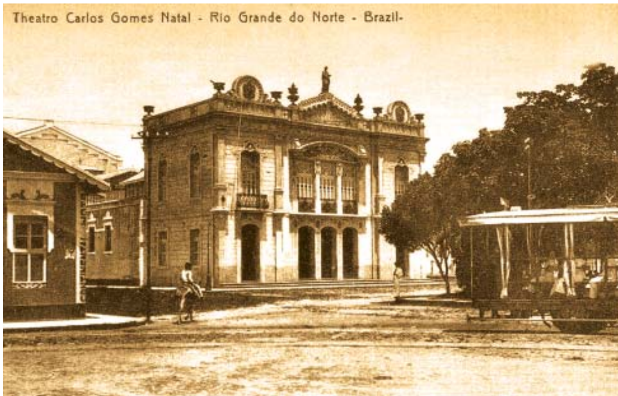
Theatro Carlos Gomes em 1913. Foto de cartão postal. Autor não-identificado.