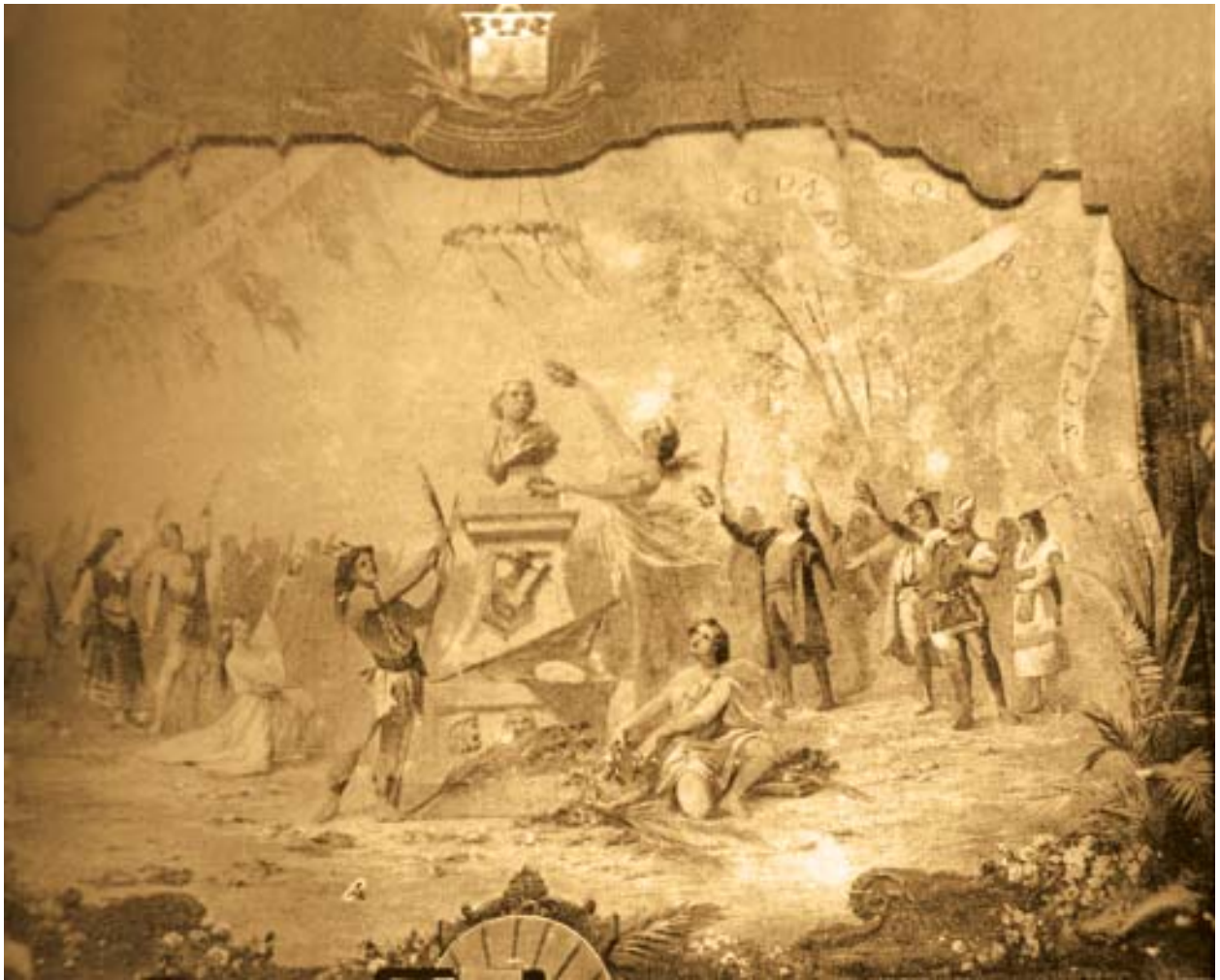
Pano-de-boca do Theatro Carlos Gomes. 1912. Pintado pelo cenógrafo francês Eugène-Louis Carpezat.