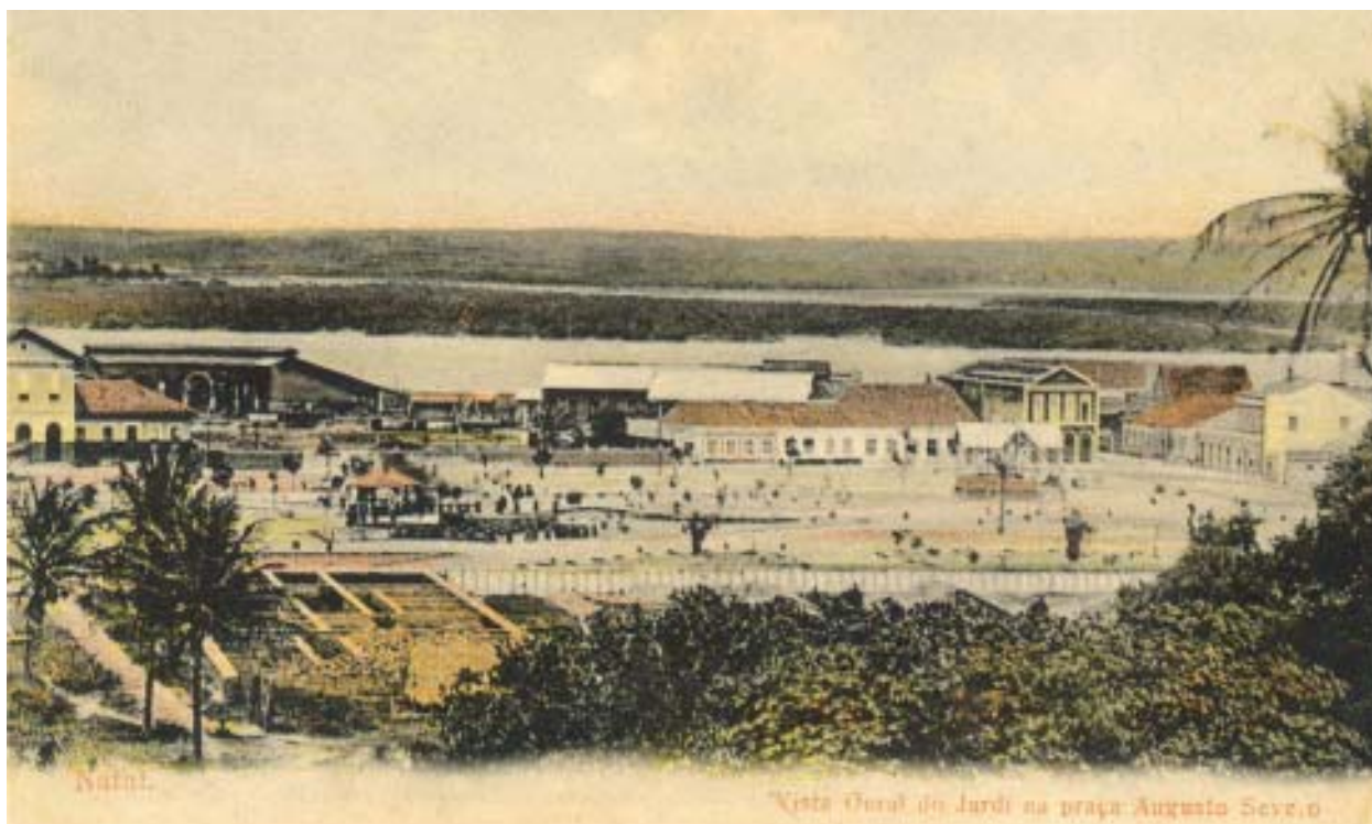
Foto acima. Local onde seria construído o Jardim Público, atual Praça Augusto Severo. Foto de Bilhete Postal, sem identificação e data.

Foto ao lado. Detalhe da Praça Augusto Severo. Foto de Bilhete Postal, sem identificação e data.