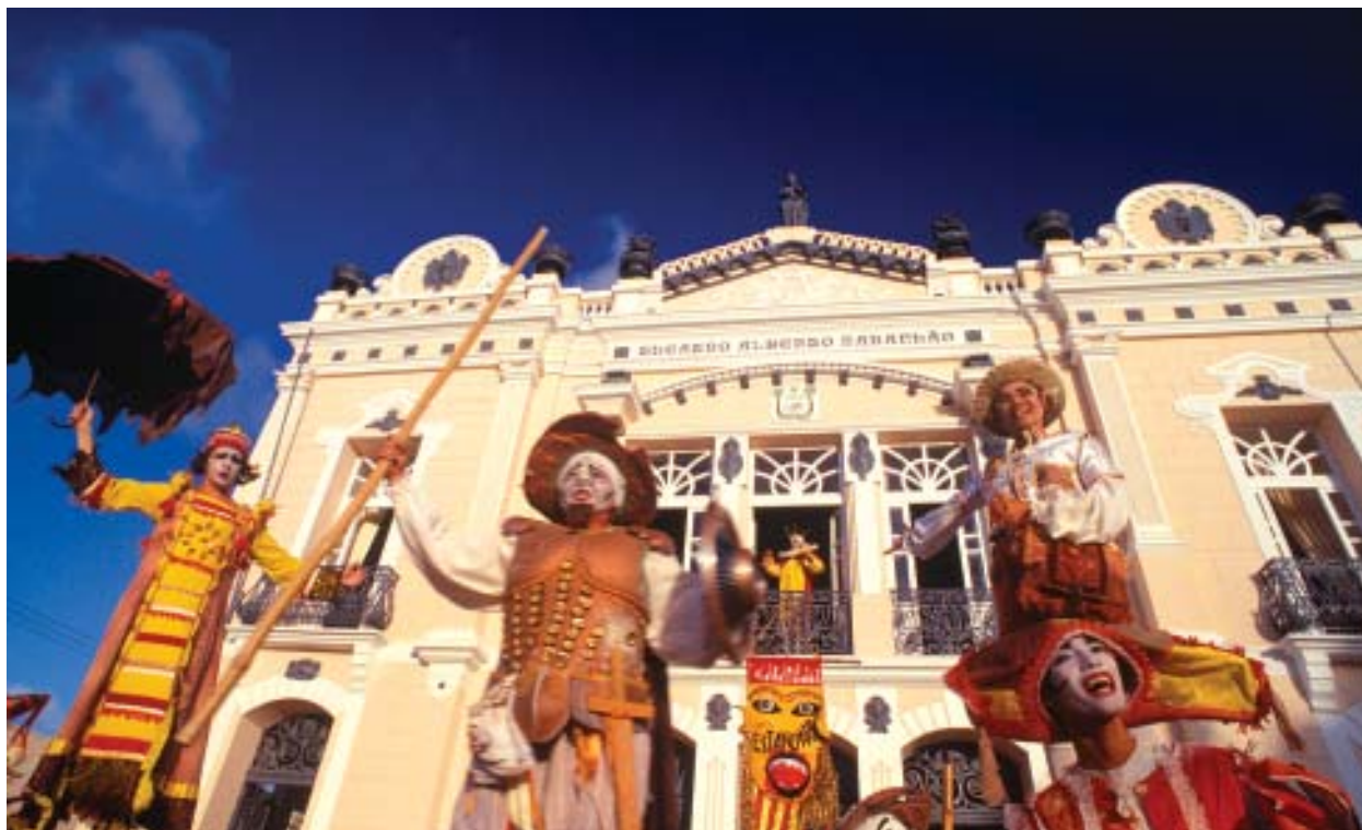
Teatro Alberto Maranhão. Unindo o erudito ao popular.