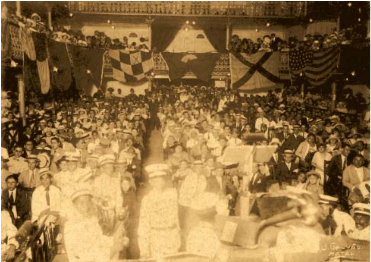
Foto acima. Interior do Theatro Carlos Gomes, durante um evento do Centenário da Independência (1922).