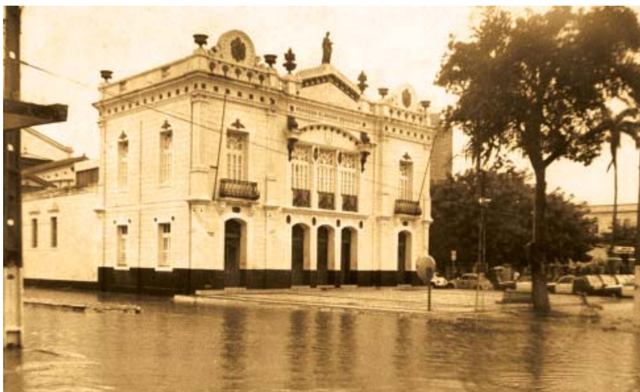
Alagamento da Praça Augusto Severo, em decorrência das chuvas de 5 de abril de 1992.

Após a execução dos serviços, responsáveis técnicos advertiram para a necessidade de manutenção das galerias, prevenindo para um provável entupimento por lixo acumulado.