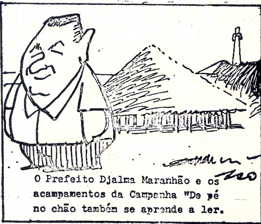
O Prefeito Djalma Maranhão e os acampamentos da Campanha "De pé no chão também se aprende a ler."

Nossos bairros têm se caracterizado, entre outros aspectos, por suas lutas. Dentre essas lutas destacam-se a invasão da Brasília Teimosa e do Vietnã, quan-