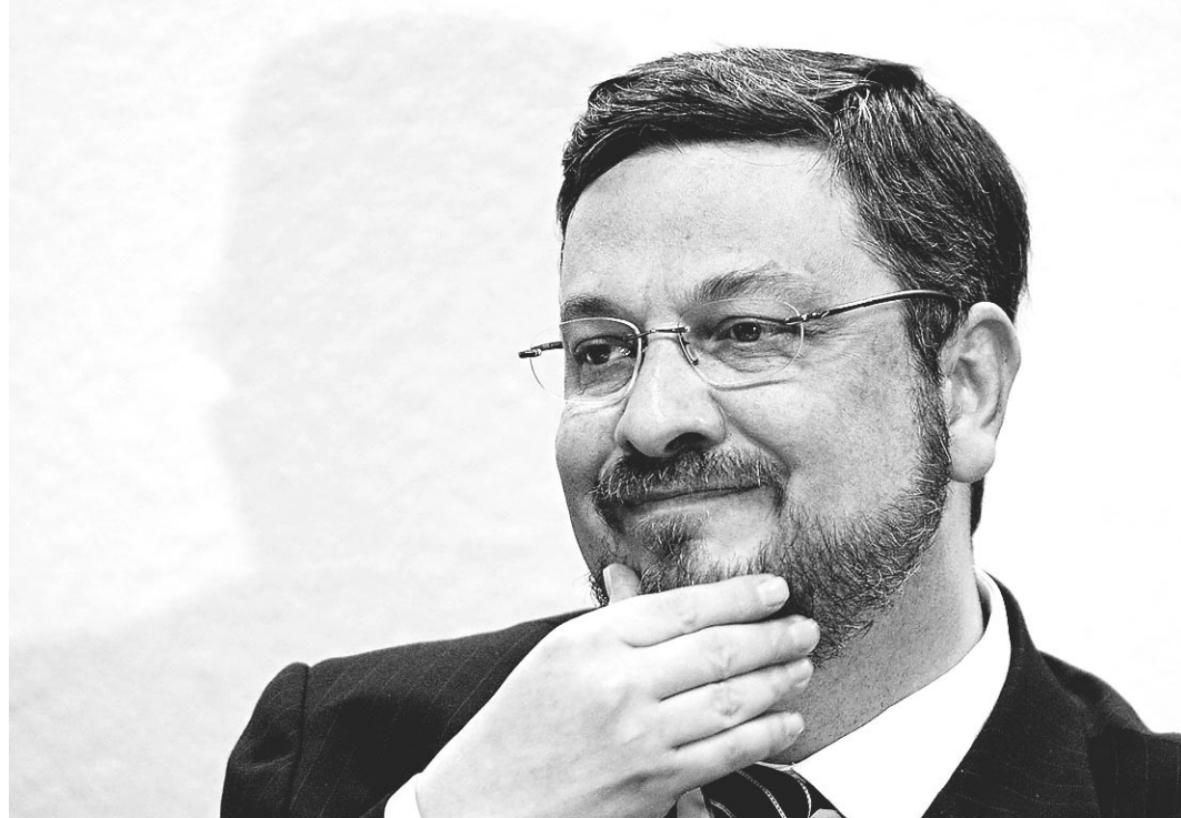
// Antonio Palocci: preso desde na 35.ª fase da Operação Lava Jato, desde 26 de setembro

Como exemplo, eles citam as tentativas de aprovar mudanças na Lei de Abuso de Autoridade no Senado e as alterações feitas pela Câmara no pacote de 10 Medidas contra a Corrupção - projeto de iniciativa popular encabeçado pelo Ministério Público Federal.