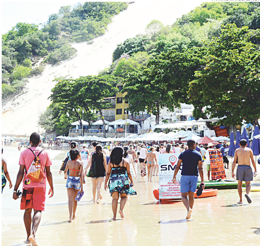
// Feriados este ano devem causar 2% a mais de prejuízos financeiros ao comércio em relação a 2016

O setor de vestuário, tecidos e calçados deverá deixar de ganhar cerca de R$ 1,1 bilhão com os feriados e emendas de 2017, um crescimento de 23% em relação a 2016. No lado oposto, o segmento de outras atividades - em que é preponderante o comércio de combustíveis, além de joias e relógios, e artigos de papelaria - deixará de ganhar cerca de R$ 3,9 bilhões, 8% a menos que em 2016, o único setor a não apresentar crescimento das perdas.