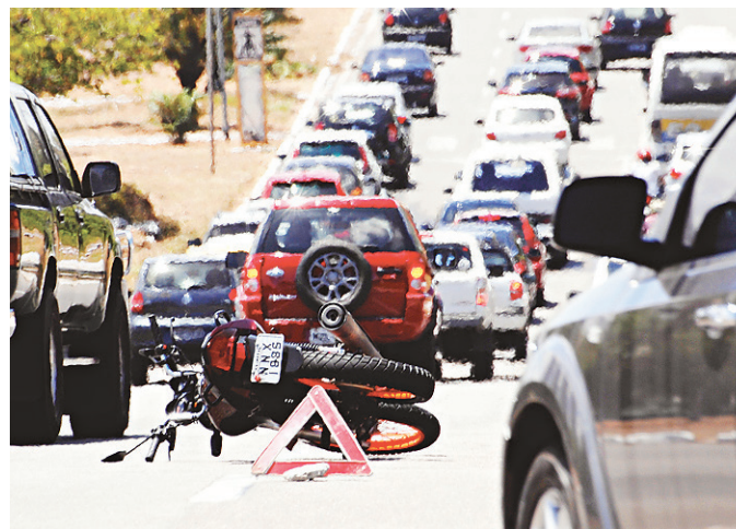
// PRF justifica redução de acidentes em decorrência da fiscalização

Ainda segundo a pesquisa, 46% das rodovias federais e estaduais que cortam o Rio