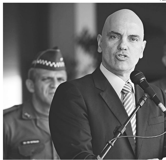
// Moraes diz ser urgente reduzir população carcerária

Atualmente, o PCC domina o tráfico de drogas na favela da Rocinha, no Rio, o que aumenta a tensão com o CV. Com cerca de cem mil moradores, a favela é considerada pela polícia a área do Rio onde o tráfico de drogas é mais rentável. A comunidade era dominada pela Amigo dos Amigos (ADA), facção rival do CV. O PCC firmou uma parceria com a ADA, aliança que começou na rua e teve reflexos nos presídios. Em Bangu 4, bandidos que aderiram ao PCC pediram transferência para uma ala destinada à ADA.