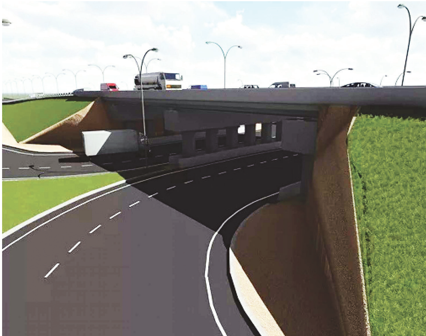
// Com as novas regras para liberação de recursos em convênio com União, Governo quer facilitar fiscalização de obras de pequeno porte