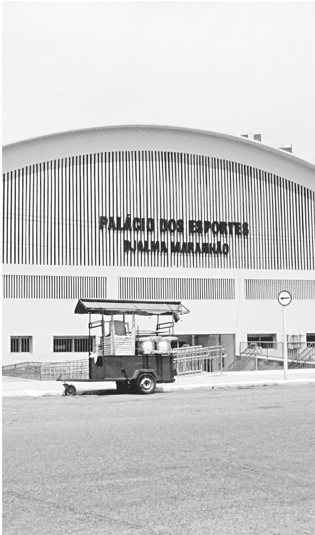
// SEL não tem autonomia para gerir recursos e promover eventos, segundo o titular da pasta

Ao todo, segundo o secretário, a Prefeitura tem 94 quadras esportivas espalhadas por toda Natal, além de 22 campos de futebol e os "campos de areia, a gente nem conta". "Mas a manutenção é bem complicada", destaca.