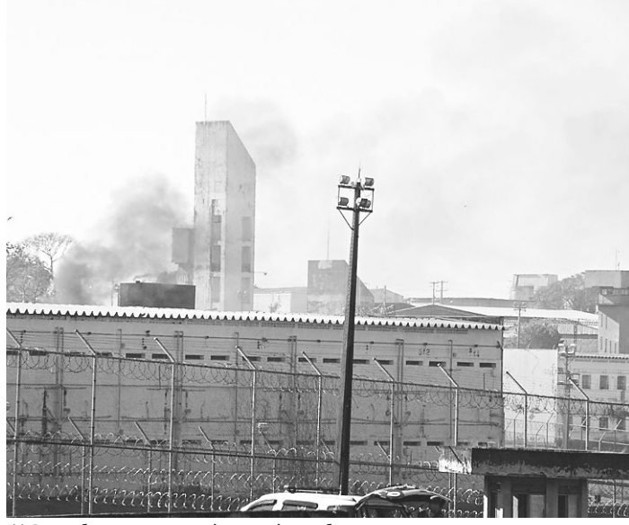
// Complexo Penitenciário Anísio Jobim em Manaus: massacre