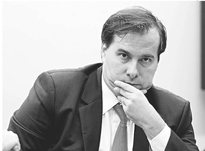
// Rodrigo Maia, candidato não oficialmente confirmado à reeleição

O foco do presidente da Câmara tem sido garantir apoio do PMDB, maior partido da Casa e a quem o deputado do DEM ofereceu a primeira vice-presidência da Câmara em sua chapa. Ele também articula para tentar rachar o Centrão, grupo de 13 partidos da base aliada ao governo, liderado por PP, PSD e PTB, e que tem dois candidatos ao comando da Casa.