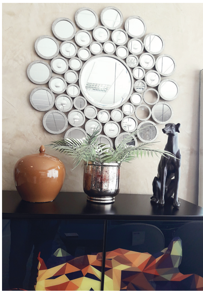
// Armário em laca com print e adornos na Spasso Ambiente.

B risa de oportunidades incríveis nas liquidações de verão e final de ano nas loja de decoração. Uma procura bem orientada e planejada é possível renovar espaços e comprar "aquela peça" capaz de dar um "up" na casa. A arquiteta Lorena Medeiros diz que, e o momento é propício para comprar, inicie o planejamento a partir de peças que são "chave". Por exemplo, na a sala de estar o sofá seria a primeira peça a ser escolhida. Se pensa em novidade na sala de jantar, comece a pensar a partir da mesa. O ideal é fazer aquisição tendo como alidade a orientação de um profissional capaz de indicar as dimensões ideais ao projeto de ambientação. Como a onda de preços especiais vão de lojas como Etna, Spasso Ambiente à Movelaria, só para citar alguns endereços do circuito da decoração, à loja de móveis externos tais Mac até viveiros de plantas, a atualização da ambientação deve ser racionalizada com a real necessidade da família no momento. "A dica que dou nesse momento: deem prioridade em finalizar um ambiente de cada vez! Por exemplo, não saiam comprando coisas, faça uma lista de prioridades, a cozinha e closet, são os ambientes que considero prioridade em um projeto! É