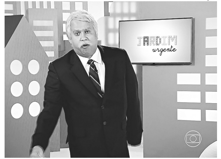
// Nova tempora traz quadros clássicos, como "Jardim Urgente"