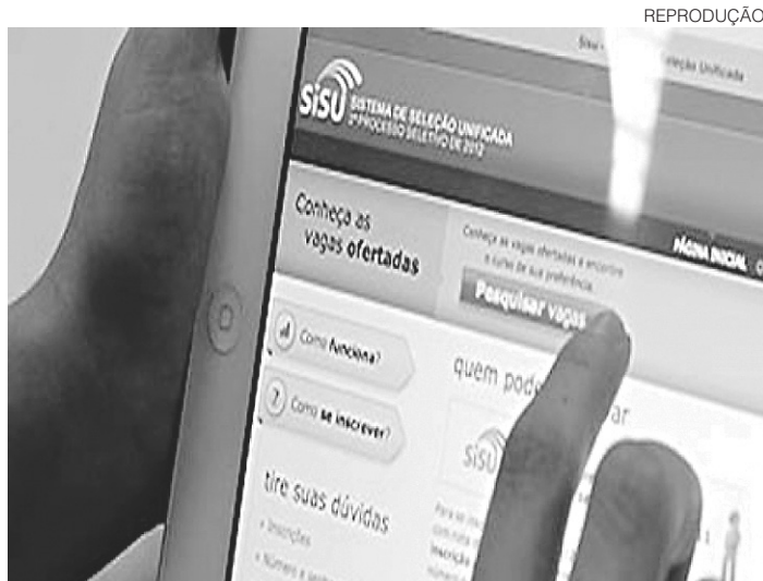
// Resultado da chamada regular do Sisu sai no dia 30 de janeiro

Na página do Sisu, é possível acessar a lista dos cursos oferecidos, das instituições participantes e dos municípios que oferecem as vagas. Para se candidatar, quando o sistema abrir para inscrições, o estudante precisa acessar o mesmo endereço eletrônico, informar o número de inscrição no Enem e escolher, por ordem de preferência, até