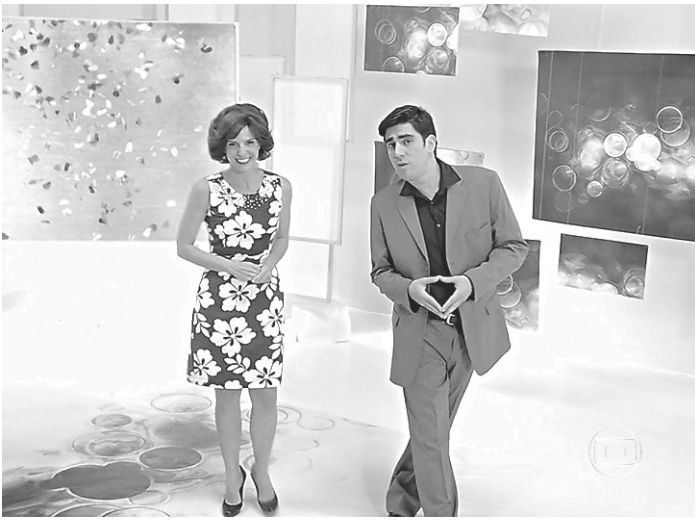
// Homorístico estreia hoje, 24, na Globo, após o BBB 17

Editor: Jalmir Oliveira E-mail: jalmiroliveira@novojornal.jor.br