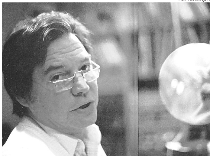
// Jobim dizia que voz feminina era a adequada para acompanhá-lo

Originalmente, teria letra de Vinicius de Moraes. Ao ouvir a melodia tocada por Tom no piano da Rádio Nacional, Dolores escreveu a sua com lápis de sobranceira e mandou um bilhete ao Poetinha. "Vinicius, outra letra é covardia, hein!". Tom e Vinicius acei-