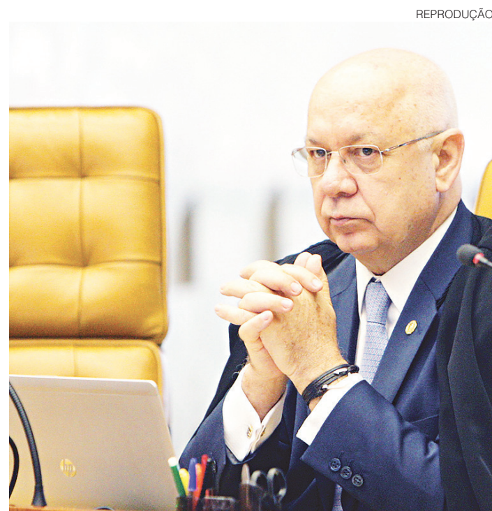
// Zavascki, sepultado sábado, em Porto Alegre: sucessão em debate