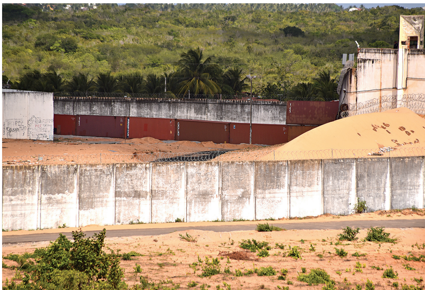
// Contêineres estão sendo instalados para servir de muro de separação entre pavilhões que abriram organizações criminosas rivais

O secretário Caio Bezerra anunciou também a colocação de uma cerca no entorno da penitenciária, para evitar que objetos sejam arremessados por cima do muro. "Isso é imprescindível para que tenhamos um perímetro de segurança, e evitar que seja introduzido no presídio munições ou outros artigos ilícitos". Bezerra explica que a estrutura vai ficar a 50 metros do entorno da unidade prisional, e terá um sistema de alarme.