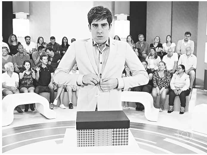
// Marcelo Adnet é um dos principais criadores do programa