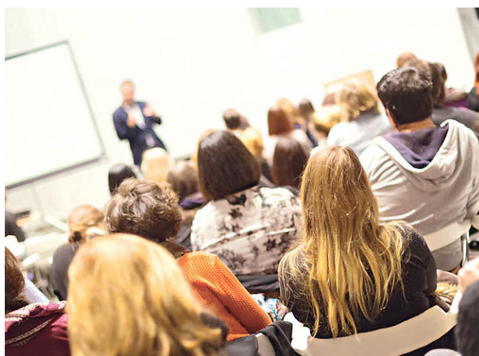
// Investir em educação não é prioridade para jovens