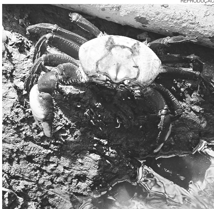
// O RN é um dos estados proibidos de capturar o caranguejo

As datas, de acordo com a publicação, correspondem à "andada", período reprodutivo em que os caranguejos machos e fêmeas saem de suas galerias (tocas) e andam pelo manguezal, para acasalamento e liberação de ovos.