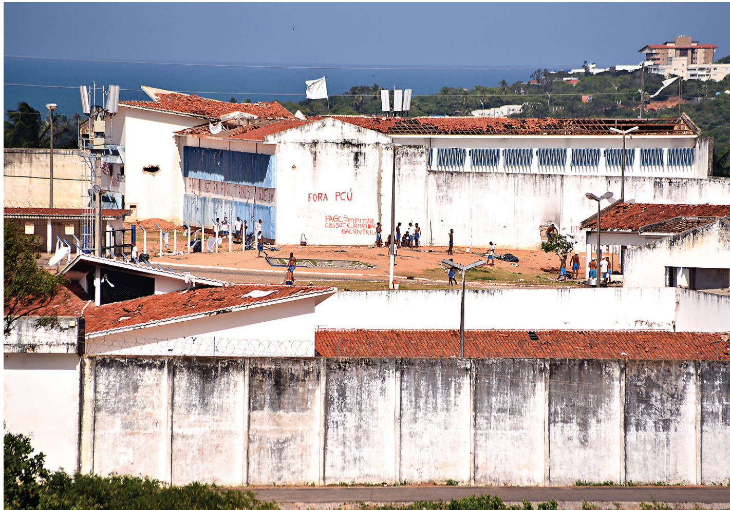
// Dia ontem foi tranquilo na Penitenciária Estadual de Alcaçuz, onde facções criminosas se enfrentam desde o dia 14

Os efeitos também foram sentidos do lado de fora do presídio, quando veículos foram incendiados e unidades de delegacias alvejadas por disparos de arma de fogo. As ações foram ordenadas de dentro de Alcaçuz, pois os presos utilizam também, deliberadamente, celulares.