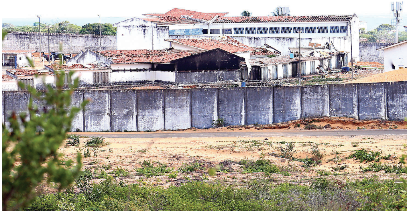
// Penitenciária Estadual de Alcaçuz, em Nísia Floresta: palco de rebelião e massacre desde a semana passada

“São fossas muito grandes, 18 metros cúbicos, e são muitas. Demorou um dia inteiro só para esgotar uma delas. Lógico que as buscas vão continuar, mas acredito que não vamos achar todas. Em regra, nas fossas existe a parte líquida, mas tem a parte de lama que fica embaixo e não dá para tirar. E a cabeça em decomposição começa a soltar osso e fica muito difícil achar”, explica Brandão. “A gente tem que trabalhar com isso em mente”, afirmou Brandão à Agência Estado.