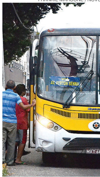
// Transporte coletivo circulou ontem com a frota reduzida

O funcionamento dos ônibus começou a ser reduzido na última quinta-feira (19),