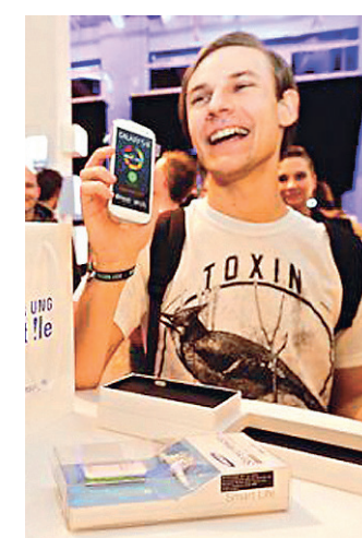
// Preferência por celulares estão entre itens mais caros

do o valor não é muito alto para poder comprar mais; 33% admitem comprar mais do que o planejado, 32% cedem aos impulsos quando querem muito algo, 32% gastam mais do que o planejado para comprar produtos que mostram seu estilo e personalidade, 31% acreditam que vale a pena fazer uma dívida para comprar uma roupa que os façam sentir especiais, e 29% às vezes perdem a noção do quanto podem gastar em um balada e extrapolam o orçamento.