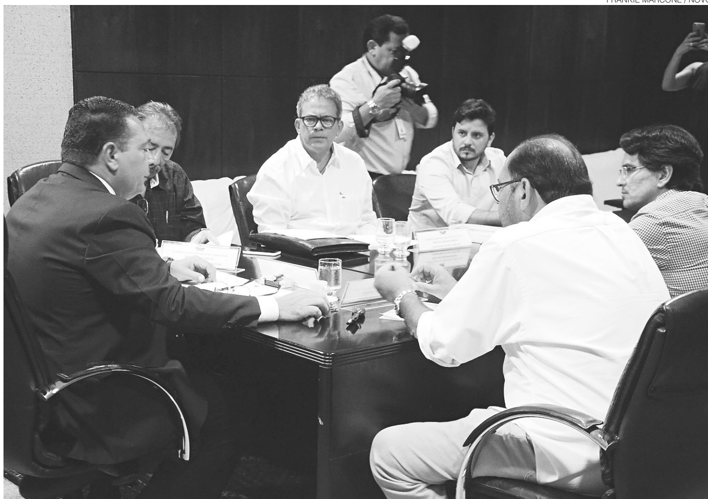
// Presidente da Assembleia Legislativa, Ezequiel Ferreira, reunido com a Mesa Diretora da Casa: deliberações para a sessão extraordinária

O Poder Legislativo ainda vai recomendar ao governo que utilize os veículos na região metropolitana de Natal – que concentra 43% da população do estado – e em cidades-