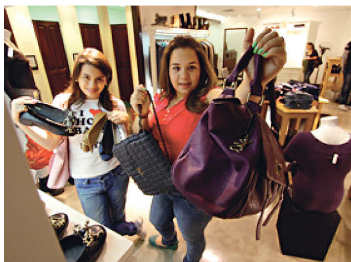
// Nos planos de consumo, está a valorização das marcas como estilo

Oito em cada dez jovens possuem conta corrente. Formato exclusivamente digital já atrai um terço