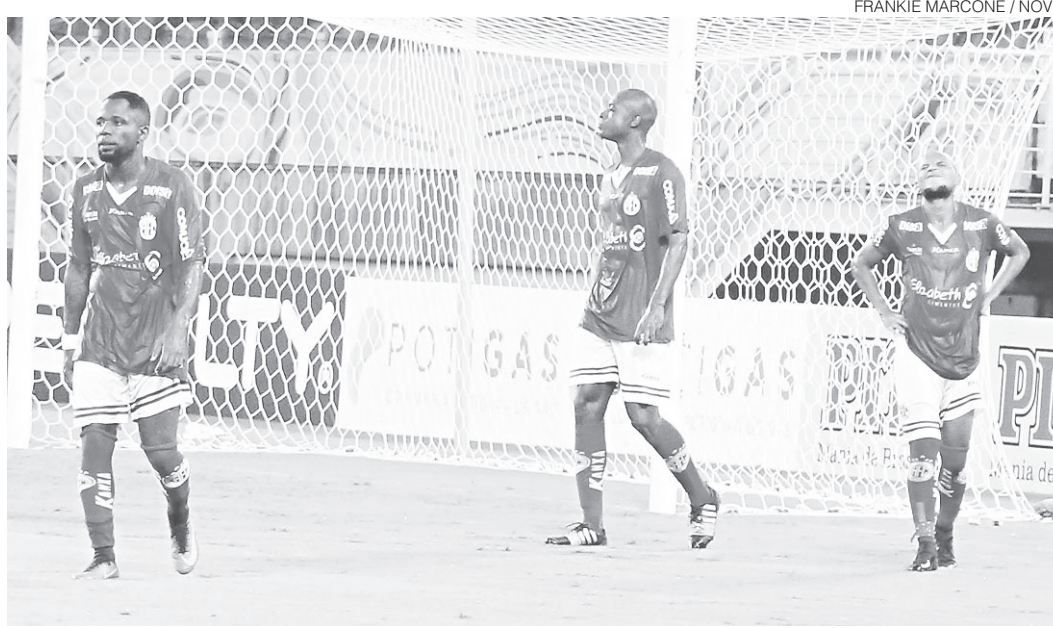
// No primeiro embate com o ABC em 2017, Alvirrubro foi derrotado por 1 a 0 em jogo na Arena das Dunas