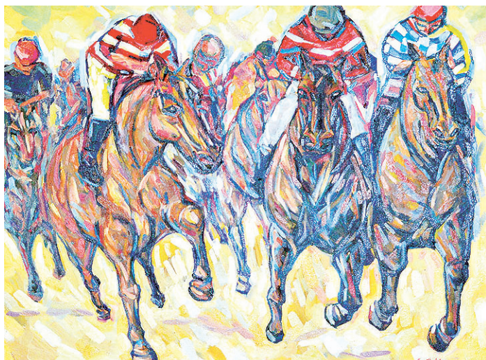
// Hipismo faz parte da exposição com trinta telas