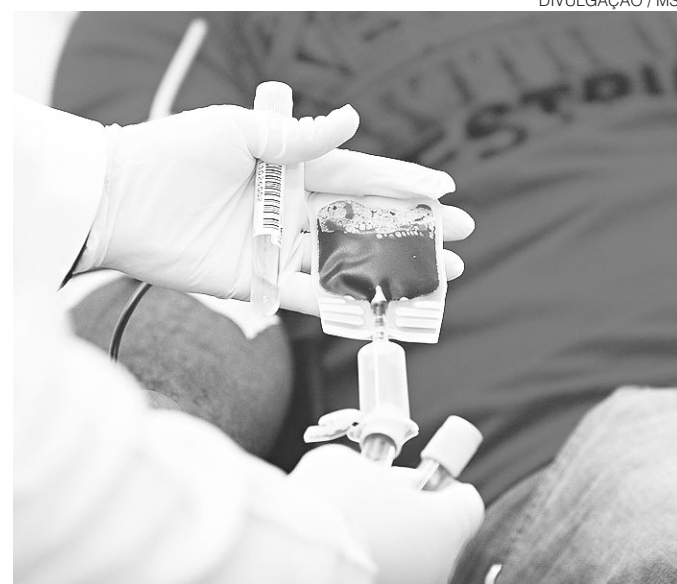
// Ministério da Saúde dificulta homens gays de doarem sangue

Por outro lado, o resultado agradou Temer. O apoio do PSDB ao governo na Câmara, por exemplo, conta com a influência de aliados de Aécio. Para isso, a avaliação do presidente é de que é preciso que o senador mineiro mantenha seu mandato e continue atuante.