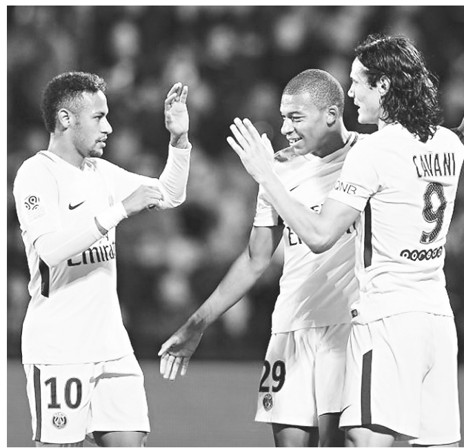
// Neymar faz gol e trio de ataque do PSG volta a brilhar

O MPF também informou que, nos últimos dez dos 22 anos de presidência do COB, Nuzman ampliou seu patrimônio em 457%, não havendo indicação clara de seus rendimentos, além de manter parte de seu patrimônio oculto na Suíça. Por exemplo, ele só veio a declarar a existência de 16 barras de ouro, de 1 kg cada uma, que mantinha no exterior, à Receita Federal, por meio de retificação do Imposto de Renda, na data de 20 de setembro deste ano, ou seja, após a deflagração da Operação Unfair Play. Nuzman está preso preventivamente, desde o dia 5, em Benfica, zona norte do Rio.