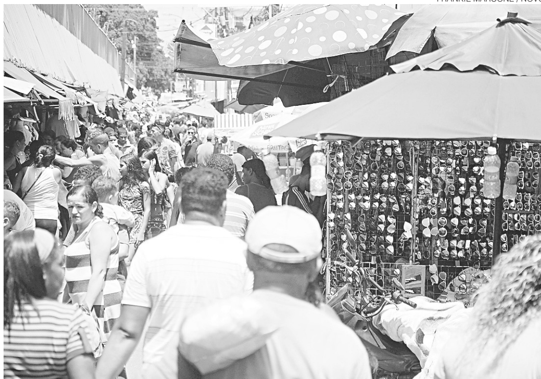
// Segundo pesquisa do IBGE, o número de mulheres que procura se formalizar é maior que de homens

A Pnad Contínua também revela o comportamen-