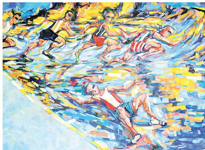
// Atletismo ressalta as influências surrealistas do artista