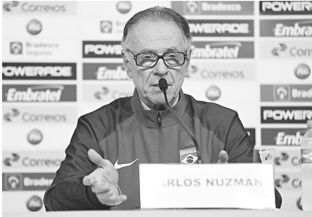
// Ex-presidente do COB é acusado de ocultar 16 quilos de ouro, no valor de R$ 1.495.437,63

"A despeito de tratar-se de uma pessoa jurídica de direito privado", o Comitê Olímpico do Brasil, por meio de seus dirigentes, representa a República Federativa do Brasil em eventos esportivos internacionais, recebe verba pública (que representa a maior par-