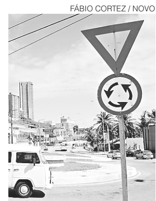
// Motorista poderá pagar multas de trânsito no débito

O auditores que fiscalizam o trabalho escravo, funcionários do Ministério do Trabalho, decidiram paralisar suas atividades em 21 Estados. A manifestação ocorre em resposta a uma portaria editada pelo Ministério do Trabalho e publicada nesta segunda-feira (16), que traz regras que dificultam o acesso à chamada "lista suja" de empregadores flagrados por trabalho escravo no país. O texto também altera o modelo de fiscalização e abre brechas que podem dificultar a comprovação e punição desse tipo de crime.