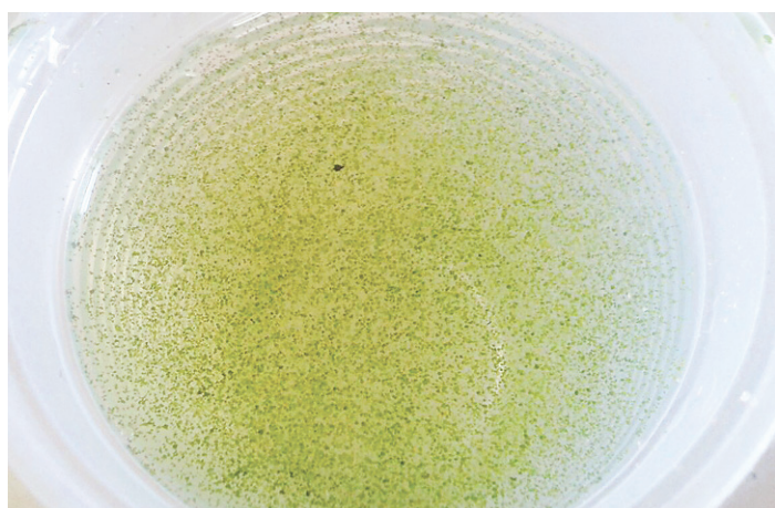
// Leitora envia foto com mostra da água no Assentamento 3 de Agosto