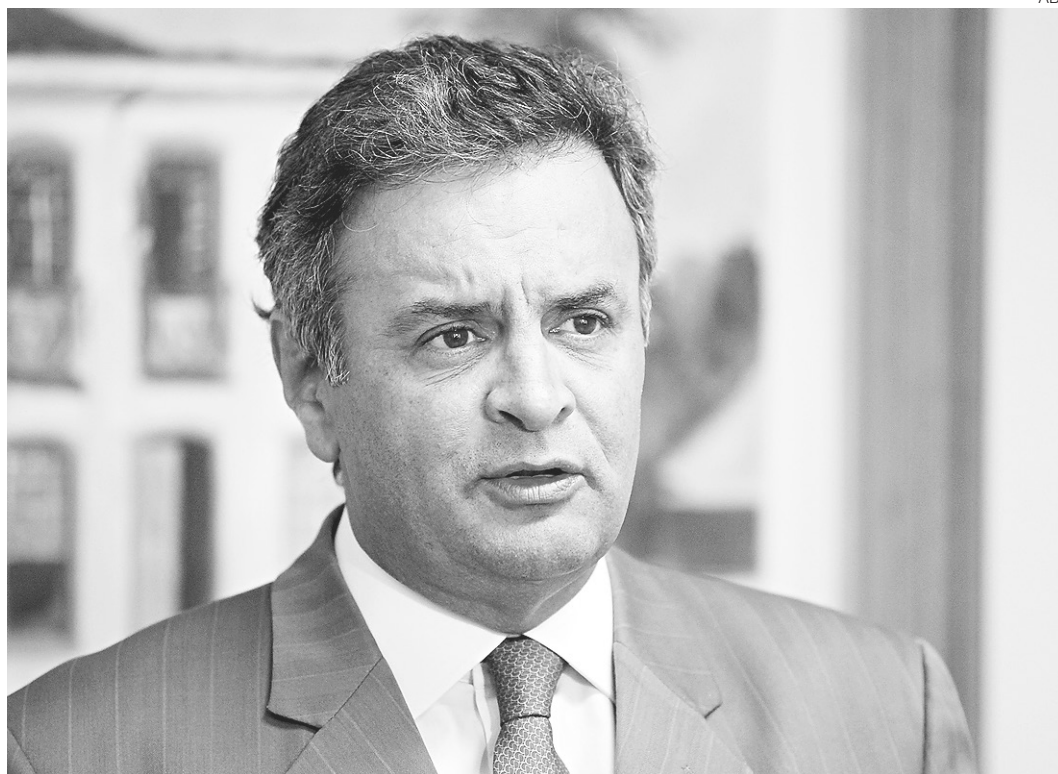
// Aécio Neves retoma mandato no Senado atacando a delação da JBS e a PGR

O tucano atacou a delação da JBS, que disse estar suspensa "em razão de parte da verdade estar vindo à tona". E dirigiu críticas ainda à gestão anterior da PGR (Procuradoria-Geral da República), evitando citar nomes. "Mas o que é mais grave, corroboraram, contribuíram para essa trama ardilosa homens do Estado, notadamente alguns que ti-