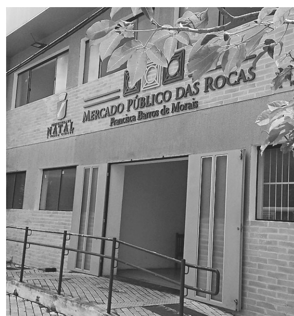
// Mercado Modelo das Rocas: um projeto moderno