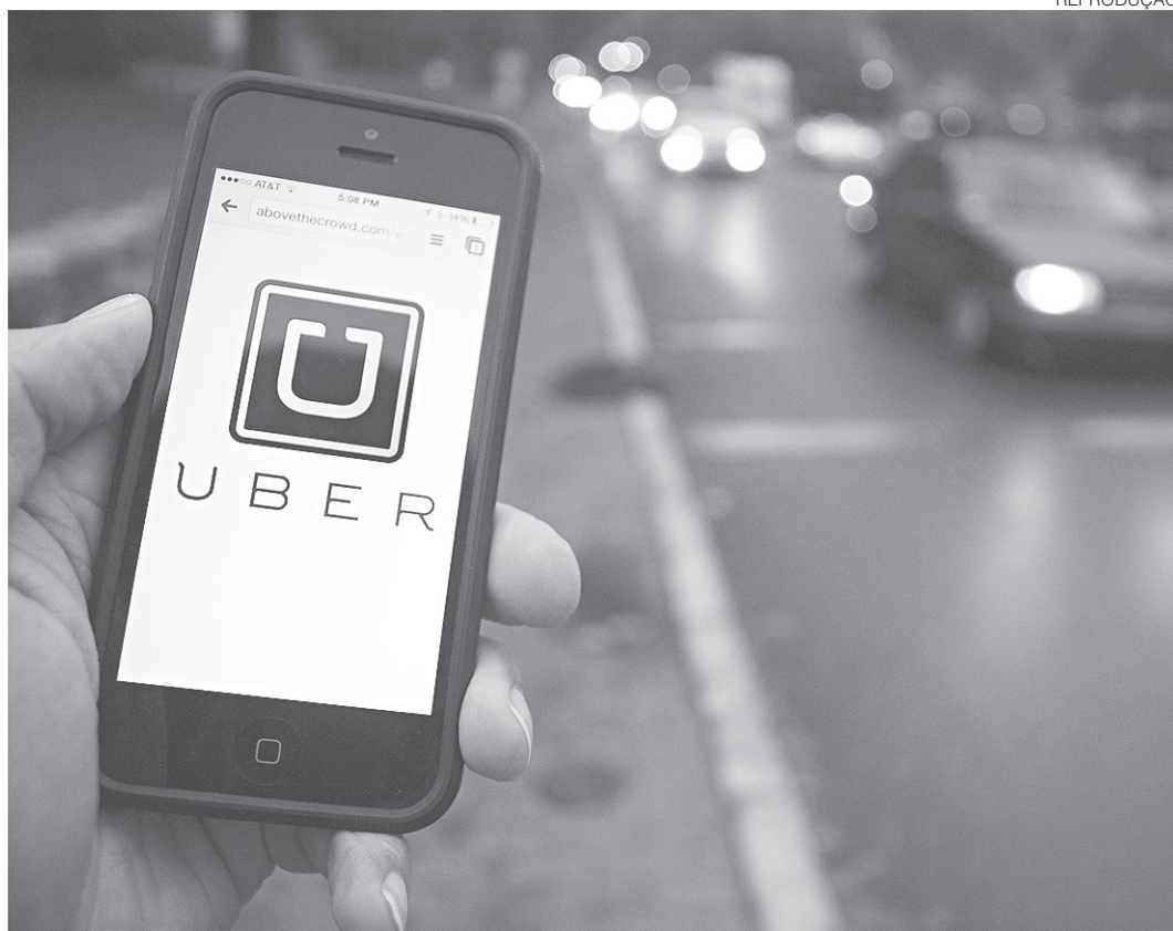
// Serviço individual de passageiros operado pela Uber em Natal tem respaldo da justiça

"Não somos contra o aplicativo em si, mas acredito que toda empresa precisa de licença para funcionar e eles não são regulamentados. Natal tem mais de 3 mil taxistas que estão sendo prejudicados com esse mercado predatório e a Prefeitura quer fiscalizar, mas