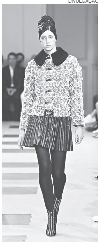
Desfile Azzedine Alaïa, Inverno 2018, em Paris

O Tribunal de Contas da União autorizou, no início da noite desta quarta-feira (23), a retomada das obras de duplicação da Reta Tabajara, na BR 340, que estavam paralisadas há quase quatro meses. A notícia foi comemorada por políticos potiguares. Entre eles, a senadora Fátima Bezerra e a deputada Zenaide Maia, que, juntamente com o presidente do Departamento Nacional de Infraestrutura de Transportes (DNIT), Valter Casimiro Silveira, haviam reunido-se com o ministro relator do processo, Vital do Rêgo, para sensibilizá-lo sobre a importância da retomada das obras.