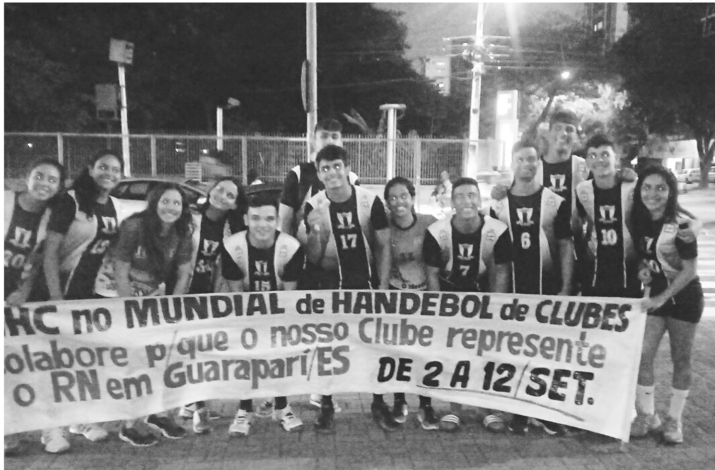
// 'O Mestre' é referência no handebol escolar no Rio Grande do Norte e já coleciona conquistas a nível nacional

São 28 estudantes natalenses, 14 meninos e 14 meninas da mesma escola, que têm en-