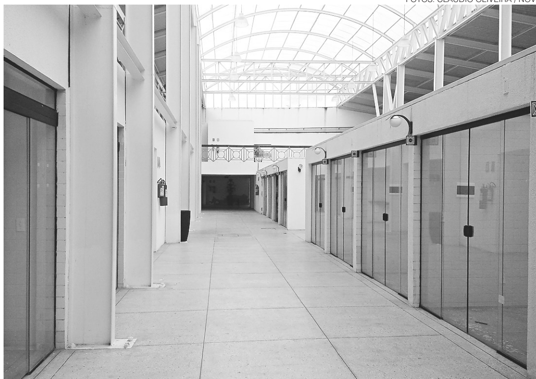
// Os amplos corredores do Mercado das Rocas estão vazios de clientes e com lojas fechadas

Alguns dos antigos comerciantes têm título de propriedade dos espaços destinados à comercialização no mercado. Os outros, mesmo utilizando o local há décadas, precisariam disputar a licitação