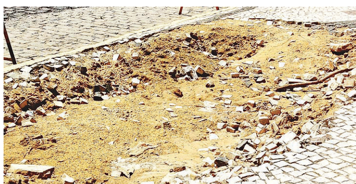
//Em Ponta Negra, pedras se desprendem por falta de manutenção