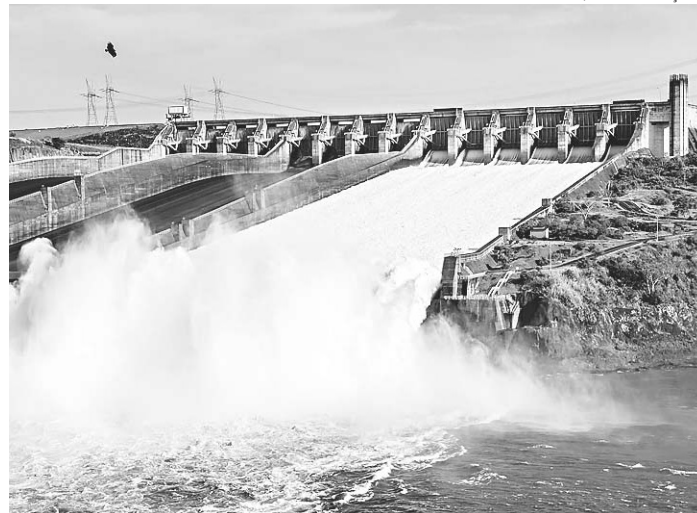
// Itaipu Binacional está fora da proposta de privatização do governo

"A empresa mudou de gestão no governo Temer, tentando trazer um choque de gestão, na busca de venda de ativos. Acho que a mudança pode trazer uma governança maior, mais consistência nos dados e uma eficiência maior para a companhia. É um movimento claro do governo no sentido de fazer caixa", ressaltou Indech.