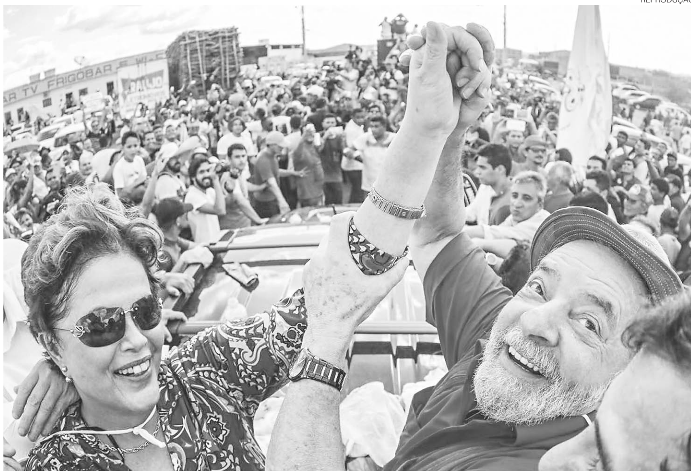
// No Rio Grande do Norte, em datas diferentes, Dilma Rousseff e Lula avaliam situação do país pós-PT