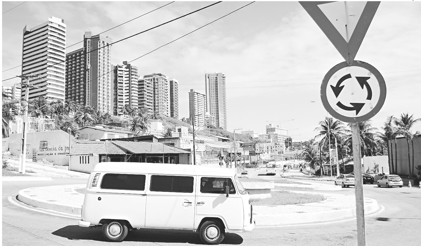
// Os motoristas precisam saber usar as rotatórias corretamente para evitar acidentes.

O chefe de gabinete do Detran esclarece que a preferência é de quem já está fazendo a manobra na rotatória. O motorista que está vindo tem que parar e esperar que o ou-