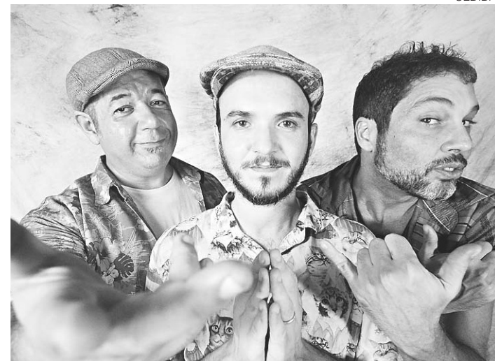
// DuSouto participa de show histórico do Rappa na capital potiguar

As canções representam o grito das ruas, as emoções do cotidiano difícil e o apreço pela vida digna. A banda já havia interrompido as atividades entre 2009 e 2011.