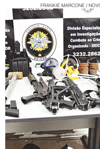
// Arsenal encontrado pela polícia na casa de Búzios

“Queria deixar claro que não tem nada a ver o caso de Búzios com a situação na [Avenida] Abel Cabral. Na Abel Cabral é o caso de quadrilhas menores que estão investindo em assalto a carro-forte porque acham que é mais fácil. Esses grupos pegam dois vigilantes com um malote, chegam com três, quatro homens com espingarda e fazem a ação”, comentou. “Eles costumam não levar valores muito altos porque são ações feitas com poucas pessoas; são o que a gente chama de associações criminosas. É uma ação bem diferente de uma organização criminoso que tem toda uma logística por trás”, completou Teodósio.