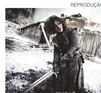
// Sétima temporada do seriado traz surpresas e novas batalhas

Há ainda rumores de que Cersei Lannister (Lena Headey), que assumiu o Trono de Ferro e governa