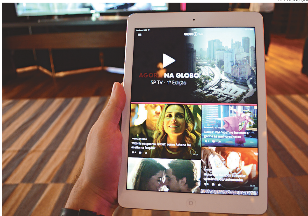
// Aplicativo da Rede Globo, segundo especialistas, é uma ferramenta de engajamento da audiência

Mesmo com a chegada de aplicativos que transmitem o mesmo conteúdo que a