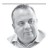
Artigo Rogério Marinho Deputado Federal

E também é efeito da indiferença, que começa com a falta de um bom dia para quem passa na rua, passa pela falta de interesse em escolher com cuidado nossos representantes políticos e chega até na falta de amor - ou pelo menos um mínimo de zelo - pelo nosso semelhante.