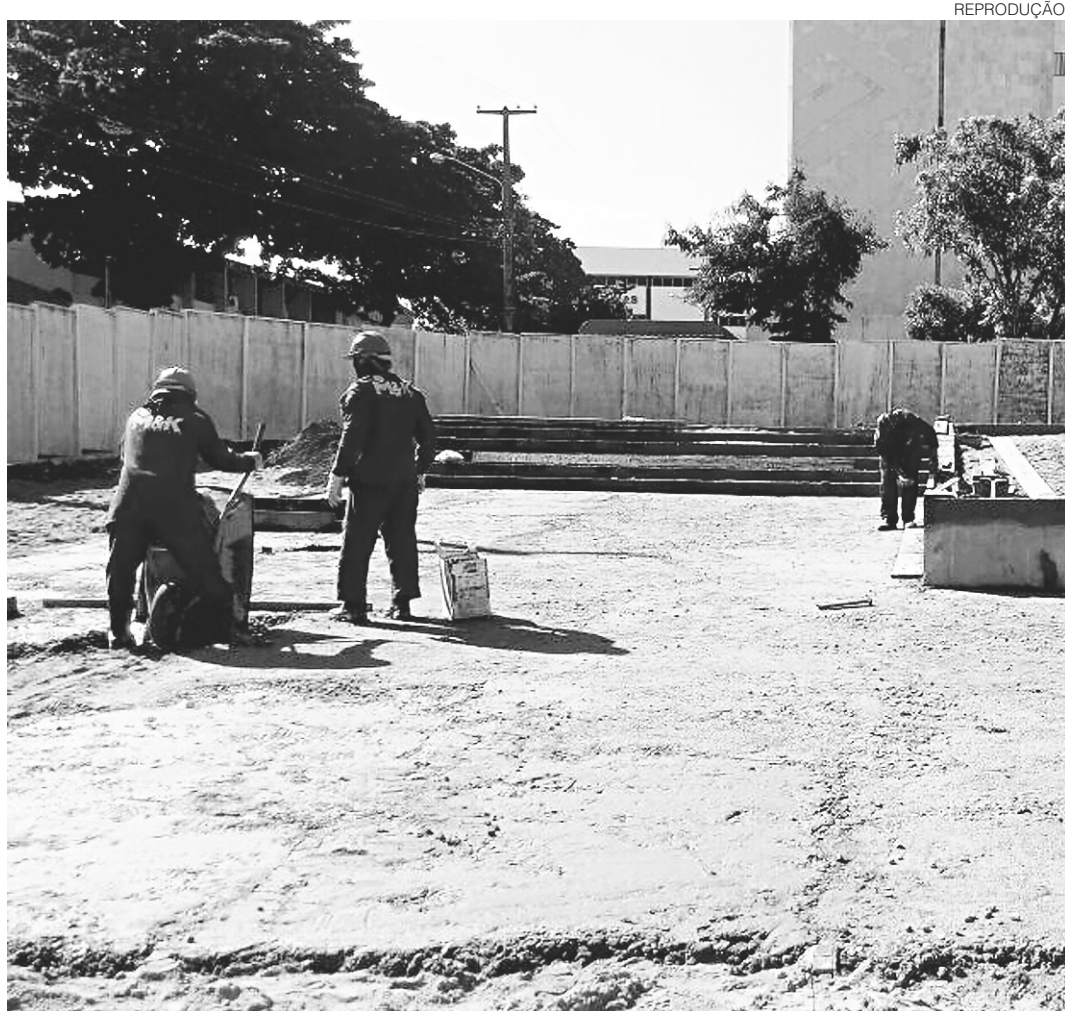
REPRODUÇÃO // Praça do estudante, no bairro de Cidade Alta, foi a primeira a receber obras de recuperação

Foram encaminhados ao Ministério da Cultura (MinC) 16 projetos potiguares para concorrer ao PAC Cidades Históricas, ainda em 2013, em um total de aproximadamente R$ 100 milhões. Destes, R$ 78 milhões pertenciam a projetos elaborados pela equipe da Setur RN. O total aprovado no MinC corresponde a R$ 43 milhões, sendo R$ 25 milhões de projetos da Setur RN, ou 58% do total. O restante são