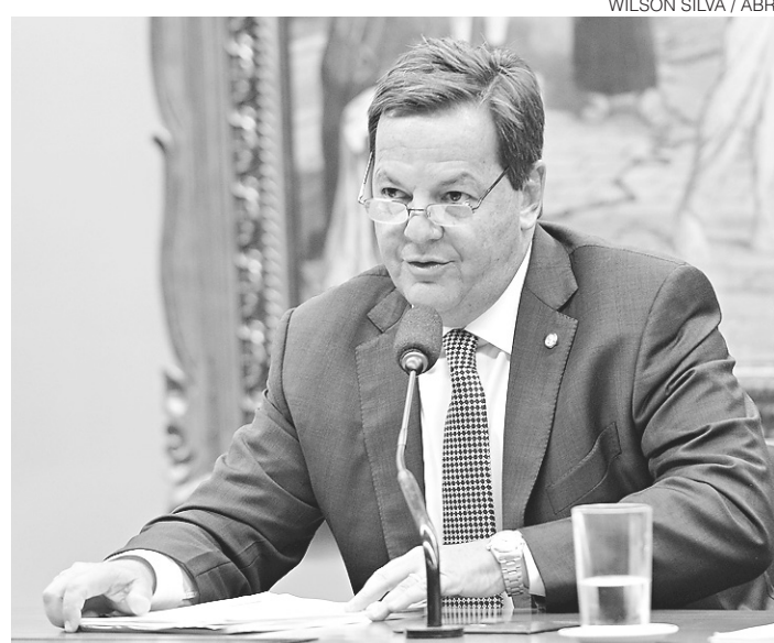
// Sérgio Zveiter, relator da denúncia contra o presidente na CCJ

O parecer de Zveiter foi derrotado na CCJ por 40 votos a 25. Apenas o presidente da CCJ, Rodrigo Pacheco (PMDB-MG), se absteve. O voto vencedor foi do tucano Paulo Abi-Ackel (MG), que apresentou um parecer contra a admissibilidade.