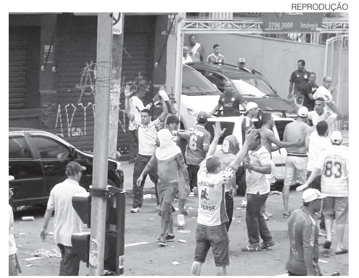
// Torcedor palmeirense foi morto por rivais no último dia 13

O ABC atravessa o seu pior momento na temporada. Após as cinco derrotas seguidas na Série B, o clube caiu da sexta posição para a vice-lanterna. Se vencer, o Alvinegro chega aos 15 pontos e pode até sair da zona de rebaixamento.