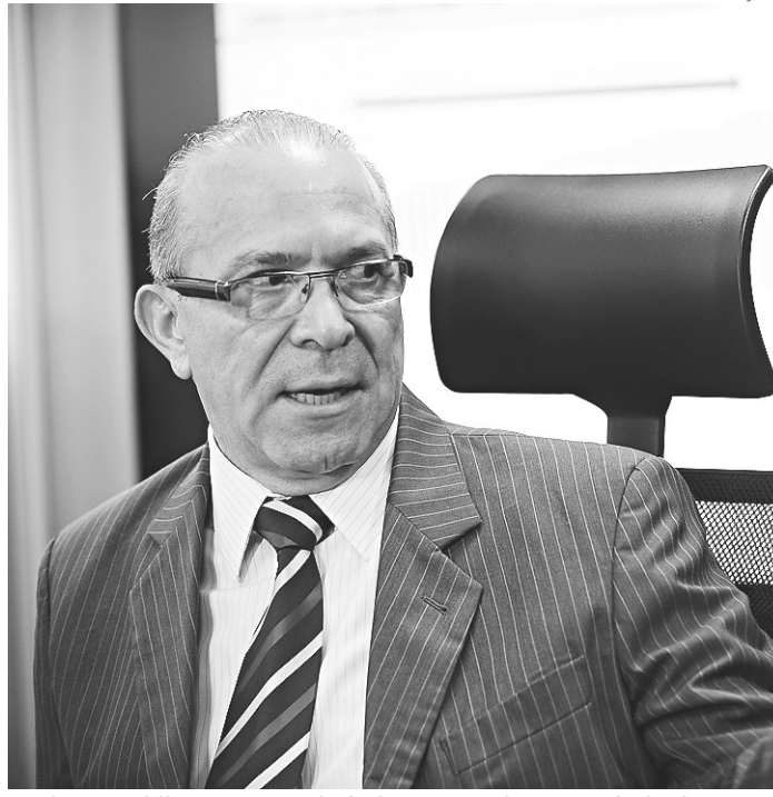
// Eliseu Padilha, ministro-chefe da Casa Civil: questão fechada

o deputado Sergio Zveiter (PMDB-RJ), relator da denúncia contra Temer, criticou a troca de parlamentares na CCJ e acusou o governo de comprar votos em troca da liberação de emendas. Padilha minimizou a acusação. "Se ele [Zveiter] tivesse certeza disso, teria entrado com algum tipo de ação contra o governo", disse.