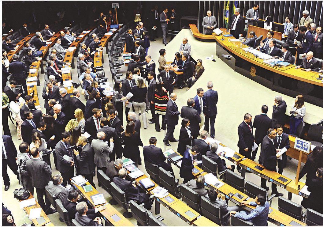
// Texto do Refis, aprovado por deputados, beneficia também igrejas e clubes de futebol

Outro revés para o governo foi a possibilidade de utilização de créditos tributários gerados por prejuízos fiscais. Caso haja saldo remanescente, será possível o parcelamento em até sessenta meses.