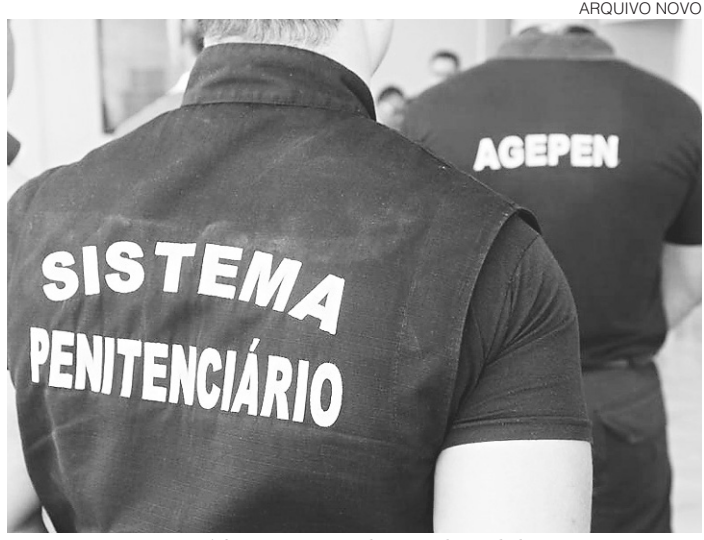
ARQUIVO NOVO // Exame escrito será feito por mais de 14 mil candidatos no RN

Estão sendo destinadas 451 (quatrocentas e cinquenta e uma) vagas para o sexo masculino e 120 (cento e vin-