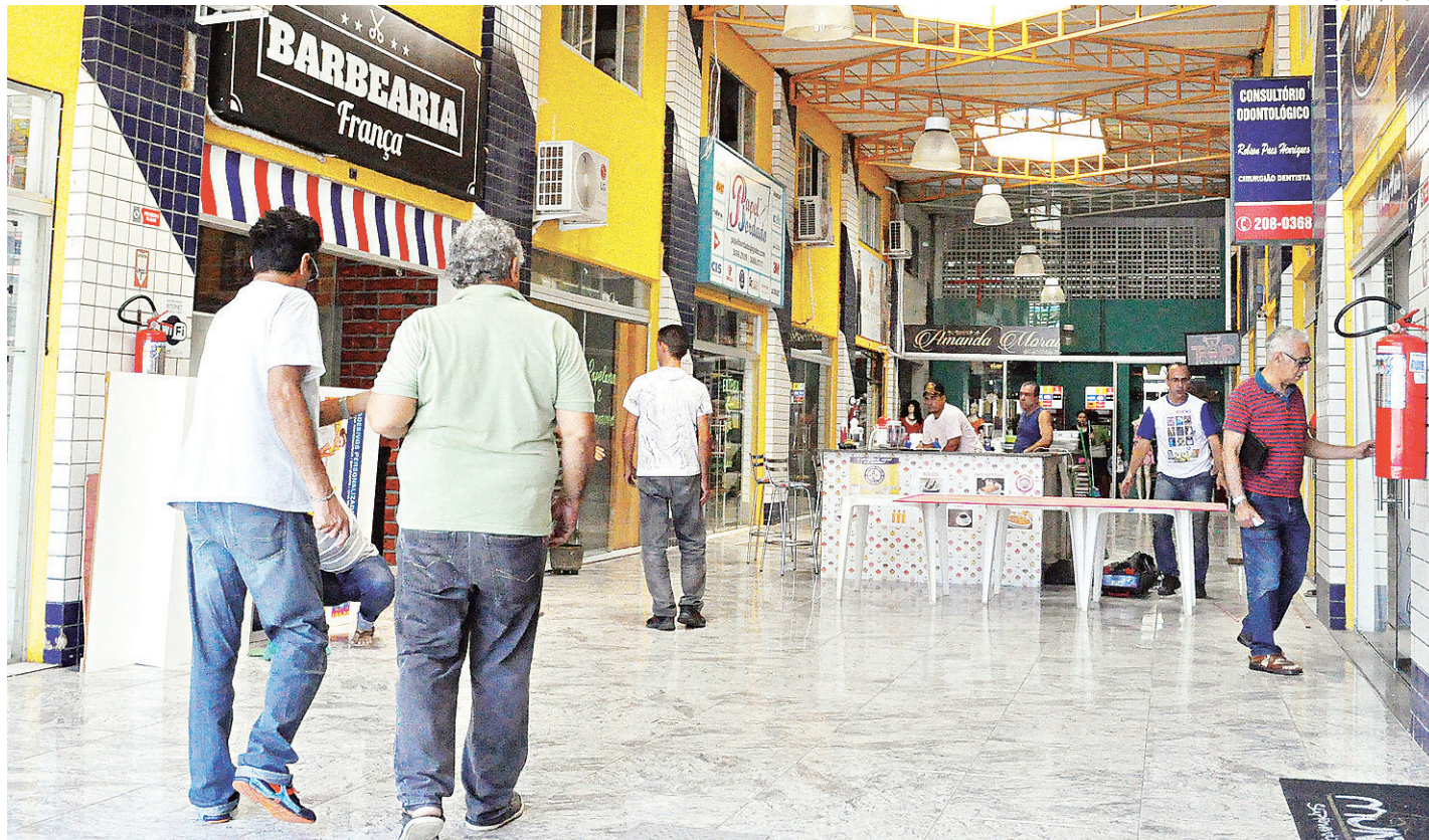
// Barbearia localizada no shopping entre avenidas Ayrton Senna e Abel Cabral, em Nova Parnamirim: local onde a vítima trabalhava

Os outros criminosos da quadrilha acabaram fugindo antes da chegada da Polícia Militar, deixando para trás o comparsa, que morreu momentos após ser atingi-