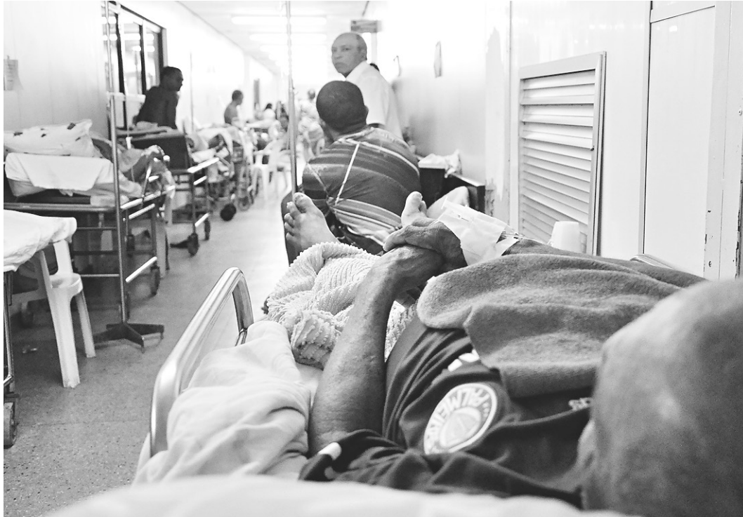
FÁBIO CORTEZ / NOVO

Desenvolvido desde 2010 em parceria com o Ministério da Educação e a Empresa Brasileira de Serviços Hospitalares (EBSERH), o REHUF já possibilitou investimento de aproximadamente R$ 3 bilhões nos hospitais universitários, somente por parte do Ministério da Saúde. Com isso, as universidades mantenedoras desses estabelecimentos ganham maior capacidade orçamentária para estimular a oferta de ensino,