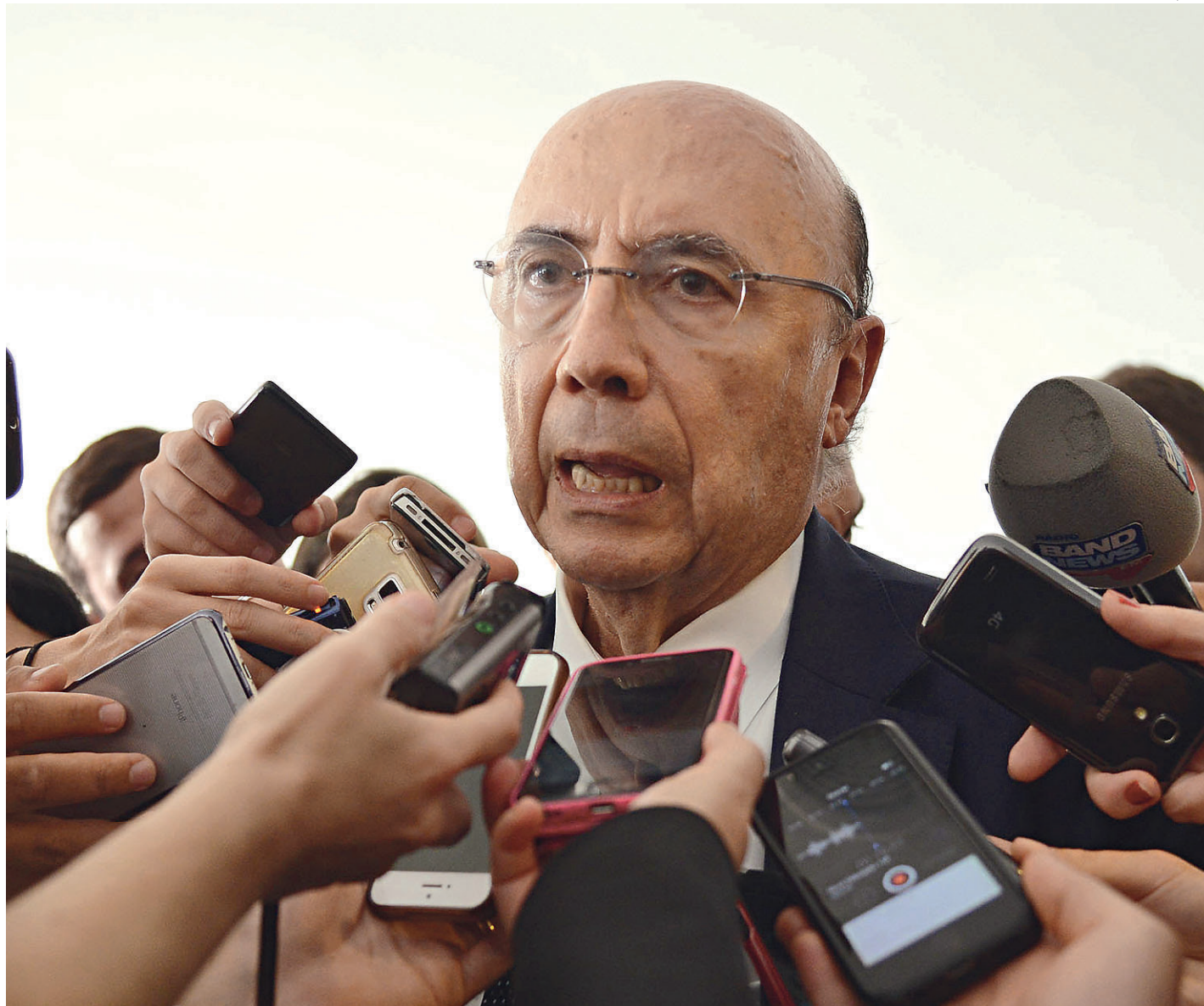
// Ministro da Fazenda, Henrique Meirelles, disse ontem que o governo está considerando a hipótese de aumentar ou criar impostos

"Vamos divulgar a meta menor possível, porém a realista e crível", afirmou Meirel-