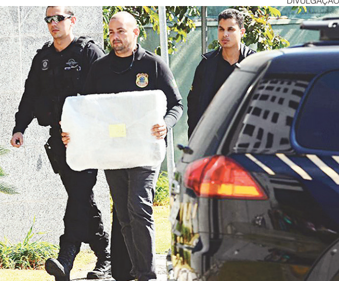
// Operação Abismo investiga propina das obras do Cenpes

"Na maioria dos serviços contratados não houve a devida prestação dos mesmos, senão "pró-forma" com único intuito de gerar dinheiro em espécie para o Grupo OAS Brasil", informaram os delatores. O presidente afasta-