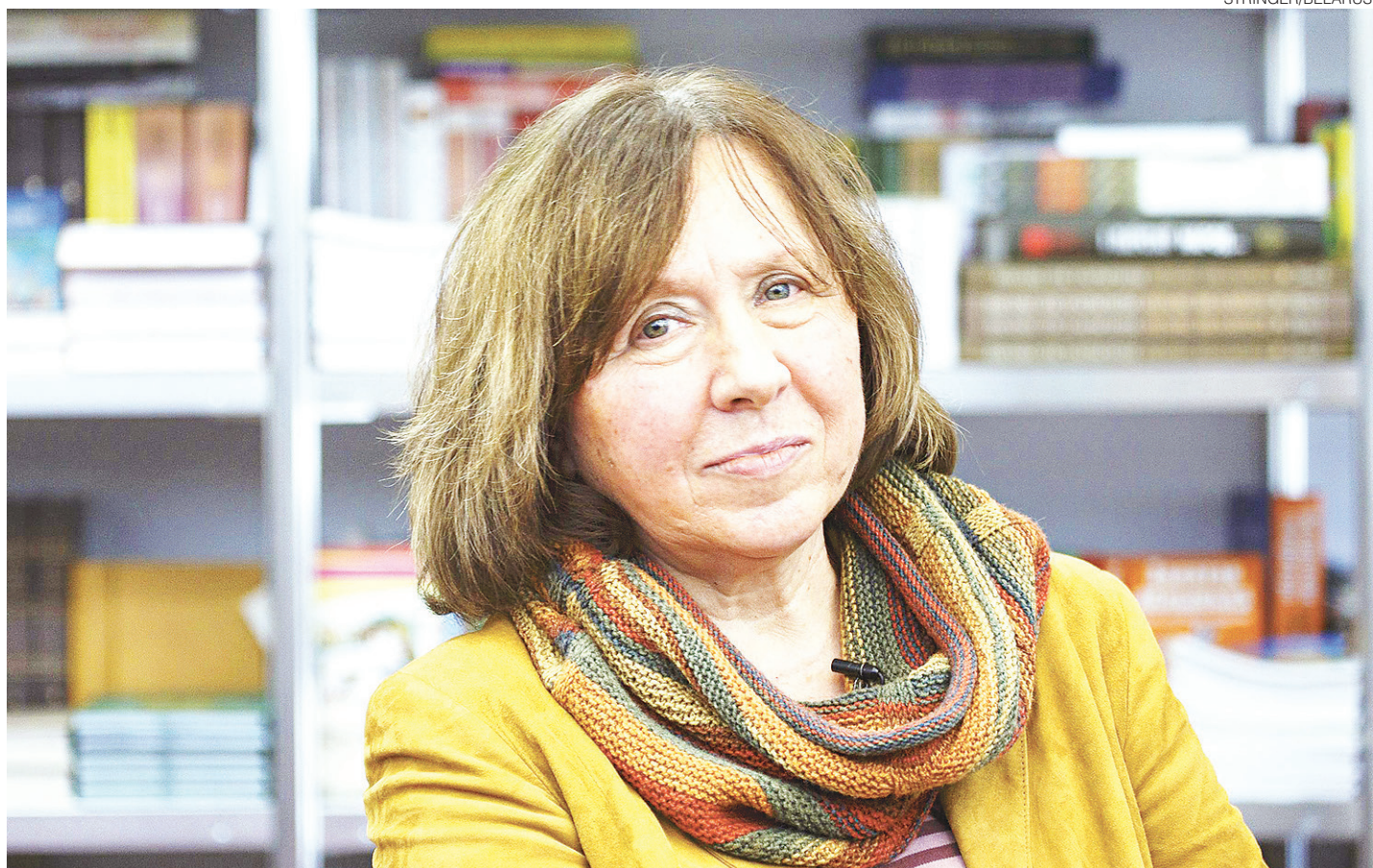
// A jornalista e escritora Svetlana Aleksievitch veio ao Brasil participar da Feira Literária de Paraty (Flip), onde lançou duas obras literárias

A vencedora do prêmio Nobel de Literatura de 2015, Svetlana Aleksievitch, da ex-República Soviética Belarus (Bielorrússia), está decepcionada com relação à política de sua região. Com uma obra fortemente dedicada a narrar o declínio da União Soviética, através de relatos de pessoas anônimas e proeminentes, ela conta que o homem pós-soviético vive com constante medo e tensão, por conta da maldade, da violência e do terrorismo.