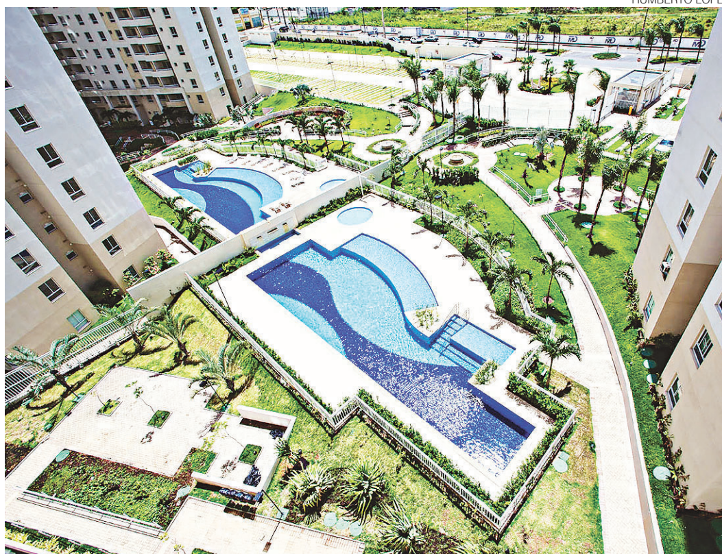
// Falta de transparência na aplicação do dinheiro dos condomínios gera atritos entre moradores e síndicos