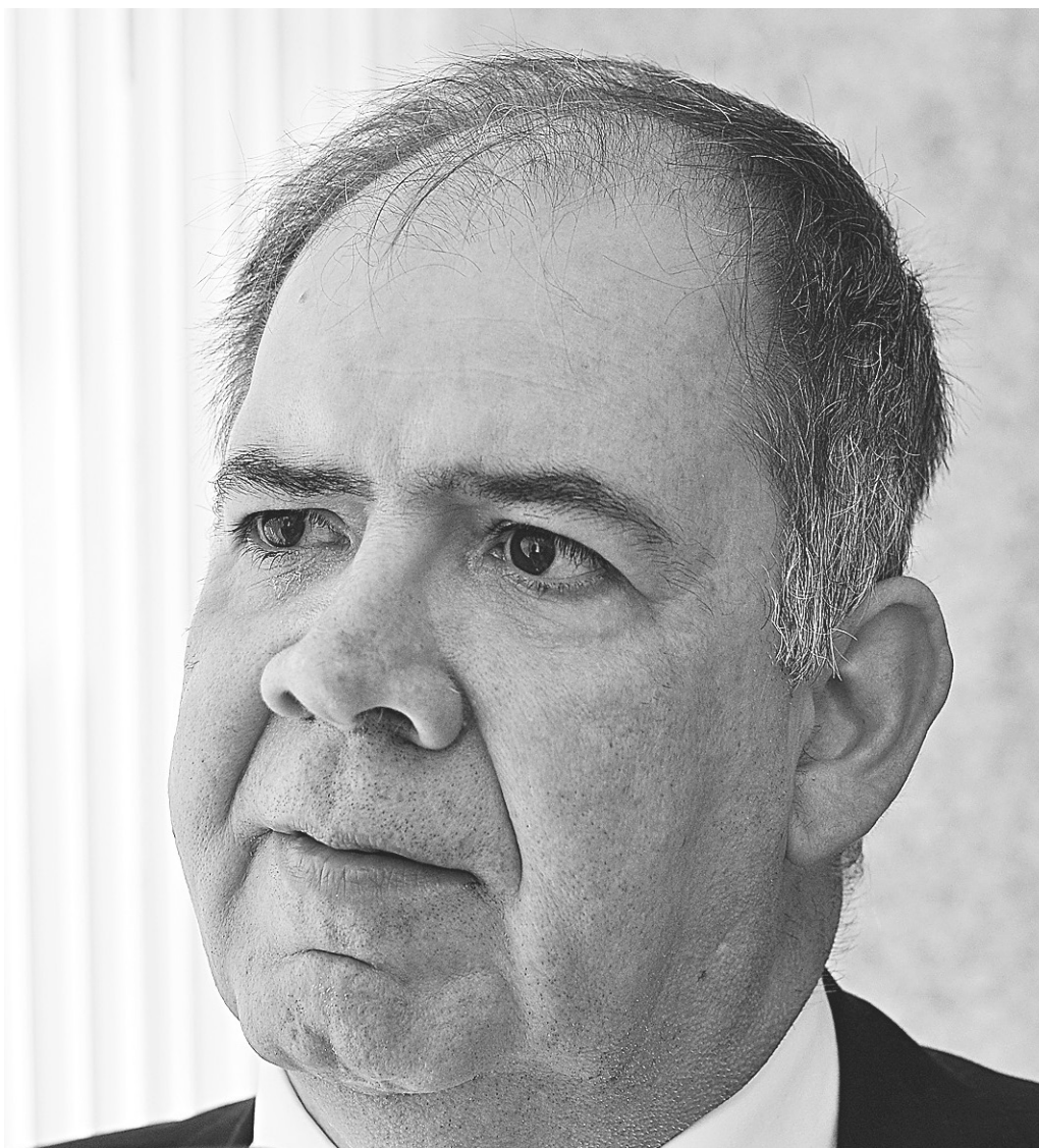
// Alexandre Pinto Varella, controlador geral do estado: recomendações também para a PGE