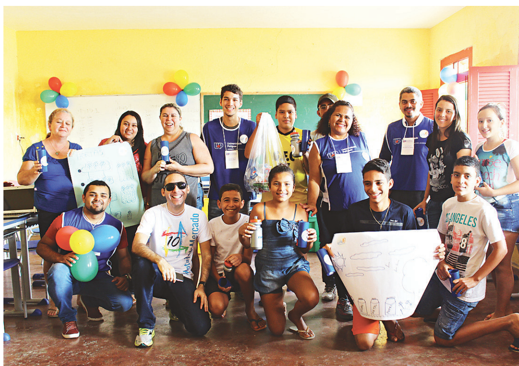
// Durante dois dias, moradores de Monte das Gameleiras e universitários trocaram experiências