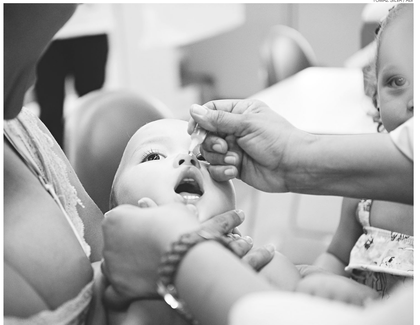
// Legenda Us, quia sam rae lat. Ellabora dolum voluptas vit ariam as sum unt aut et haria volupti od es eneE d que nestota veribusapit

Nos últimos meses de 2015 e início deste ano, por exemplo, foram registrados problemas de abastecimento das vacinas DTP (tríplice bacteriana), BCG (tuberculose) e hepatite A. Problemas também foram encontrados com a vacina de febre amarela e antirrábica.