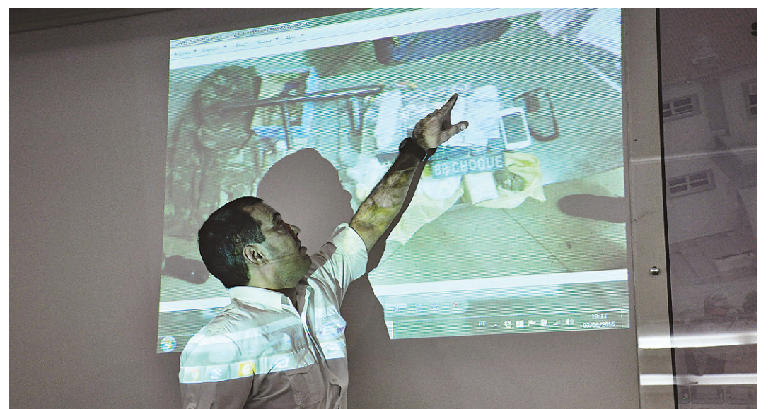
// Objetos encontrados durante a operação podem ser fruto de roubo