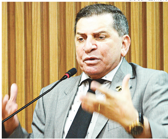
FÁBIO CORTEZ / NOVO