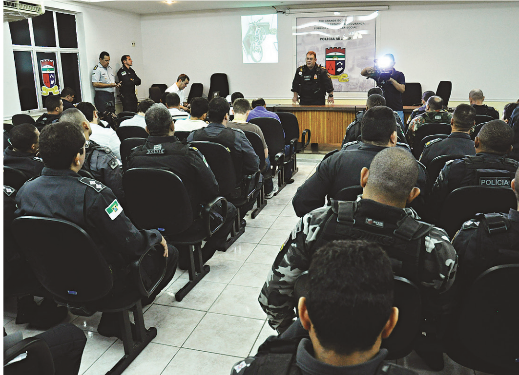
// Polícia Militar promove coletiva para explicar operação realizada Comunidade do Mosquito, Zona Oeste

O coronel Jair Júnior explica que os objetos encontrados durante a operação podem ser fruto de roubo, e que todo o material apreendido foi encaminhado à Polícia Civil para que se faça a averiguação da procedência.