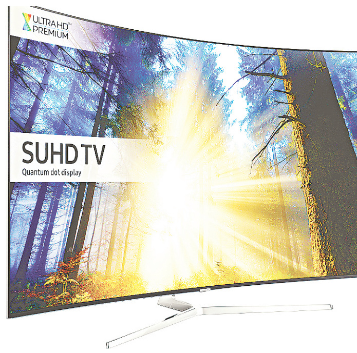
// Venda de TVs Ultra HD cresceu 118% em faturamento

O segmento de TVs 4K ainda sofre com a falta de conteúdo - hoje, o serviço de streaming Netflix é o que oferece mais vídeos nessa resolução: são cerca de 50 títulos apenas. Outra opção é o Globo Play, serviço sob demanda da TV Globo, que tem minisséries gravadas com a tecnologia. As emissoras nacionais de TV aberta planejam adotar o 4K em larga escala só em 2018. Para Barbara, da LG, é importante continuar a investir. "Se o mercado não mostra que a tecnologia existe, o consumidor não cria o desejo."