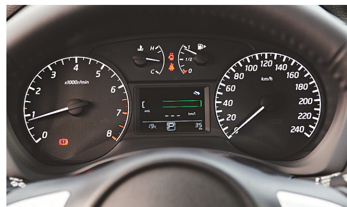
// Veículo traz sistemas de controle de estabilidade e tração (VDC)

O Flex Start Bosch conta com gerenciamento eletrônico que controla toda operação de aquecimento do combustível, que entra em operação na partida e também na fase fria, permitindo a ignição em temperaturas baixas mesmo quando o tanque está com 100% de etanol.