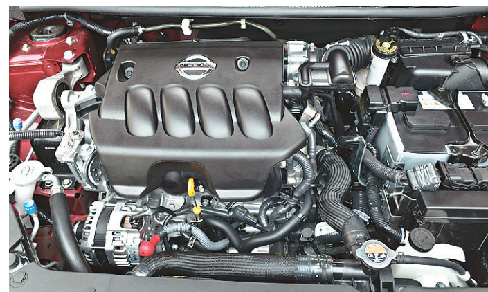
// Motor desenvolve 140 cavalos de potência a 5.100 rpm