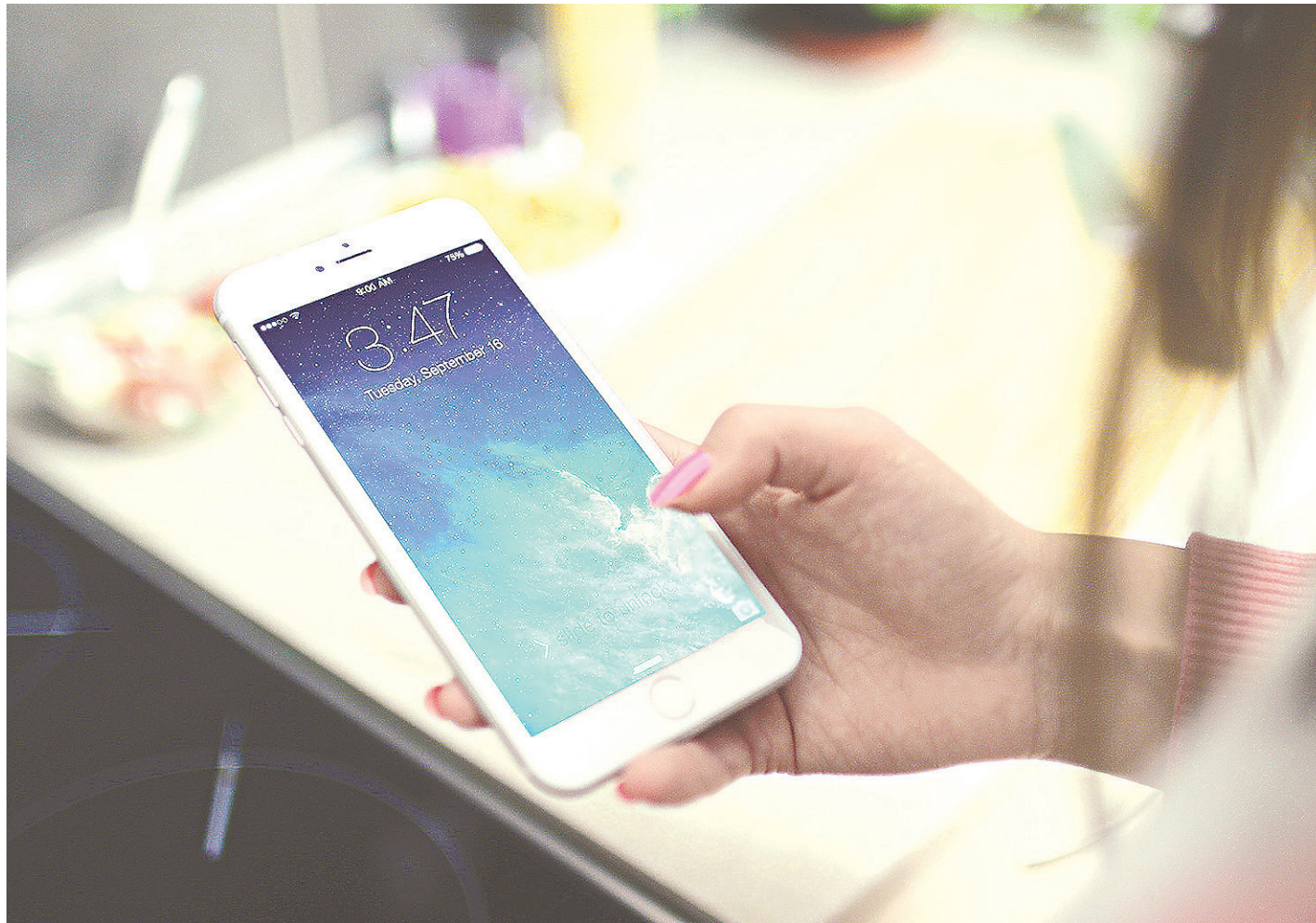
// Vendas de smartphones com preço acima de R$ 3 mil, que representavam 1,7% no primeiro trimestre de 2015, passaram a 5,3%

Acostumado a ser disputado por apenas duas marcas - Samsung e Apple -, o segmento de smartphones acima dos R$ 3 mil ganhou novos membros nos últimos meses: segundo a IDC Brasil, o número de modelos disponíveis no mercado brasileiro cresceu de 8 para 22 aparelhos, com a entrada de empresas como Sony