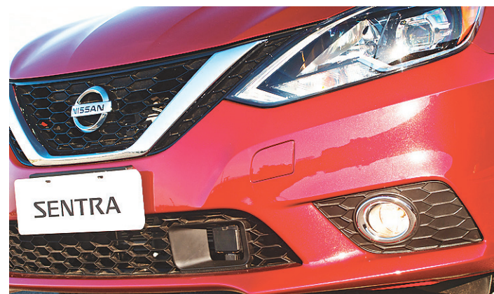
// Sensor crepuscular nos faróis para acendimento automático