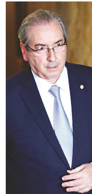
// Eduardo Cunha insiste na luta para voltar à Câmara