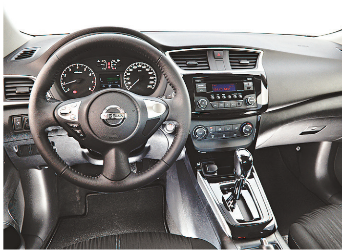
// Quadro de instrumentos traz display de LCD 5 polegadas

O alerta de colisão frontal considera a velocidade re-