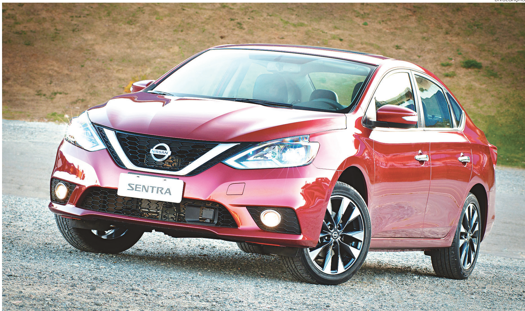
// O novo Sentra 2017 foi lançado no fim do mês passado. Os preços da nova linha da companhia Nissa ficarão entre R$ 79,990 mil e R$ 95,990 mil.

Passam a fazer parte do pacote de itens de série ainda o retrovisor foto cromático, o novo rádio com display de cinco polegadas, o sensor de estacionamento e os faróis com acendimento automático