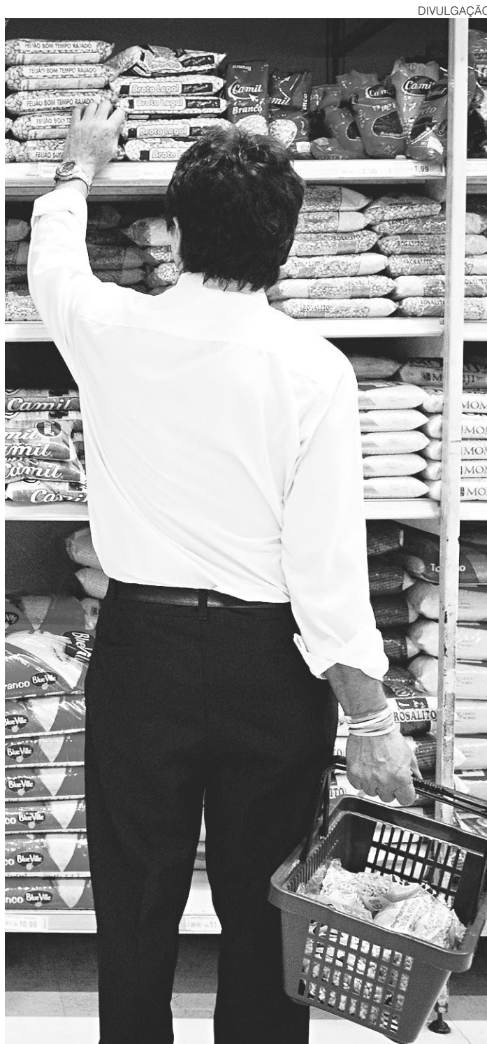
// Maioria dos entrevistados sentiu o peso do avanço da inflação

Os mais temerosos são das zonas Oeste (77%), Leste e Oeste (70%). Na Zona Sul, esse medo atinge 53.3% dos entrevistados. Mas há aqueles que se garantem nos seus postos de trabalho. 30.5% disseram que não temem perder seus empregos, maioria da zona Sul (43.3%). Outros 2% não souberam responder.