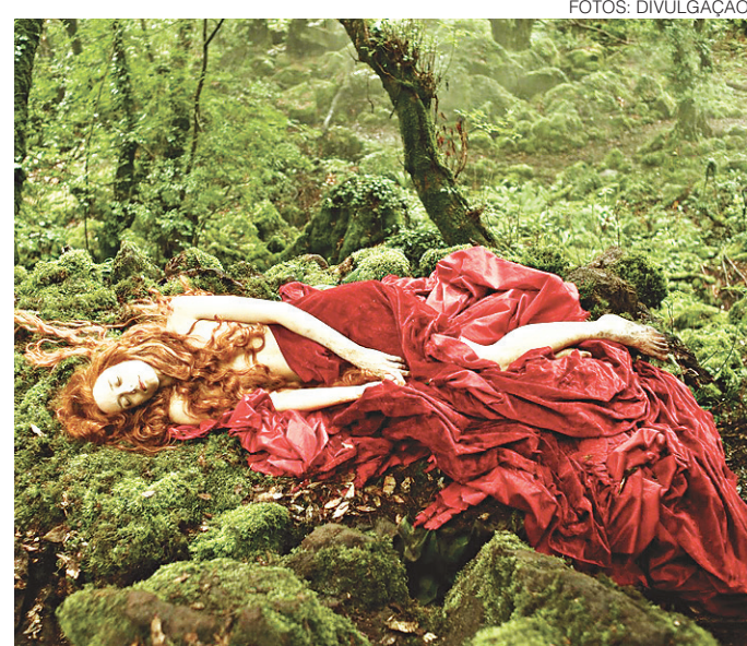
// "O Conto dos Contos" abre a programação cult

"Não vamos dourar a pílula. Nossa intenção é realizar um ato contra o fim do Ministério da Cultura, uma das primeiras medidas tomadas por um governo interino", disse Randolfe Rodrigues.