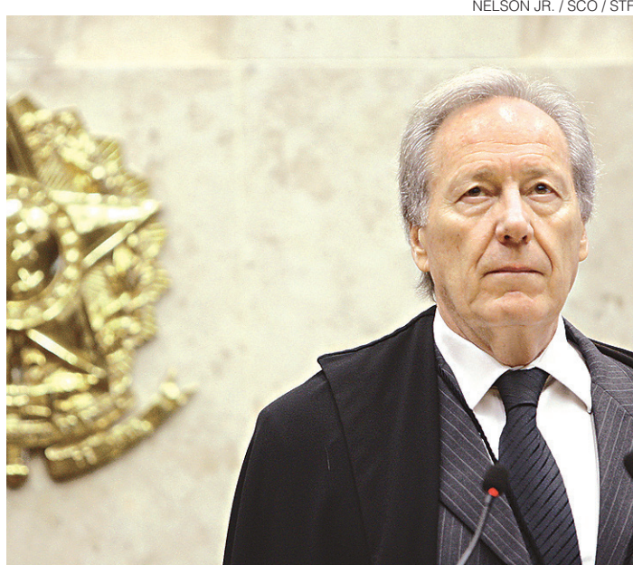
// Ricardo Lewandowski lembra a possibilidade de recursos

Ao chegar ontem ao STF, o presidente da Corte lembrou que a possibilidade de apresentação de recursos, as diligências e oitivas que poderão ser requeridas pela defesa e acusação podem alongar o processo de análise do mé-