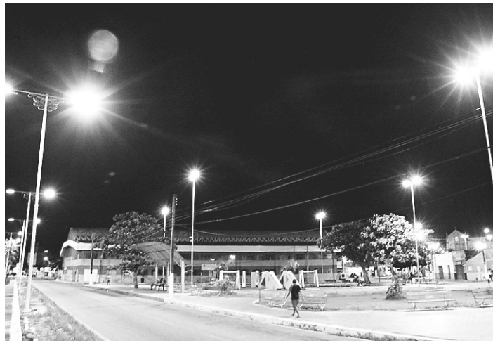
// Iniciativa é parte do Projeto de Eficientização Energética da Semsur

O investimento em iluminação em LED foi iniciado pela Prefeitura do Natal em 2014 nos principais corredores da região Sul, como BR 101, Salgado Filho até a altura do Midway Mall, orla marítima da cidade (Ponta a Negra a Redinha), Ponte Newton Na-