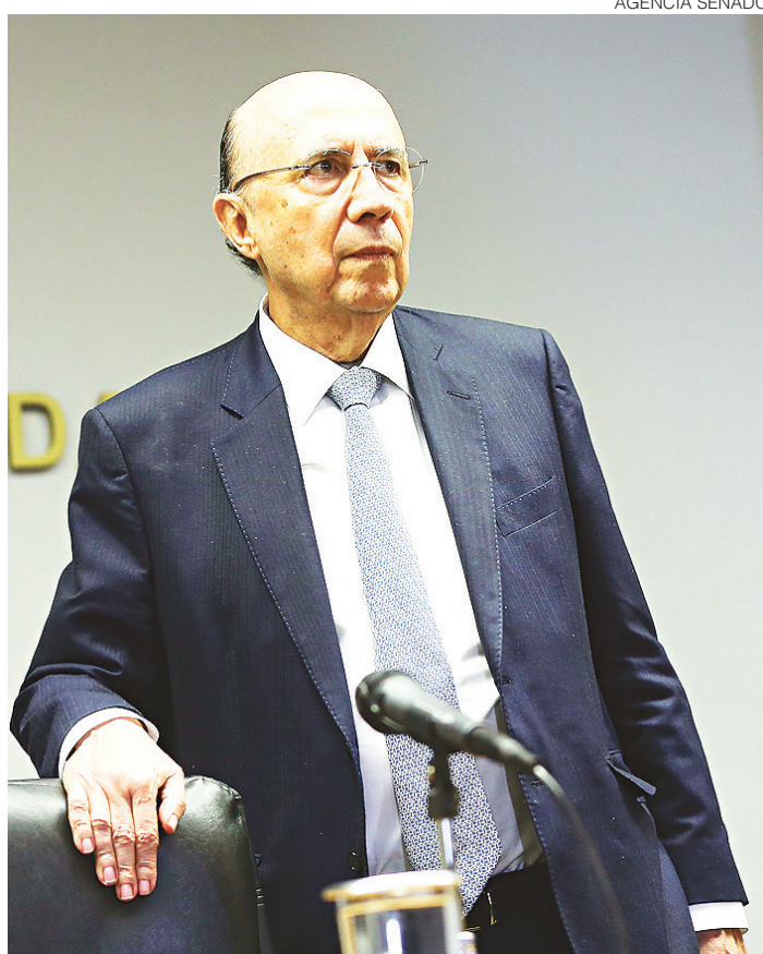
// Henrique Meirelles, ministro da Fazenda: mais prazo para a meta

O governo tem até o dia 30 de maio para realizar a mudança da meta fiscal. Enquanto isso, o novo dirigente da Fazenda tem evitado anunciar números e ressaltou, por diversas vezes durante o encontro, que é preciso ser criterioso com os cálculos para que