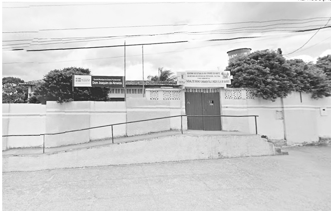
// Segundo a PM, autor do disparo já foi apreendido (e solto) outras vezes por envolvimento com tráfico

Ainda segundo informações do delegado, o adolescente diz que o outro estudante o convidou para consumir drogas, mas que recusou. Os dois discutiram e foi iniciada a briga. No entanto, a investigação preliminar mostra que o