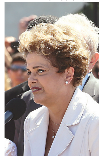
// Dilma terá que apontar os atos que compõem o golpe

neira como vem fazendo, a senhora presidente da República deixa toda a nação em dúvida, recomendando, portanto, a presente interpelação, a fim de que possa explicar qual a natureza, os motivos e os agentes desse suposto 'golpe', dizem os deputados na ação.