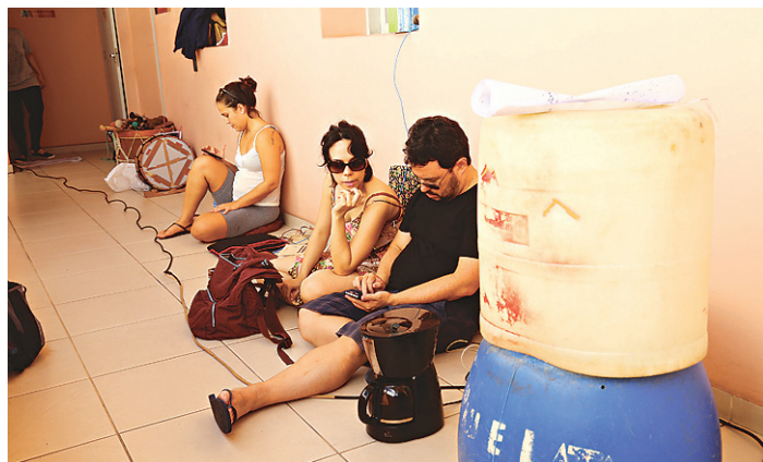
// Ocupação se divide em turnos e também promove ações culturais

exemplo de mostras de filmes, oficinas diversas, workshops e ensaios abertos de espetáculos.