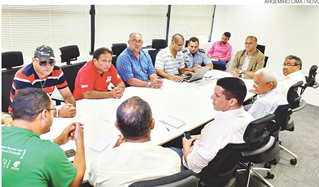
// Cúpula da Secretaria de Segurança se reúne com o sindicato dos rodoviários

O sindicalista informou ainda que, dentro de 15 dias, haverá nova reunião com representantes da Secretaria de Segurança Pública e Defesa Social para discutir o que vem sendo feito e o que pode ser melhorado. "É muito triste que um pai de família saia de casa para ganhar o pão e corra o risco de levar um tiro e morrer, ou ficar paraplégico", lamenta.