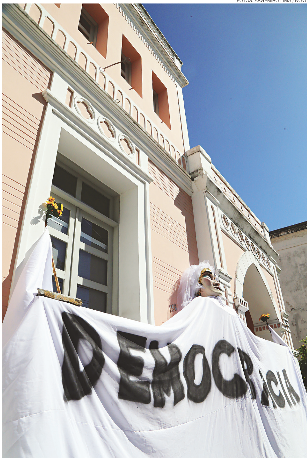
// Além de Natal, outras 10 cidades também ocuparam prédios de órgãos ligados ao extinto MinC

Até domingo várias ações culturais gratuitas estão sendo articuladas para serem realizadas no prédio do IPHAN/RN, a