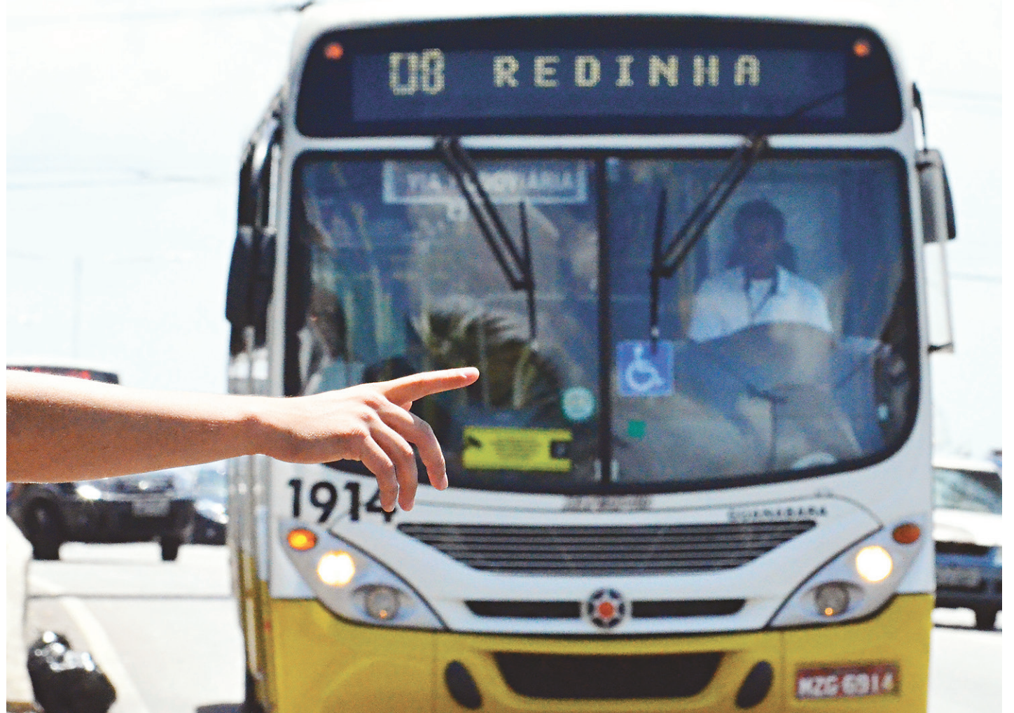
// Entre janeiro e abril deste ano, a Secretaria de Segurança Pública e Defesa Social registrou 72 ocorrências de assalto a ônibus em Natal

Na noite da segunda-feira passada, no bairro de Cidade Satélite, mais uma dessas ocorrências foi registrada pela polícia. Dois homens re-