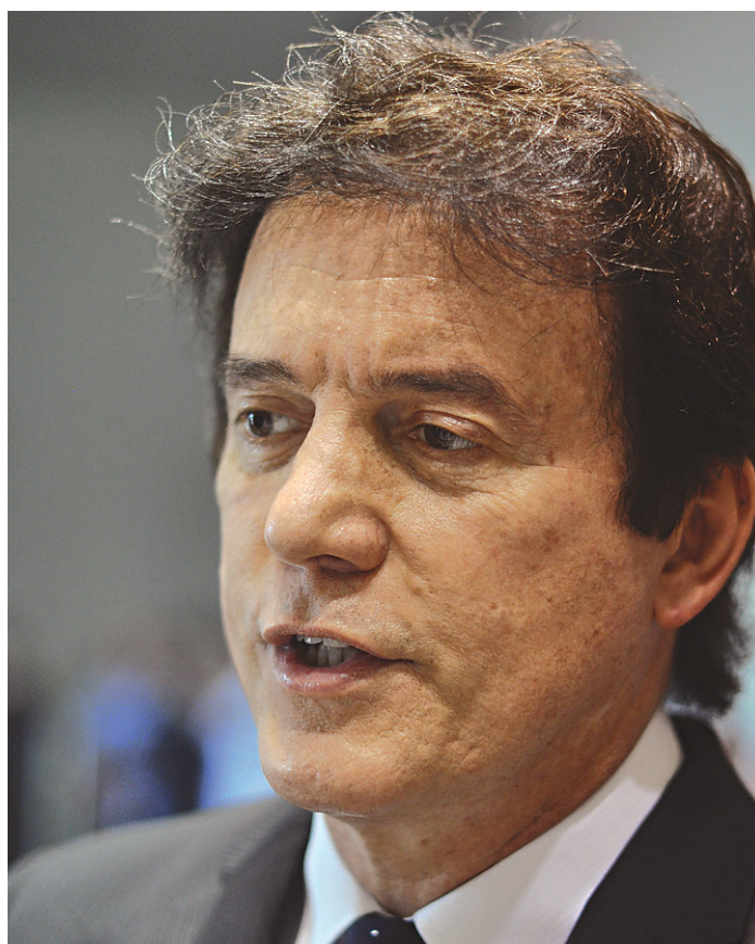
// Robinson Faria, governador: “A população tem pressa”

Entre as metas da Secretaria de Infraestrutura, por exemplo, está a ampliação e melhoria da qualidade da malha rodoviária estadual. O mapa estratégico e os contratos firmados entre governador e secretários podem ser consultados no site governancainovadora.seplan.rn.gov.br