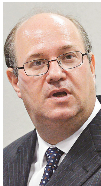
// Ilan Goldfajn, presidente do Banco Central: pessoa acessível

Considerado no trabalho uma pessoa acessível, Goldfajn é afeito a formalidades. Prefere o blazer e, sempre que pode, dispensa o terno, a gravata e as abotoaduras. Quem trabalha com ele diz que não é preciso marcar hora para discutir qualquer assunto e, se ele