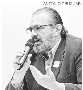
// Barusco teve condenação suspensa graças a delação

Moro ordenou a renovação da prisão preventiva de Moura, que havia sido revogada em novembro de 2015