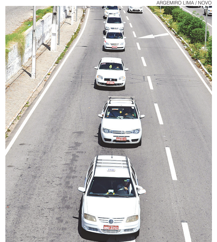
// Taxistas saíram em carreta em direção à Prefeitura do Natal