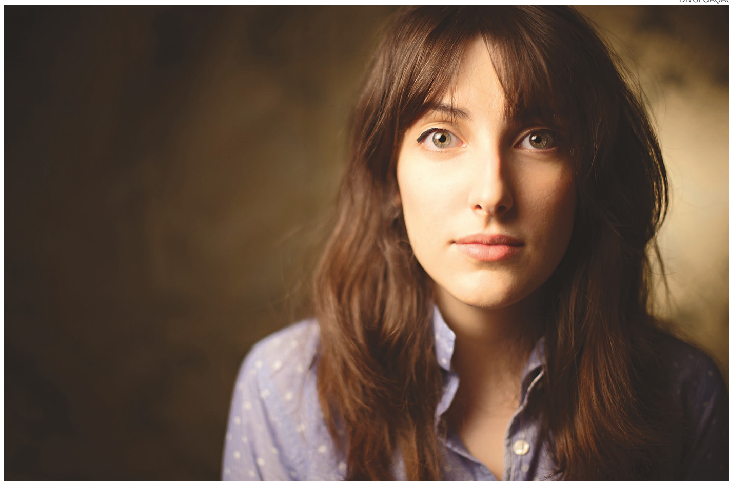
// Legenda Us, quia sam rae lat. Ellabora dolum voluptas vit ariam as sum unt aut et haria volupti od es ene

é preciso contar que a personagem principal das canções inverteu o jogo a favor dela e já não sofre mais. Ao contrário, ri da cara daquele homem tolo que acreditou que o amor descompensado que ele recebia valia alguma coisa.