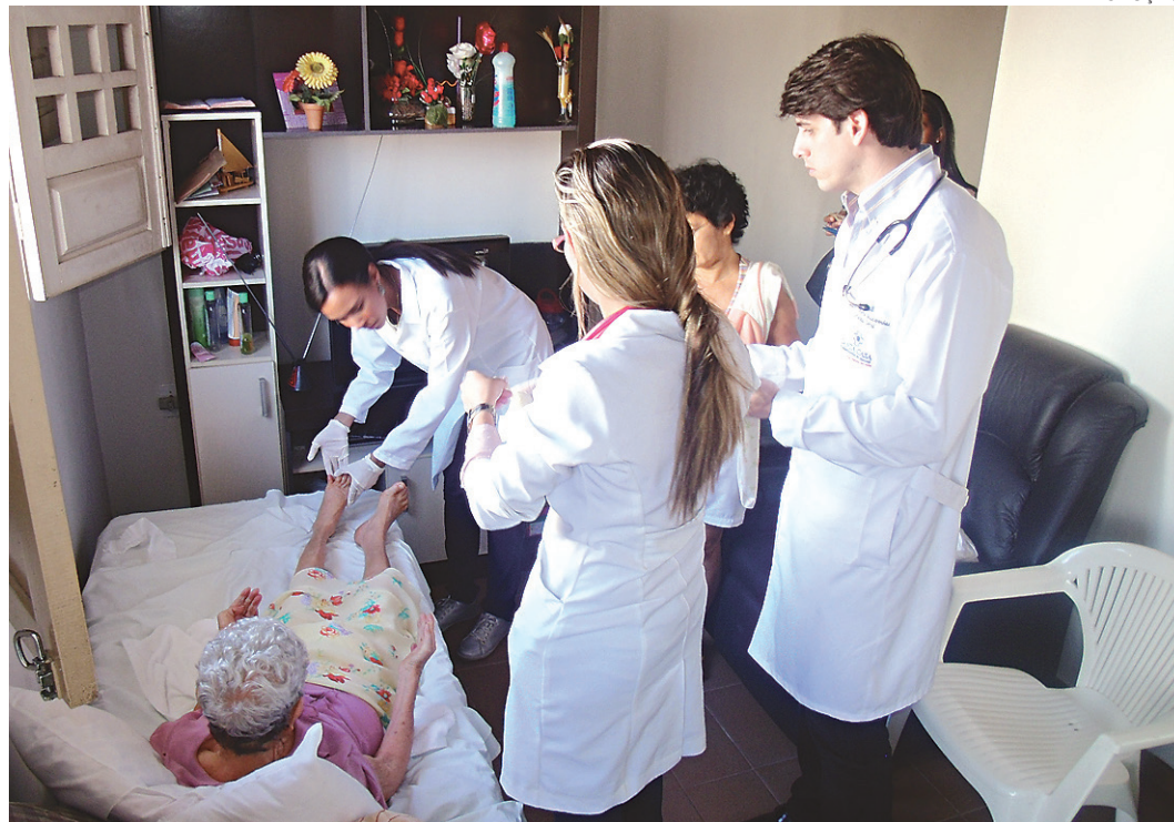
// Coordenação do SAD está firmando parcerias para conseguir ampliar serviço

Ele também expôs também que, atualmente, o Serviço de Atendimento Domiciliar presta assistência médica para 69 pacientes, que recebem visitas domiciliares por uma equipe multidisciplinar composta por médico, enfermeiro, técnico de enfermagem, fisioterapeuta, nutri-