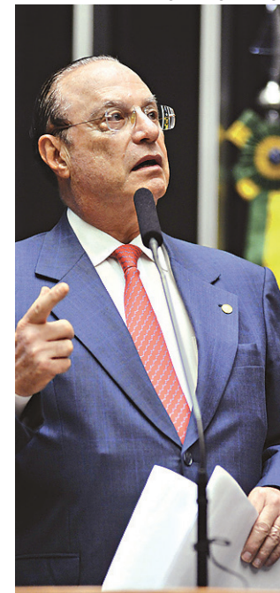
// Paulo Maluf, deputado federal: lavagem de dinheiro