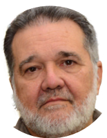
Cena Urbana [ Vicente Serejo ]

Na política, a tirar pelos últimos exemplos, nem sempre o "novo" representa a melhor opção. #4