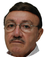
Jornal De [ João Batista Machado ]

Na experiência de Drauzio Varella e no exemplo do modelo inglês, a constatação: SUS só é único na sigla. #5