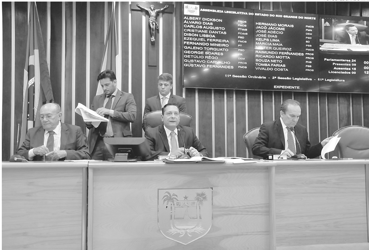
// Medidas para contenção de gastos na folha de pessoal estão sendo analisadas pela Procuradoria da Assembleia Legislativa

A folha e a situação funcional também são alvos de investigação do Tribunal de