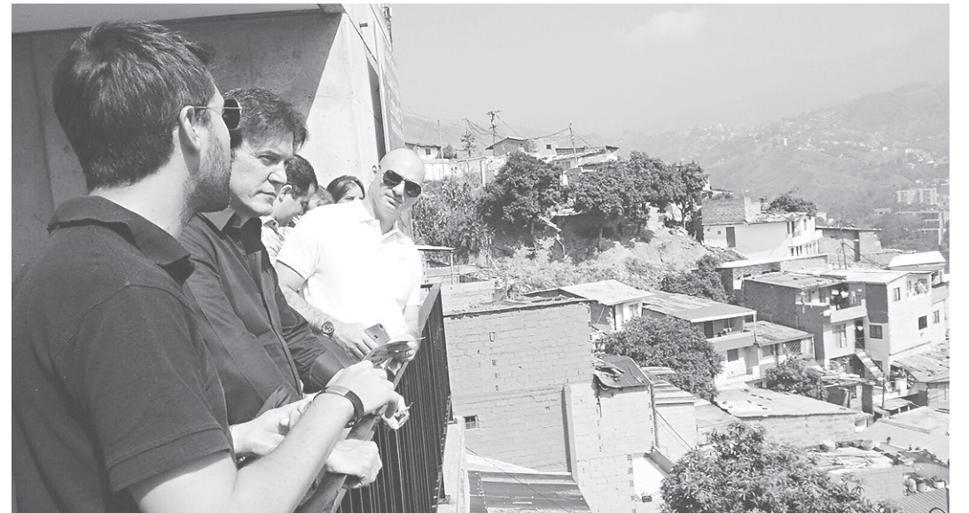
// Governador Robinson Faria 'admirando' Medellín, durante a sua visita a Colômbia