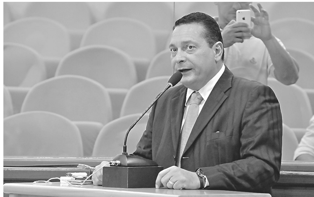
// Deputado Ezequiel Ferreira, presidente da Assembleia Legislativa do RN

A iniciativa do TCE atende representação do procurador-geral do Ministério Público de Contas em exercício, Thiago Guterres, que requisitou a auditoria. Após a publicação em Diário Oficial, a comissão deverá iniciar as diligências, solicitando documentos ou verificando as informações in loco. A auditoria será feita em 90 dias.