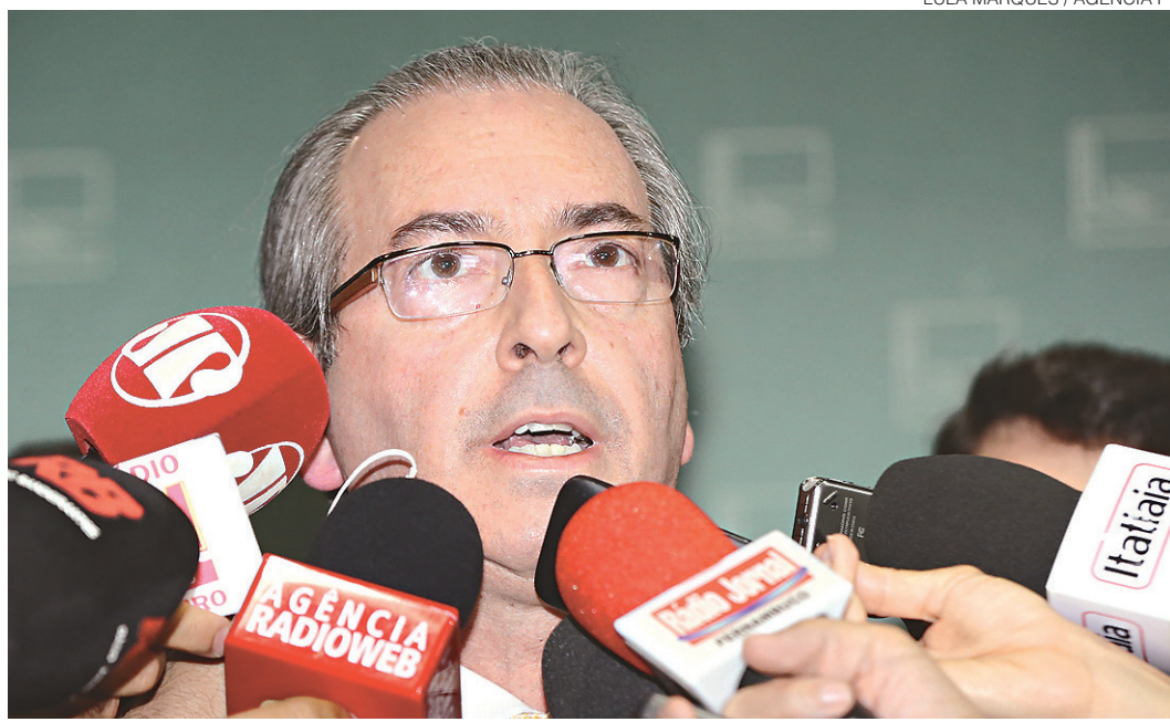
// Eduardo Cunha, presidente da Câmara Federal: contrato de navios-sondas da Petrobras