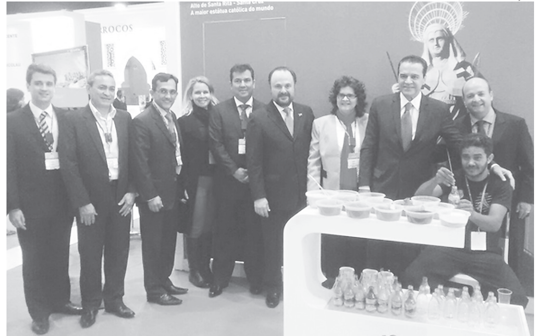
// Ministro Henrique Alves esteve na abertura da BTL 2016, em Lisboa, com a presença do Primeiro-Ministro, António Costa. Presente também o secretário estadual de Turismo, Ruy Gaspar