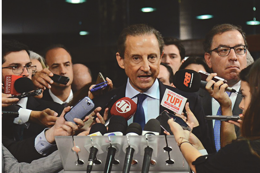
// Presidente da Fiesp, Paulo Skaf, enviou vídeo a vários associados chamando para o ato de hoje

Embora não tenha convocado associados para o protesto, o Sindicato da Indústria da Construção Civil do Estado de São Paulo (SindusCon-SP) divulgou nota em que defende a transparência de ações e o estado democrático de direito. "O sentimento de indefinição política está prejudicando o Brasil e travando os investimentos e a economia. É preciso que essa situação chegue rapidamente a um desfecho dentro da ordem democrática rumo à retomada do desenvolvimento sustentado do País".