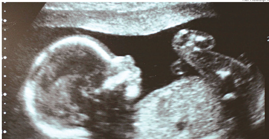
// Ministério da Saúde recomenda que a ultrassonografia seja realizada no primeiro trimestre