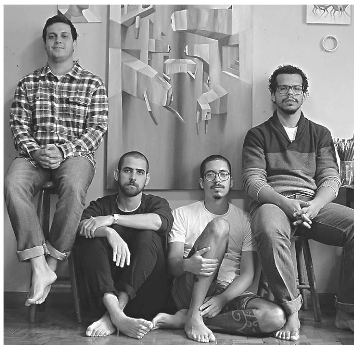
// Os potiguares da Mahmed são uma das atrações deste domingo

No palco aberto em Valva Melo Café Salão, na Avenida