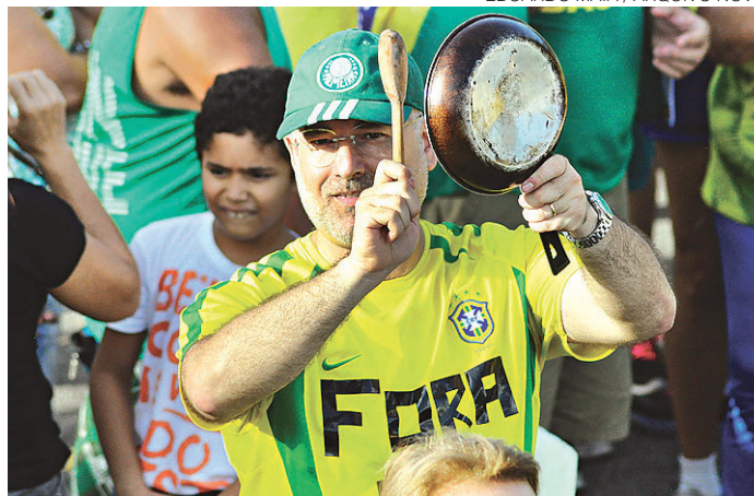
EDUARDO MAIA / ARQUIVO NOVO

Arthur Dutra Advogado e da organização do evento