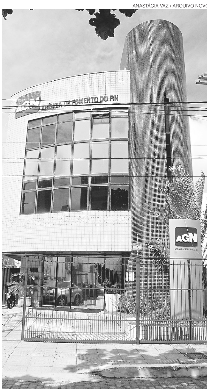
// Agência de Fomento do RN aprova e seleciona os candidatos

No entanto, caso o microempresário cumpra com o pa-