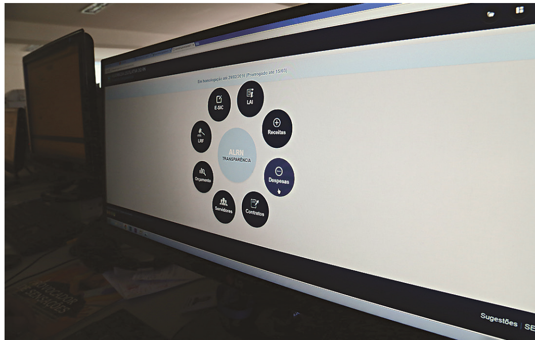
// Portal da Transparência da Assembleia Legislativa do RN revelou existência de funcionários fantasmas

www.sinmedrn.org.br | comunicacao@sinmedrn.org.br