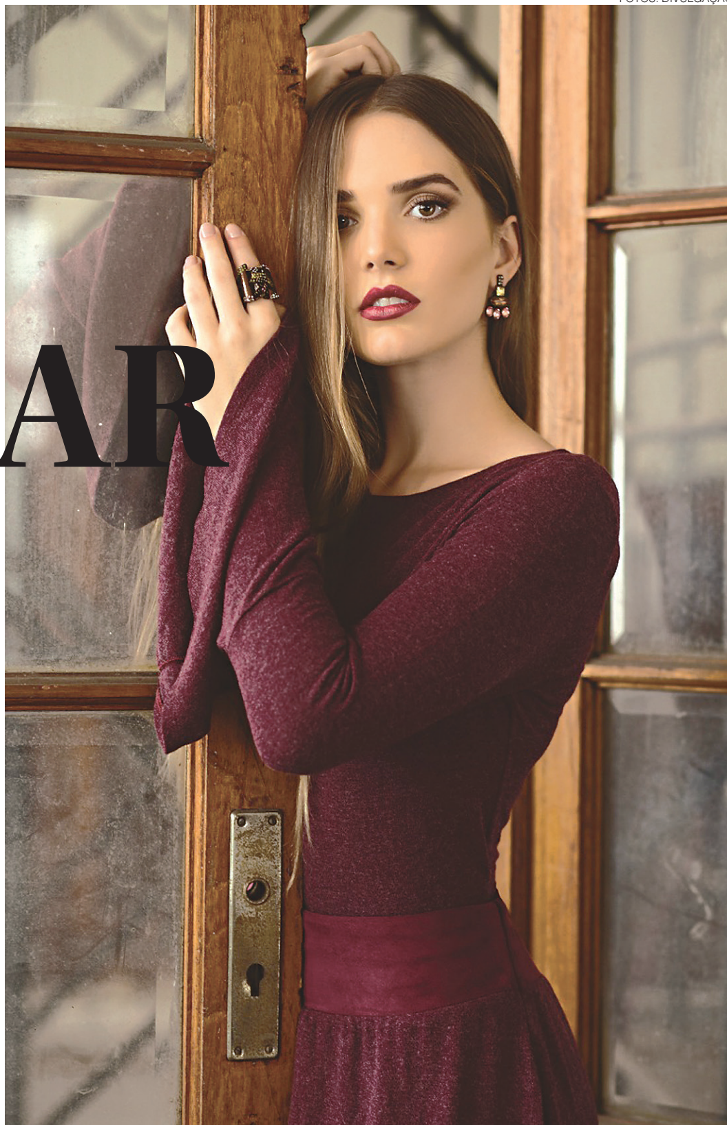
// Tyyli por Lígia Lapertosa

15 a 50 anos a partir roupa fácil de usar e a combinação da boa malha com materiais nobres tais seda e couro. E mais importante: preço compatível. Ainda falando em Ready-To-Go, a Unity 7 nasceu como startup. Tem mais de 900 seguidores no Instagram e faz uma roupa de festa contemporânea, sem excessos. Vencedora na edição de inverno, Rita Cassini se destaca por criações atemporais. Uma curiosidade no trabalho da estilista é que todas vestidos, coletes, calças, todas as peças, tem bolsos.