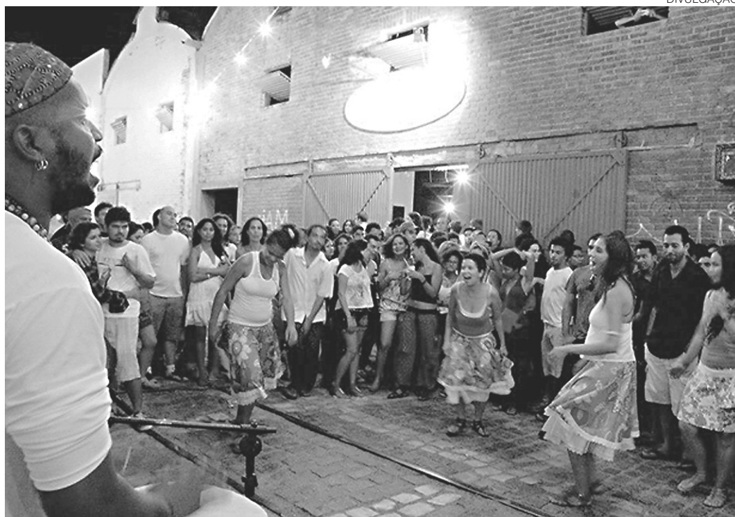
// O circuito cultural ocorre há cinco anos e este ano estão garantidas edições até o mês de julho