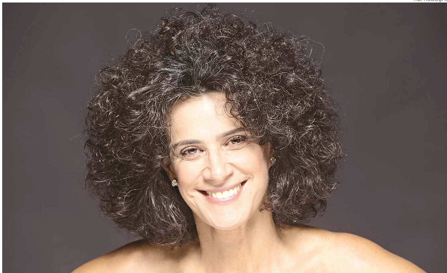
// "Está sendo um prazer enorme. Você não sabe o que é o olhar de uma pessoa que está vendo o primeiro show da vida dela", diz a cantora

O frisson despertado pela turnê É Melhor Ser se deve ao valor dos ingressos: R$ 1. E ainda há vendas a R$ 0,50, em respeito à obrigatoriedade da meia-entrada. Os ingressos