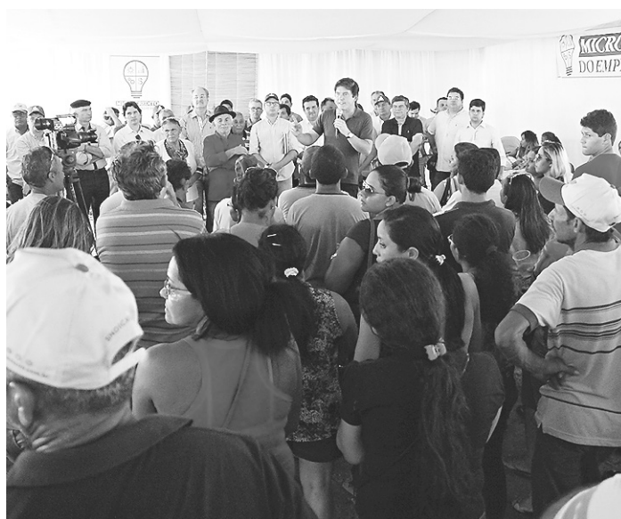
// Cerca de 400 profissionais dos mais diferentes ramos de atuação no Seridó foram beneficiados pelo programa na semana passada

Ainda segundo ela, que foi contemplada durante solenidade realizada na semana passada com a presença do governador Robinson Faria e microempreendedores da região do Seridó, não há tempo a perder para fazer logo uso do benefício que recebeu: “Com o dinheiro do Microcrédito vamos adquirir logo os ingredientes necessários e iniciar já a produção”, afirmou.