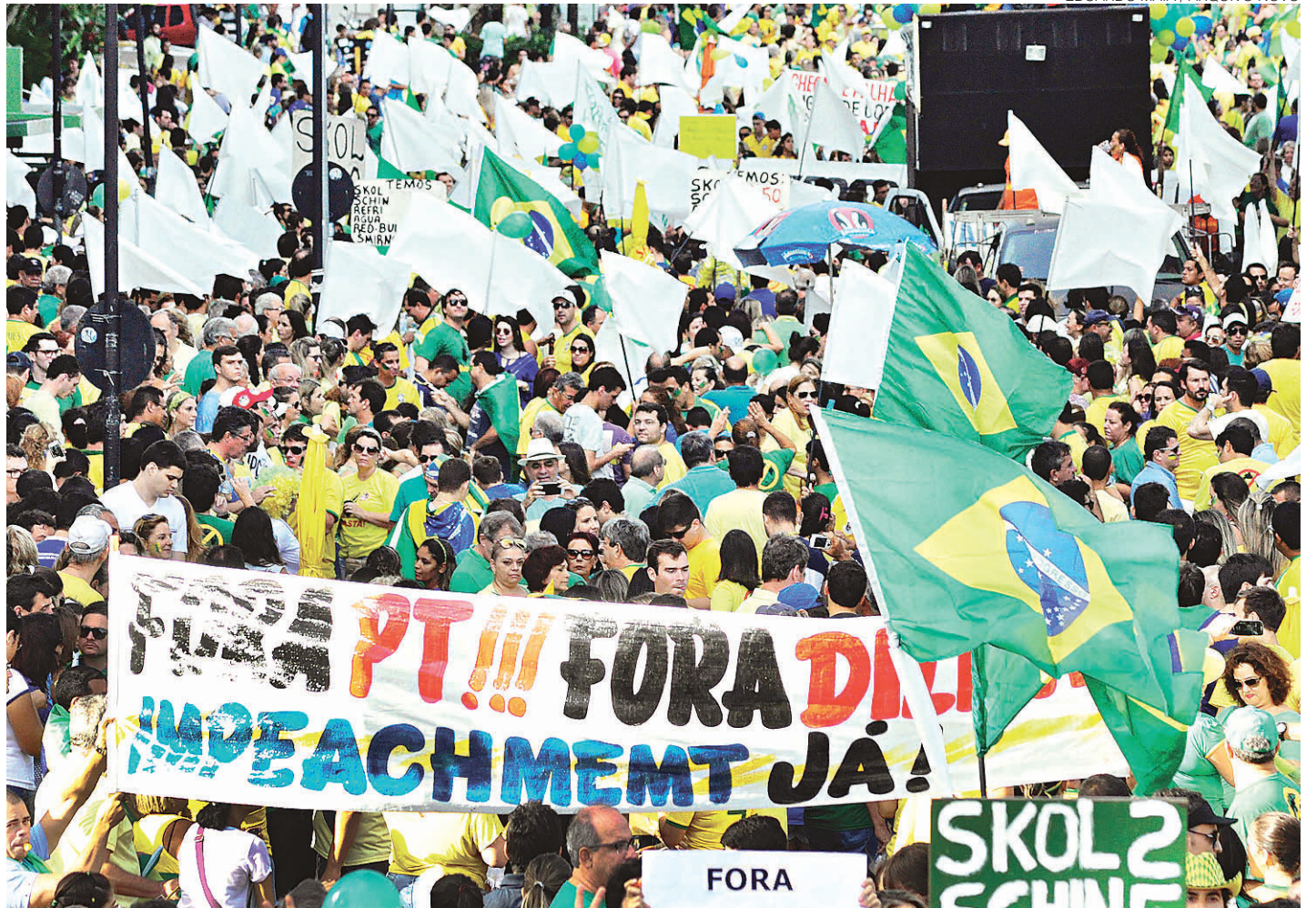
// Última manifestação realizada em Natal foi em dezembro do ano passado