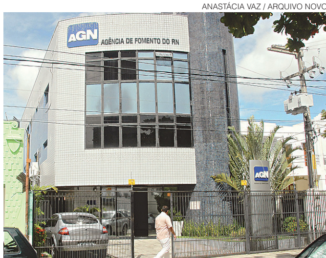
ANASTÁCIA VAZ / ARQUIVO NOVO