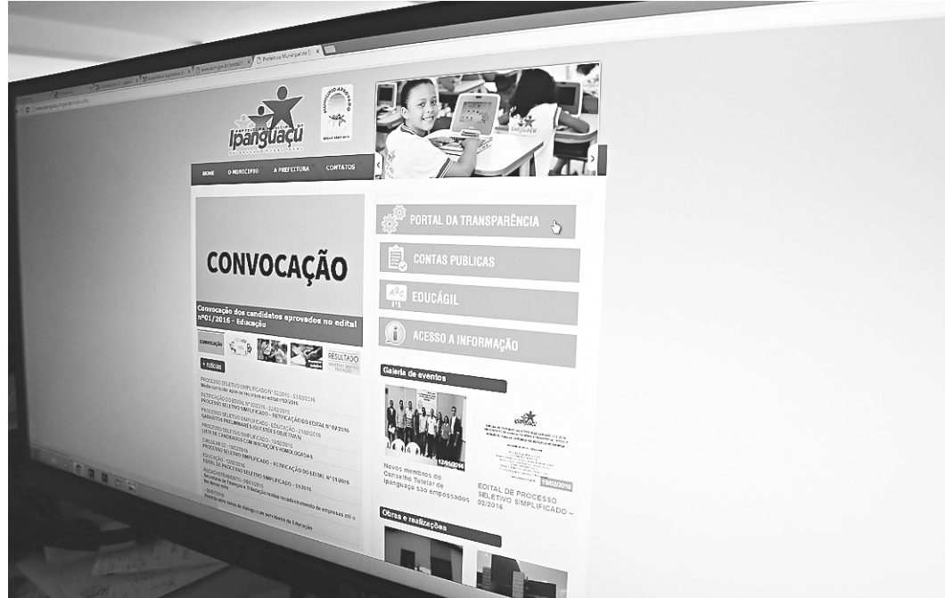
//Ministério Público Federal elegeu site da Prefeitura de Ipanguaçu como o melhor do RN em 2015