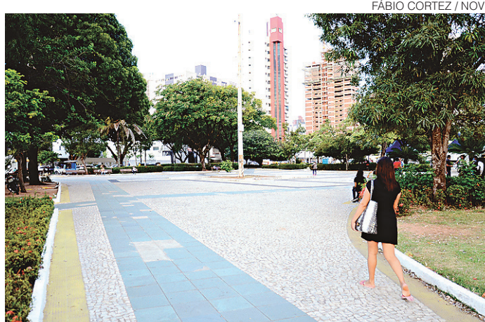
FÁBIO CORTEZ / NOVO

O itinerário das linhas de ônibus que passam pelo local também sofrerá mudanças.