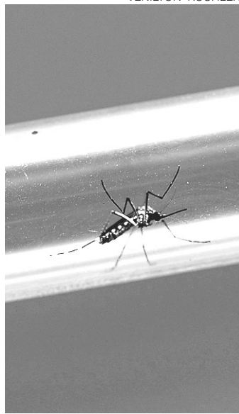
// Aedes : transmissor da dengue, Zika e chikungunya

A última etapa, ainda em fase de elaboração com o Ministério da Educação (MEC), prevê a participação de visitas a escolas. A meta é reforçar o trabalho de conscientização das crianças e adolescentes sobre como evitar a proliferação do mosquito Aedes aegypti .