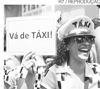
Pode beber mas, pra curtir de verdade, vá de taxi e afaste o risco de encontrar Styvenson

A festa carnavalesca é contagiante, até o sangue mais nobre esquenta. Os monarcas europeus já sabiam disso e começaram a se mascarar para conseguir se infiltrar no meio do povo. Histórias de perdidos