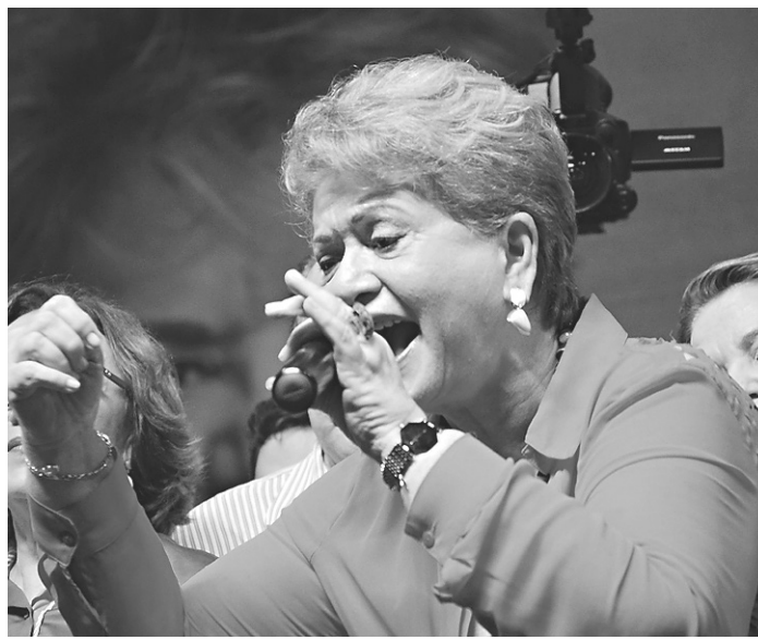
// Wilma de Faria: vice-prefeita de Natal