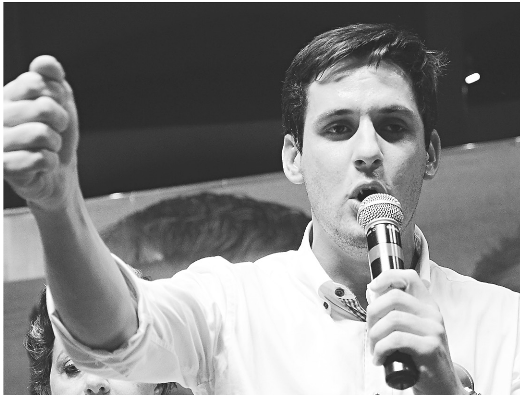
// Rafael Motta, deputado federal: novo presidente do PSB no Rio Grande do Norte

A decisão veio acompanhada de críticas à gestão de Wilma, chamada de individualista e responsável pela má prestação de contas das eleições de 2014 que levou o Tribunal Regional. “É lamentável que a nova direção partidária esteja recebendo o PSB/RN com contas rejeitadas pelo Tribunal Regional Eleitoral – TRE, o que demonstra a forma como o PSB/RN vinha sendo