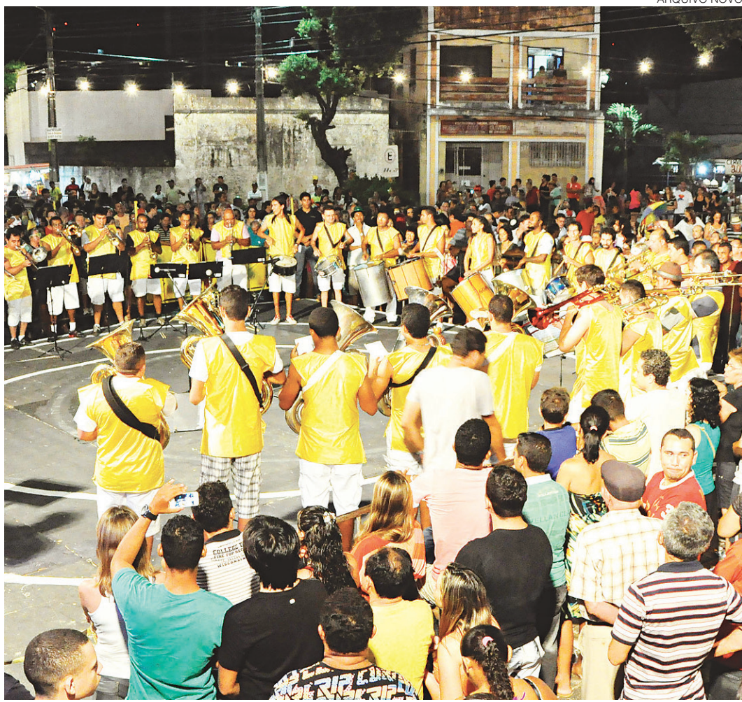
// Segundo dia de carnaval em Natal também terá o reggae da banda Alphorria e o som da banda Detroit

Largo do Atheneu, em Petrópolis, será palco para o baiano Armandinho embalar o público com clássicos da folia de momo