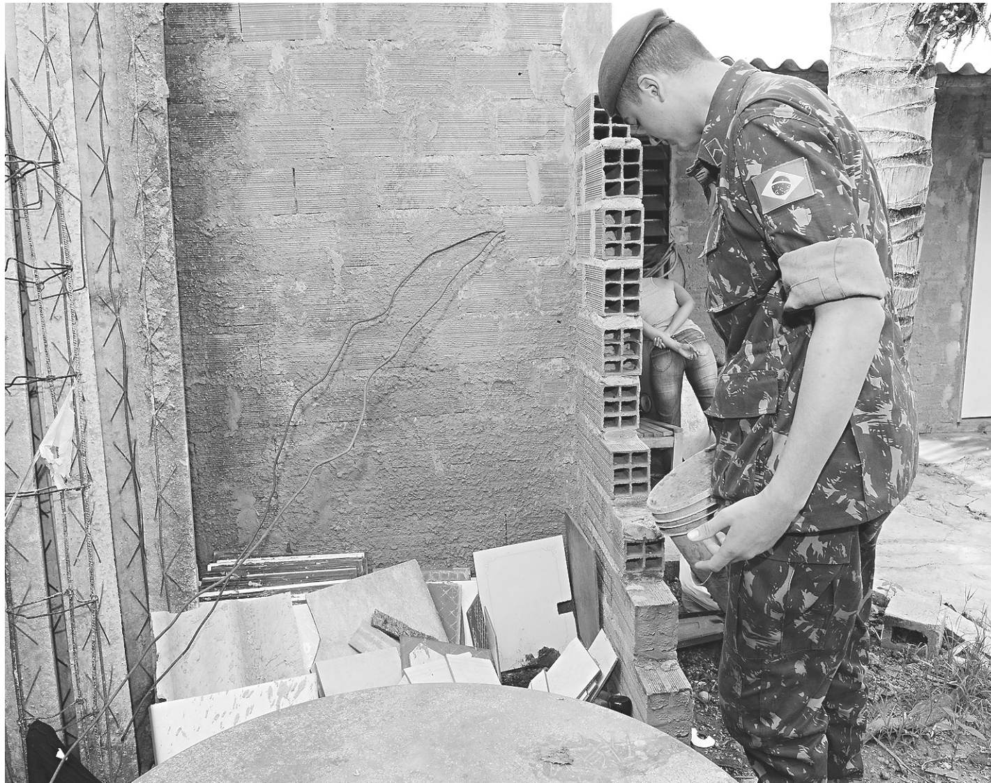
// Em todo o país, serão cerca de 220 mil militares indo às ruas para distribuir material impresso com orientações para a população

Ainda estão previstas duas etapas da campanha de combate ao Aedes . Entre os dias 15 e 18 de feverei-