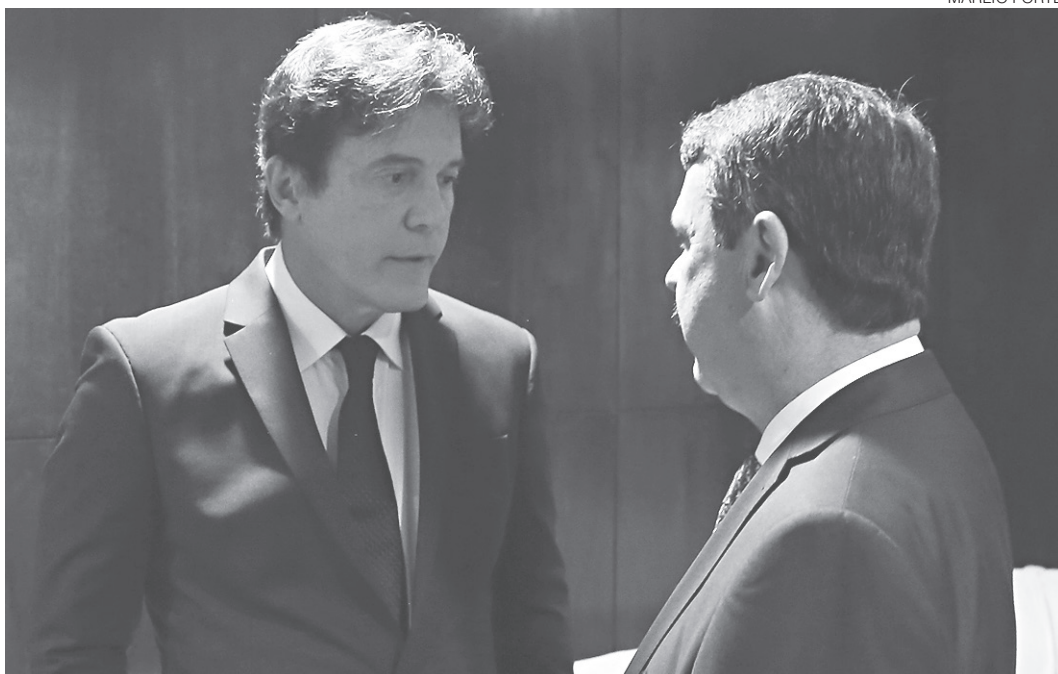
// Conversa de 'pé de ouvido' entre o governador Robinson Faria e o ex-presidente da Assembleia, deputado Ricardo Motta