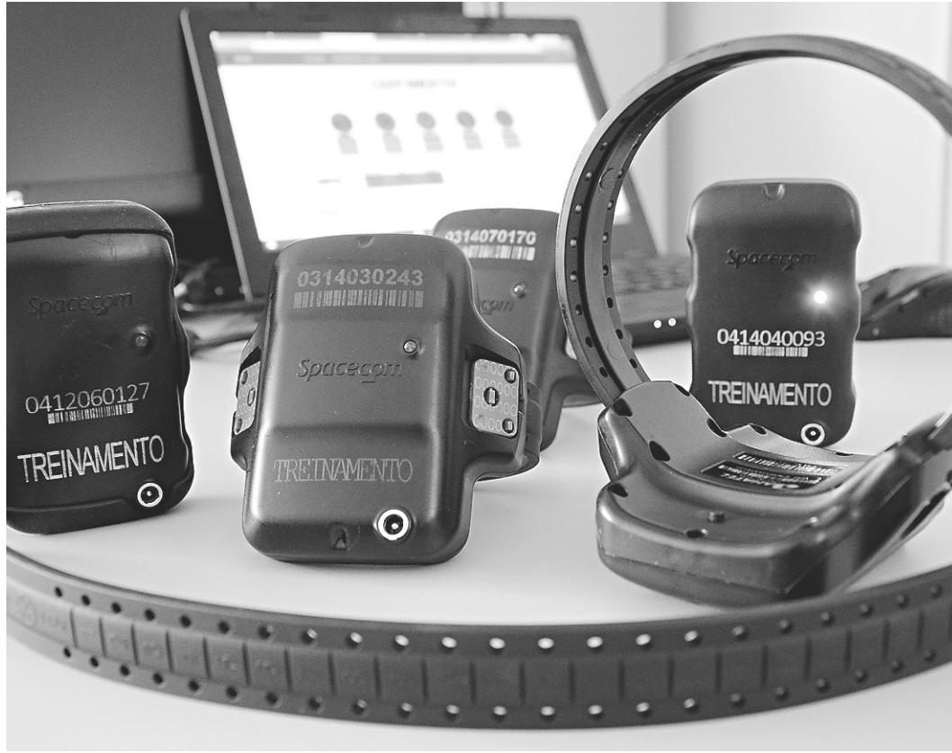
// Equipamento (500 unidades) foi adquirido pelo Governo do Estado em 2015; custo unitário é de R$ 275

Mesmo sem divulgar quanto o estado vai economizar com o uso do equipamento de monitoramento, o titular da Sejuc cita o exemplo dos presos do regime semiaberto custodiados em Parnamirim, que conta com 118 detidos.