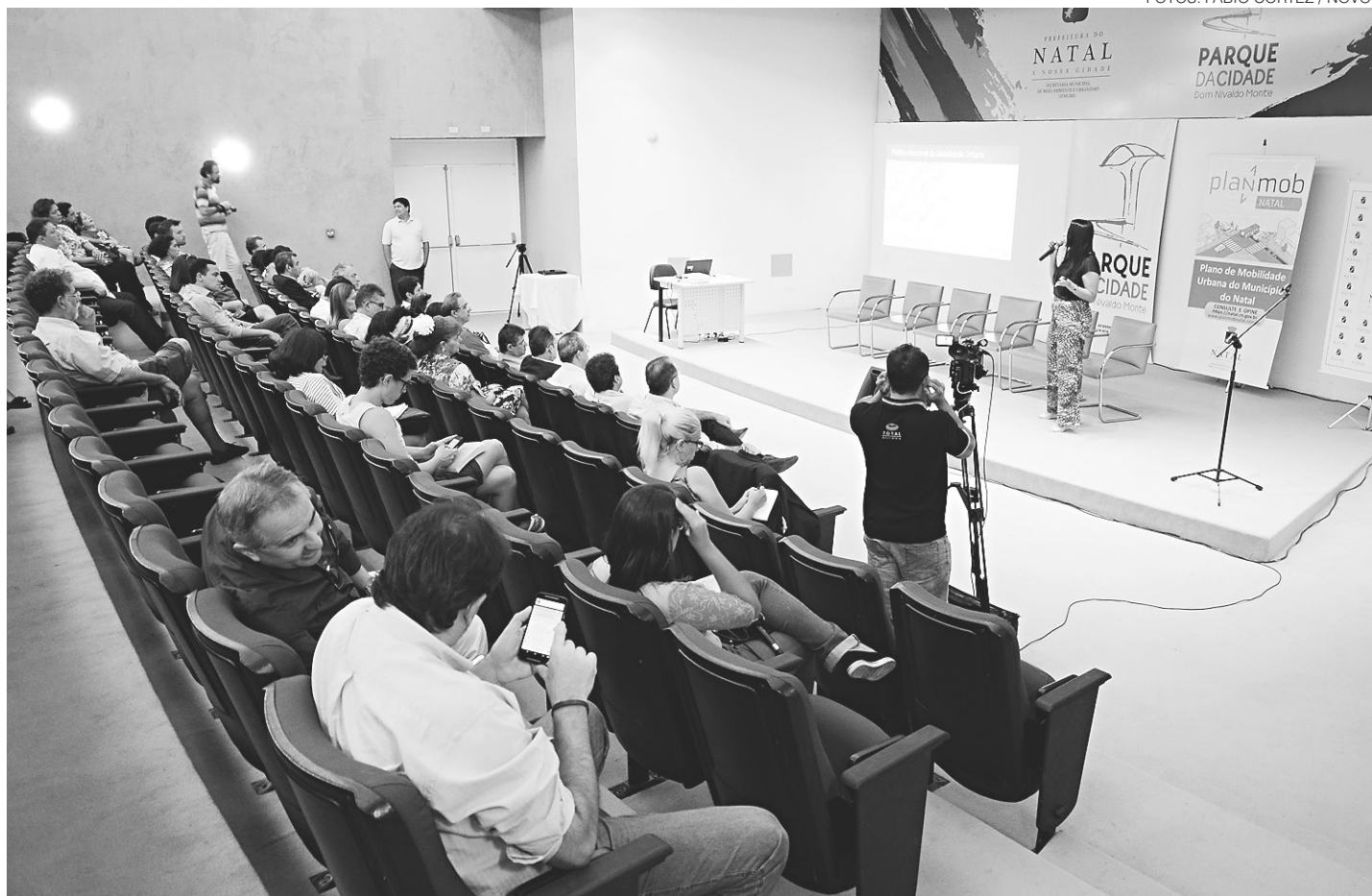
// Prefeitura do Natal divulgou os primeiros direcionamentos para elaboração do Plano de Mobilidade Urbana