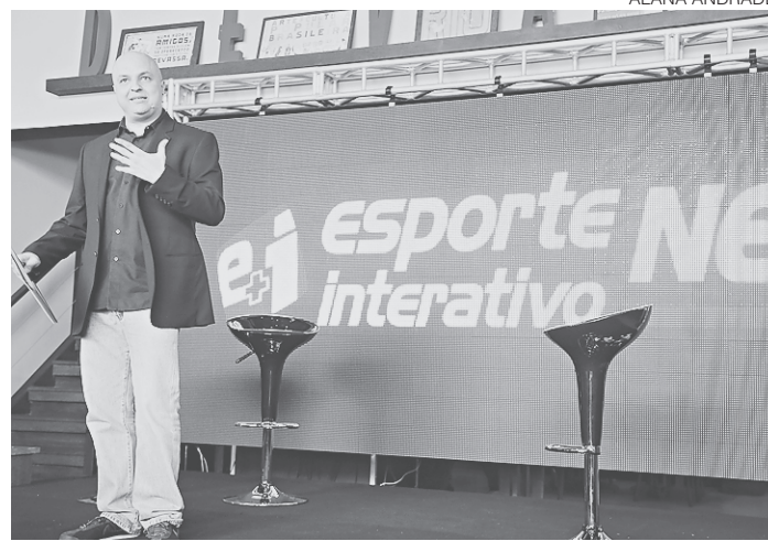
// Esporte Interativo é o único que transmite a Copa do Nordeste

perou a ESPN para adquirir os direitos de transmissão da Liga dos Campeões da Europa na atual e na próxima temporadas. O canal teve dificuldades de entrar no pacote das principais operadoras de TV paga no Brasil (Sky e Net) e precisou transmitir partidas nos canais dedicados a filmes e séries do grupo Turner. Nos últimos anos também chegou ao Brasil o canal Fox Sports, que tirou do SporTV os direitos de transmissão da Copa Libertadores. O canal do gru-