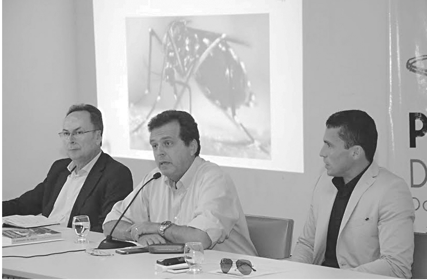
// Prefeito ordenou que todos os prédios pertencentes ao Município que ainda não foram vistoriados sejam inspecionados

O secretário e o prefeito comemoraram a redução re-