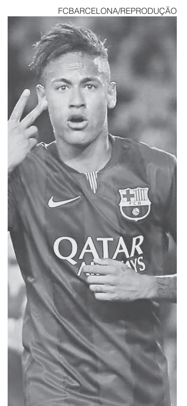
// Neymar, entrando numa fria

O recurso de Blatter contra a suspensão, também de oito anos, será ouvido nesta terça-feira, dez dias antes do congresso que elegerá seu sucessor como presidente da Fifa. Blatter e Platini também pode recorrer à Corte Arbitral do Esporte se suas suspensões foram mantidas. As esperanças do francês de suceder o suíço foram frustradas pela investigação sobre o pagamento de US$ 2 milhões (R$ 8 milhões). Além disso, a Uefa não apontou um presidente interino para dirigir a organização antes da Eurocopa, que se realizará na França, em junho. A entidade avisou que não iniciará um processo eleitoral até que Platini encerre a sua luta judicial.