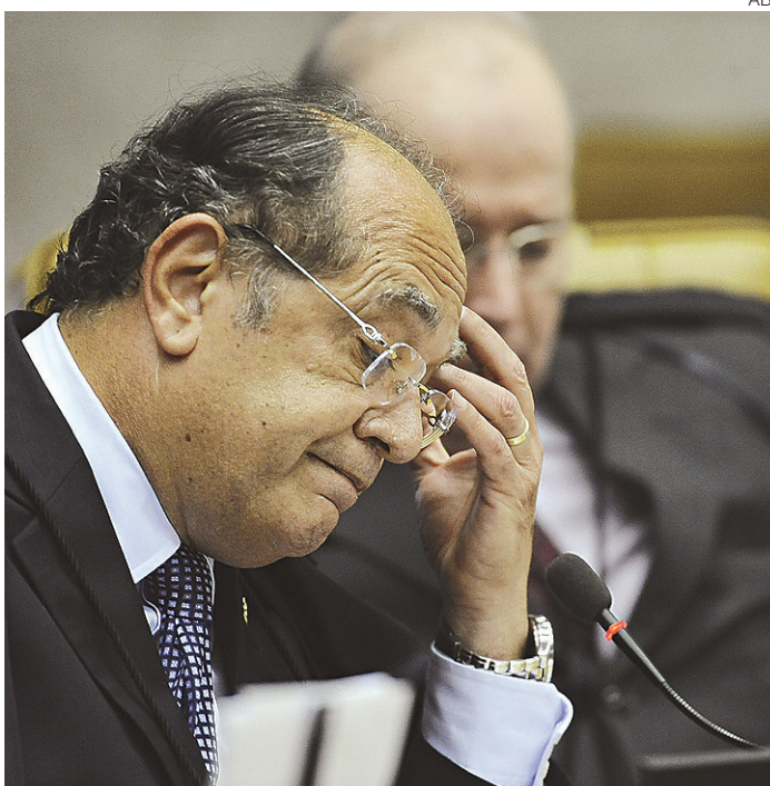
// Gilmar Mendes, ministro do Supremo Tribunal Federal

“Uma questão fácil, típica até do populismo constitucional, ah, agora a gente vai resolver o problema. Ah, a causa da corrupção está no financiamento privado. Logo, tudo o que ocorreu aí, especialmente agora no Petrolão, está associado a esse fenômeno. O próprio Supremo disse que o financiamento privado é inconstitucional, então estamos absolvidos, até anistiados. Absolvidos, claro. Vamos entrar numa nova fase. Façam o que