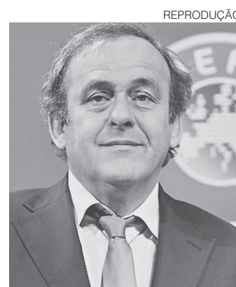
// Platini, de craque a culpado

O Comitê de Ética da Fifa considerou Platini culpado de aceitar presentes, conflitos de interesse, deslealdade e não-cumprimento de regras de conduta. Ele também foi multado em 80 mil francos suíços (R$ 323 mil). Os juizes da comissão disseram que não era convincente o argumento dos advogados de Platini de que um contrato verbal lhe conferia o direito a receber um salário em 2011 pelo trabalho re-