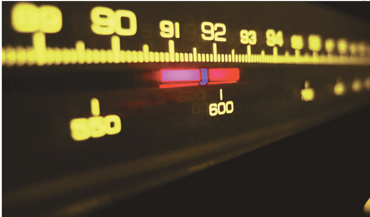
// Segundo o Ministério das Comunicações, o Brasil tem hoje 1.781 emissoras de AM e 1.385 já pediram para mudar de faixa para FM

mil em equipamentos. "O valor não é desprezível, mas vale a pena. A diferença da qualidade entre AM e FM é muito grande. O rádio é o sujeito do serviço local", destacou.