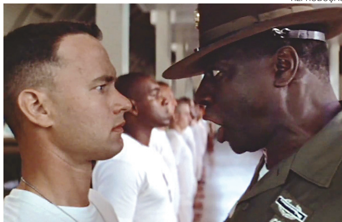
// Filme Forrest Gump (1995) está entre as reexibições

Em todo caso, é neste Chefão que temos a figura impagável de Marlon Brando como Don Vito Corleone, o capo que veio menino da Sicília e se tornou o padrinho da máfia nos Estados Unidos. O diretor, Francis Ford Coppola, usa o argumento da família mafiosa para retratar