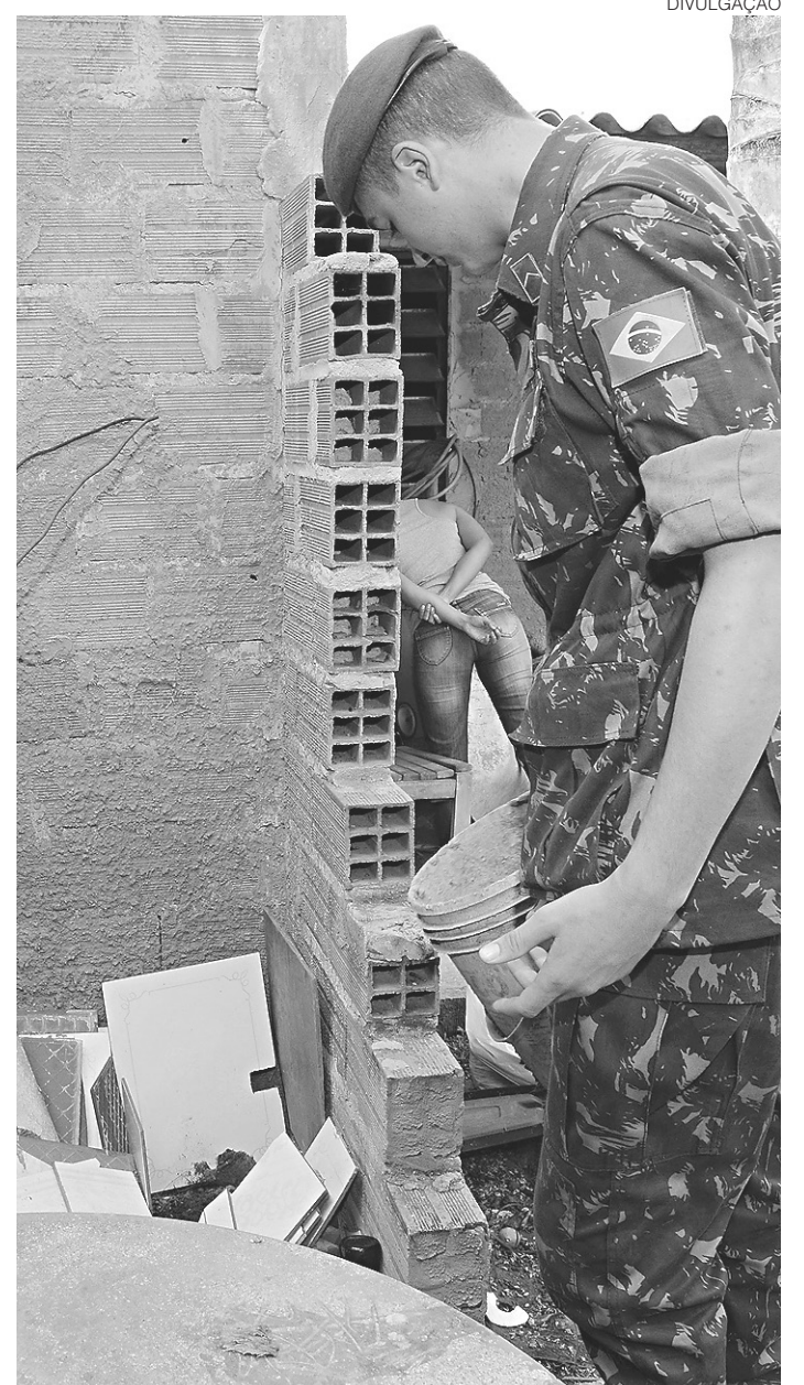
// Em todo o Brasil, militares participam do combate ao Aedes

Do próximo dia 19 a 4 de março, as ações serão nas escolas, em uma parceria entre os ministérios da Defesa e da Educação. Militares vão percorrer escolas públicas e privadas, além de universidades, levando informações aos alunos.