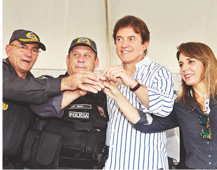
// Governador Robinson Faria e secretária Kalina Leite: equipamentos

“Não temos previsão de quando poderemos colocar as próximas etapas na rua, já que antes precisamos realizar concursos e aumentar o efetivo, coisa que não podemos fazer agora” destaca.