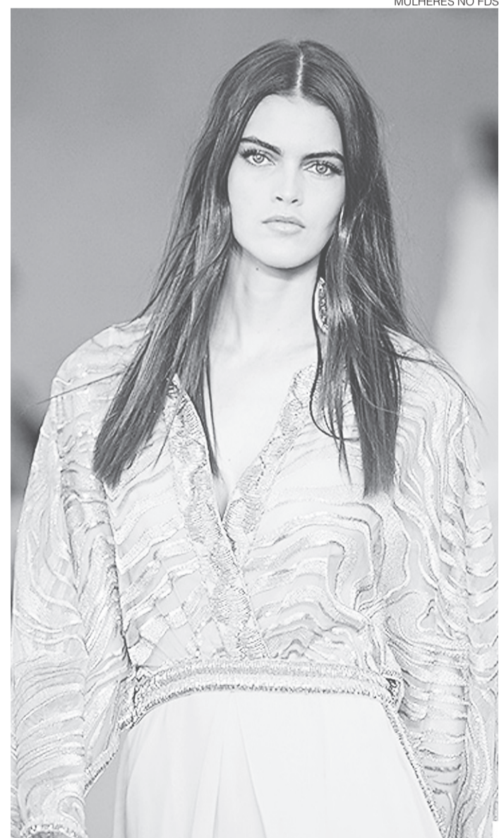
// Desfile Vivaz no Minas Trend Inverno 2016