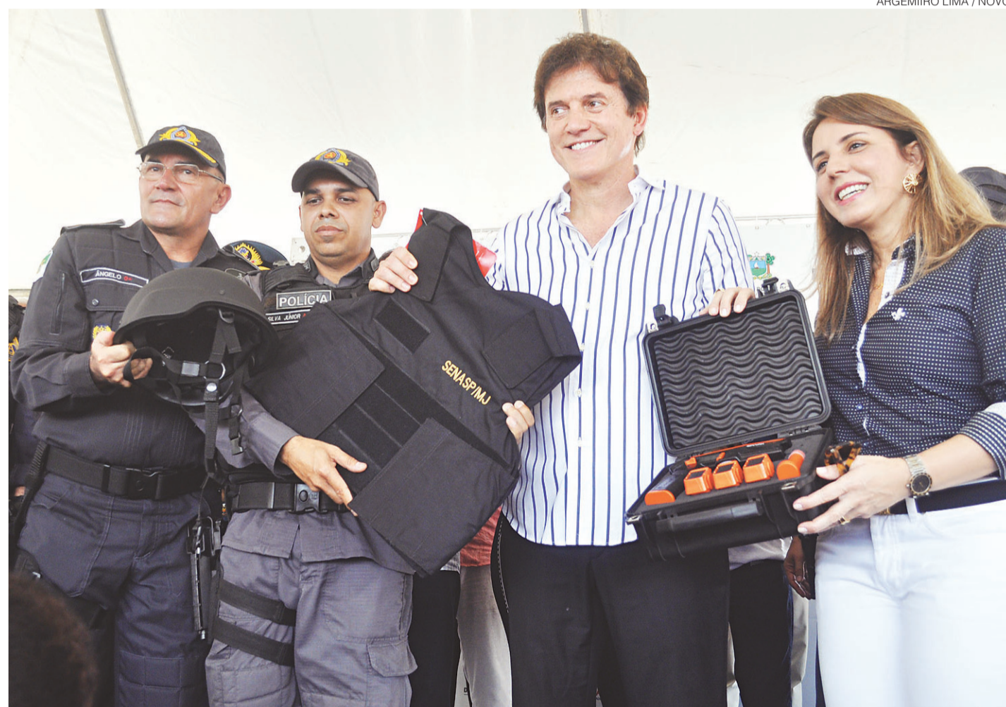
// Governador Robinson Faria fez a entrega de novos equipamentos e veículos para auxiliar no policiamento da área beneficiada pelo programa

Conselho Penitenciário decide levar ao Conselho Nacional de Justiça o caso da esquizofrênica que está presa há 11 anos sem tratamento médico, situação considerada ilegal. Cidades #11