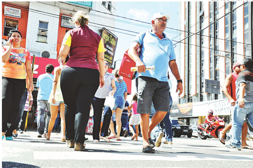
// Em 2014 a perspectiva de vida do potiguar era de 75,2 anos, enquanto que no ano anterior foi de 75

Segundo estima o IBGE, a expansão da Estratégia Saúde da Família (ESF), atenção às diarreias, estímulo ao aleitamento materno, ações de pla-