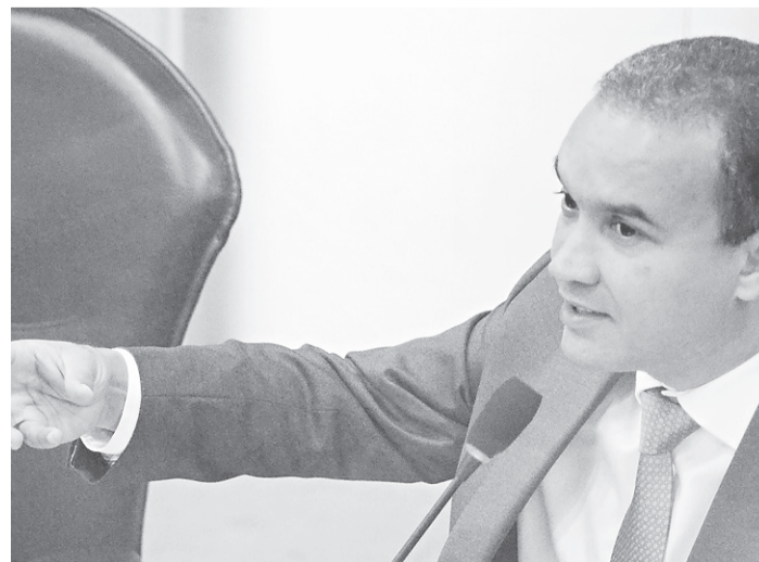
// Para deputado Kelps Lima (SDD), governo perde com projeto

O relator do projeto, Dison Lisboa (PSD), da base aliada do governador Robinson Faria (PSD), concordou com a posição de Kelps. Apesar disso, defendeu que a mudança não prejudicaria o governo por que o poderes ainda podem colaborar de forma voluntária, com o remanejamento de seus orçamentos para o Executivo. “Acho que os poderes não vão dificultar isso. O governo mandou um projeto que originalmente era um pouco autoritário, digamos assim. Você