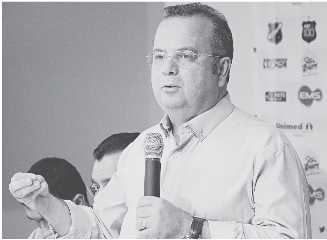
// Deputado federal e diretor do ABC, Rogério Marinho acredita que Profut é passo para profissionalização

Rogério foi um dos relatores da Medida Provisória sancionada em agosto pela presidenta Dilma Rousseff, após 139 dias da apresentação do