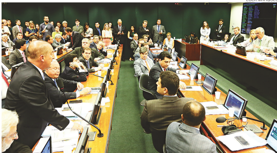
// Ministros agiram para que os três deputados que integram o Conselho de Ética mudassem de posição

A movimentação do Planalto a favor de Cunha aconteceu porque o peemedebista