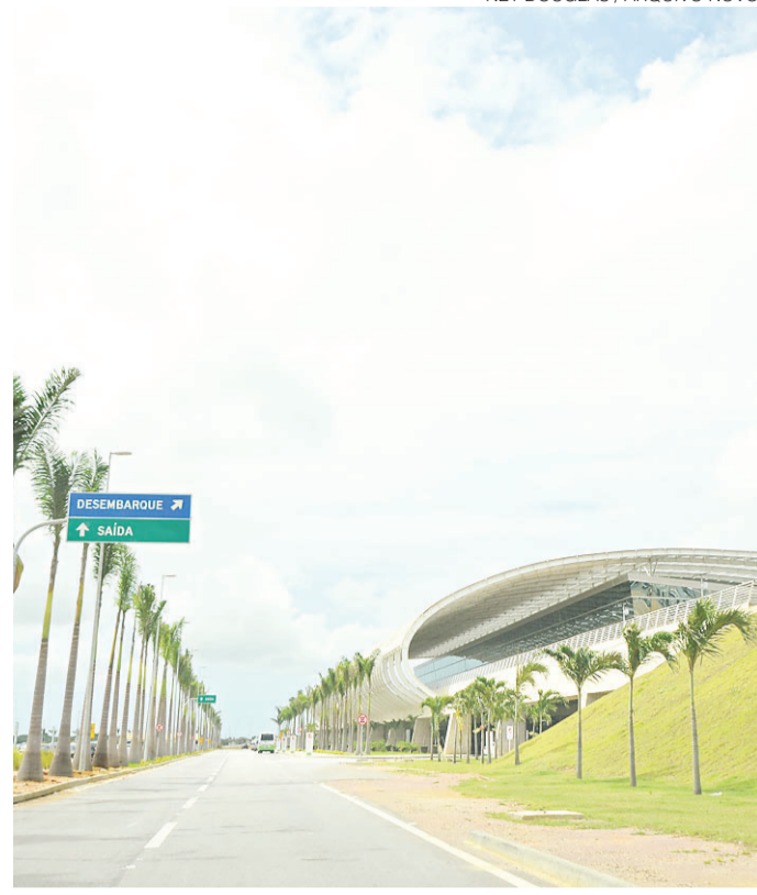
// Terminal aéreo fica bem posicionado mais uma vez

Para o ministro, os instrumentos de ajuste fiscal mais fáceis foram esgotados e o país precisa, agora, enfrentar questões de longo prazo para voltar a crescer. A solução estaria, segundo ele, na estabilidade fiscal e na criação de novas condições de financiamento da economia.