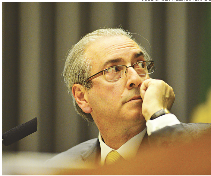
// Eduardo Cunha, presidente da Câmara Federal: fogo cruzado

Na nota assinada pela bancada, os tucanos dizem que as explicações de Cunha sobre suas contas na Suíça são insuficientes diante da "contundência das denúncias e documentos" já conhecidos. Só no penúltimo parágrafo do texto o partido reitera "de forma ainda mais veemente" posição da nota