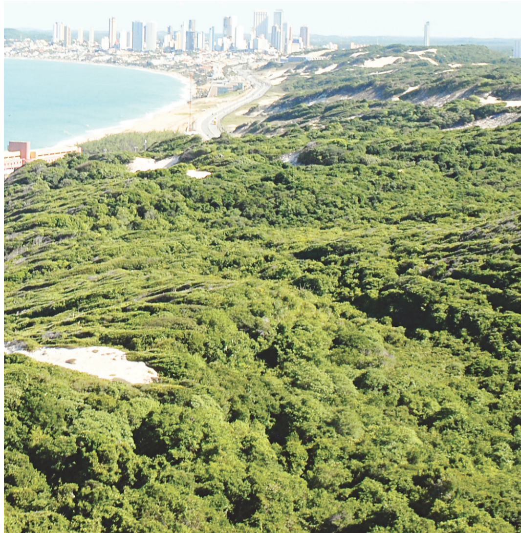
// Parque das Dunas, em Natal: uma das três unidades de conservação da Mata Atlântica no RN

“A SOS Mata Atlântica tem o objetivo de tornar mais acessíveis os dados e o histórico das cidades que são abrangidas pelo mapa de aplicação da Lei da Mata Atlântica [no endereço eletrônico da entidade]. A partir de uma ferramenta de fácil visualização, qualquer pessoa poderá saber como seu município tem con-