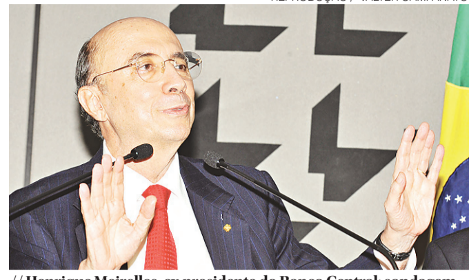
// Henrique Meirelles, ex-presidente do Banco Central: sondagem

"Em nenhuma hipótese, a bancada do PSDB irá transigir com a ética exigida dos