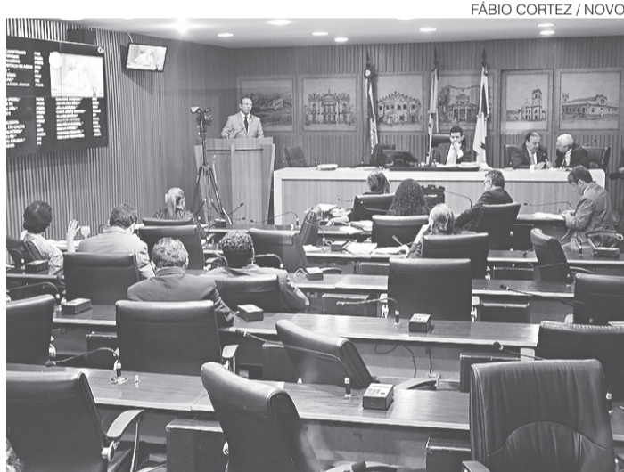
// Câmara recebeu a LOA 2016 no mês de setembro

municípios, no valor de R$ 1.415.033.000,00, a proposta orçamentária para o exercício do próximo ano fica em R$ 10.584.807.000,00. O orçamento 2016 prevê ainda R$ 8.751.700.000,00 de Receita Corrente Líquida, uma redução real de 8,42% em relação à peça orçamentária de 2015.