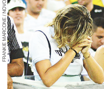
FRANKIE MARCONE / NOVO

Depois de seis anos, Alvinegro voltará à série C, tendo ao lado o América. Com base nos números, NOVO lista os passos que agora fazem a tristeza da torcida. Esportes #12