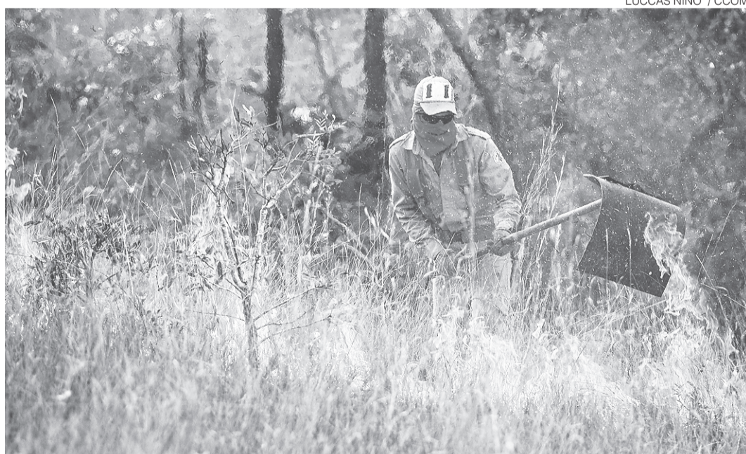
// Segundo Corpo de Bombeiros, 80% dos casos são provocados por ação humana

Em 2014 foram registrados, entre outros, 288 incên-