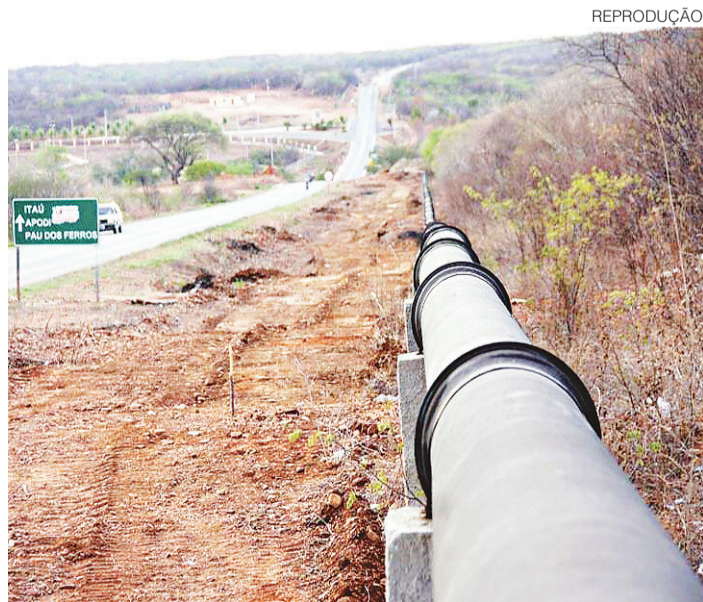
// Adutora do Alto Oeste: responsável pelo abastecimento de 11 cidades

O incidente acabou por afetar o abastecimento das cidades de Paustinhos, São Francisco do Oeste, Rodolfo Fernandes e Severiano Melo.