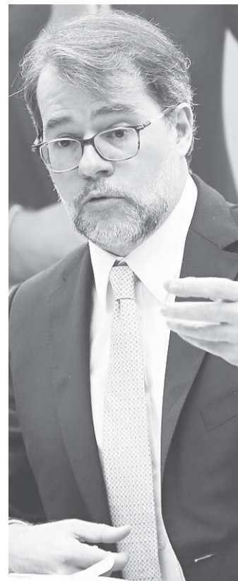
// Dias Tófoli, do TSE confirma excesso de partidos no Brasil

Numa decisão sensata tomada anteriormente, o Supremo Tribunal Federal entendeu que o mandato pertence ao partido e não ao candida-