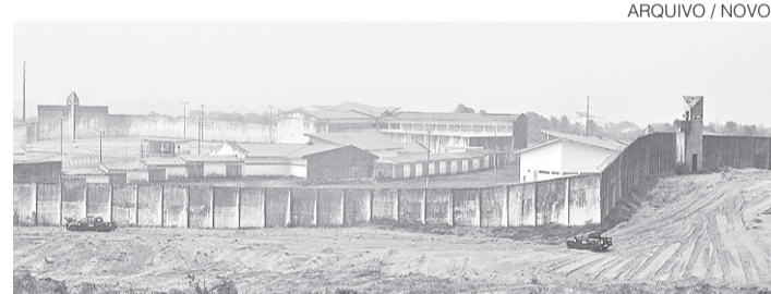
// Quadro de agentes do RN tem déficit aproximado de 500 servidores

Foram necessários nove homens do Corpo de Bombeiros para debelar o incêndio, que não chegou a atingir a edificação de transferência de ônibus localizada na marginal da rodovia federal.