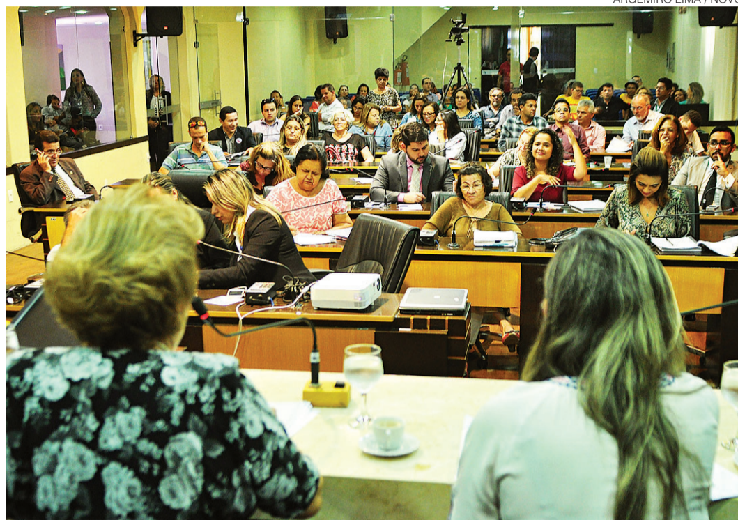
// Câmara Municipal de Natal realizou ontem audiência pública sobre o Plano Municipal de Educação

Entre as demandas abordadas pelo plano municipal, estão pontos a respeito da universalização da educação infantil, garantindo vagas para crianças de 4 e 5 anos na rede pública de ensino já em 2016, além da valorização do profissional e da implementação da educação integral, até 2024.