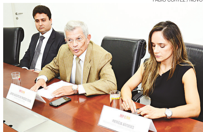
// MP representou contra policiais no início de outubro, após operação