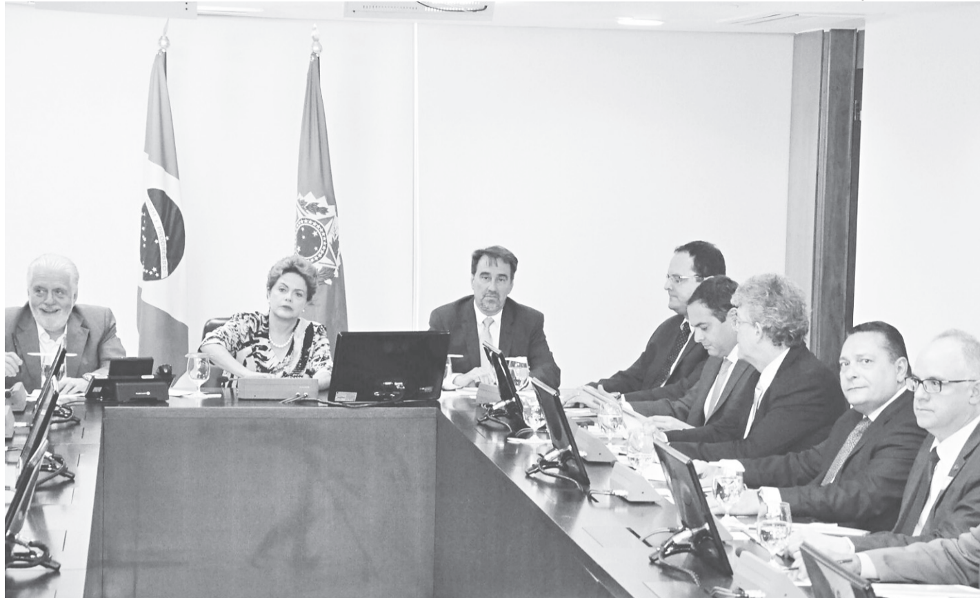
// Pacote da presidente Dilma contempla projetos para adutora de montagem rápida e aquisição de dessalinizadores