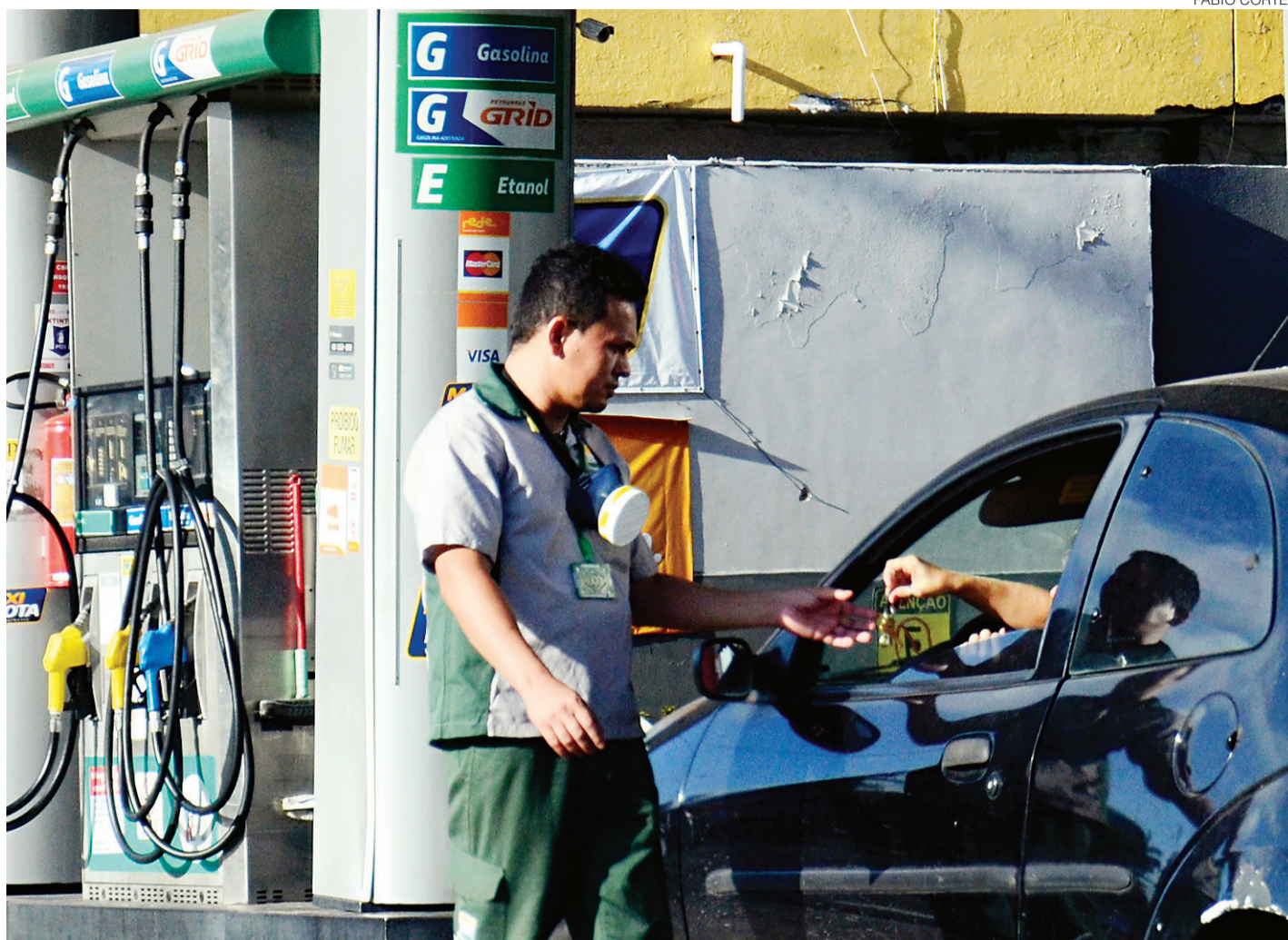
//IBGE aponta que aumento da gasolina nas bombas acumula 6,48% entre outubro e novembro

"O consumidor passou a pagar 4,70% a mais pelo litro da gasolina, que exerceu impacto de 0,18 p.p. [ponto percentual] no índice, enquanto o etanol, que ficou 12,53% mais caro, exerceu 0,11 p.p. O aumento da gasolina nas bombas, que acumula 6,48% nos meses de outubro e novembro, foi consequência dos 6% praticados ao nível das refinarias, reajuste em vigor desde o