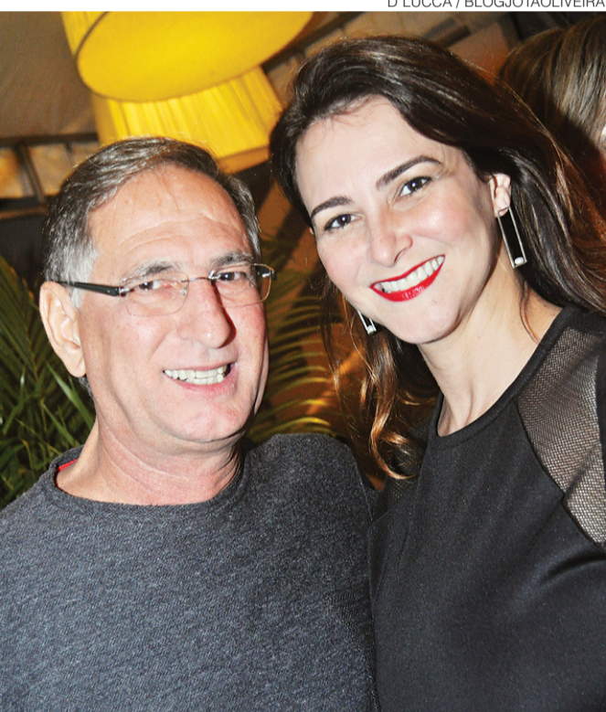
D'LUCCA / BLOGJOTAOLIVEIRA