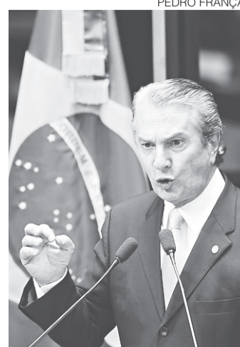
// Laudo afirma que senador tem gastos incompatíveis

também aponta um "montante expressivo" de empréstimos contraídos pelo senador junto à TV Gazeta de Alagoas no período analisado que ajudaram o petebista a justificar seu crescimento patrimonial. "Se não tivesse o empréstimo, o crescimento patrimonial seria incompatível. Há indícios de empréstimos fictícios", concluíram os policiais. Os peritos também consideraram "desproporcional" o fato de Collor ter apenas 12,28% da TV para contrair os empréstimos milionários.