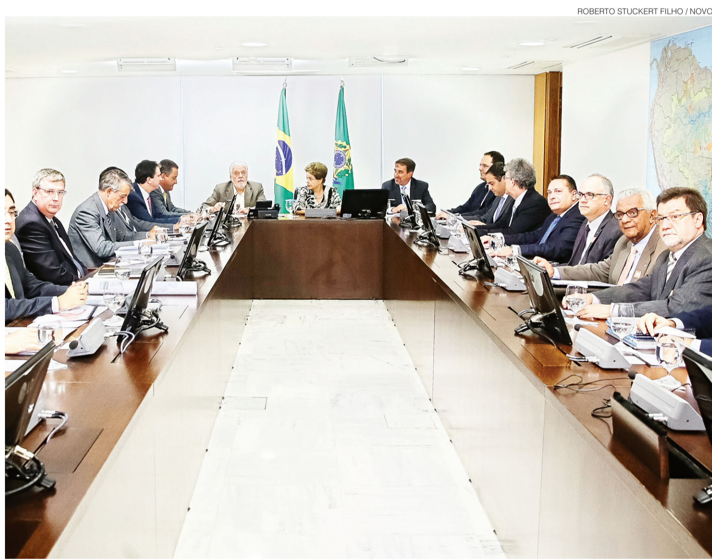
ROBERTO STUCKERT FILHO / NOVO

Produto Interno Bruto no Rio Grande do Norte chega a R$ 51,4 bilhões em 2013 e setor público continua tendo uma grande participação na economia, representando aproximadamente um quarto do que é produzido no estado Economia#7