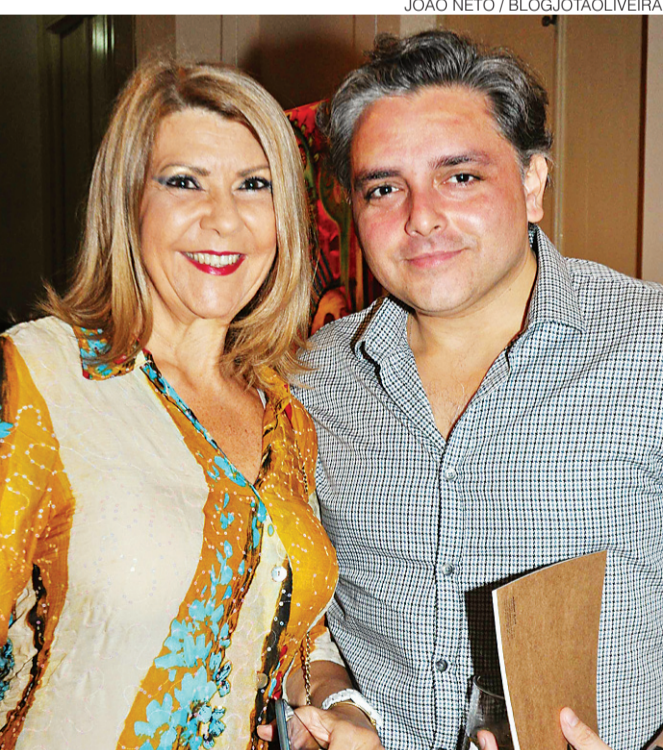
JOÃO NETO / BLOGJOTAOLIVEIRA