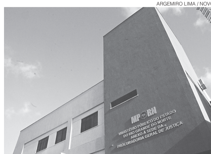
// Para o MPE, a atuação das Procuradorias têm sido ilegítima

Na petição, o MP menciona o pleito semelhante impetrado pela Assembleia Legislativa no mês passado que foi indeferido pelo desembargador Ibanez Monteiro no Mandado de Segurança nº 2015.013812-3, consignando que não cabe às Procuradorias se manifestar em defesa dos deputados, mas aquele parlamentar que