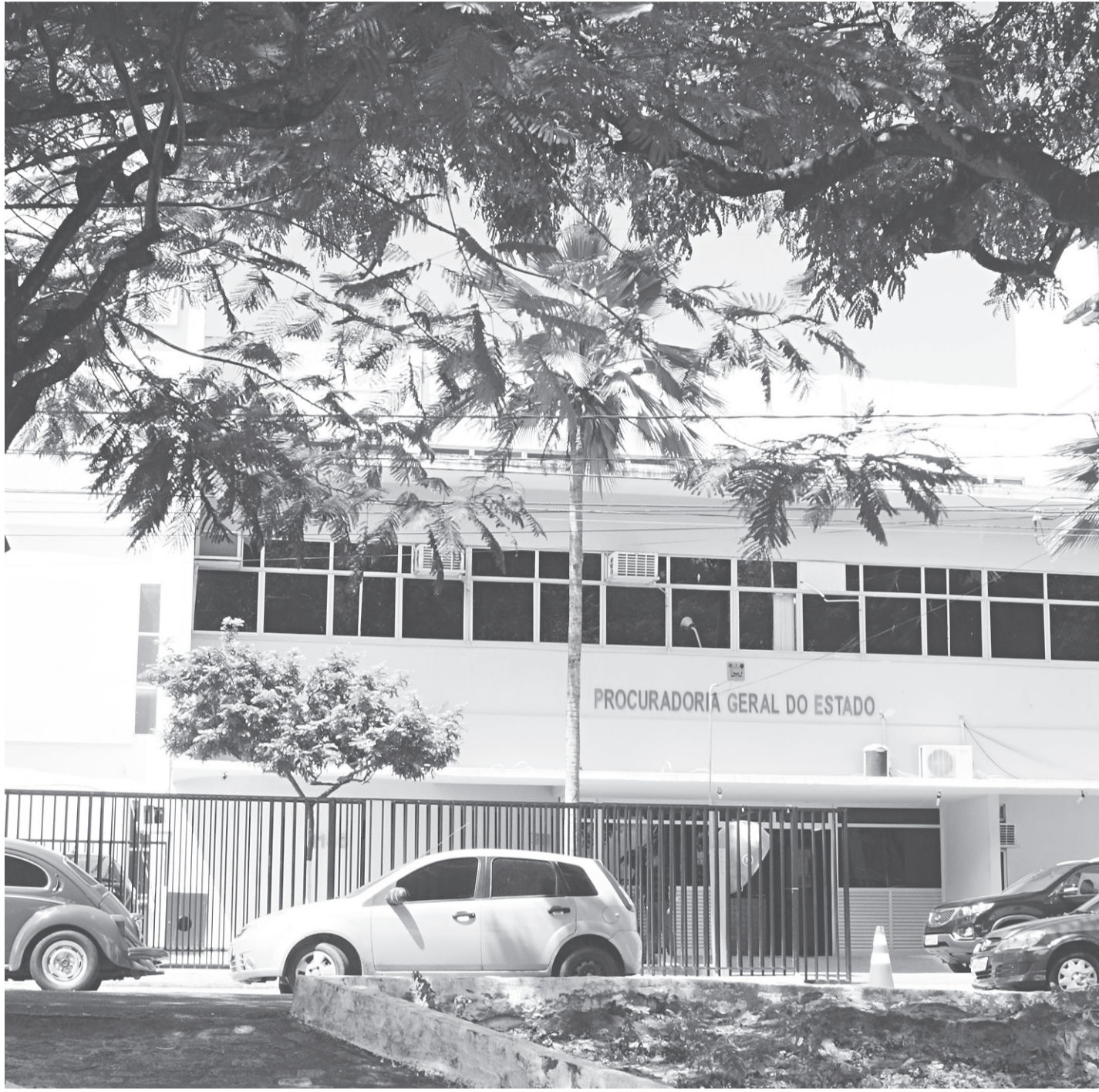
// A Procuradoria do Estado se pronunciou esclarecendo as razões de estar atuando com a reclamação que fez o TJ suspender as investigações

Os procuradores ingressaram com uma ação no Tribunal de Justiça alegando que as investigações da Operação Dama de Espadas, que investiga o desvio de mais de R$ 5 milhões por servidores da casa, estariam atingindo o foro privilegiado dos deputados, que não podem ser investigados por promotores, mas sim, pelo Procurador-Geral de Justiça, autorizado pelo Tribunal de Justiça e não pelo juízo da 1ª instância. O desembargador Cornélio Alves acatou o pleito e suspendeu por 30 dias as investigações. O presidente da Associação Nacional de Procuradores