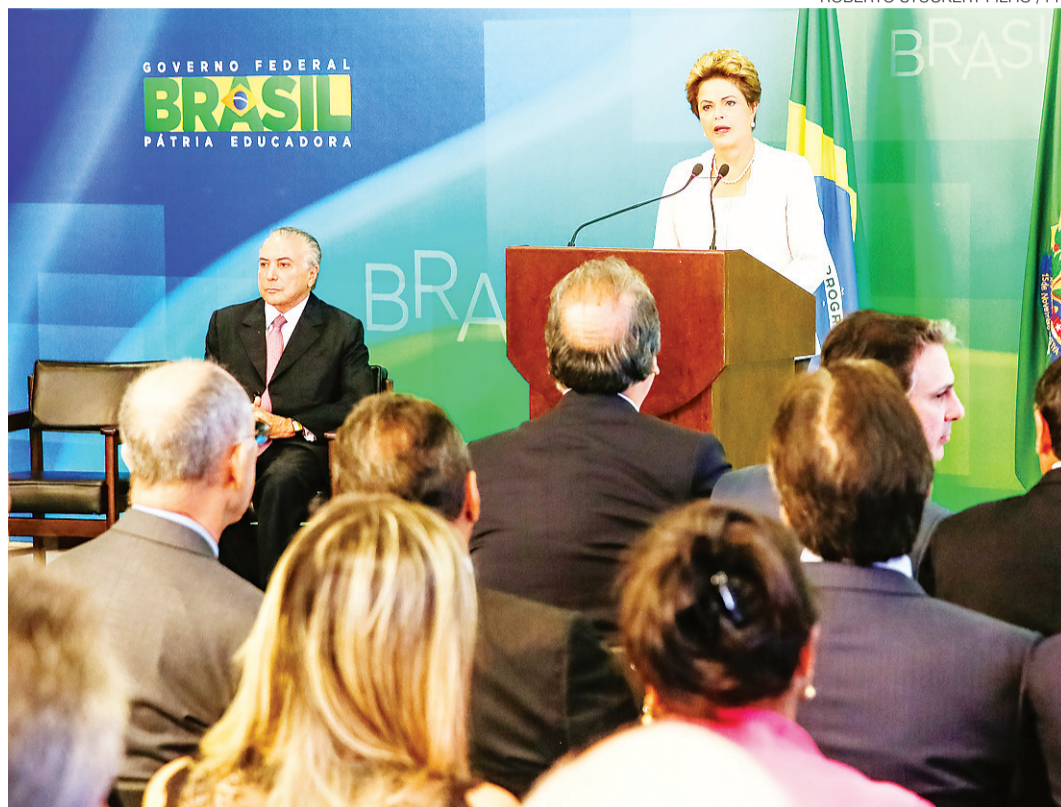
// Dilma Rousseff disse que serão estabelecidas metas de eficiência no uso de energia e água

A Secretaria-Geral da Presidência foi extinta e em seu lugar foi criada a Secretaria de Governo, sob o comando do PT. O novo órgão vai reu-