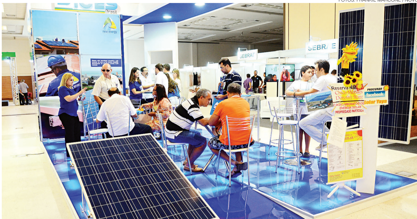
// Feira de Negócios de Energias Renováveis e Sustentabilidade Ambiental do RN continua hoje no Centro de Convenções de Natal