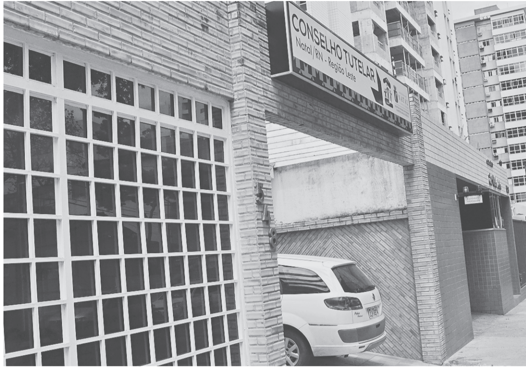
Fachada do Conselho Tutelar da Zona Leste de Natal: renovação de mandato neste domingo