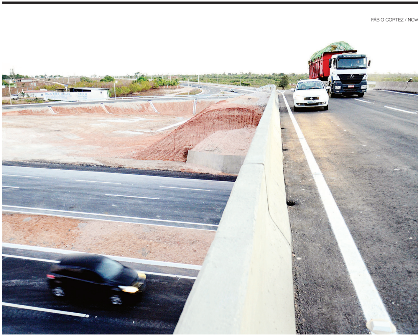
FÁBIO CORTEZ / NOVO

Terceira ponte de Natal é confirmada pelo governador Robinson Faria na Zona Oeste da cidade, com orçamento estimado em R$ 50 milhões. A obra será bancada pelo RN Sustentável, que conta com recursos do Banco Mundial. Política #3