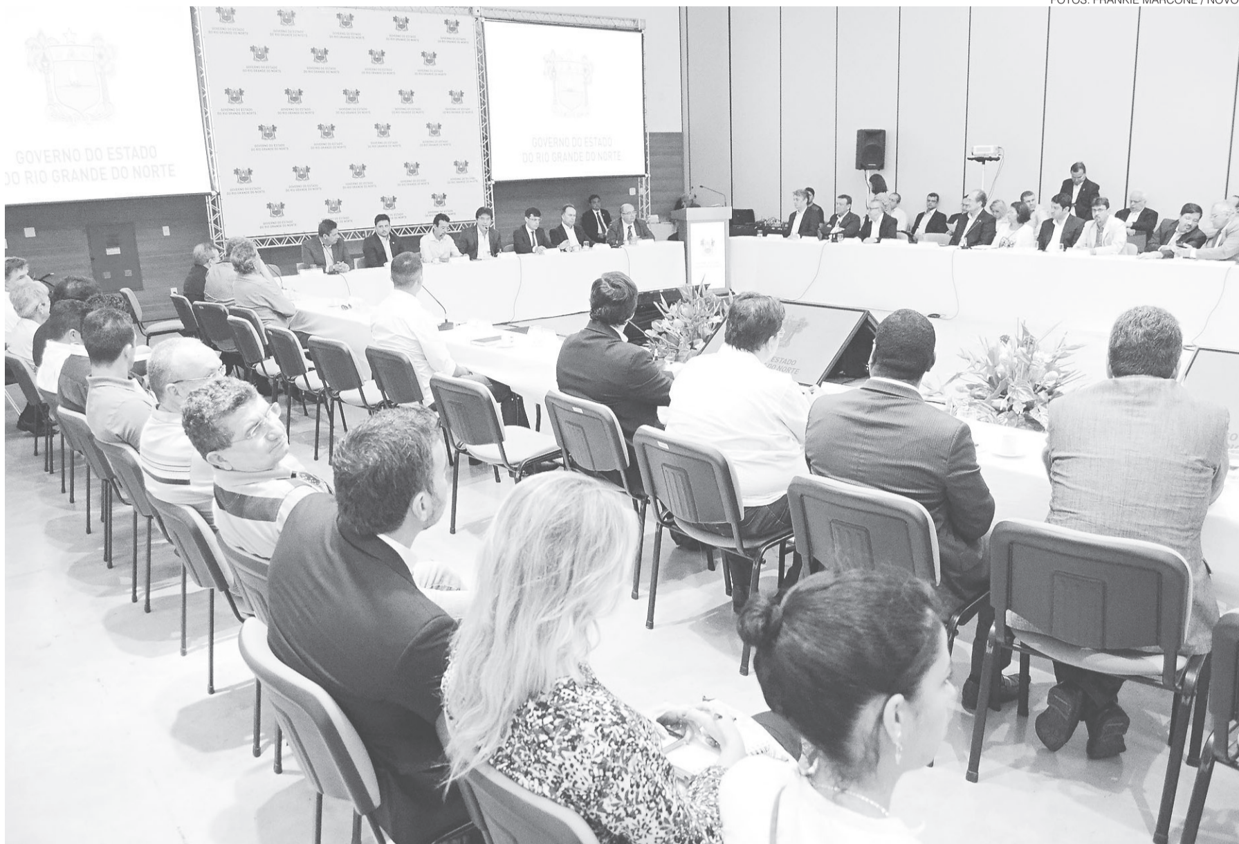
// Reunião do Conselho Metropolitano, com a presença de prefeitos e representantes dos municípios da região, foi realizada na Escola de Governo, no Centro Administrativo

O antigo projeto, que também havia sido anunciado pelo governador, chegou a três valores diferentes: R$ 1,3 bilhão; R$ 1 bilhão; R$ 900 milhões. Robinson Faria também explicou que o projeto era caro porque a ponte seria muito alta para a passagem dos navios da Marinha, na altura do Viaduto do Baldo, na