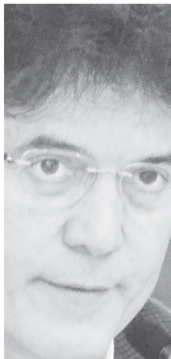
// Robinson Faria, governador: custo menor viabiliza a obra

“Hoje eu anunciei a perspectiva real da terceira pon-