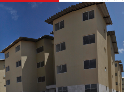
Minha Casa Minha Vida virou dúvida