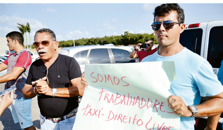
► Motoristas alegam que a prática prejudica a relação com os clientes

Os taxistas não descartam novas manifestações caso o acordo seja descumprido pelas autoridades. Para tanto, eles aguardam pela reunião no fim desta semana e a assinatura da portaria.