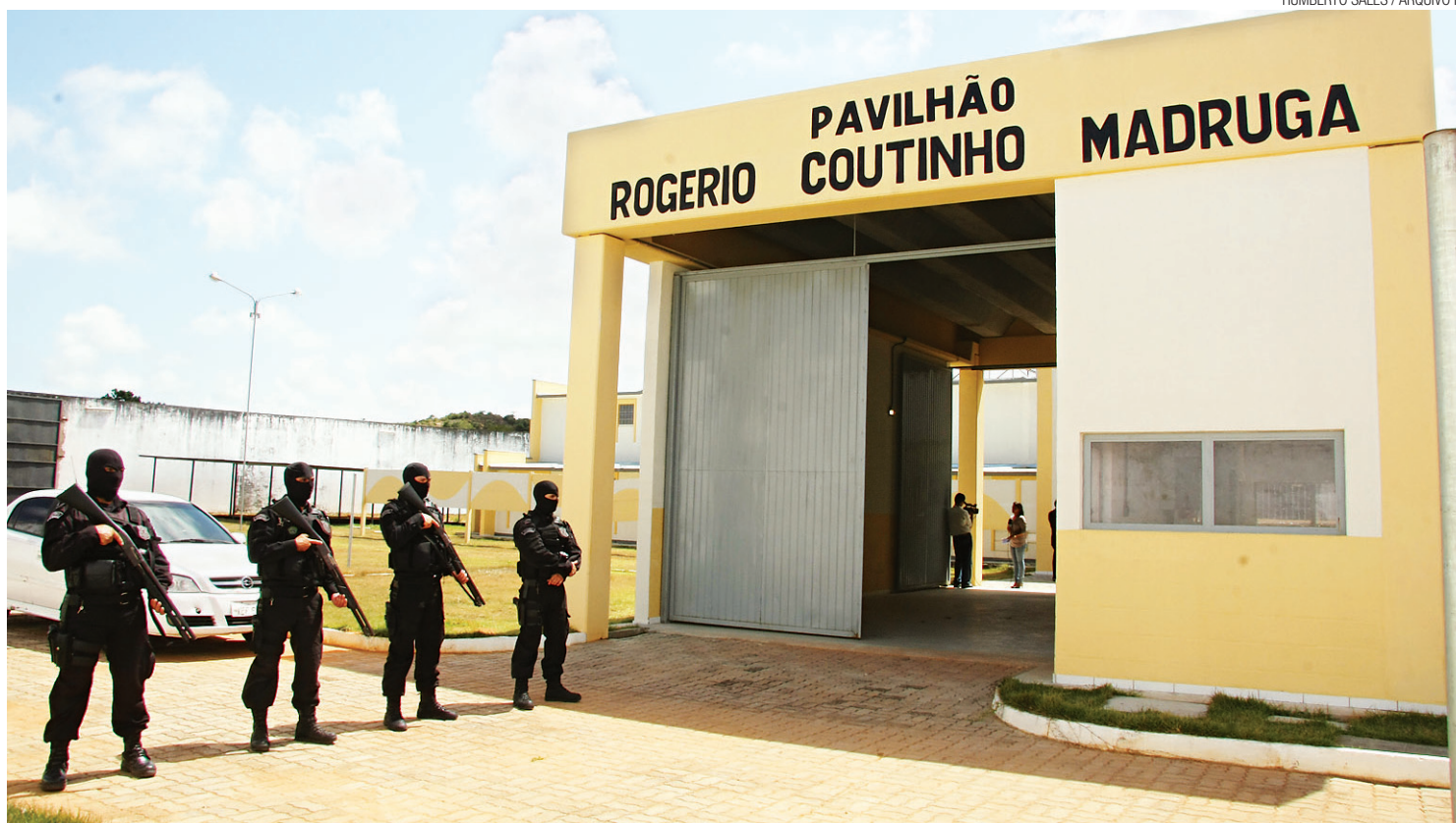
▶ Detentos do pavilhão 5" da Penitenciária Estadual de Alcaçuz são os supostos autores da carta dirigida à direção do presídio

A carta escrita pelos presidiários aponta "urgência" nos pedidos e dá uma semana para resposta por parte da Sejuc. "Vinhemos reivindicar da melhor forma possível a melhoria da unidade carcerária e caso esta petição não for atendida na forma que estamos reivindicando, iremos faser aconecer da