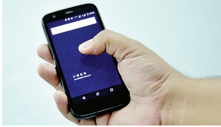
▶ UBER é serviço que conecta passageiros a motoristas particulares

sa a vigorar a partir da data de publicação.