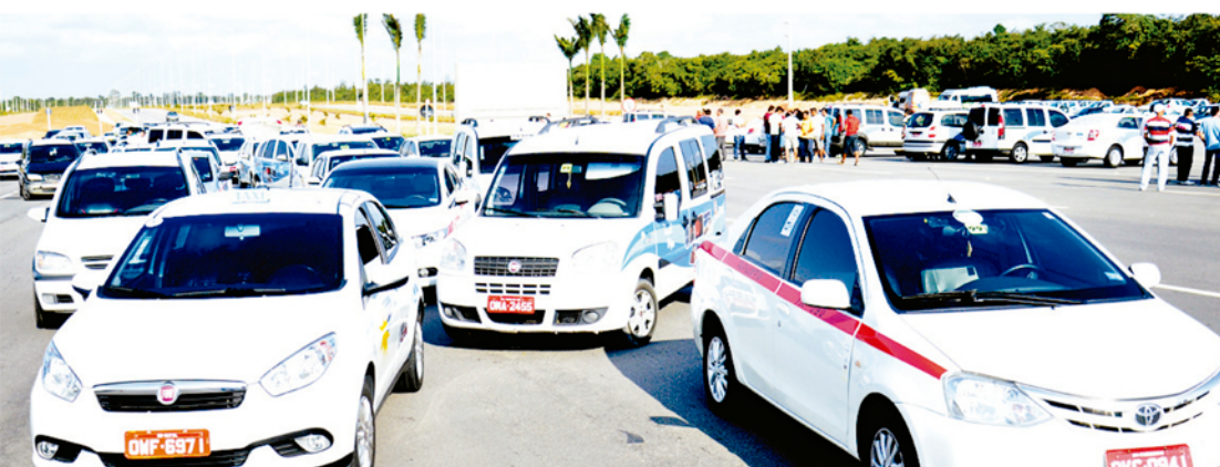
► Cerca de 100 profissionais que operam na capital e nos municípios de Parnamirim, Extremoz e Tibau do Sul participaram do ato, obstruindo cancelas limitando o acesso ao Aeroporto Internacional Aluizio Alves

/ PRAÇA / MOTORISTAS PROFISSIONAIS REIVINDICAM O DIREITO DE BUSCAR CLIENTES QUE DESEMBARCAM NO TERMINAL; NOVA REUNIÃO SEXTA-FEIRA VAI DEFINIR O ASSUNTO