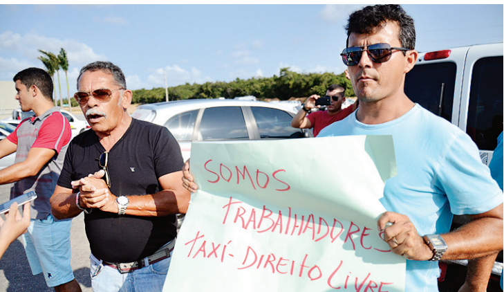
▶ Motoristas alegam que a prática prejudica a relação com os clientes

Os taxistas não descartam novas manifestações caso o acordo seja descumprido pelas autoridades. Para tanto, eles aguardam pela reunião no fim desta semana e a assinatura da portaria.