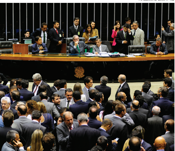
Por 285 votos, financiamento privado está mantido