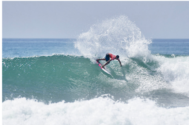
▶ Ítalo Ferreira manobrando forte, ontem, em Trestles, na Califórnia

Líder do ranking, Adriano de Souza surfou com consistência e fez valer o seu "power surf" - estilo baseado na força de manobras - para estreiar com vitória. O taitiano Michel Bourez e o local Ian Crane, convidado em Trestles,