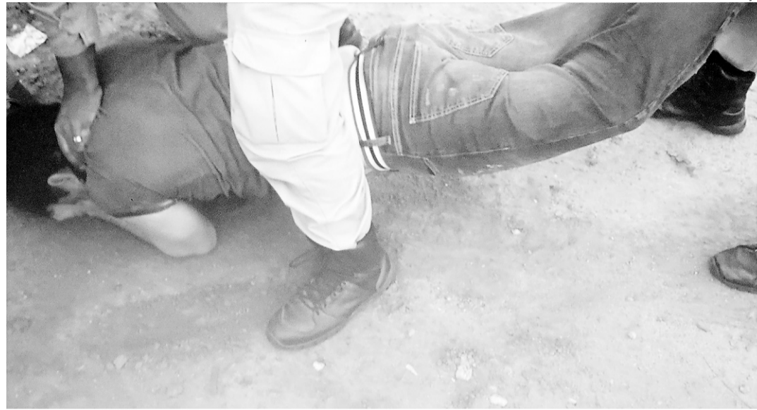
Policiais rodoviários federais imobilizaram e algemaram deputado, no chão