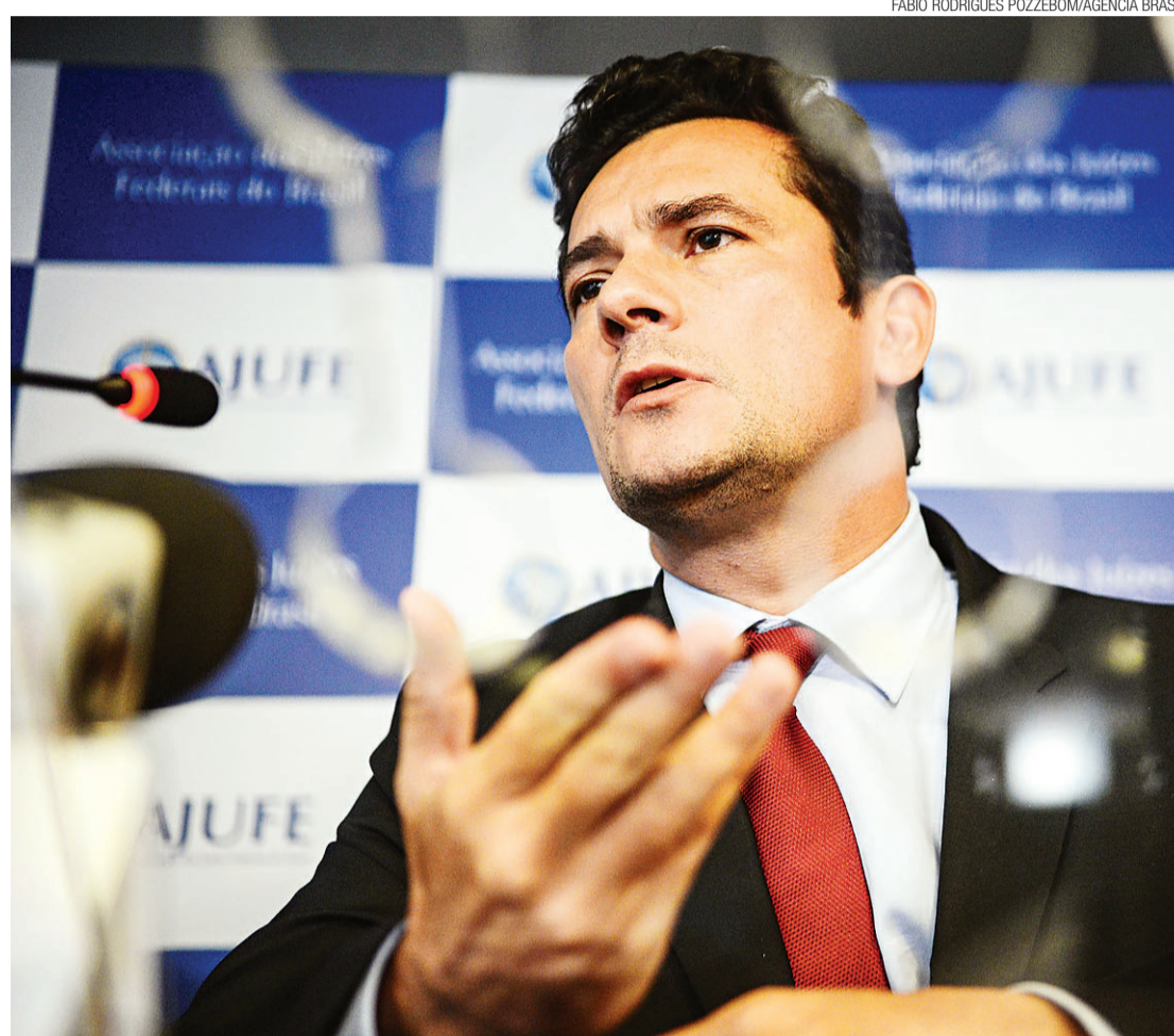
► Sérgio Moro diz na sentença que lavagem de dinheiro teve origem no crime de cartel e no ajuste de licitações

Os dois empresários não são investigados, mas as duas empresas foram citadas em depoimento do doleiro Alberto Youssef. A Mitsui e a Samsung são acusadas de pagamento de propina para favorecimento em seus negócios.