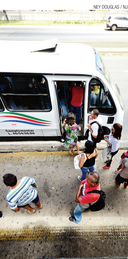
► Veículos passarão a ter padrão

APROVADOS DA PM AINDA ESPERAM PAGAMENTO DE BOLSA