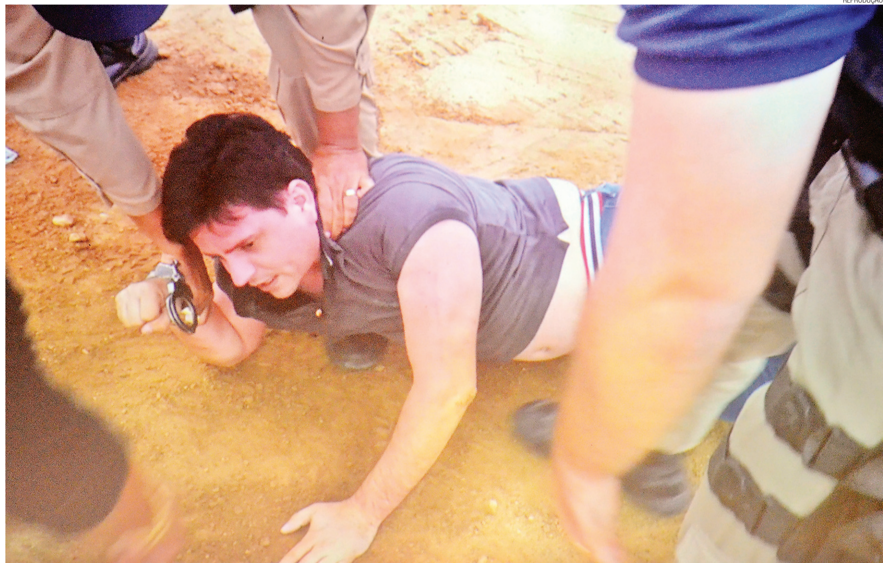
► Deputado apresentou vídeo no plenário da Assembleia, mostrando como foi a abordagem dos policiais rodoviários federais que resultou na sua prisão, o que considera uma agressão