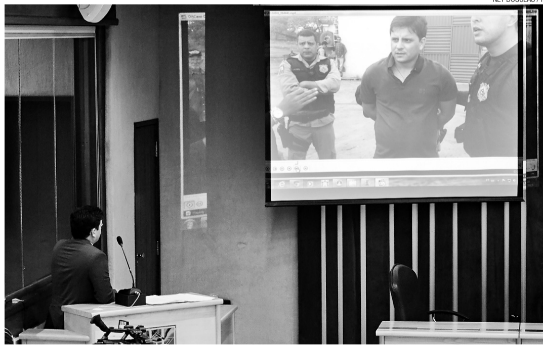
Parlamentar expôs vídeo como prova a seu favor e recebeu apoio dos demais deputados