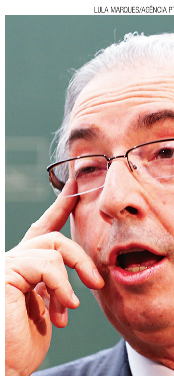
► Eduardo Cunha, alvo de rumores

"Alguns [pedidos] podem ser arquivados ainda hoje porque não cumpriram requisitos. Outros vão para análise técnica e todos os procedimentos serão de acordo com a Constituição e o Regimento Interno desta Casa. Não há qualquer questão política do presidente da Câmara com qualquer partido ou quem quer que seja", reforçou.