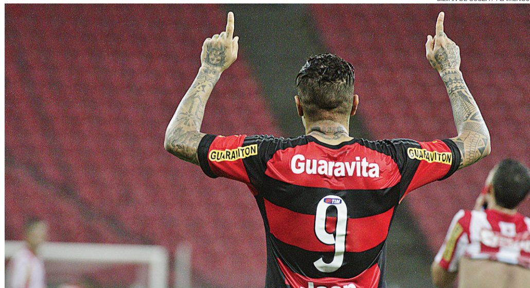
► Principal estrela do time, Guerrero, estará atuando pela seleção peruana e não vem