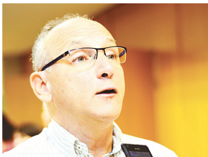
▶ Giovanini Coelho, coordenador geral do Programa Nacional de Controle da Dengue

O Observatório da Dengue, em Natal, é um dos aspectos importantes desenvolvidos no Brasil para a definição das áreas quentes, destacou o coordenador do Ministério da Saúde. É uma ferramenta de informações on line que ainda está em