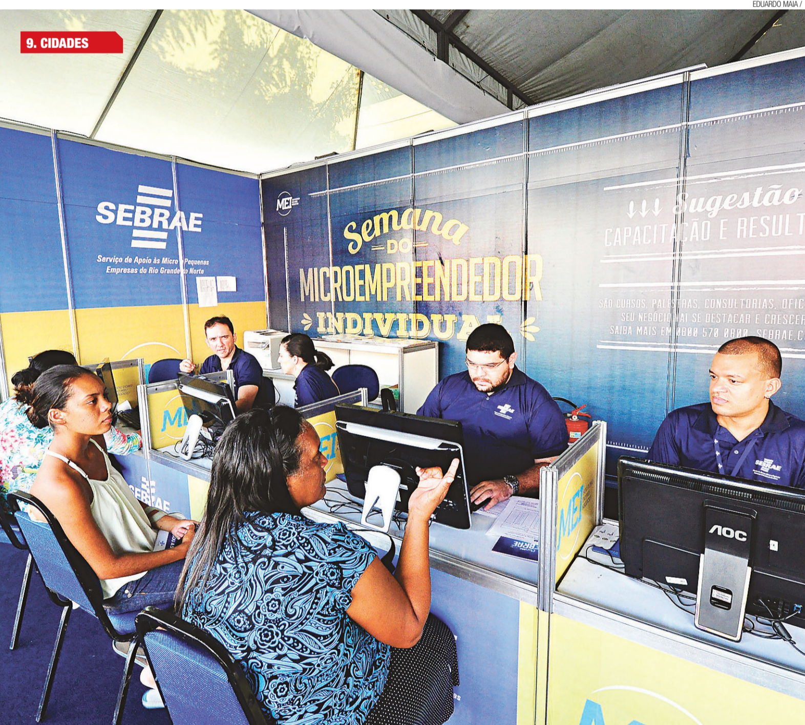
Sebrae promove atualmente Semana do Microempreendedor Individual, com stand montado na praça Gentil Ferreira para atender à população

Feira do Empreendedor 2014 promovida pelo Sebrae no RN é eleita a melhor do Brasil