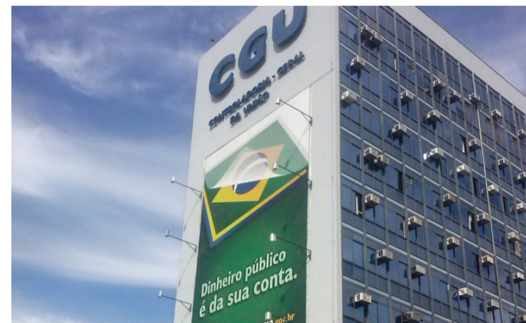
► A CGU auditou 259 órgãos e verificou 330 mil inconsistências

/ DINHEIRO PÚBLICO / A CONTROLADORIA GERAL DA UNIÃO (CGU) VAI GERAR UMA ECONOMIA DE R$ 1,2 BILHÃO AO ERÁRIO APÓS SUSPENDER PAGAMENTOS INDEVIDOS