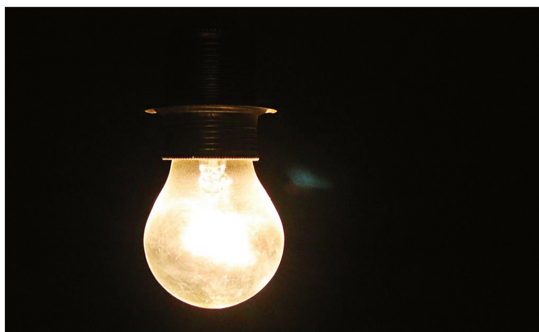
▶ Aumento, previsto em contrato entre a União e as distribuidoras, é acrescido do aumento de impostos

"Isso significa que, para uma conta de R$ 100,00, por exemplo, apenas R$ 23,50 ficam com a Cosern para operar e expandir todo o sistema elétrico no estado", exem-