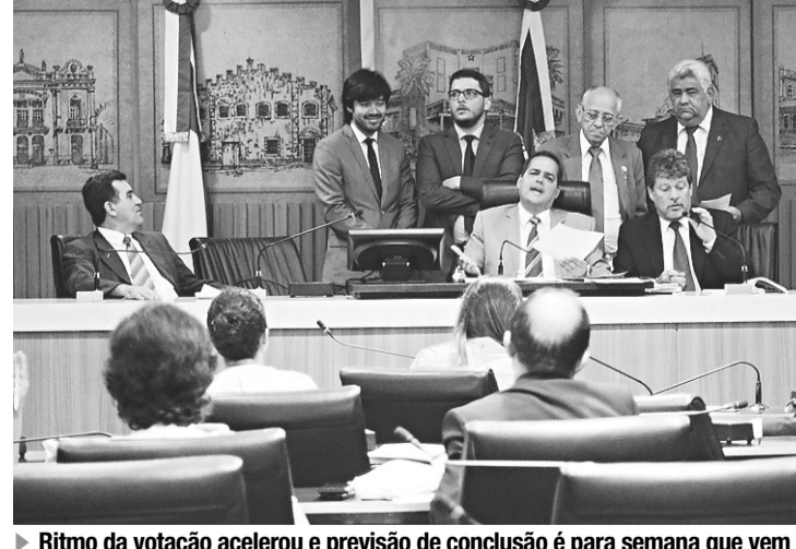
► Ritmo da votação acelerou e previsão de conclusão é para semana que vem

As emendas aprovadas também preveem a padronização das paradas de ônibus; acessibilidade em todos os veículos para pessoas com necessidades especiais ou limitações, começando com 20% da frota e 100% no prazo de um