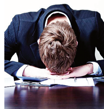
▶ Economia em retrocesso

A previsão para o crescimento global não sofreu alterações e está fixada em 3,5% para 2015 e 3,8% para 2016. Os números sobre pers-