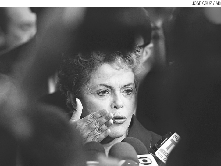
▶ Relação de Dilma Rousseff com o Congresso está estremeçada

Ele também faz críticas ao atual sistema político brasileiro. É favorável a uma ampla reforma eleitoral. "Eu sou favorável à redução dos custos de campanha", diz. No entanto, a mudança mais profunda seria a adoção do chamado mecanismo "voto distritão", no qual seriam eleitos os candidatos mais votados, independentemente do desempenho de seus partidos.