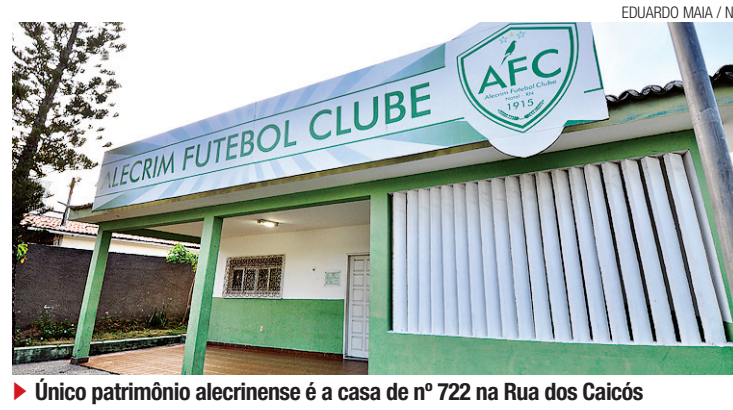
Único patrimônio alecrinense é a casa de nº 722 na Rua dos Caicós

O terreno que servia para a diversão dos sócios e como centro de treinamento foi sendo vendido e sequestrado para o pagamento de ex-jogadores e funcionários que cobravam na Justiça do Trabalho os salários atrasados e pagamentos dos depósitos do Fundo de Garantia do Tempo de Serviço (FGTS). Desde meados de 2005 que o clube não detém sequer um metro quadrado do terreno na Região Metropolitana de Natal.