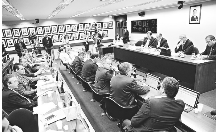
▶ Comissão da reforma política debaterá eleições municipais

O relator da comissão, deputado Marcelo Castro (PMDB-PI), informa que, após esses encontros, os parlamentares realizarão quatro reuniões internas, sem convidados de fora da Câmara,