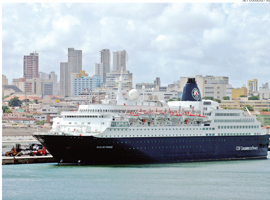
▶ Além da pouca quantidade de cruzeiros, setores de serviços do terminal ainda estão sem funcionamento

o assunto, a Codern lembra que já promoveu diversas reuniões e até uma solenidade oficial – em julho último – para apresentar a estrutura do TMP ao trade turístico e ao empresariado do Rio Grande do Norte. À época, a entrega do terminal deixou esperançosos os representantes das categorias, que vislumbraram no mercado de cruzeiros marítimos um novo e atraente produto, com potencial para acelerar o desenvolvimento econômico do Estado.