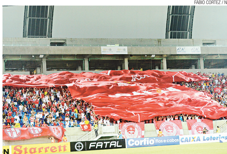
Com 14 pontos na tabela, América se estabelece na liderança

Fechando a rodada, às 18h30, líder e lanterna se enfrentam na Arena das Dunas, no duelo que pode deixar o América com uma mão no troféu do primeiro turno