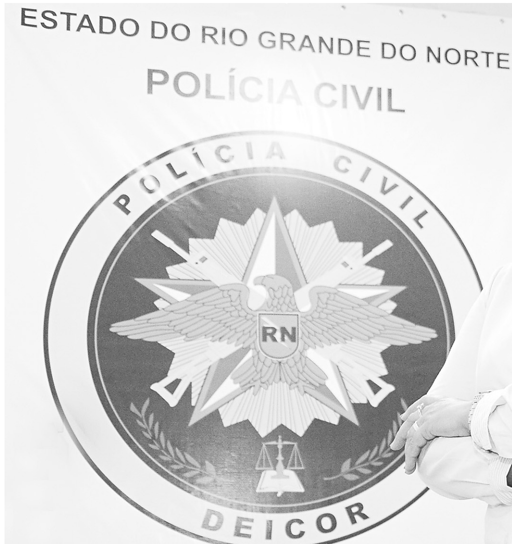
► Sheila Freitas, integrante do pequeno batalhão de 34 delegadas da Polícia Civil do RN, destacou-se na solução de casos envolvendo seqüestros