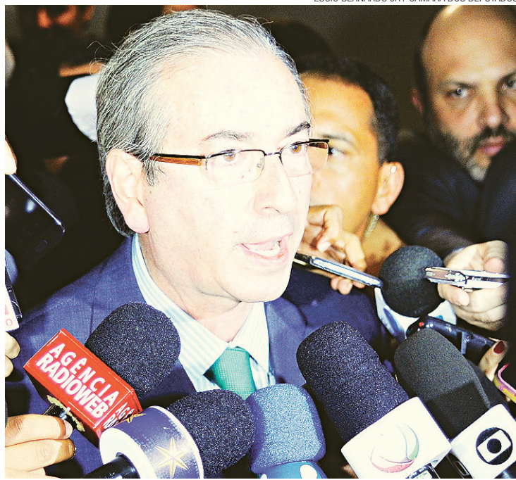
► Eduardo Cunha, presidente da Câmara dos Deputados: “Sócio na lama”

Cunha também divulgou uma nota oficial sobre a menção de seu nome na lista de Janot, com o título “Quem não deve, não teme”. No texto ele desmente as suspeitas. “Óbvio que desminto todas as afirmações do procurador Ge-