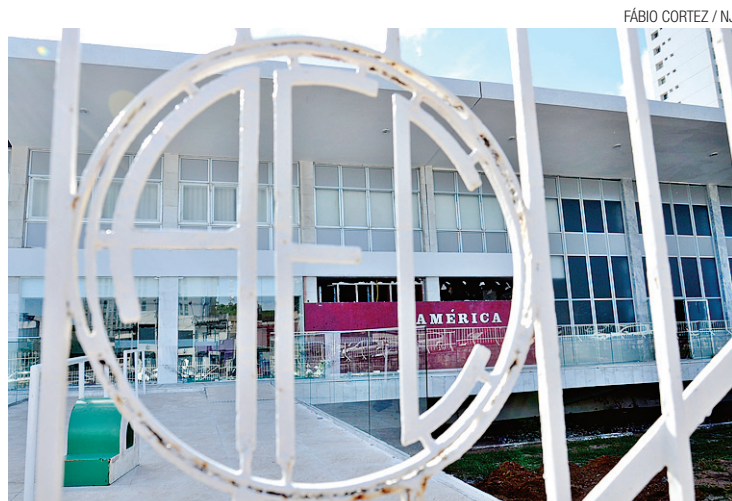
Principal espaço de eventos da cidade durante anos, sede social do América está reduzida à metade de seu tamanho original após permutas com construtoras