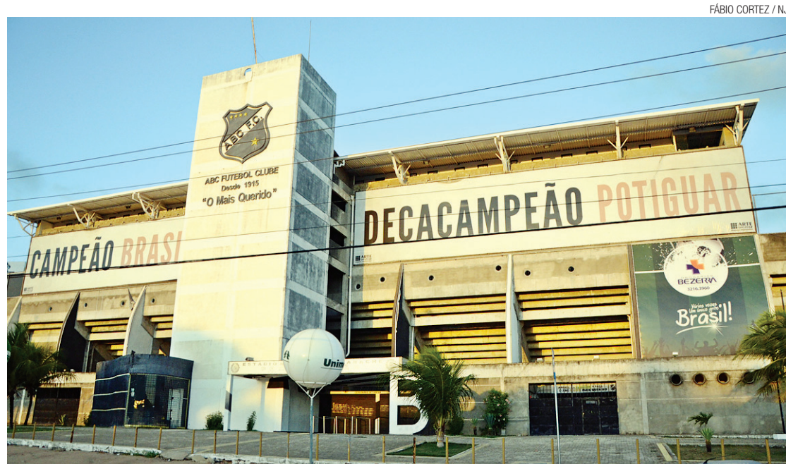
Inaugurado em 2006, estádio Frasqueirão é o maior patrimônio abecedista