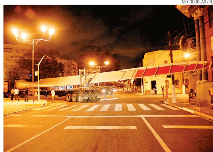
▶ Transporte de cargas na Ribeira enfrenta dificuldades

“A falta é de um acesso ao porto. Nosso Porto não tem acesso separado da via urbana. Um trecho