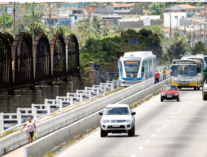
► VLT, promessa de melhoria no transporte de passageiros