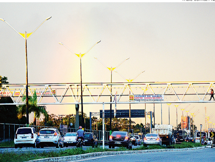
► Integração entre rodovias e linhas ferroviárias tem de ser estabelecida