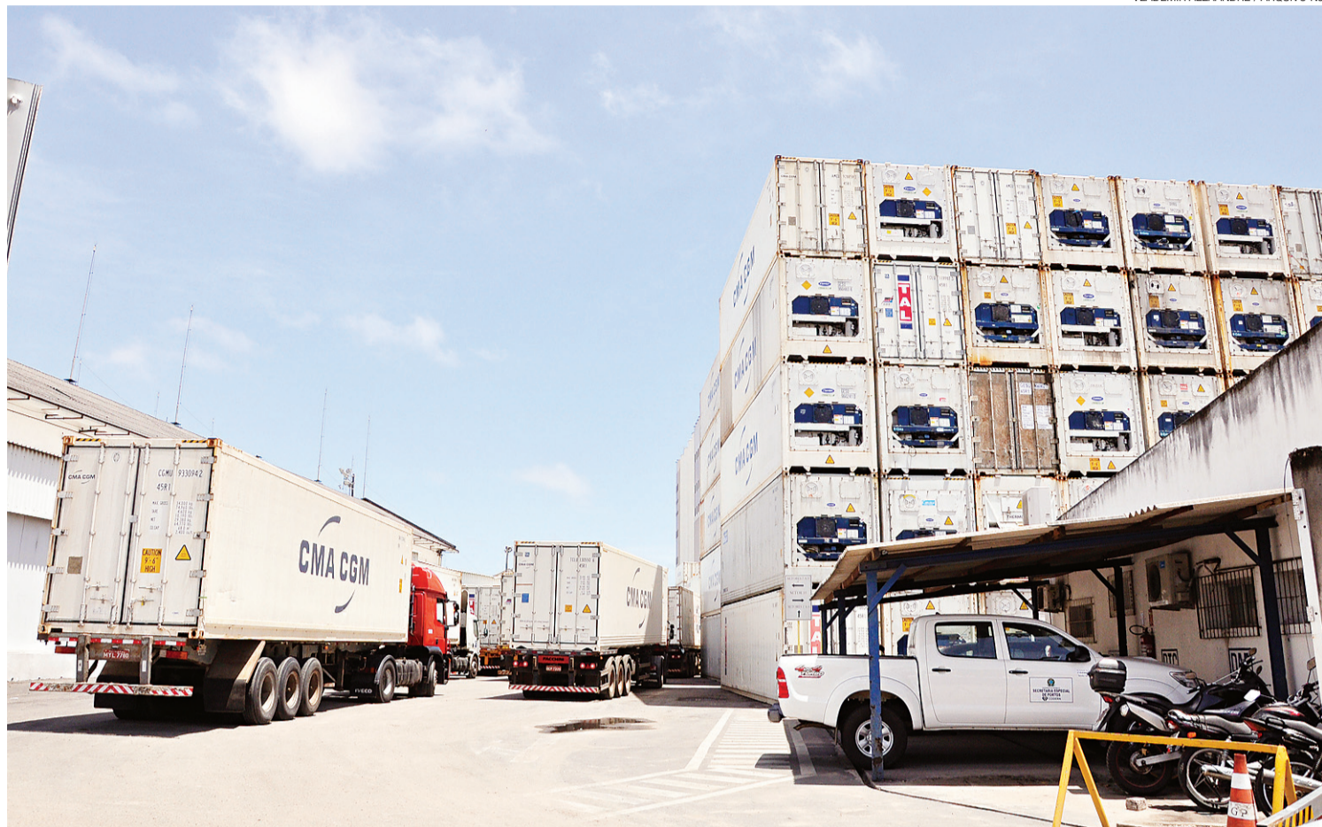
▶ Porto de Natal, estrangulado pela falta de espaço no seu entorno, poderia tirar proveito das linhas ferroviárias próximas

A ferrovia Transnordestina integra a região do agronegócio brasileiro com dois dos principais portos do Nordeste ao Norte e a Leste, gerando novas oportunidades de negócios no interior do Ceará e de Pernambuco. O Rio Grande do Norte não se beneficia de imediato desse empreendimento, mas pode aproveitar as oportunidades geradas pela ferrovia. Considerando a duplicação da BR 101, integrando a economia potiguar com os outros Estados do Nordeste oriental, principalmente Pernambuco, os impactos econômicos da Transnordestina podem ir-