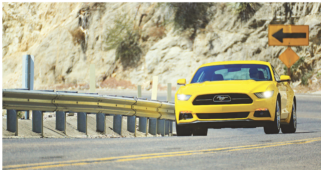
▶ Nova versão do Mustang é influenciada por esportivos europeus

Num percurso de 80 quilômetros, o Mustang EcoBoost deixou a certeza de ser o carro certo para quem está mais interessado no status de dirigir um ícone americano