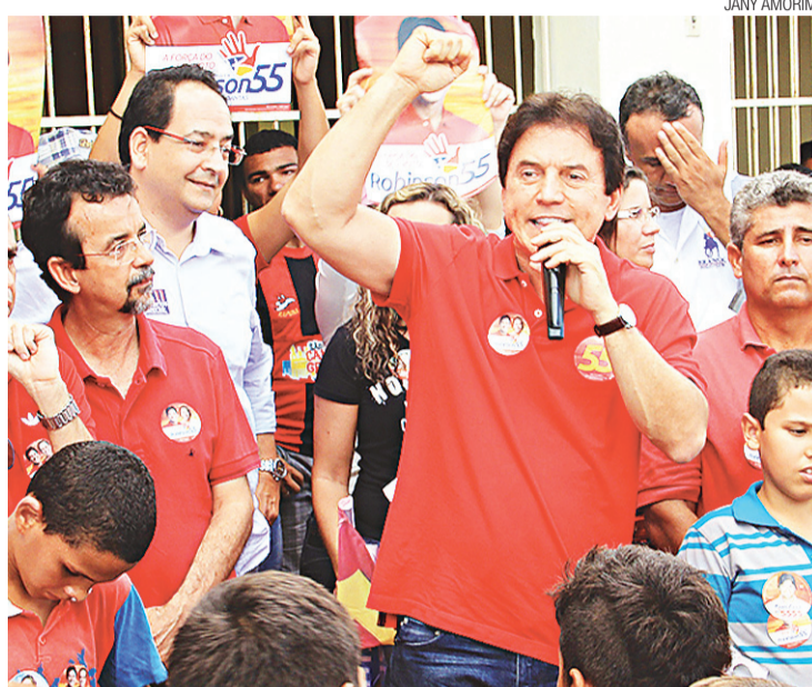
► Robinson Faria também participará de caravana, com concentração na ZN

Já Robinson Faria votará às 10h na Escola Doméstica, em Natal, ao lado da família, da senadora eleita Fátima Bezerra (PT) e do candidato a vice-governador Fábio Dantas (PCdoB). Após a votação, ele irá percorrer colégios eleitorais da capital e do interior do Rio Grande do Norte e acompanhará a apuração dos votos em casa, ao lado de familiares e correligionários.