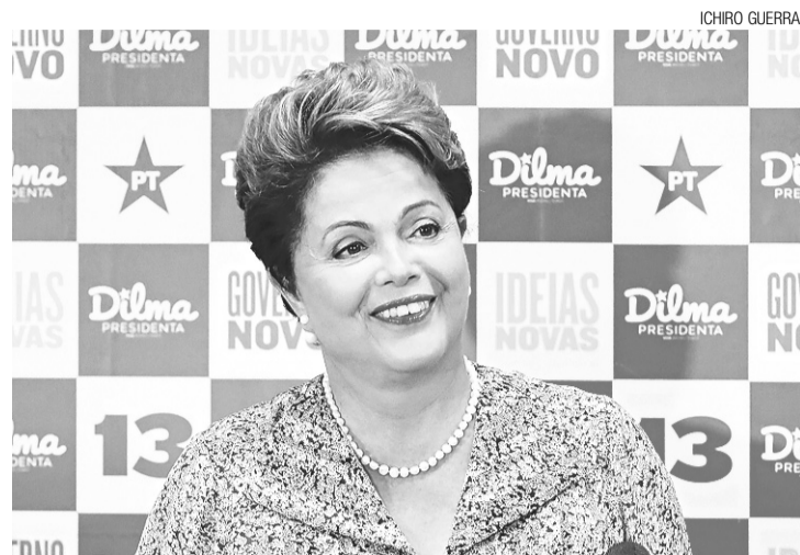
▶ Dilma Rousseff demonstrou indignação com relação à revista Veja

A fala de Dilma foi precedida pela narração de um apresentador que mostrou uma série de capas que a “Veja” publicou com reportagens contra o PT em eleições anteriores. A capa da edição desta sexta, porém, não foi exibida no programa. Segundo a presidente, “todo mundo sabe da campanha sistemática que a revista move há anos”. “Com das outras vezes, [a revista] vai fracassar no seu intento criminoso. A Justiça