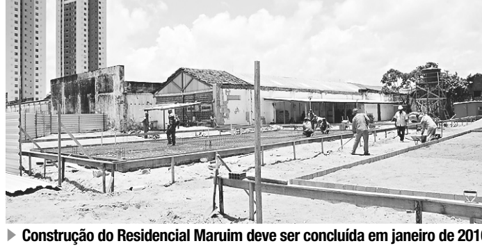
► Construção do Residencial Maruim deve ser concluída em janeiro de 2016