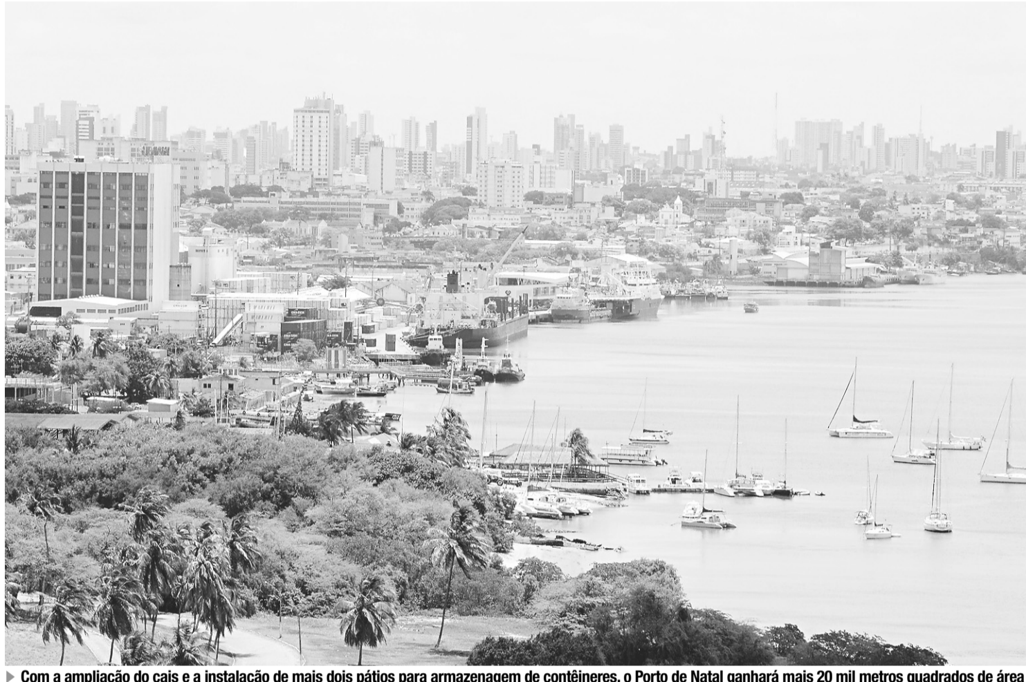
► Com a ampliação do cais e a instalação de mais dois pátios para armazenagem de contêineres, o Porto de Natal ganhará mais 20 mil metros quadrados de área

Segundo o último cronograma de atividades divulgado pela Codern, já sob a gestão atual, a carga