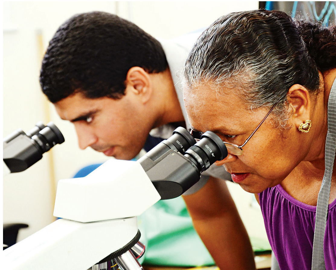
► Semana de Ciências, Tecnologia e Cultura da UFRN chegou à sua vigésima edição em 2014

O sistema, nascido e criado em terras potiguares, consiste em uma “central de comando”, ligada à rede doméstica de internet, que distribui as ordens dadas pelo proprietário através do celular, onde quer que ele esteja. Para tanto, o engenheiro e fundador da empresa Innuvati desenvolveu interruptores, maçanetas e até torneiras inteligentes, com sensores que