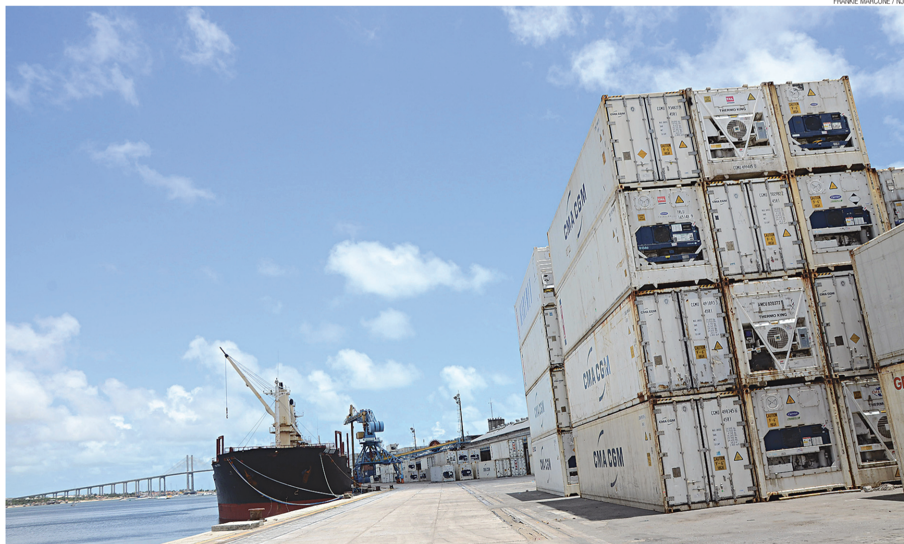
▶ Codem deve abrir processo licitatório para ampliação do Porto de Natal na próxima quinta-feira, incluindo instalação das defensas da ponte Newton Navarro: obras vão durar mais de dois anos