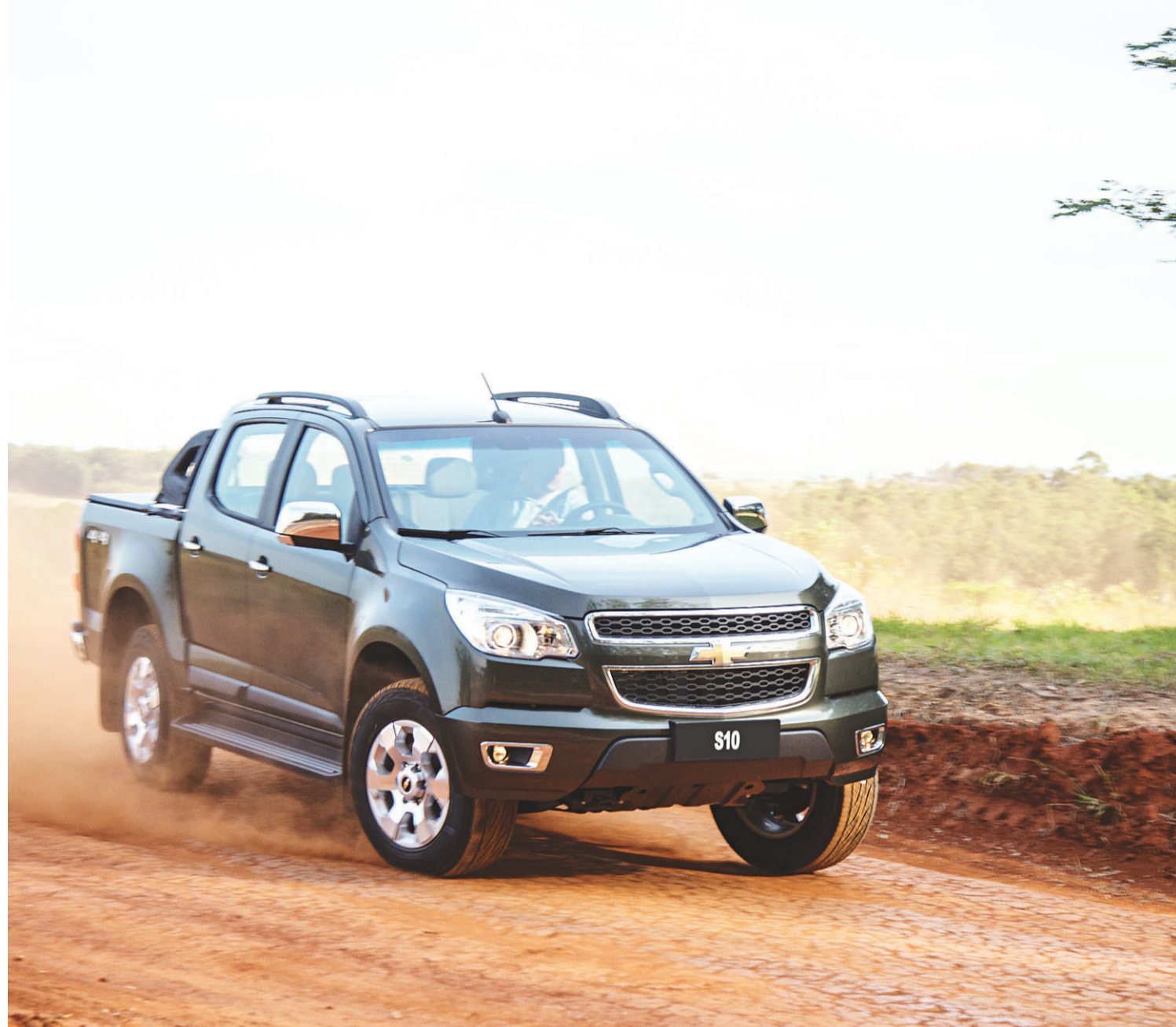
▶ Chevrolet modificou a suspensão e fez ajustes no interior, mas desenho da carroceria continua o mesmo

Elástico, o 2.5 não exige constantes trocas de marcha, o que acaba por se traduzir em comodidade. Ainda bem, pois o curso longo da alavanca nos engates exige um certo esforço. A nova suspensão garante mais estabilidade, especialmente com a caçamba vazia. É possível, por exemplo, ignorar algumas lombadas e buracos em trajetos urbanos. Vale ressaltar que, em nenhum momento, a S10 esconde sua vocação para o trabalho. Apesar dos mimos a bordo, continua sendo um carro rústico, que exige mais atenção do motorista. Se não teve novidades na aparência, as alterações devem garantir um fôlego extra para a picape continuar vendendo bem. Com motorização mais forte e eficiente, ela mantém seu maior trunfo: o apelo de um veículo capaz de encarar suas tarefas sem reclamações.