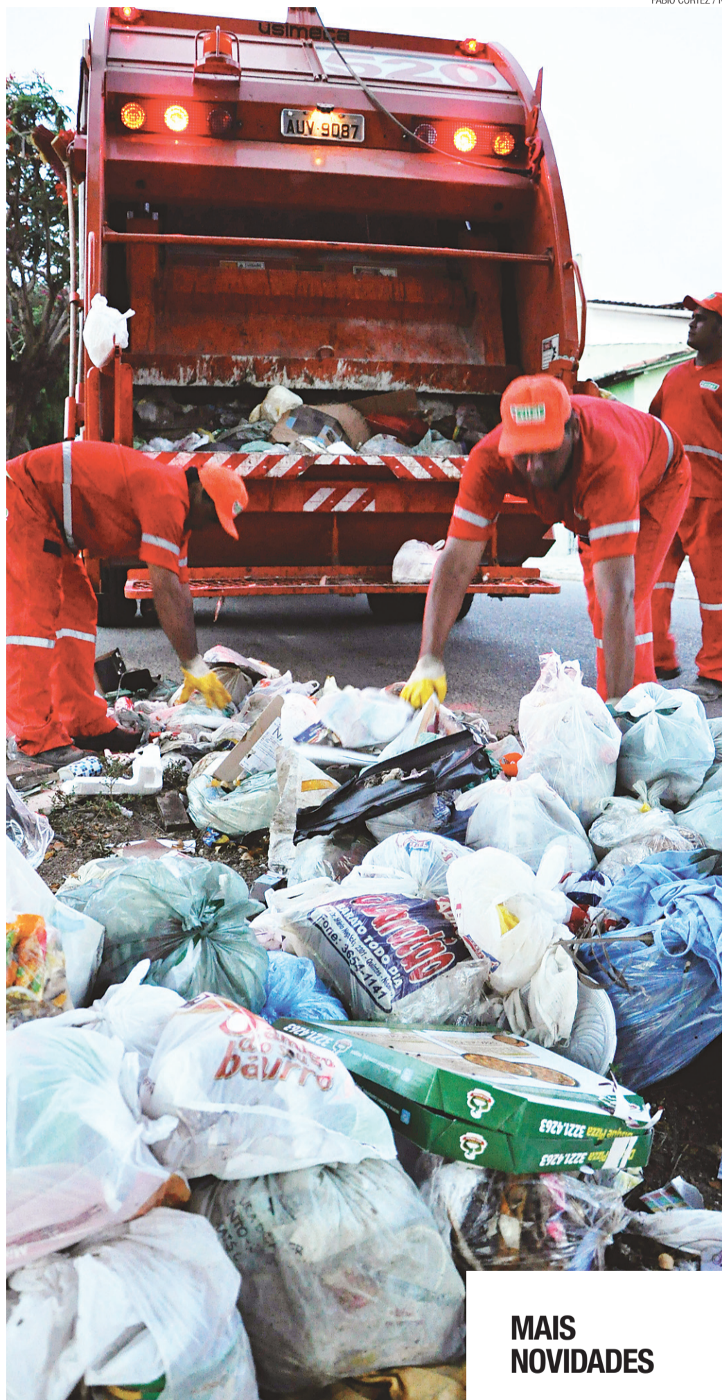
► Urbana recolhe hoje, por dia, 674 toneladas de lixo domiciliar

Serviços como caixas estacionárias que estavam em todos os lotes foram deslocados para o lote 2 de locação de equipamentos da Urbana. "Foi uma relocação para melhorar o serviço. Não houve mudança na execução, mas na gestão do contrato para facilitar a realização dos serviços".