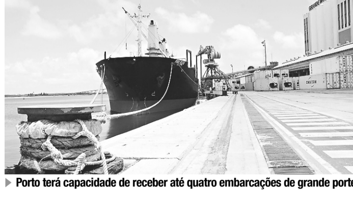
► Porto terá capacidade de receber até quatro embarcações de grande porte

Com o aumento da retroárea do Porto de Natal, a Codern deverá, além de construir mais um pátio operacional, montar uma subestação elétrica e abrigar um parque gerador de energia próprio – os recursos para a iniciativa deverão ser aportados via solicitação de verba de emergência à Secretaria de Portos da Presidência da República (SEP), tão logo o espaço esteja pronto para receber as intervenções.