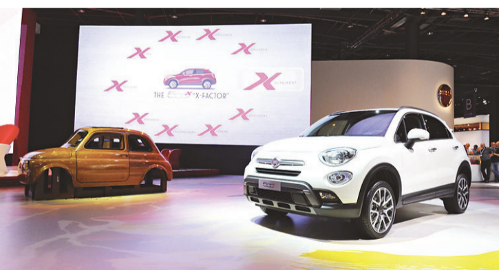
▶ A família Fiat 500 ganhou um crossover, batizado de 500X; o fora de estrada compartilha plataforma com o Jeep Renegade, que será produzido no Brasil