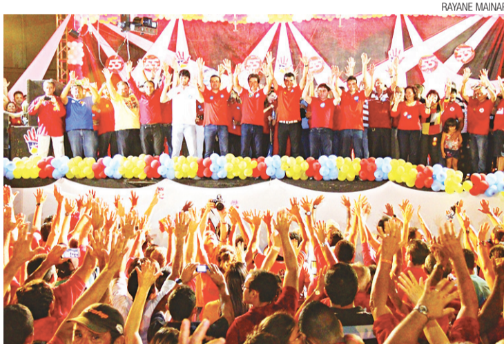
► Últimos comícios dos candidatos foram realizados na quinta-feira, conforme ajustado pela Justiça Eleitoral; já o programa na TV foi veiculado até ontem

A medida visa evitar a repetição de casos semelhantes aos registrados na votação do primeiro turno, quando a Procuradoria Regional Eleitoral (PRE) representou contra mais de 30