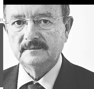
Aluisio Lacerda escreve nesta coluna aos sábados