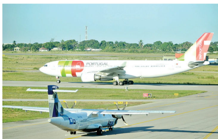
► O jato da TAP e o turboélice da Azul foram os últimos a baixar em Parnamirim