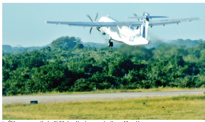
▶ Último voo partiu às 6h20 do sábado, com destino a Maceió