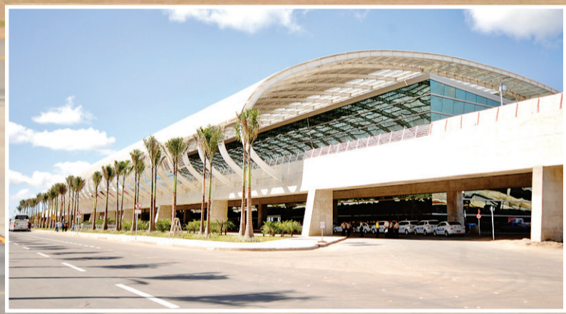
▶ Às 9h13, o primeiro avião "queimou" a pista do novo aeroporto, vindo de São Paulo