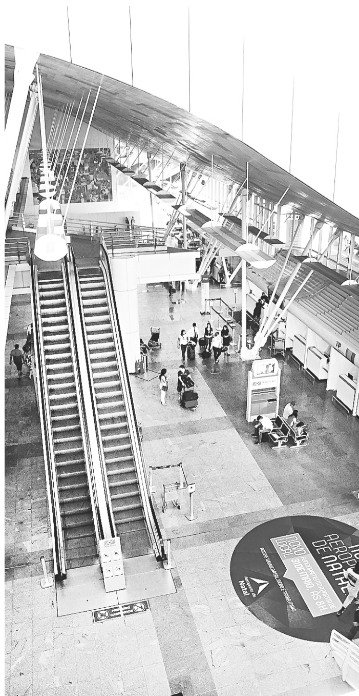
► Após reforma, terminal ficou plenamente adequado à demanda potiguar