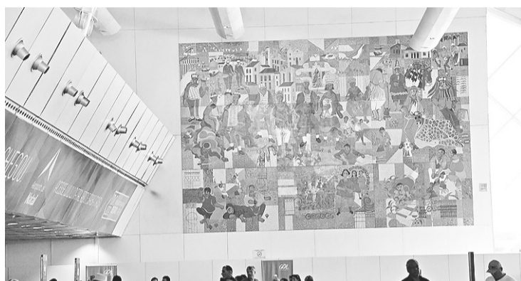
► Painéis de Dorian Gray serão encaminhados a outra unidade da Infraero