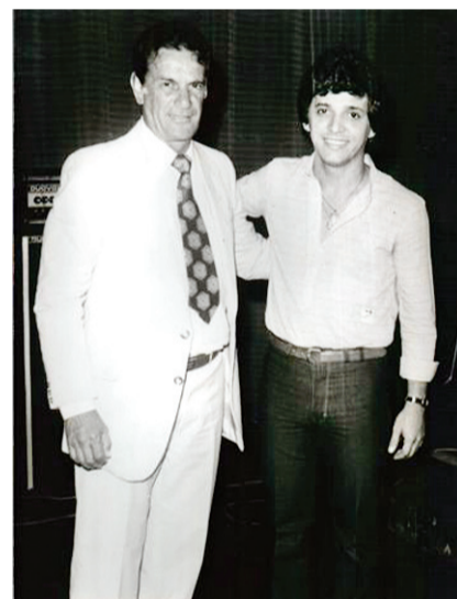
▶ Ao lado do craque Zico, com Roberto Carlos e com outro gigante do futebol, o técnico Telê Santana