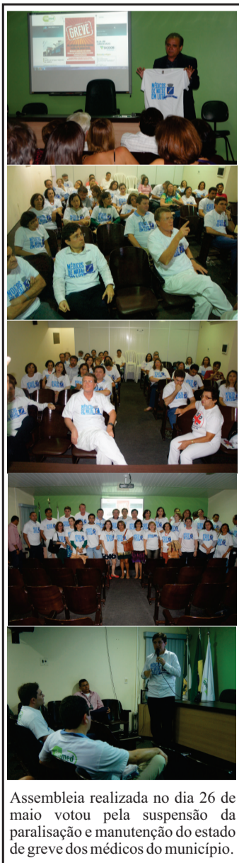
Assembleia realizada no dia 26 de maio votou pela suspensão da paralisação e manutenção do estado de greve dos médicos do município.

Serão visitados os hospitais Natal Hospital Center, Unimed, Onofre Lopes, Santa Catarina, Maria Alice Fernandes, Hospital da Mulher, Hospital da Polícia Militar, Dr. João Machado, Varela Santiago, Rui Pereira, Giselda Trigueiro, Walfredo Gurgel e Maternidade Januário Cicco.