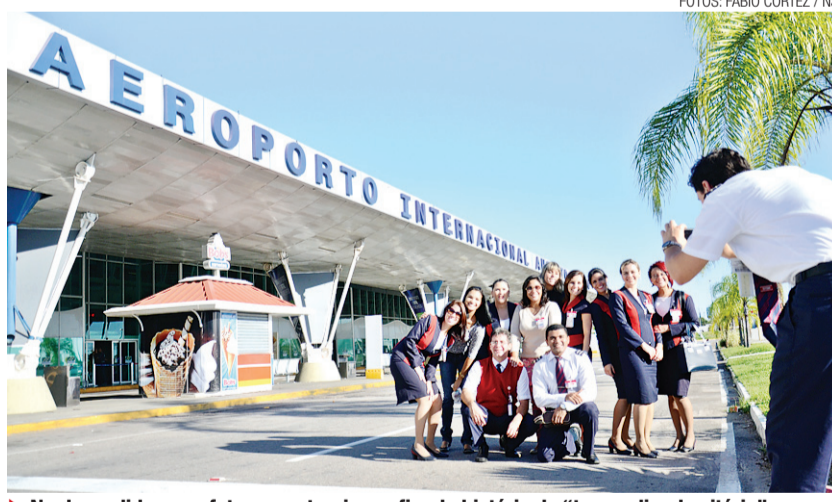
▶ Na despedida, uma foto para eternizar o fim da história do "trampolim da vitória"