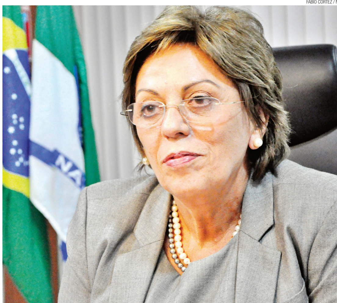
► Em entrevista recente, Rosalba Ciarlini afirmou disposição de lutar pela reeleição