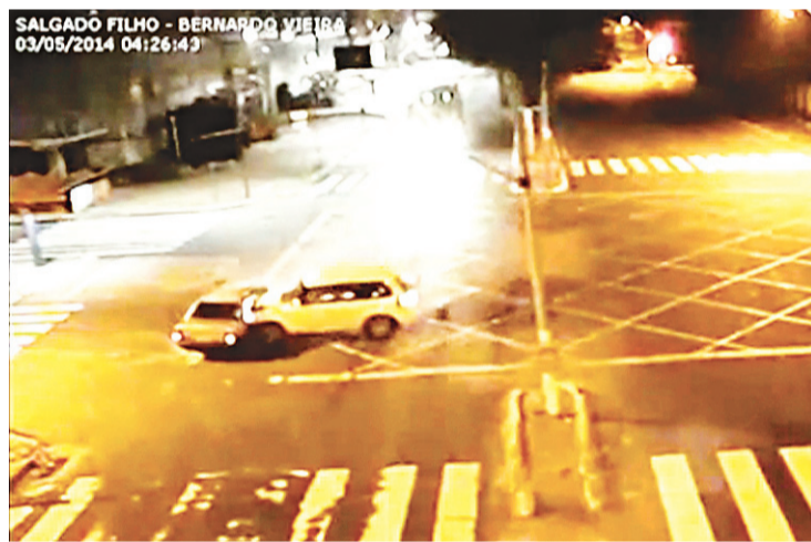
► Motorista responsável pela batida avançou o semáforo vermelho