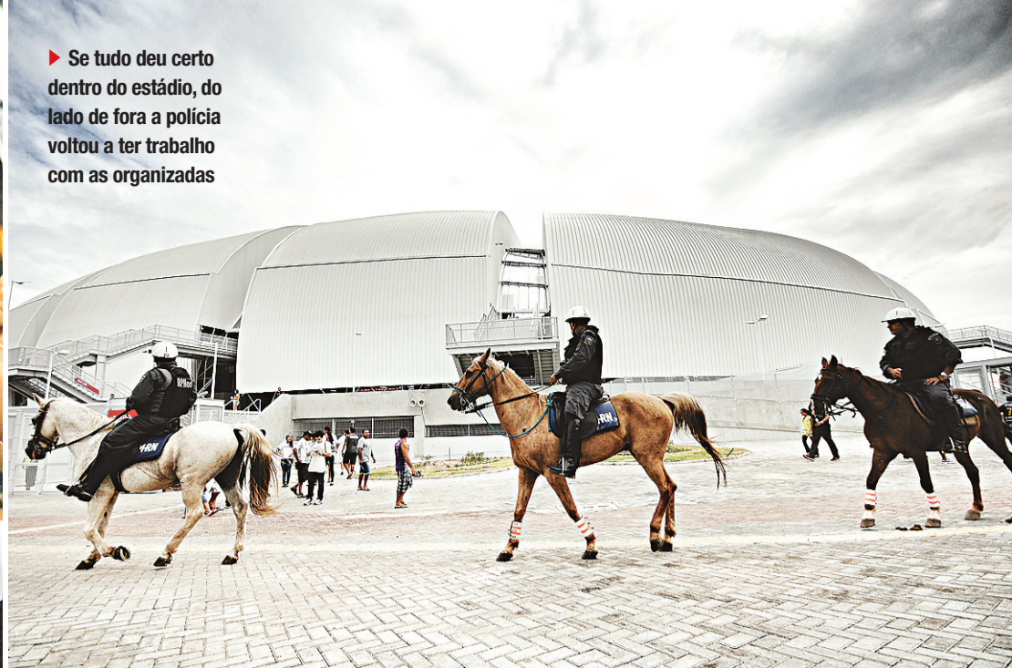
► Se tudo deu certo dentro do estádio, do lado de fora a polícia voltou a ter trabalho com as organizadas