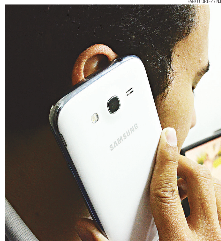
► Número de celulares já é quase igual à população mundial