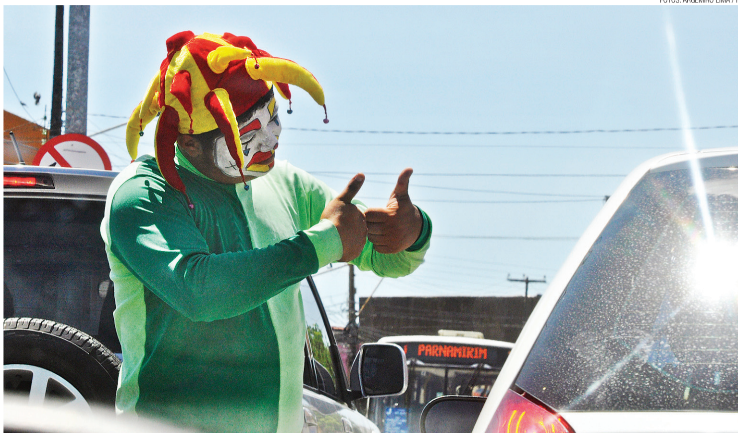
► Ator fantasiado de bobo da corte distribui simpatia durante campanha + Gentileza - Acidentes, que chega também ao interior do estado

"As pessoas estão se estressando mais no trânsito sim com as obras, mas acredito que este é um momento passageiro, para muitas melhorias futuras. Por isso nós levantamos essa bandeira, a da tranquilidade acima de tudo no trânsito", afirma. O dia nacional da Paz