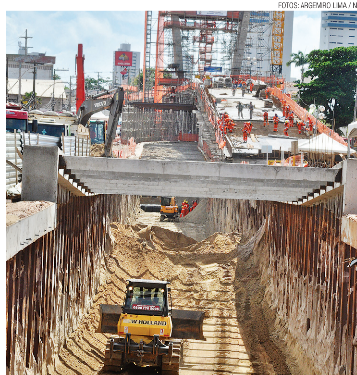
► Viaduto da Prudente de Moraes concentra maior número de trabalhadores

O enrocamento da orla de Ponta Negra, iniciado há mais de um ano, também deve ser concluído antes da Copa do Mundo. A estimativa é de que os 46 metros restantes, assim como as duas escadas e a rampa de acesso, sejam finalizados nos próximos 25 dias.