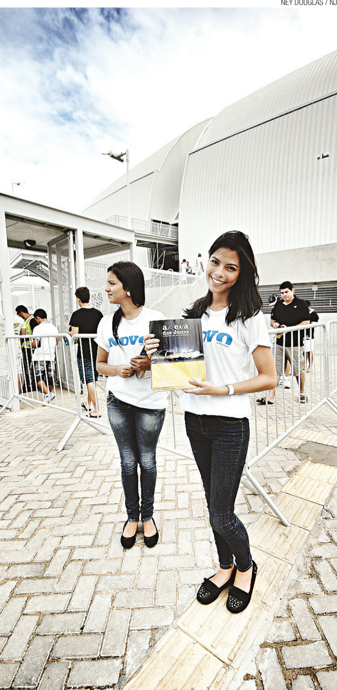
▶ Publicação foi distribuída aos torcedores na entrada do estádio