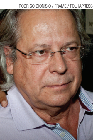
► Ex-ministro está na Papuda