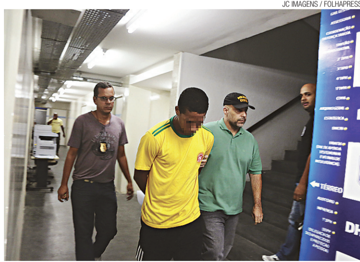
► ASG atirou bacia da arquibancada superior do estádio contra torcedores

Everton agiu com outras duas pessoas e deve responder por homicídio qualificado e, se condenado, pode ficar preso de 12 a 30 anos.