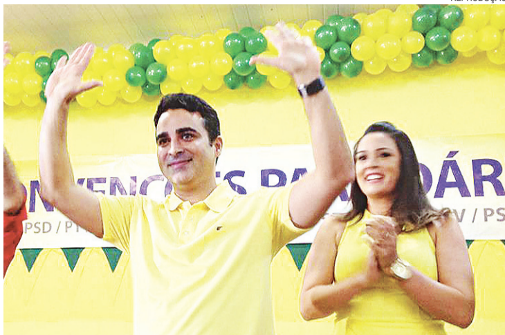
▶ Apoio a Robinson Faria pode render vaga de vice para o pai, Francisco José

O prefeito também tem o nome citado na Operação Vulcano, da Polícia Federal, deflagrada em maio de 2012. A investigação que combateu o cartel de venda de combustíveis teve início em novembro de 2011. Três vereadores teriam recebido propinas para beneficiar postos de combustíveis. O processo, hoje, transita em segredo de justiça na 3ª