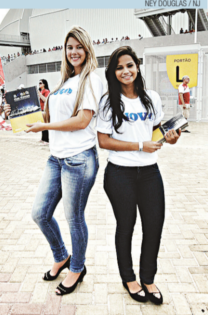
NEY DOUGLAS / NJ

No jogo em que o ABC venceu o América por 2 a 0 pela Série B, o comitê da Fifa aprovou a Arena das Dunas. A ressalva foram as obras de mobilidade no entorno.