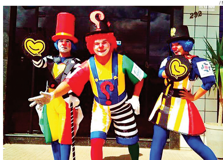
► Atores apresentam esquete educativa nas ruas de Natal