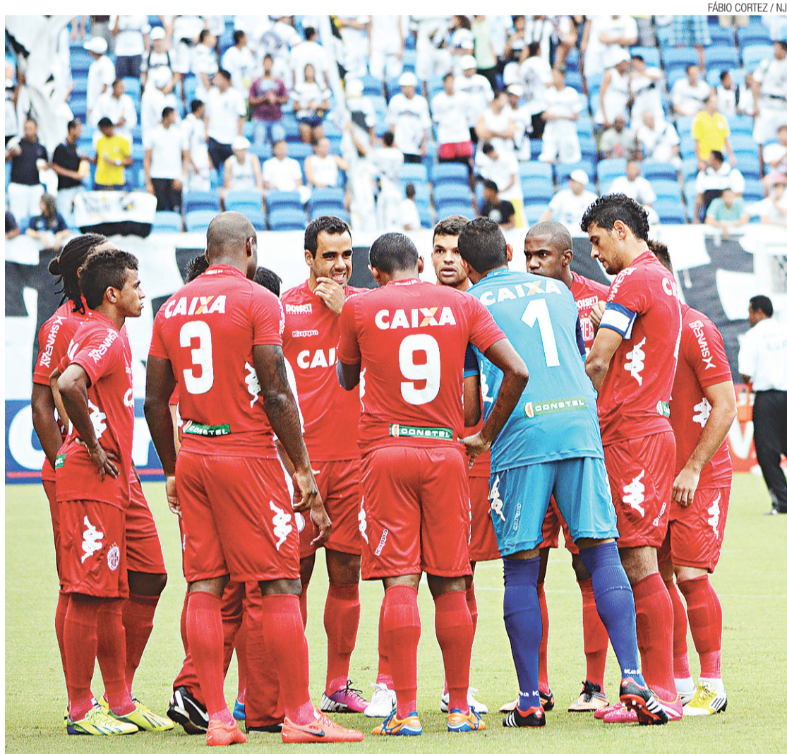
▶ Dragão ainda tem desvantagem de poder ser eliminado da competição caso seja derrotado com dois gols de diferença

E se na Segundona, o time vem de duas derrotas seguidas, na Copa do Brasil o time teve vitória convincente diante do Boavista-RJ no jogo de volta da primeira fase, quando venceu por 1 a 0. Dessa vez, diferente do jogo diante do