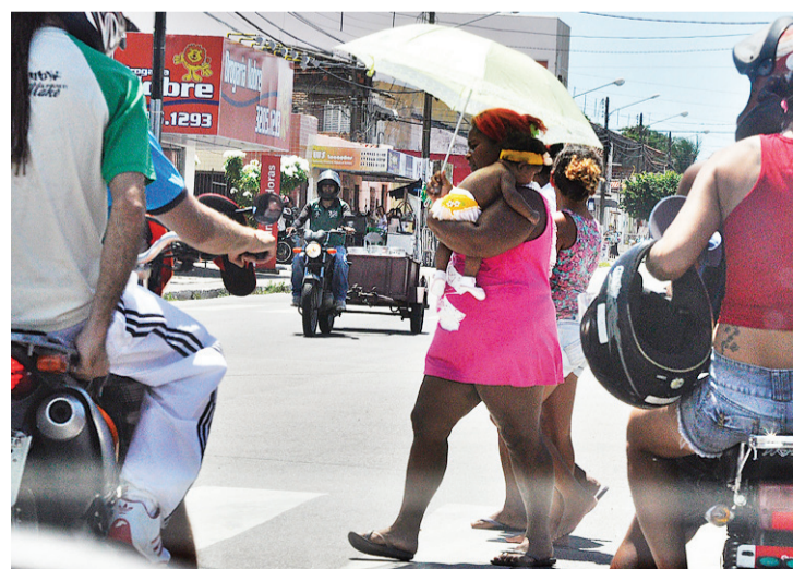
► Motociclistas são o público alvo da campanha do Detran

Questionado se a campanha não sofreu com a decisão judicial que proibiu o Governo do Estado de gastar com publicidade, ele comenta que não. "A verba é própria do Detran", garante.