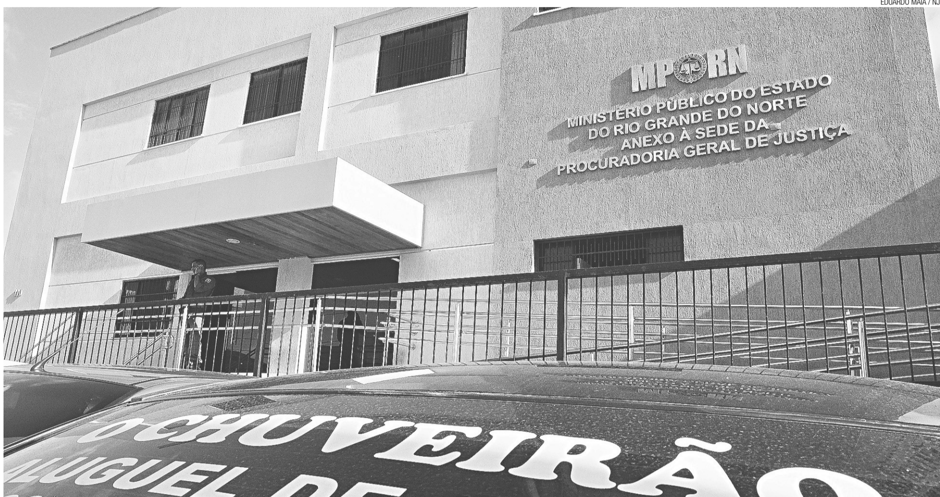
► De dezembro para abril, somente com auxílio-alimentação retroativo, Ministério Público já recebeu um total de R$ 10,9 milhões

O pagamento retroativo foi autorizado por resolução do Conselho Nacional de Justiça (CNJ). E por conta da norma que estabelece a isonomia entre as carreiras da magistratura e do Ministério Público, o pagamento foi destinado ao Tribunal e ao Ministério. A resolução autorizativa chegou a