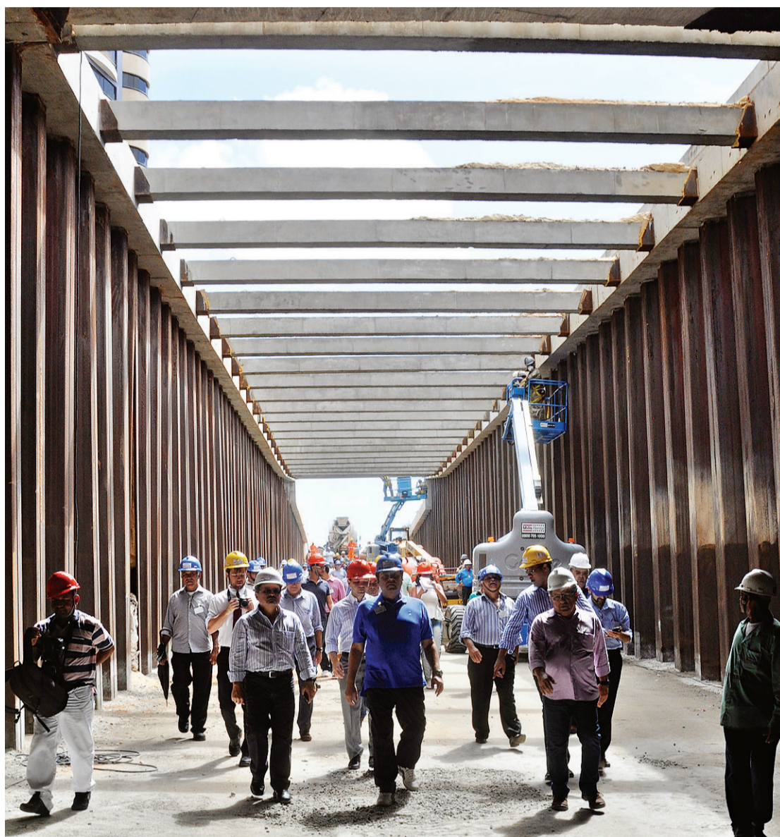
► O prefeito Carlos Eduardo vistoria obras acompanhado de secretários