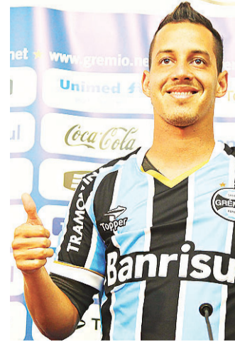
▶ Meia fica até o fim do ano