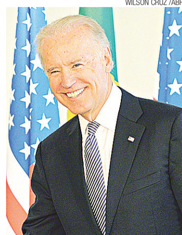
▶ Vice dos EUA, Joe Biden, na torcida

Diplomatas americanos contaram à reportagem que ainda aguardam a possibilidade de um encontro de Biden com a presidente Dilma, ainda não confirmado.