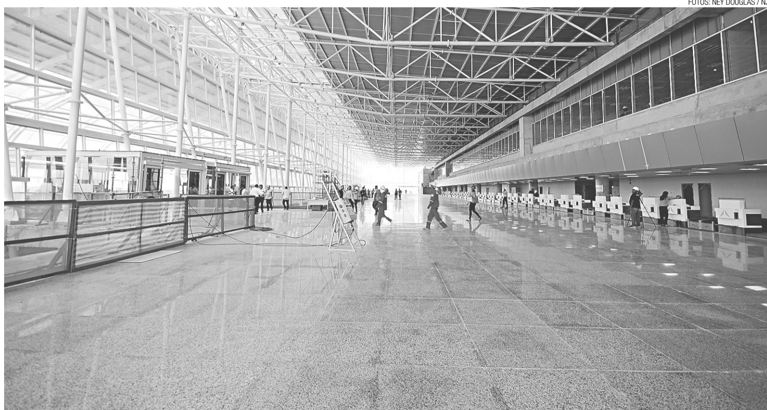
Terminal de passageiros do Aeroporto Internacional Governador Aluízio Alves entra na fase de polimento, instalações elétricas e paisagismo