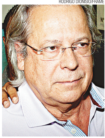
▶ Dirceu depende agora de Barbosa

No começo do ano, James Correia, secretário da Indústria, Comércio e Mineração da Bahia na gestão do governador Jaques Wagner (PT), afirmou à Folha de S.Paulo ter conversado com Dirceu no dia 6 de janeiro pelo celular de um amigo em comum que