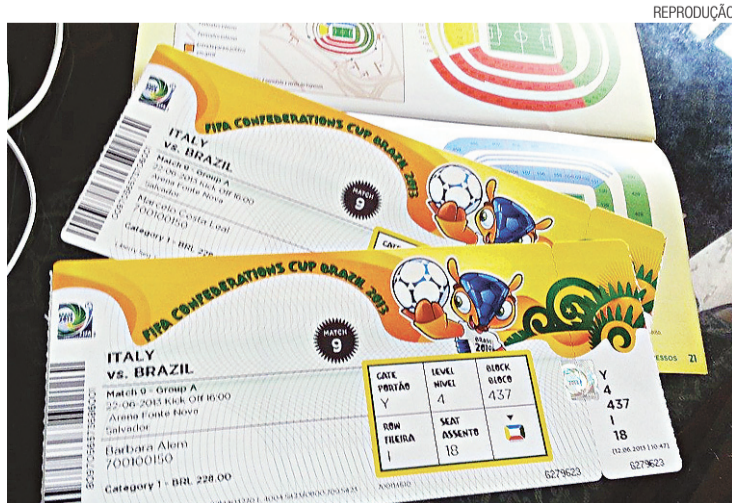
▶ Comercialização começa às 7h, via site, por ordem de chegada

O órgão que gere o futebol mundial vai vender menos ingressos do que poderia para algumas arenas porque ainda não conseguiu vistoriá-los de forma adequada.