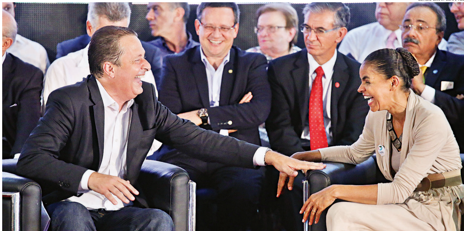
► No anúncio de Marina como vice, Eduardo Campos disse que pretende "ir pra cima" do PT durante a campanha

Campos não quis detalhar o que faria para enxugar a máquina federal. "A gente precisa diminuir o número de ministérios quem sabe à metade do que tem hoje", disse. "Da forma como está organizado o Estado brasileiro, não dá para ficar. A forma nós vamos ver mais adiante", disse. Marina comparou a união com Campos a um "casamento da tapioca com o açaí", em referência às iguarias de Pernambuco e do Acre.