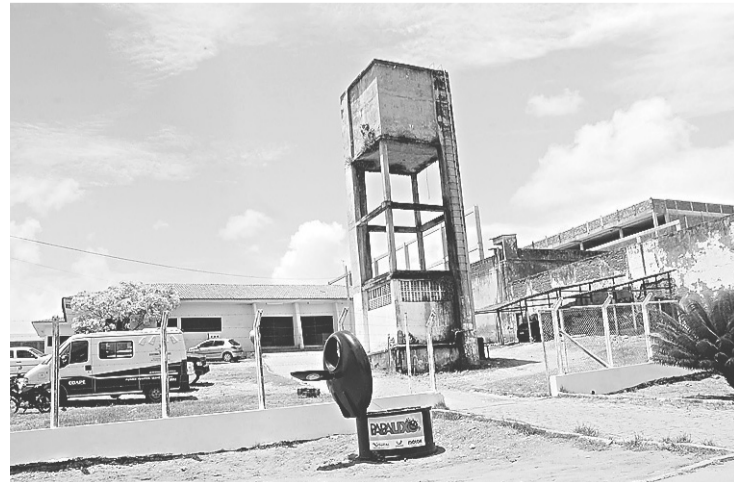
► Complexo Penal João Chaves, na Zona Norte

De acordo com o corregedor do Sistema Prisional do Estado, Leonardo Freire, é preciso aguardar a publicação da Portaria assinada pelo titular da Sejuc para que as investigações sejam iniciadas. A previsão é de que o documento seja publicado até o final desta semana no Diário Oficial do Estado (DOE). "O secretário deverá determinar a abertura de processo e nós iremos apurar. Identificado qualquer tipo de irregularidade, apresentaremos o relatório e as possíveis administrativas", confirmou Freire.