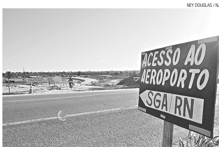
Acesso ao aeroporto a partir da BR-406 está 80% concluído

O conjunto de obras vai custar R$ 73,1 milhões ao governo estadual. Para facilitar o tráfego ao novo terminal, também será construído uma ligação através da rodovia estadual RN-160, que corta o município de São Gonçalo do Amarante. A via, uma estrada carroçável já existente, será totalmente asfaltada. Este trecho, aliás, é hoje um dos acessos alternativos para se chegar ao aeroporto. “A pista vai partir do centro do município até uma rótula que está sendo finalizada