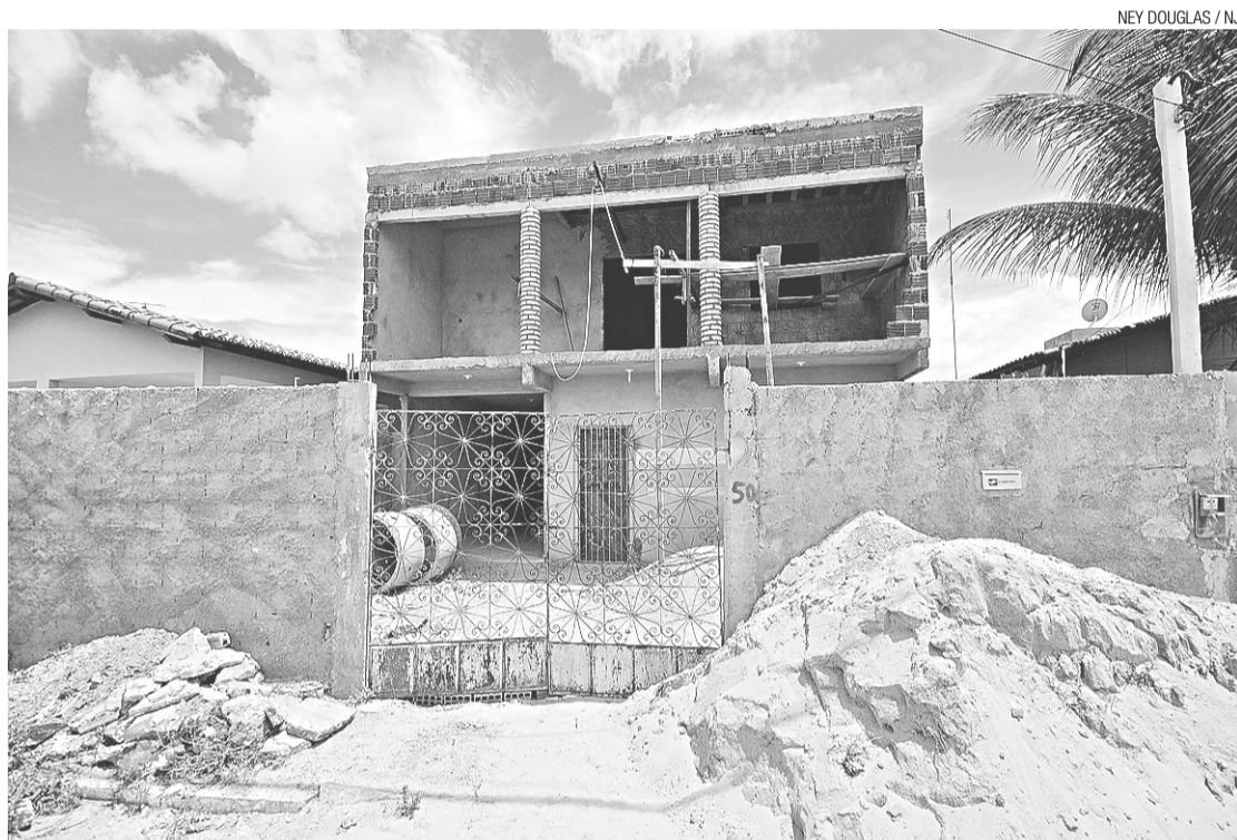
► Casa em construção no bairro de Passagem de Areia, em Parnamirim, onde o flagrante foi registrado em vídeo

Para a promotora, a decisão do então diretor do Complexo Penal Dr. João Chaves, em retirar presos para fins particulares e, ainda mais, sem autorização judicial, consiste em crime. "A conduta criminosa do diretor do presídio em utilizar mão de obra de presos de regime fechado, de perfil perigoso, para uma atividade particular foi o que mais me chamou atenção", destacou a coordenadora do Gaeco. O presídio acolhe detentos de am-