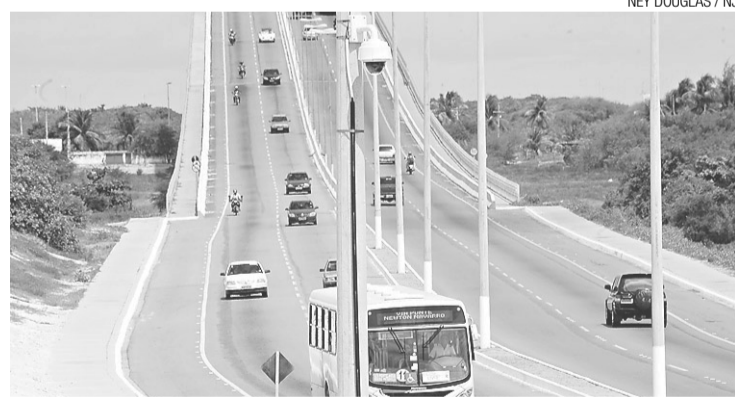
Câmara de monitoramento na Ponte Newton Navarro

“A infração poderá ser flagrada pela nossa central de monitoramento. As câmeras podem captar as placas dos veículos, facilitando a aplicação de multas”, afirma Ele-