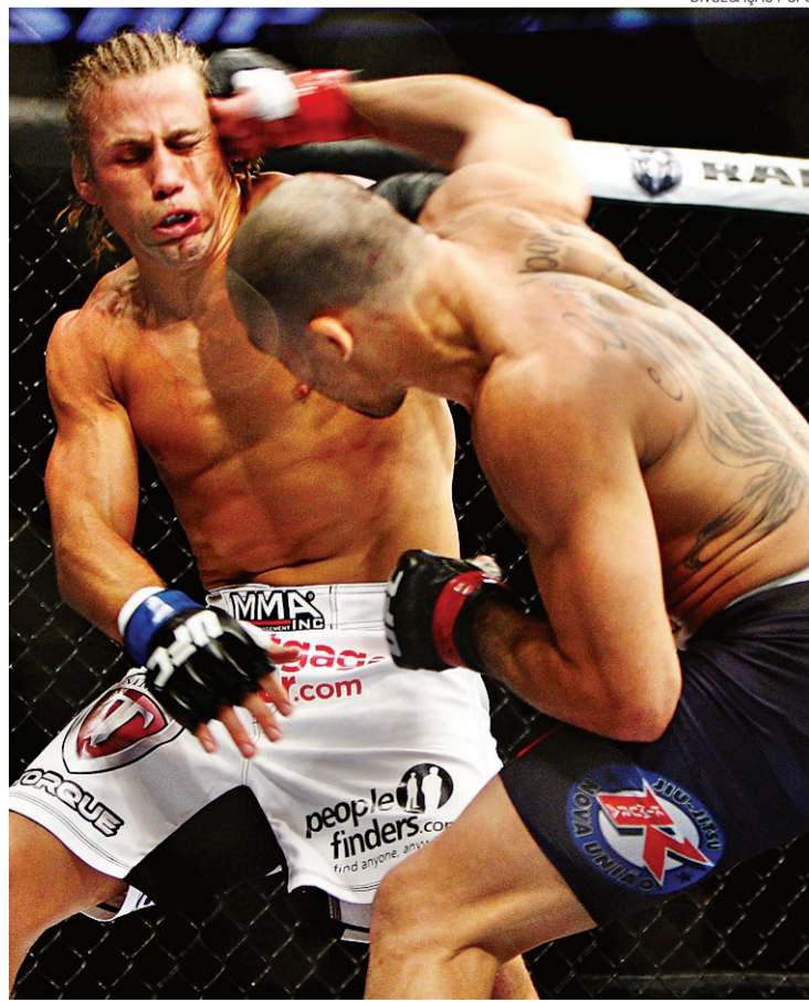
► Barão recebeu quase cinco vezes menos que Urijah Faber

todos os atletas filiados ao Ultimate, Barão espera ver sua conta bancária engordar como a de seus colegas de esporte.