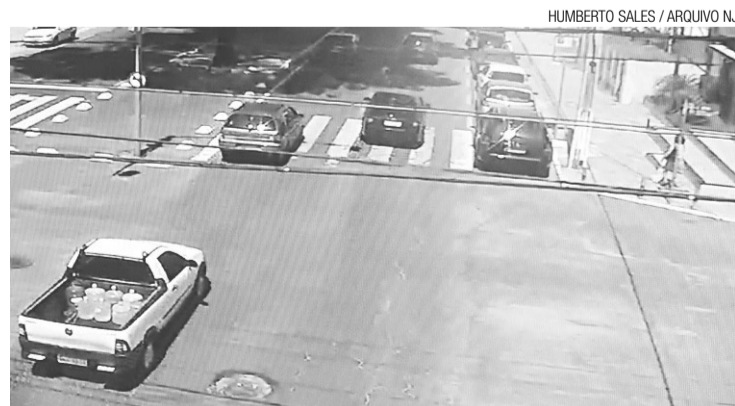
Imagens do trânsito projetadas pelas câmeras da Semob

quicina Santos. Apesar disso, a Semob ainda não tem uma previsão para que esta fiscalização seja efetuada em Natal.