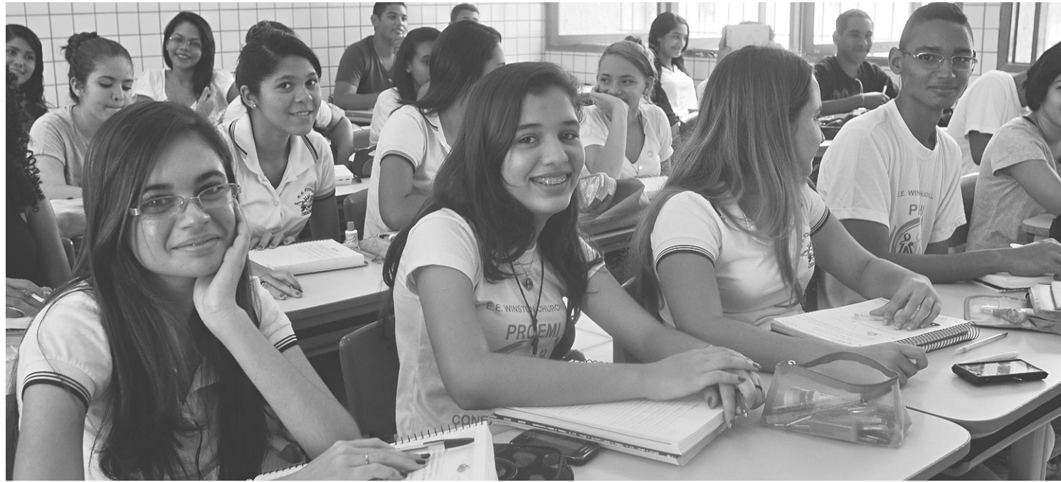
► Sala de aula da Escola Estadual Winston Churchill: movimento de alunos próximo do convencional

Mesmo com essa indicação da diretoria, os alunos – especialmente os do terceiro ano do ensino mé-