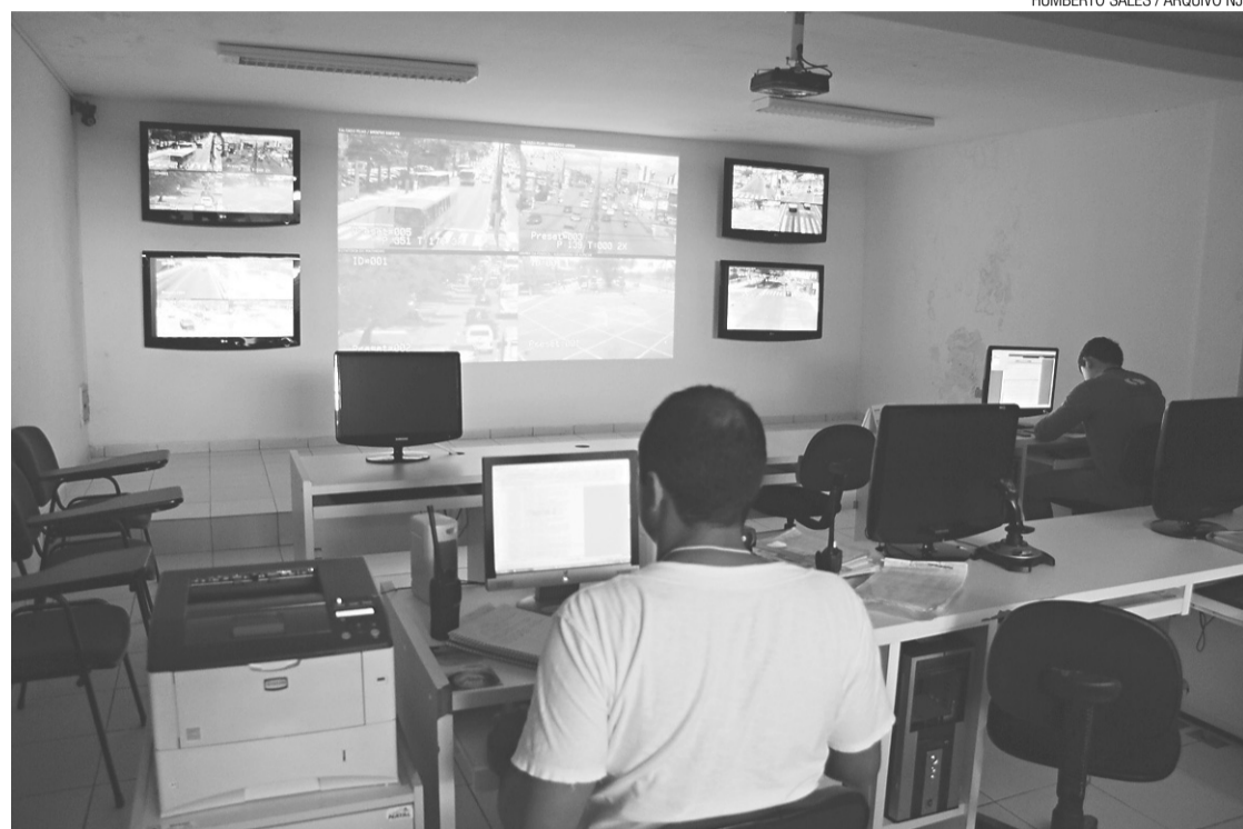
Central de monitoramento de trânsito da Secretaria Municipal de Mobilidade Urbana

Por conta da suspensão dos serviços de fiscalização, a Semob teve de aplicar um novo regime de trabalho aos 97 fiscais de trânsito da cidade, os amarelinhos, que