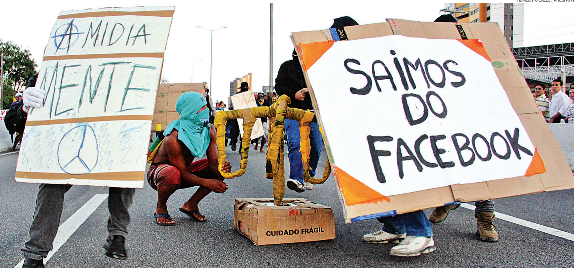
► Inconsequência, desrespeito e violência são atitudes de grupos conhecidos como 'Black Blocs', que, por não se denominarem coletivo ou uma entidade, não representam, positivamente, nem a si próprios

/ VIOLÊNCIA / MORTE DO CINEGRAFISTA SANTIAGO ANDRADE, NO RIO, EXPÕE OS RISCOS QUE OS PROFISSIONAIS DA IMPRENSA SOFREM NA COBERTURA DAS MANIFESTAÇÕES POPULARES; EM NATAL, VÁRIAS EQUIPES FORAM AGREDIDAS