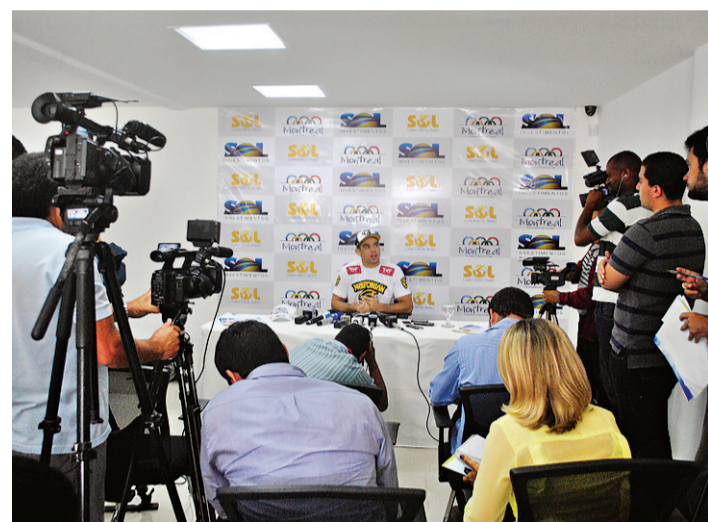
► Lutador recebeu jornalistas para falar sobre o futuro como campeão