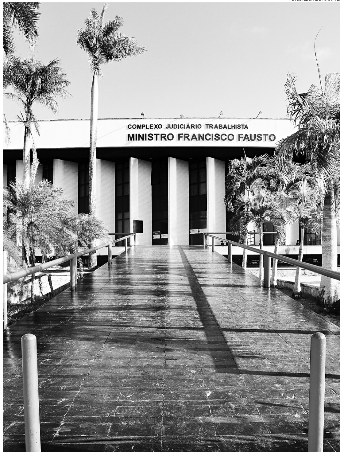
► Sede da Justiça do Trabalho em Natal: Prefeitura e TRT caminham para um acordo

soa jurídica que tiver adotado o regime especial de pagamento de precatórios instituídos pela emenda constitucional 62/2009, não será inscrita no Banco Nacional de Dívidas Trabalhistas, desde que mantenha pontualidade nos depósitos”, realçou Castim.