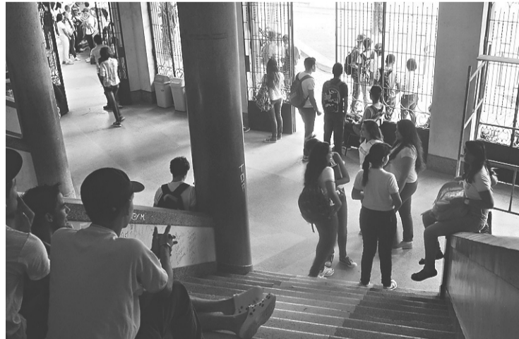
► Movimento na Escola Atheneu Norte-Riograndense: quase normal