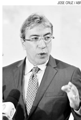
▶ Déda: mais de um ano internado