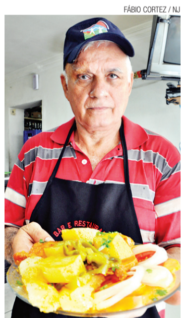
▶ Paçoca do Bar do Coelho: concorrente do Festival Pratomundo