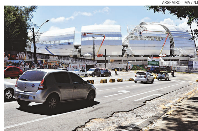
► Romualdo Galvão terá apenas uma faixa para passagem de veículos