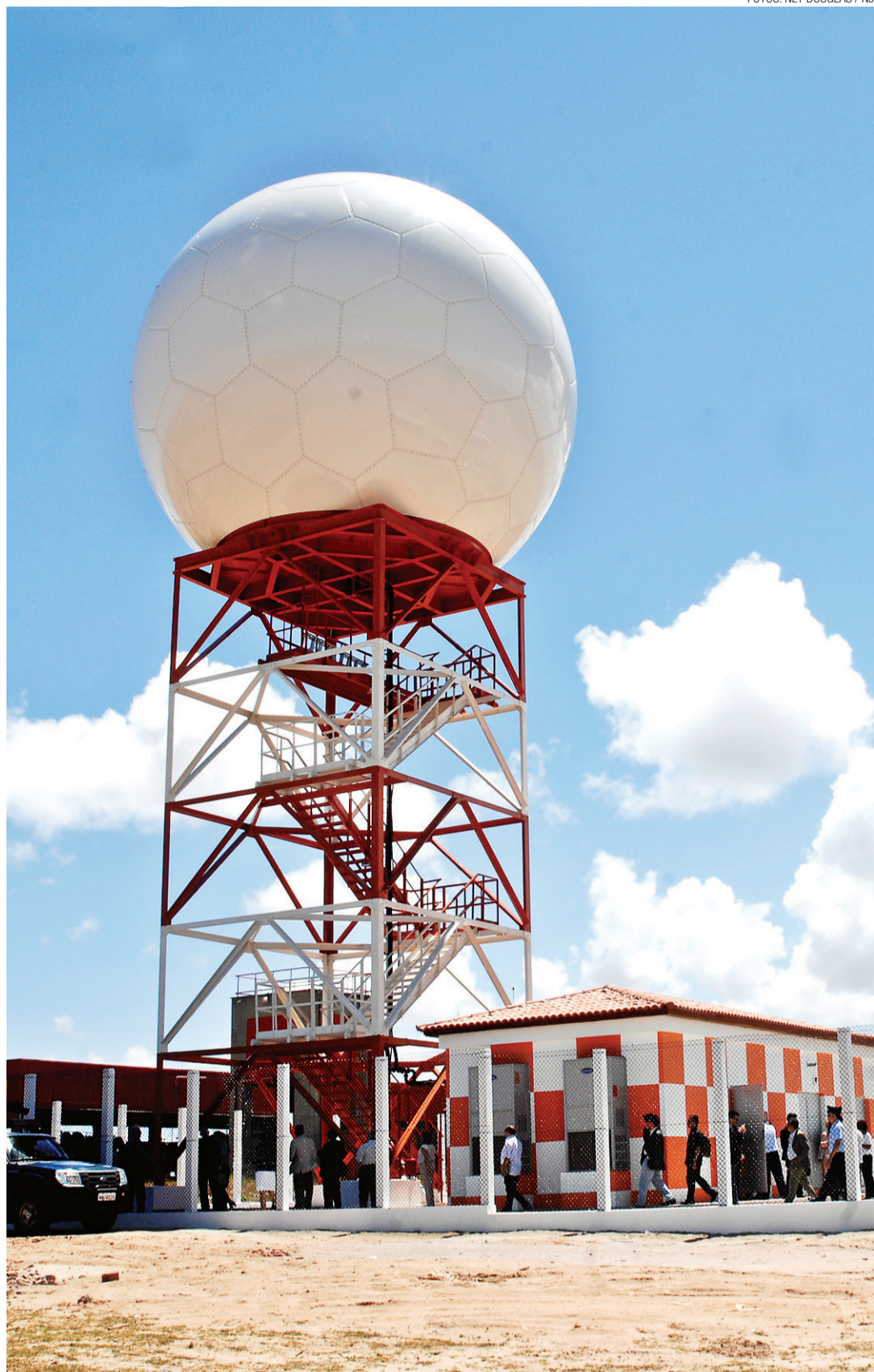
► O radar tem formato de uma bola, repleta de “gomos”, que facilita a captação de dados