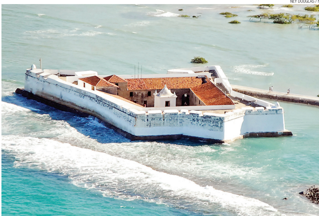
▶ Fortaleza dos Reis Magos, na foz do Rio Potengi, inspirou projeto do Estrelão...

As condições do plano de mobilidade, que tinha como complicação a distância do Estrelão para