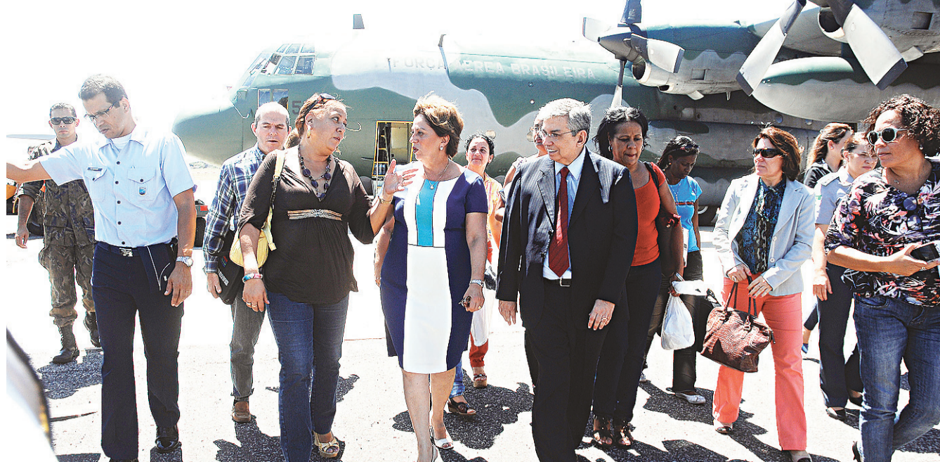
► Governadora Rosalba Ciarlini e o ministro da Previdência, Garibaldi Filho, recebem as sete primeiras cubanas do novo grupo

Marcelo Déda morre em São Paulo, após mais de um ano internado, lutando contra o câncer. Velório será hoje e corpo será cremado em Salvador, amanhã.