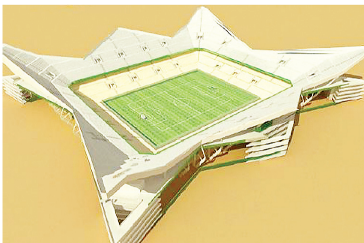
▶ ...que seria construído próximo ao aeroporto, em Parnamirim

a capital, não agradaram aos inspetores da Fifa.