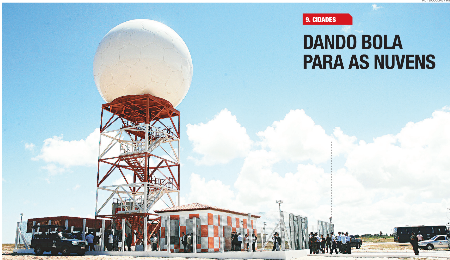
► Natal ganha radar avaliado em R$ 9 milhões que vai monitorar movimento das nuvens a cada 10 minutos e fornecerá dados climáticos mais precisos sobre Rio Grande do Norte