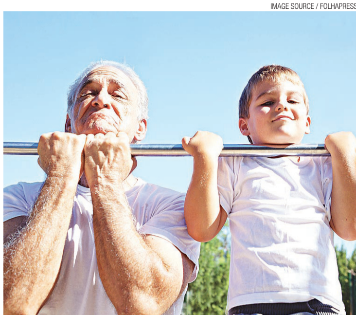
► Expectativa de vida tem crescido aceleradamente no Brasil

A afirmação foi feita em seminário em São Paulo sobre os cenários para a economia brasileira nos próximos anos. Mantega indicou ainda que o crescimento no ano também deve ficar perto