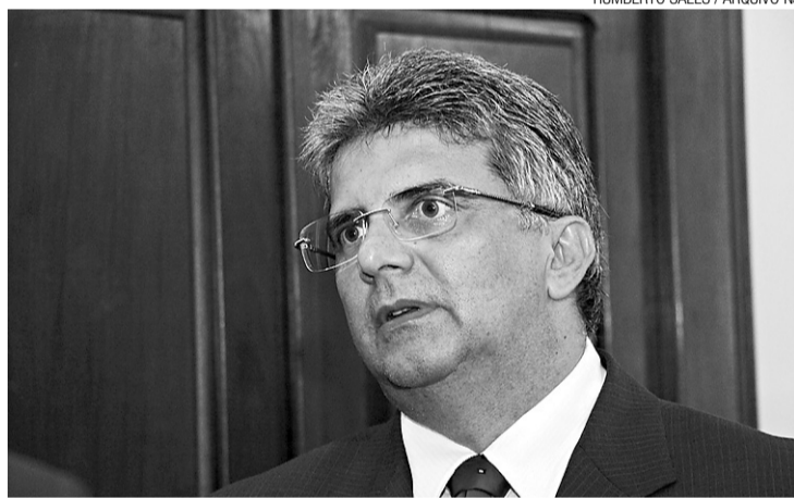
► Projeto deve voltar à votação na próxima semana