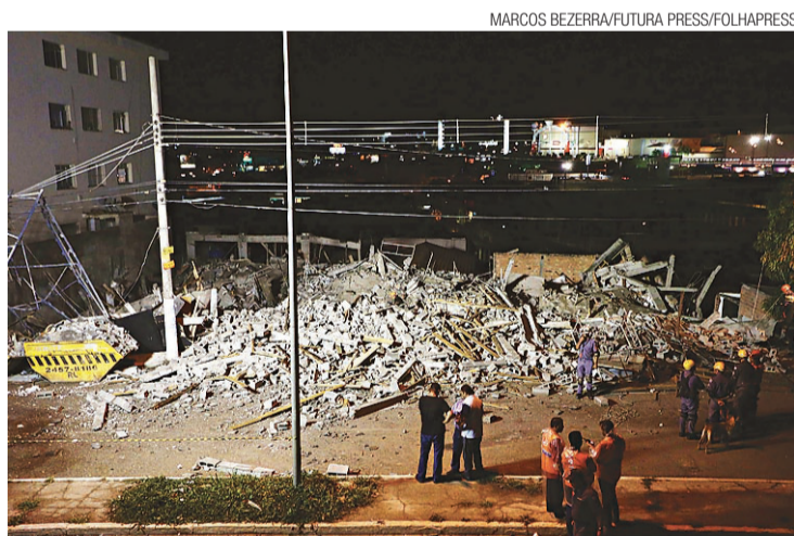
► Os escombros do prédio em Guarulhos: operários saíram pouco antes

A maior expectativa de vida também aumentou diante da menor mortalidade por doenças especialmente. Na fase adulta considerada pelo IBGE (15 a 59 anos de idade), de cada 1.000 pessoas que atingiriam os 15 anos, 846 aproximadamente completariam os 60 anos de idade. Já em 2012, o número subiu para 848 pessoas.