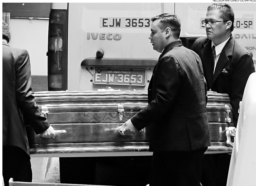
▶ Corpo do governador de Sergipe deixa São Paulo pela manhã

Em nota oficial, Dilma diz que perdeu “um grande amigo”. “A sua trajetória foi marcada pela dedicação em transformar para melhor a vida das