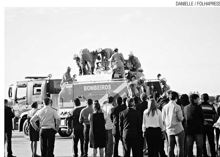
▶ Cortejo segue em carro do Corpo de Bombeiros em Aracaju

O petista ocupou cadeira na Câmara dos Deputados de 1994 a 2000, quando venceu a disputa pela Prefeitura de Aracaju. Reelegueu-se em 2004 e renunciou em 2006 para concorrer ao governo.