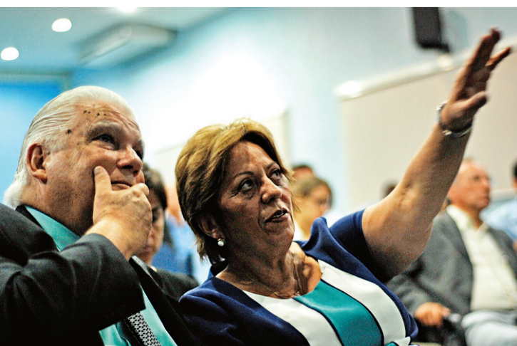
► Ministro Marco Antônio Raupp e a governadora Rosalba Ciarlini

É o valor do radar climático instalado na Base Aérea, em Parnamirim, pelo Cemaden