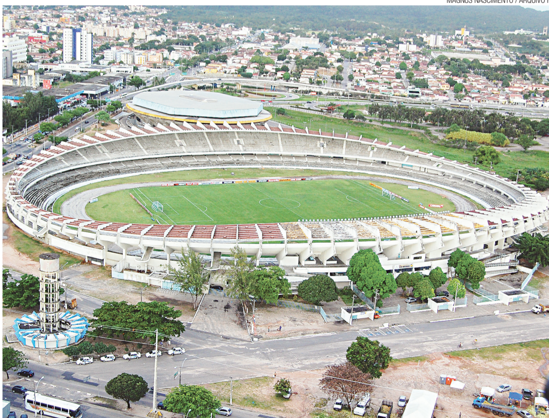
▶ Demolido para dar lugar à Arena das Dunas, Machado, ainda foi lembrado para a Copa

O plano do arquiteto potiguar prevê rebaixamento do gramado, com a ampliação da capacidade para 46 mil lugares, além de uma nova cobertura. Alterações de um estacionamento, dentro