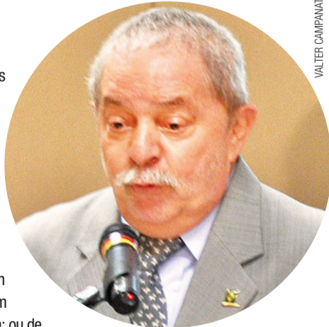
VALTER CAMPANATO / ABR

Participe deste debate e vamos continuar transformando o Brasil!