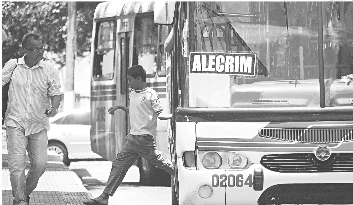
► Em Natal, projeto do passe livre tende a incluir todos os alunos da rede municipal e ter controle de frequência, como na Paraíba