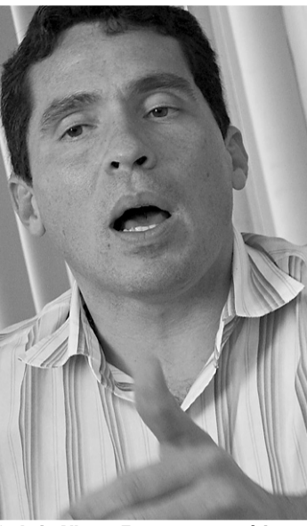
SÍLVIO ANDRADE DO NOVO JORNAL

O ATENDIMENTO DOS plantões de cirurgias gerais de urgência no Hospital Regional Deoclécio Marques de Lucena, em Parnamirim, só será restabelecido em outubro com a contratação da Cooperativa dos Médicos e nomeação de quatro cirurgiões aprovados no último concurso da saúde.