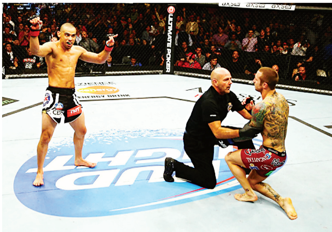
► No segundo round, potiguar disparou o chute rodado que abateu americano

é este garoto aqui do meu lado (referindo-se a Barão). Ele está invicto por oito anos, enquanto o Floyd [Mayweather] está por 17 anos. Você sabe como é difícil permanecer oito anos invicto? Ele não recebe os créditos que merece e pelo que é capaz de fazer. Veja, ele não ganha em decisão unânime ou dividida, mas ele destrói de verdade”, elogiou o presidente do Ultimate.