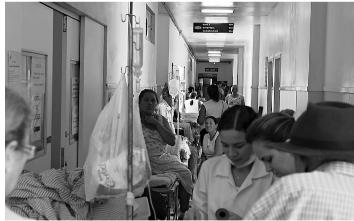
► Hospital Deoclécio Marques: corredores lotados

Com oito médicos a menos desde agosto, o serviço foi suspenso. Está funcionando apenas o plantão de enfermagem e o plantão ortopédico de politraumas da porta de entrada. Os pacientes levados pelo Samu estão sendo desviados para Walfredo Gurgel, assim como aqueles de demanda espontânea, que chegam levados por familiares. Por mês são realizadas 100 cirurgias no Deoclécio Marques, sendo uma média de 700 atendimentos diversos diários, o que dá a média de 7 mil/mês.