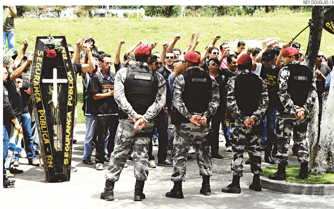
► Grevistas em frente à Governadoria: protestos agora só a 200 m de distância

Trata-se de mais uma medida do juiz, após petição do procurador geral do Estado, Miguel Josino, que busca coibir as práticas do Sinpol, durante movimento grevista que "tem perturbado ou obstado o normal funcionamento de algumas repartições públicas, bem como o funcionamento do serviço de remoção de cadáveres", fazendo-se necessária "a adoção de medidas mais eficazes para compelir o Sindicato recalci-trante a obedecer a ordem jurídi-