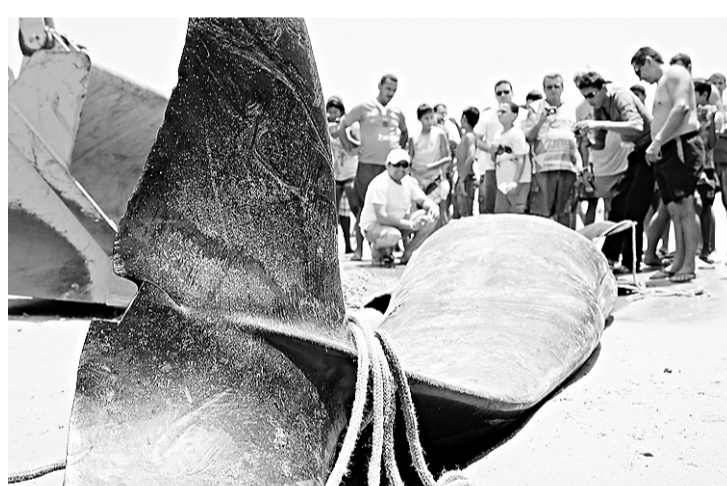
► Banhistas da praia de Upanema testemunharam a morte dos animais