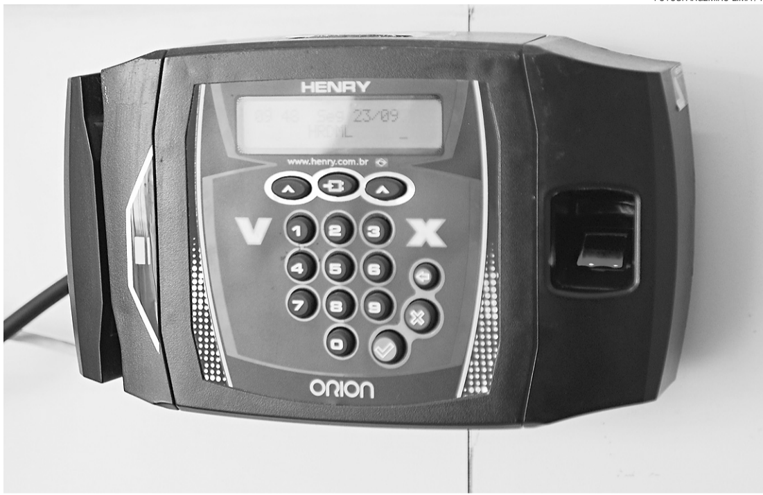
► Ponto eletrônico foi implantado na rede estadual de saúde

A implantação do ponto eletrônico para acabar com a distorção no cumprimento da carga horária trabalhada começou no atual governo com o ex-secretário