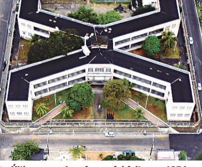
Última grande reforma foi feita em 1954