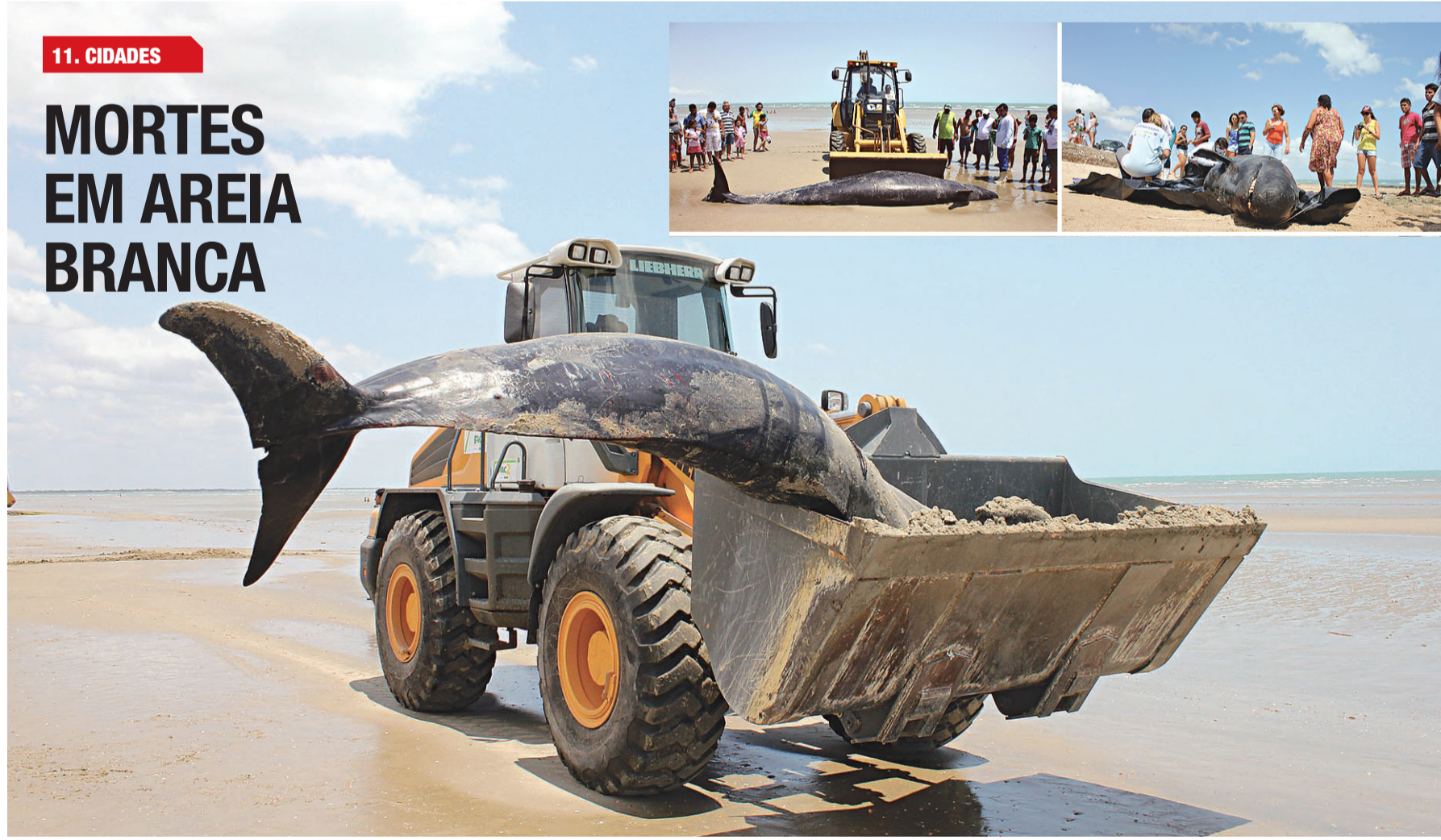
Após o maior encalhe já ocorrido no Estado e seis mortes, pesquisadores começam hoje a investigar o que ocorreu com grupo de 30 falsas-orcas que apareceu numa praia de Areia Branca