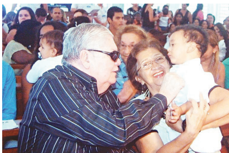
► Uma de suas fotos mais recentes numa celebração religiosa