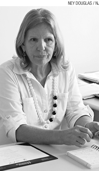
NEY DOUGLAS / NJ

Com o ponto eletrônico não dá para fazer a terceirização informal, resumiu Luiz Roberto Fonseca. Os profissionais ficaram impedidos de fazer o repasse e definiu a situação de quem não queria trabalhar, mas estava se beneficiando com o pagamento de plantões.