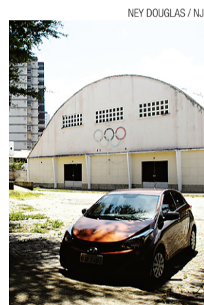
▶ Ginásio Sílvio Pedrosa