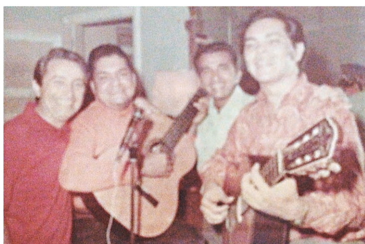
► Com os companheiros de música: talento