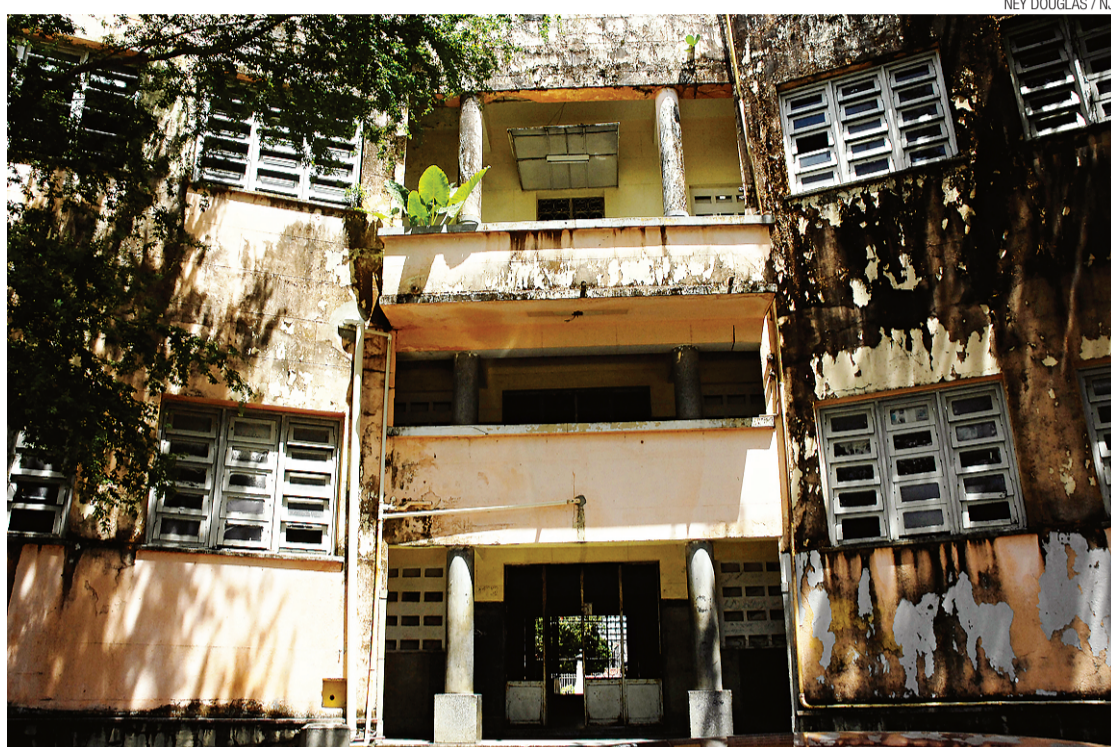
▶ Escola Estadual Atheneu Norte-Rio-Grandense: sem reforma ampla desde 11 de março de 1954