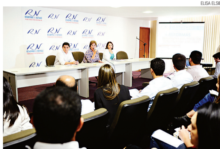
▶ Governadora Rosalba Ciarlini e secretária Betânia Ramalho: pacote de obras

Será recuperada toda a parte física de revestimento, como também adaptação da escola para o combate a incêndio, através de hidrantes e extintores. Além da instalação de uma subestação de energia de 150 kva.