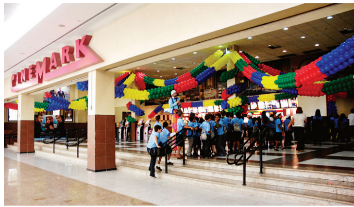
► Previsão dos organizadores é de receber 9 mil alunos de escolas públicas; no geral, o público estimado para esta edição do festival é de 15 mil espectadores