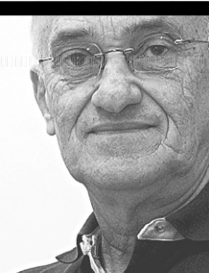
Albimar Furtado escreve nesta coluna às sextas-feiras