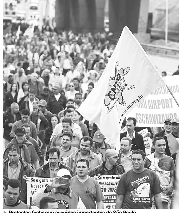
Protestos fecharam avenidas importantes de São Paulo