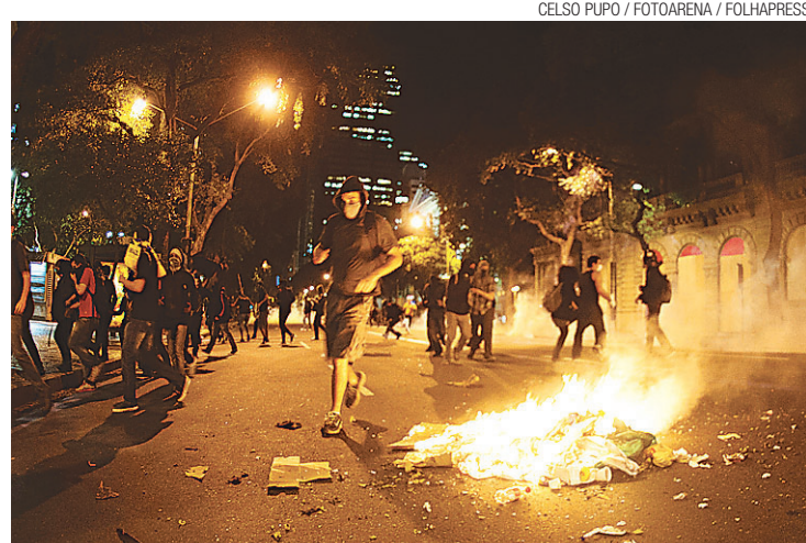
► Protestos nas ruas do Rio de Janeiro terminaram em vandalismo

A Polícia Militar (PM) usou bombas de gás lacrimogêneo para dispersar o grupo e os manifestantes jogaram pelo menos dois coquetéis molotov contra os militares. O Batalhão de Choque já tinha deixado a área central da cidade depois que os jovens se concentraram nas escadarias da Câmara