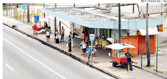
▶ Usuários tiveram dificuldade de pegar ônibus

As três entidades ligadas ao transporte público confirmam que, às 15h de ontem, os ônibus estavam circulando normalmente, sendo que em menor número devido a escassez de passageiros.