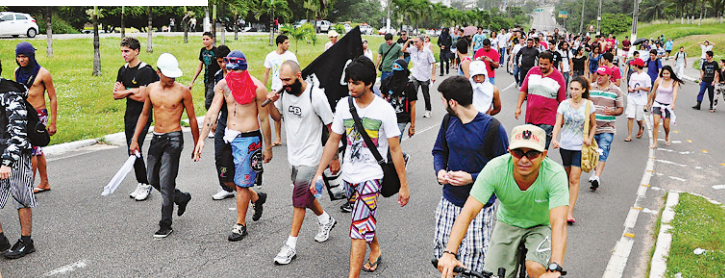
▶ Líderes de partidos e de sindicatos lideraram a passeata até Avenida Engenheiro Roberto Freire; tudo dentro da normalidade, segundo a Polícia Militar