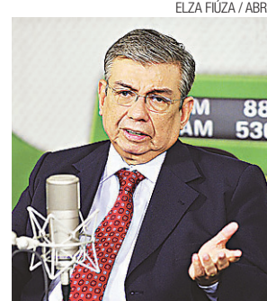
► Ministro Garibaldi Alves