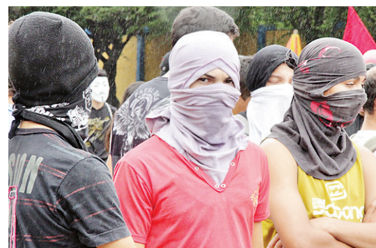
► Mascarados tentaram intimidar o trabalho da imprensa, dizendo-se vítimas das empresas de comunicação