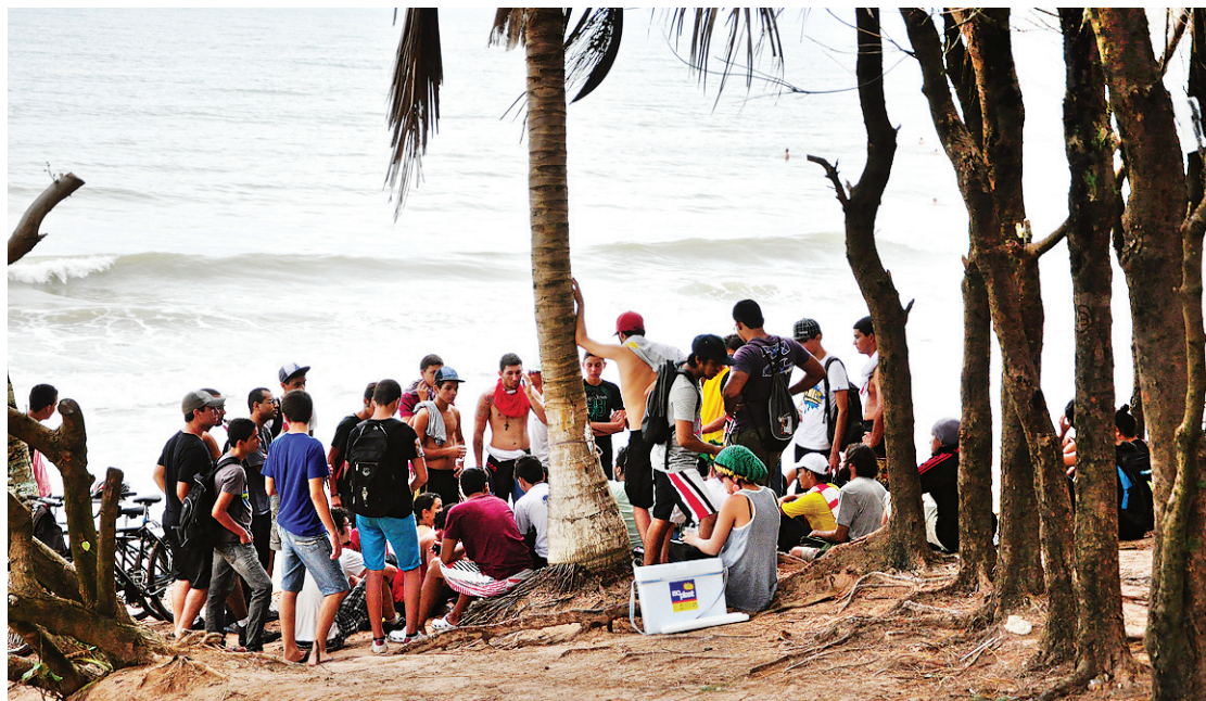
▶ Integrantes do Movimento Revolta do Busão seguiram até a praia de Ponta Negra: plenária discute a ação

Alheios aos discursos, os integrantes da Revolta do Busão resolveram fazer uma plenária para decidir os próximos passos daquele momento, enquanto os partidos e sindicatos iniciavam a dispersão. O grupo com pouco mais de cem pessoas decidiu seguir com um "ato lúdico" pela avenida até à praia de Ponta Negra.