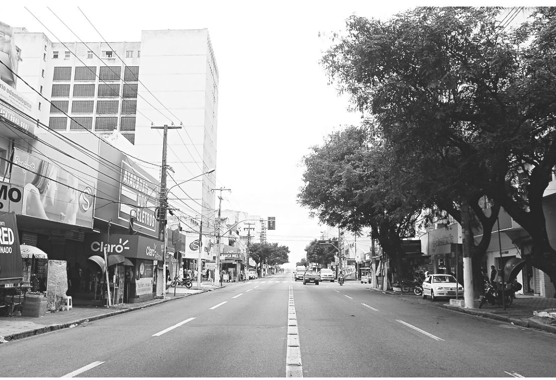
Pouco trânsito na Avenida Rio Branco e BR 101 (no alto); agência Banco do Brasil se protege com tapumes e o Shopping Via Direta fecha o portão com cadeado