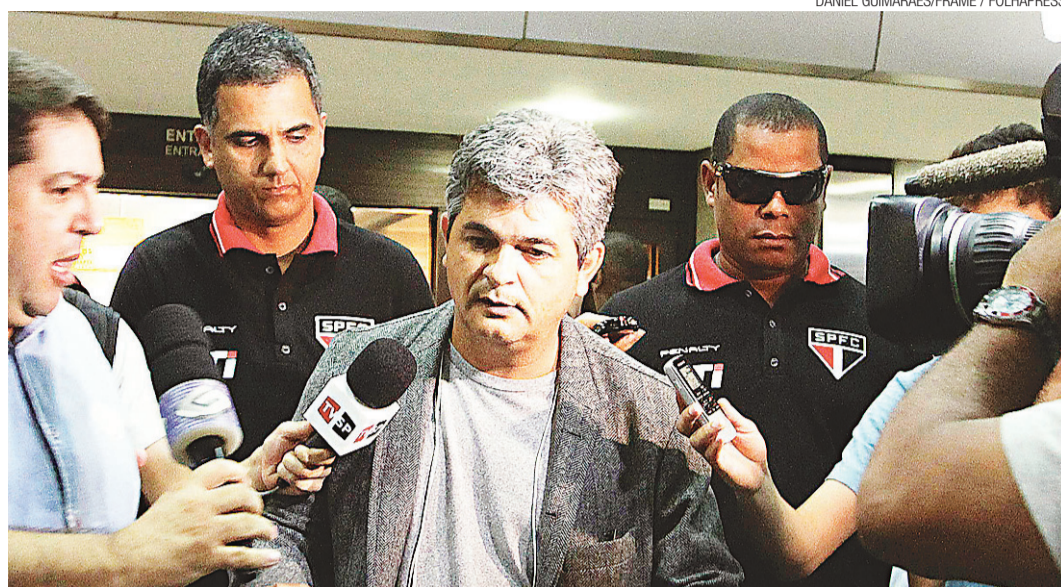
► Ney Franco: além da torcida, pressão dos próprios jogadores

Ontem, negou insubordinação, mas lançou mais fogo na crise. "Não fiquei triste nem bravo, mas fiquei surpreso. Não é comum substituir um zagueiro. Não dá para falar que foi melhor