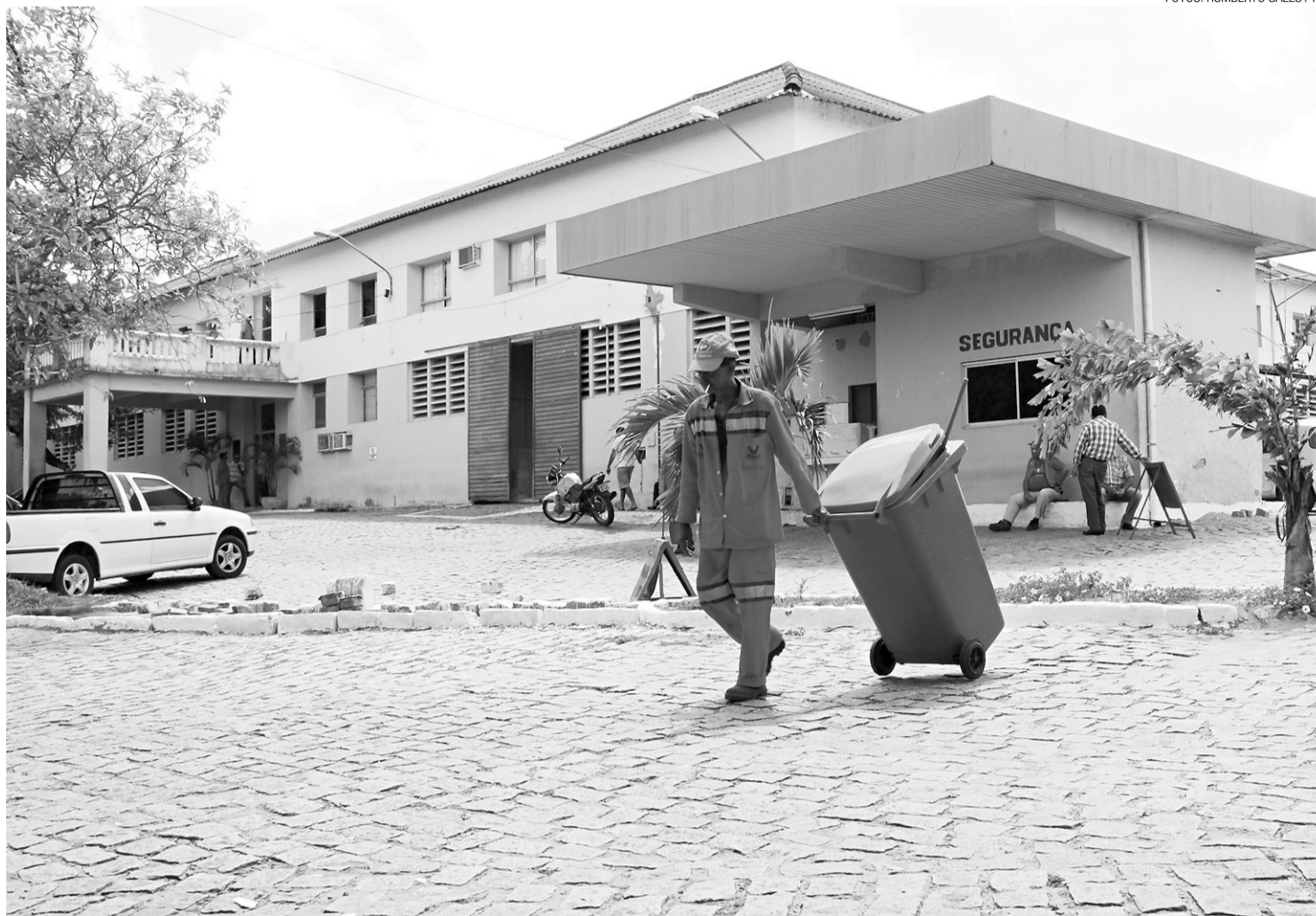
► Mudanças previstas na coleta de lixo em Natal, feita pela Urbana a partir do processo licitatório, só serão percebidas no segundo semestre

Na última terça-feira, a companhia criou uma comissão para elaborar o projeto básico, a minuta de referência e o edital de licitação da limpeza urbana. O modelo será de concorrência