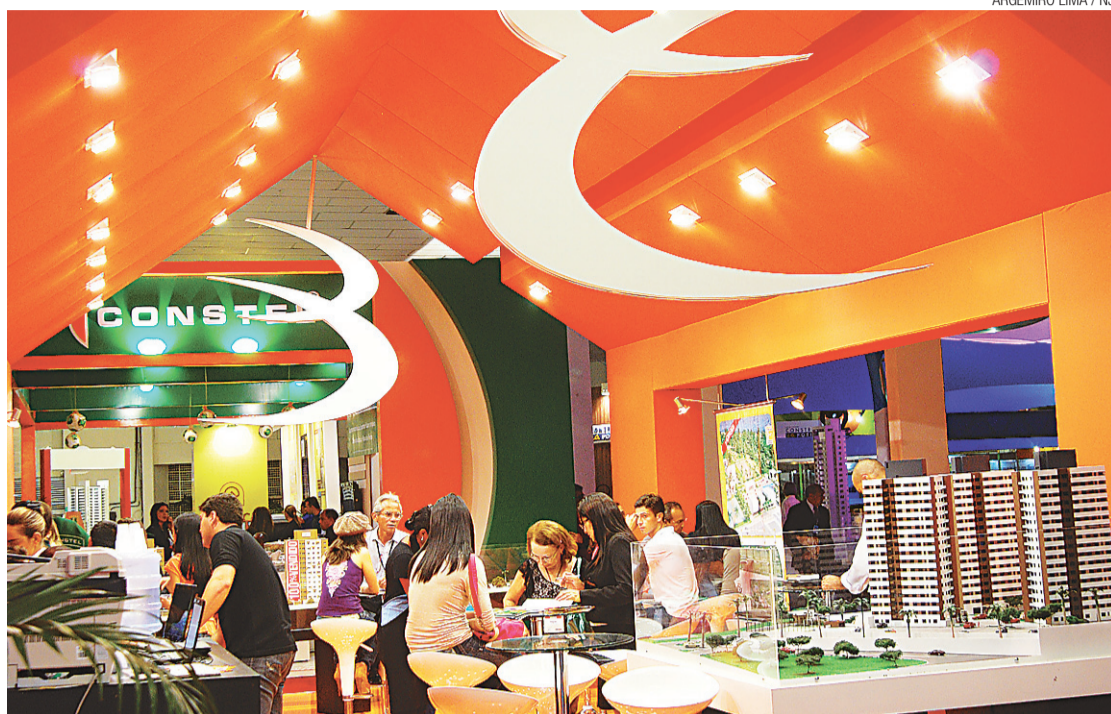
▶ Ecocil é uma das participantes do Salão Imobiliário que mantém boas expectativas de negócios

Uma novidade é que, pela primeira vez, a Ecocil está traba-