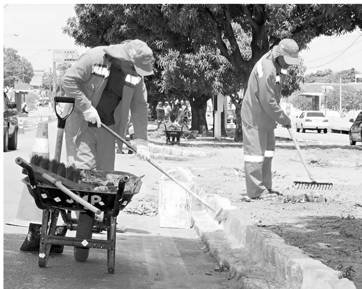
► Enquanto licitação não vem, serviço segue normalmente

O assunto faz referência à Líder, que até dezembro passado possuía contrato com a empresa pública. Na última terça-feira, a companhia publicou no Diário Oficial do Município (DOM) o encerramento do contrato com a empresa. A atitude foi exigida pela Controladoria Geral do Município. “Nós encerramos o contrato no dia 31 de dezembro,