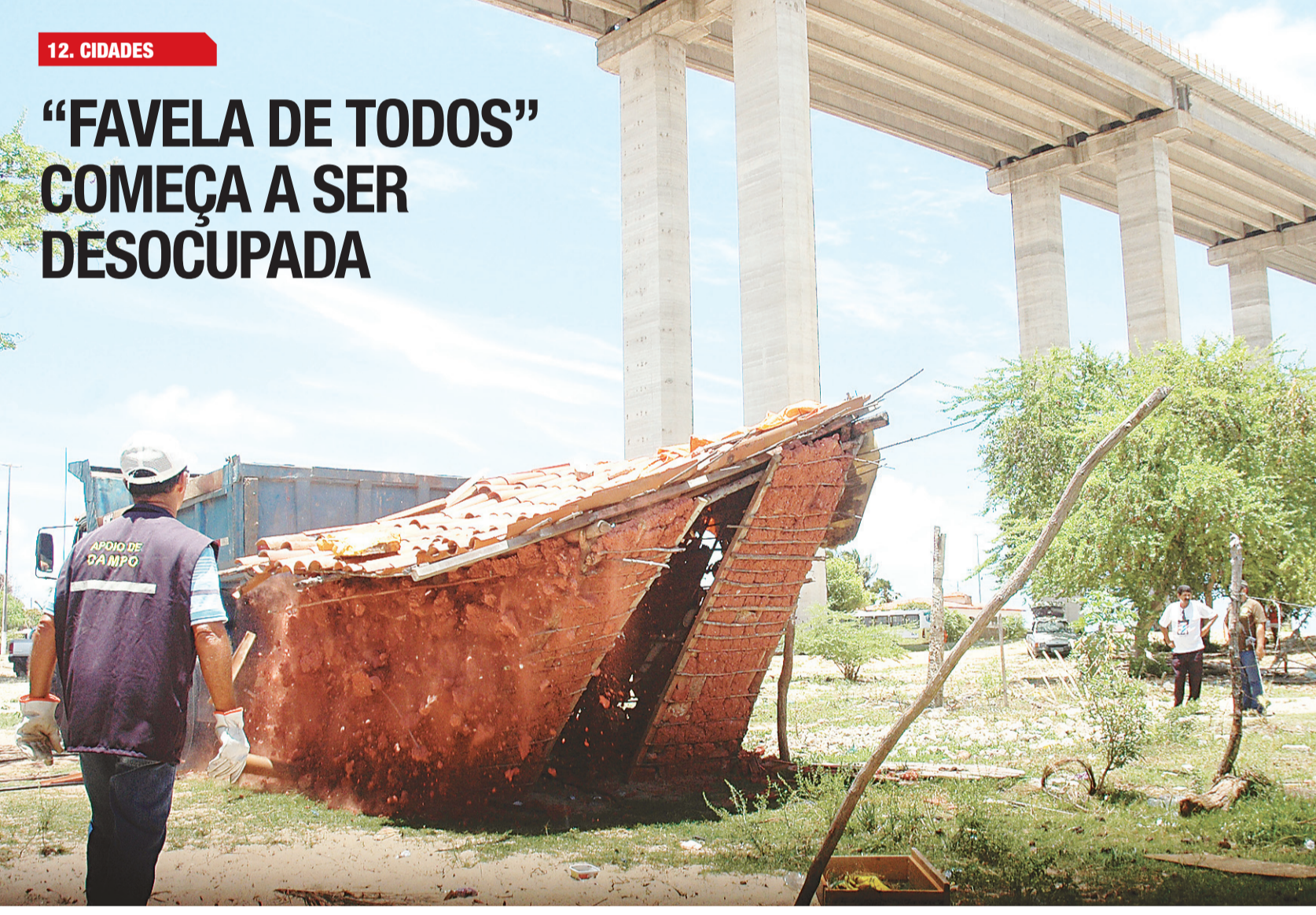
NEY DOUGLAS / NU