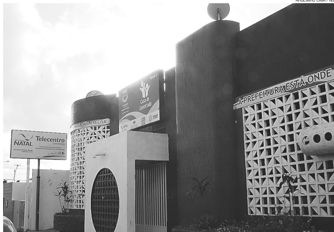
► Telecentro, onde eram realizados os cursos, está fechado