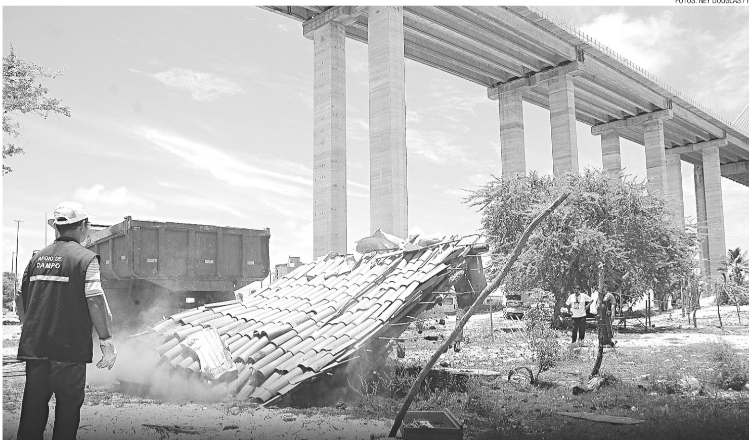
▶ Barracos foram derrubados por um caminhão, no imprevisto; o trator quebrou minutos antes do início da operação

São mais de 200 mil metros quadrados de área, sendo que 96 mil metros quadrados são de propriedade do Município. O restante é dividido em 51 mil m 2 , correspondente à faixa de domínio da Ponte Newton Navarro, do Governo do Estado; e os 77 mil m 2 que sobram são da União. Esta área em especial faz parte da ZPA-8, tendo ainda uma faixa de mangue, considerada Área de Proteção Permanente (APP).