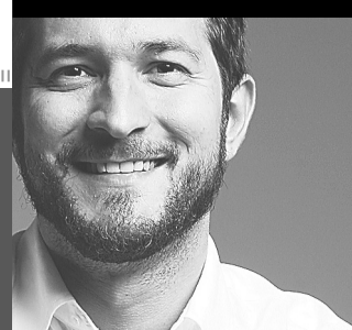
Carlos Fialho escreve nesta coluna aos sábados