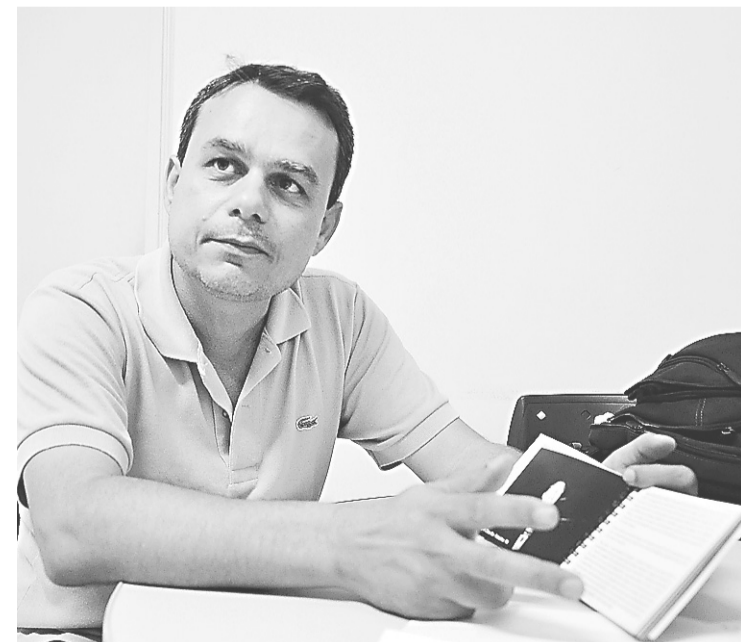
▶ Lições contidas no livro vão além da fotografia, diz autor: valores para a vida