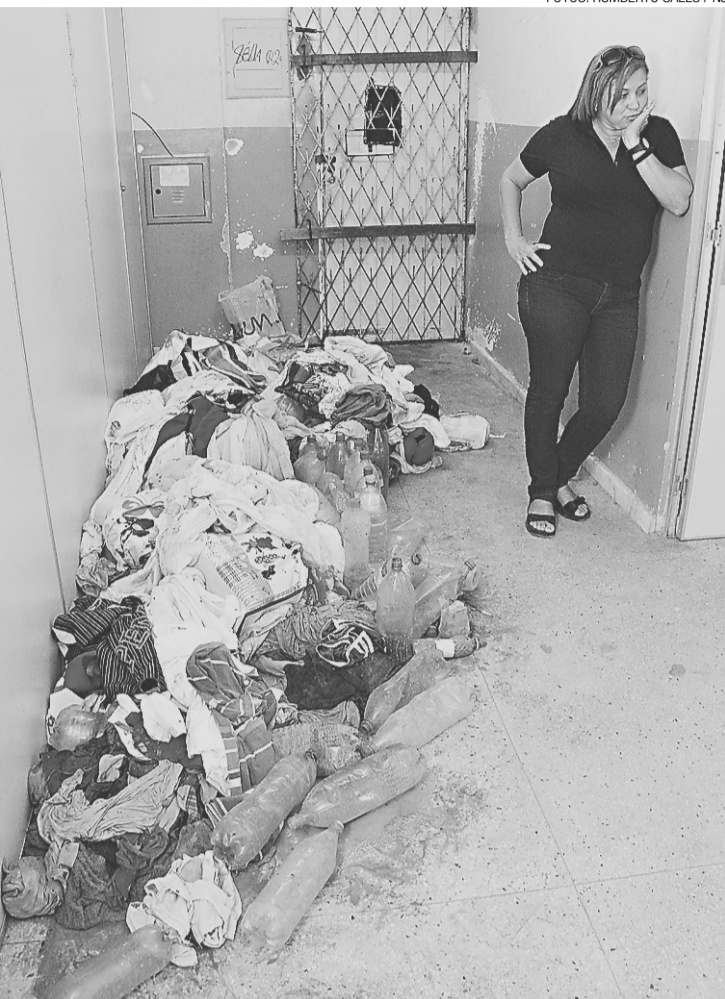
As marcas da tentativa de fuga: saco e garrafas com areia