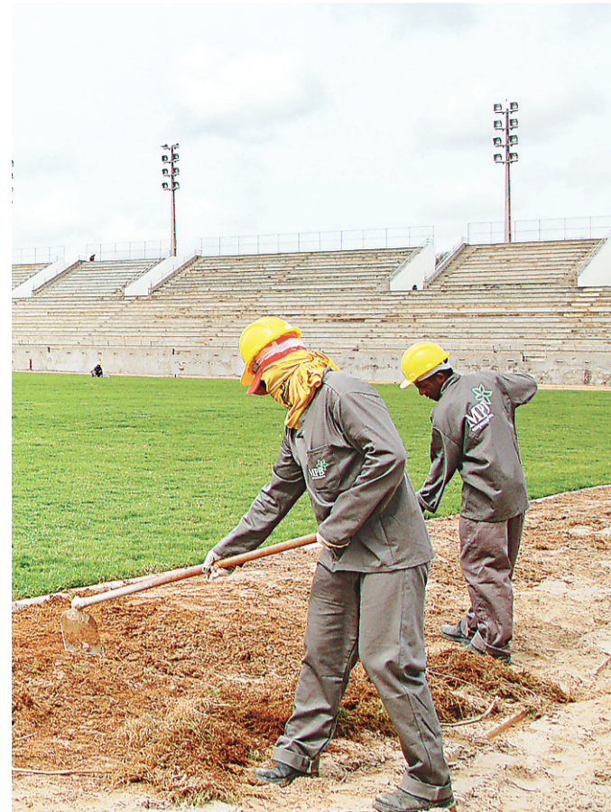
► Estádio deve ficar pronto até dia 15 de abril