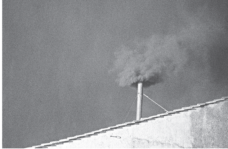
▶ Primeira saída de fumaça indica apenas que seleção começou

Os quartos dos votantes foram selecionados por sorteio. Por volta das 16h15 (12h15 em Brasília), os 115 cardeais votantes se reuniram na capela Paulina e seguirão em procissão até a Capela Sistina, onde entrarão por volta das 16h30 (12h30 em Brasília), e deram início ao