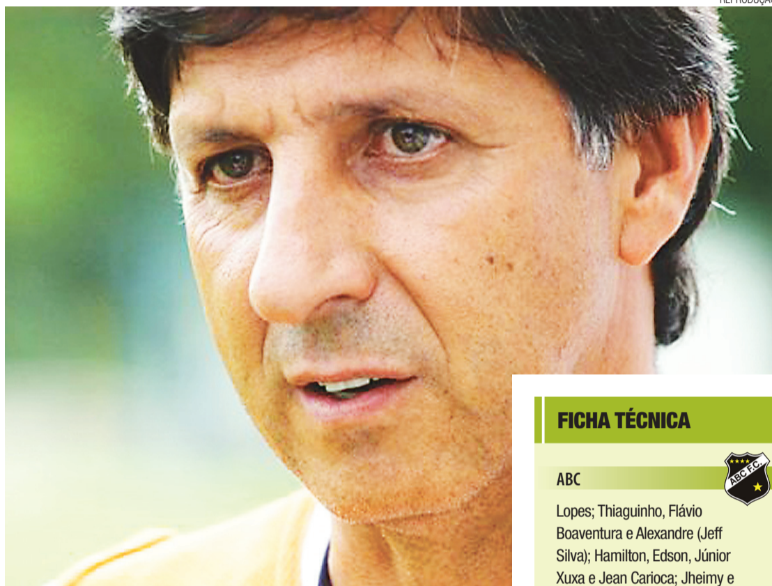
► Novo técnico vai acompanhar a partida da cabine do Frasqueirão