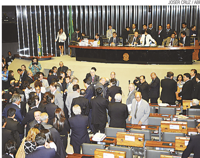
► Sessão do Congresso vota orçamento da União: três meses de atraso

No entanto, a equipe econômica de Dilma Rousseff