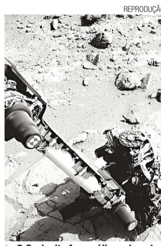
► O Curiosity faz análises do solo

Pousado na superfície de Marte desde agosto do ano passado, o jipe Curiosity tem como missão identificar se o planeta já teve condições de vida.