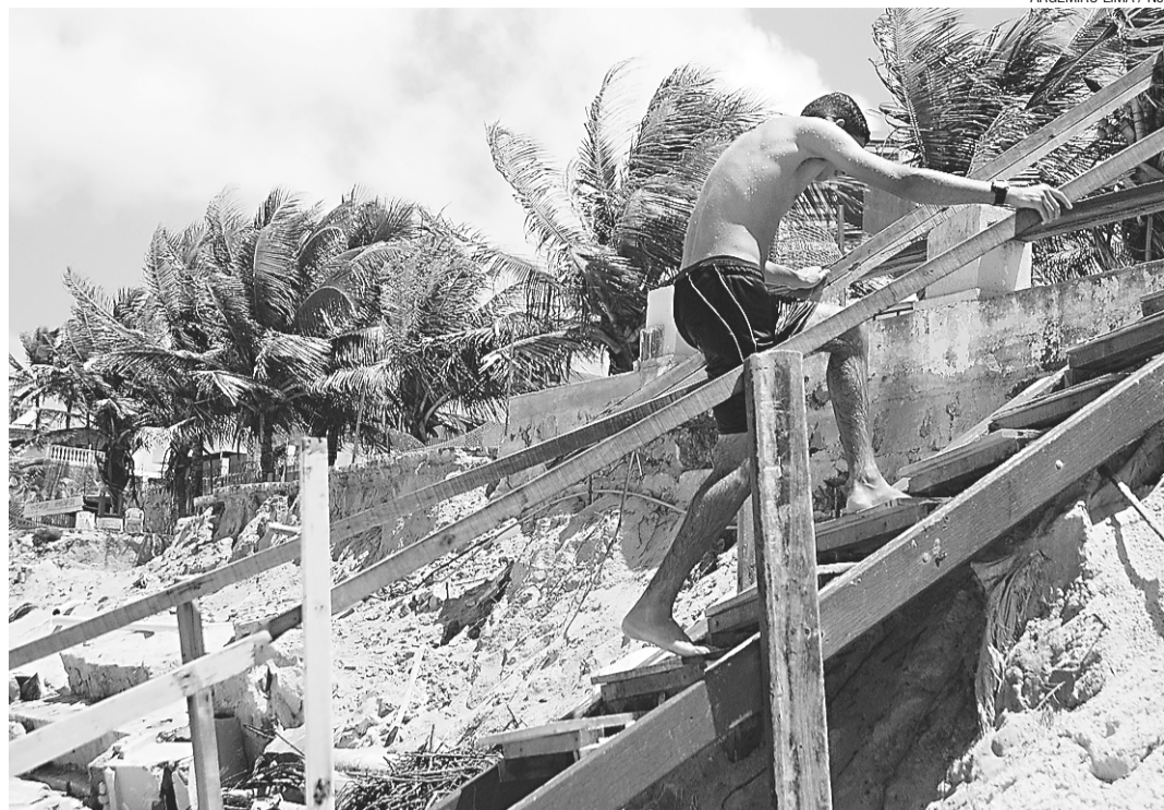
▶ Enquanto solução não chega, banhistas têm de improvisar acesso à praia