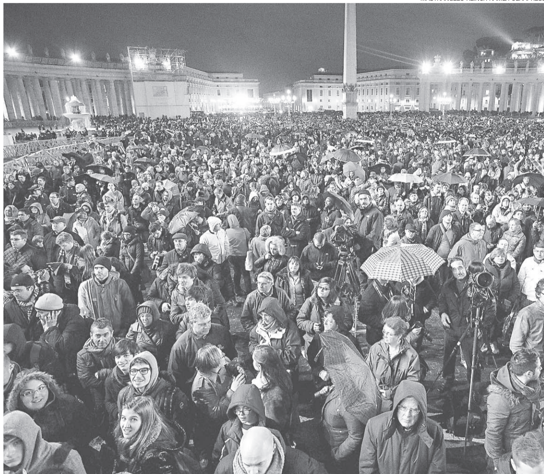
▶ Conclave tem sido acompanhado por multidão que, na praça São Pedro, aguarda o sinal da escolha

O último passo foi o fechamento da capela, o chamado "extra omnis", quando os car-