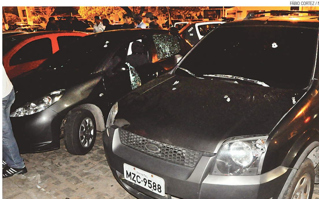
► Os dois veículos dirigidos pelos policiais exibem as marcas do tiroteio

Acreditando que se tratava de bandidos, o tenente (que estava ameaçado de morte) começou a alvejar o Ford EcoSport de placa MZC-9588, onde estavam os civis, que revidaram os disparos. Pelo menos dez tiros atingiram o carro dos policiais civis. Eles são da Delegacia Especializada em Narcóticos (Denarc) e estariam realizando uma investigação.