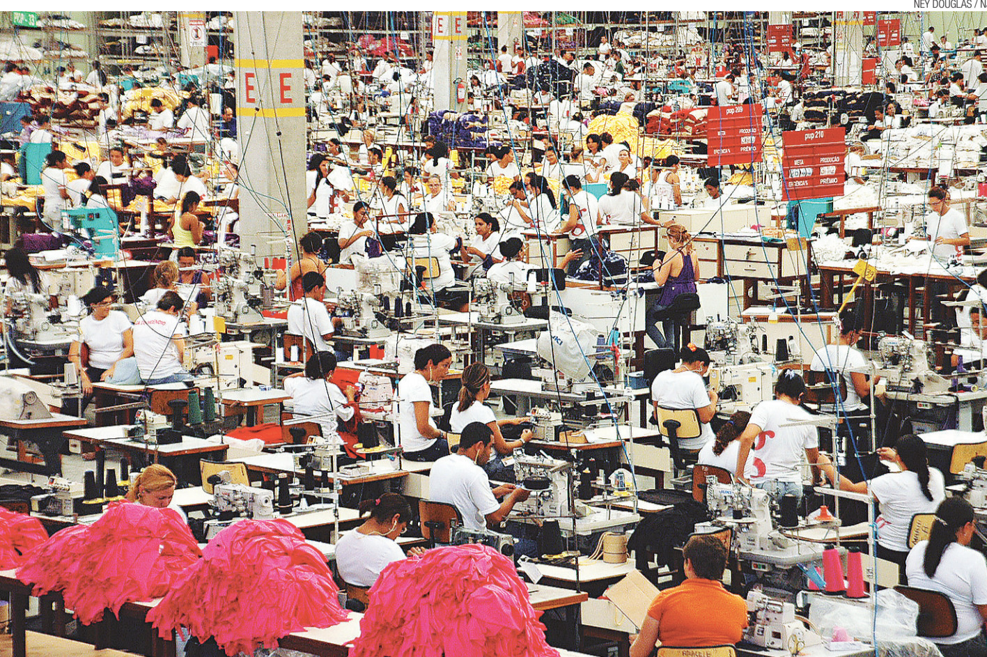
NEY DOUGLAS / NJ

► Proadi gera atualmente cerca de 35 mil empregos diretos na indústria potiguar