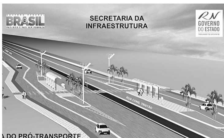
▶ Maquete eletrônica mostra a duplicação da Avenida das Fronteiras