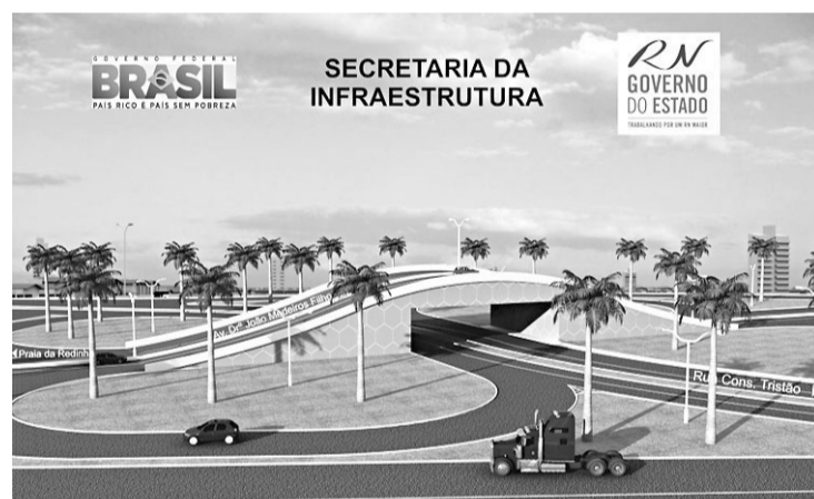
▶ Viaduto de acesso à ponte no lado da Redinha também está no projeto

so dizer que vai acontecer, mas eu quero em 60 dias finalizar o processo para retomar as obras. Esperamos que até abril isso aconteça", afirmou. Todas as intervenções devem estar prontas em 24 meses.