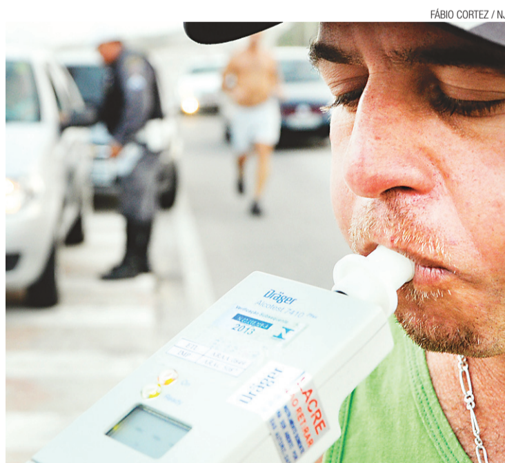
► Operações de fiscalização da PRE vão usar 122 bafômetros

Em 2011, foram registrados 120 acidentes com três mortes nas estradas estaduais, enquanto que em 2012 ocorreram sete mortes em 76 acidentes. Os números do ano passado apontaram uma