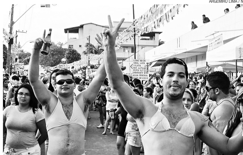
► Virgens de Pirangi, bloco que vai animar a segunda-feira

Sábado a terça-feira - Nestas praias de Nísia Floresta, a folia se divide em dois polos, Búzios e Camurupim, com os seguintes grupos locais: Remix, Estilo Pegado, Safadões de Luxo, Top 10 e Banda Fenix se revezando nos dois palcos até a terça-feira de carnaval. Em Búzios o palco será armado onde acontecia o "Skol Beat", com programação diária das 18h às 22h. Já em Camurupim, o palco será armado na Pedra Oca, com música garantida das 16h às 20h, menos na segunda-feira, dia reservado para o tradicional bloco "Barreta Gay".