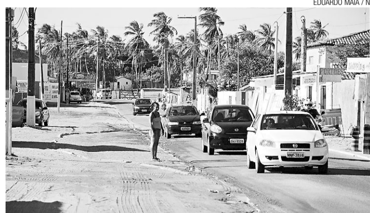
▶ Situação atual da avenida

Com três alças de acessos construídas, o viaduto necessita ainda de outro acesso para alcançar a Avenida Tocantínia, no bairro de Potengi. Para isso, parte de uma escola estadual será