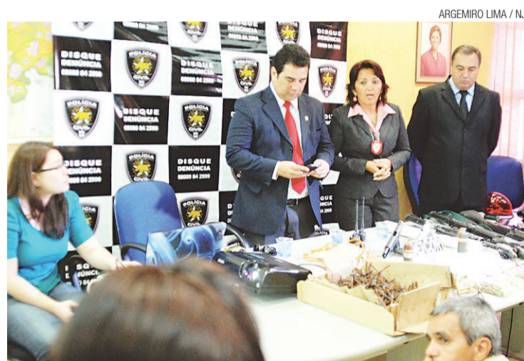
► Cúpula da Segurança Pública comemora prisão de quadrilha perigosa