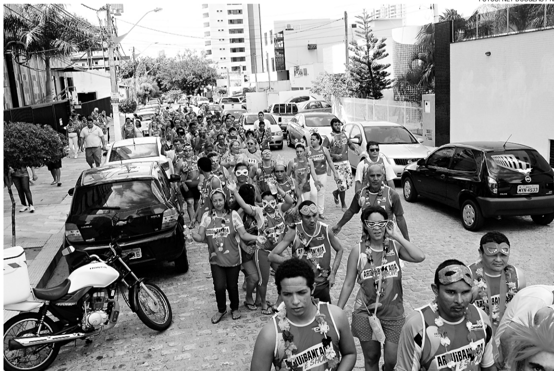
► Bloco Saúde Mental na Folia reuniu cerca de 80 pessoas entre funcionários, familiares e pacientes do Hospital Severino Lopes

O bloco animado pela Escola de Samba Unidos de Ceará-Mirim, uma tímida agremiação carnavalesca, saiu do hospital com abadás e adereços pela Rua Múcio Galvão, Avenida Romualdo Galvão até a praça. A coordenação da festa queria uma interação entre a comunidade e os pacientes, que todos brincassem juntos. Isso não aconteceu, mas os componentes do bloco se divertiram. Sambaram