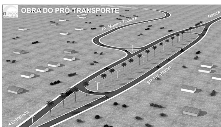
▶ Moema Tinôco também será duplicada

Em seguida, a Avenida Moema Tinôco será duplicada até o entroncamento com a BR-101 Norte. Estão previstas obras de giratórios que servirão de acessos ao futuro Aeroporto de São Gonçalo do Amarante. Ao longo do trecho, serão feitas intervenções para reconstrução de calçadas e instalação de