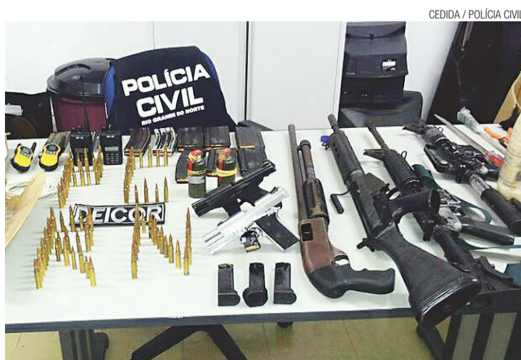
► No material apreendido estão fuzis AR-15 de uso restrito do Exército