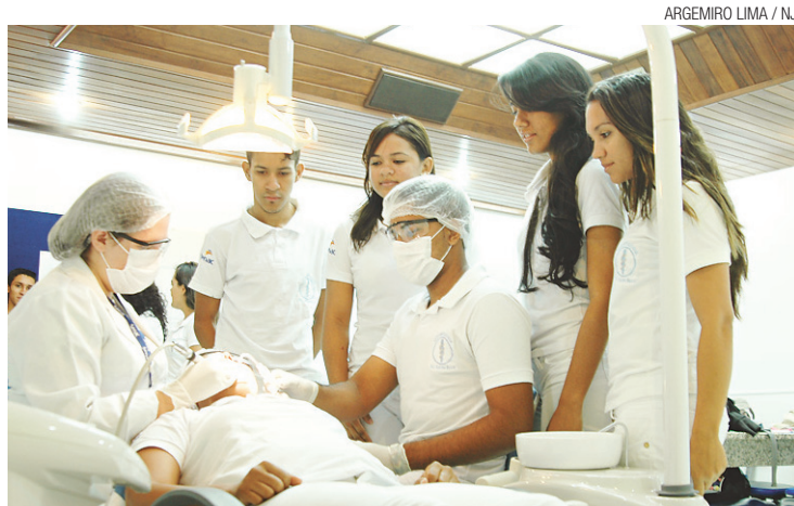
▶ Saúde bucal é um dos cursos técnicos em alta entre os jovens

Para saber que cursos deve ofertar, o Senac usa os dados do