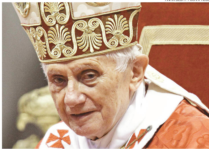
► Bento 16 editou 'motu proprio' para acelerar a eleição

O "motu proprio" editado pelo pontífice endossa a tese de que a demora habitual não faria sentido nesta sucessão, já que os cardeais não precisarão esperar um período de luto antes de escolher o novo líder da igreja.