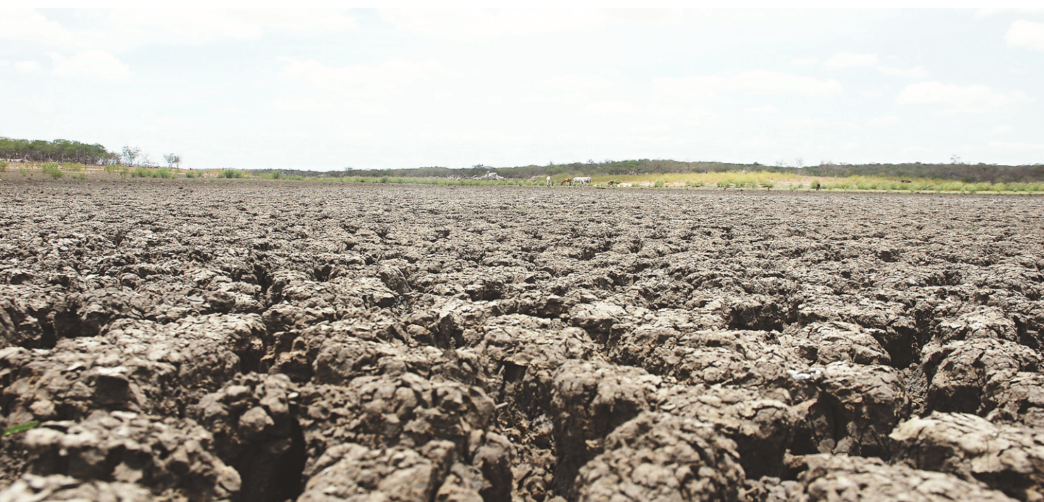
▶ Em muitas áreas do sertão o que se vê é o chão rachado pela falta de chuva