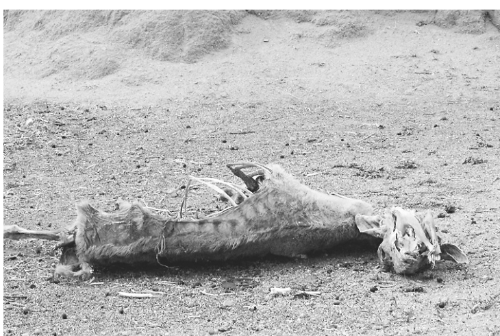
► Fazenda Gavião, em Lajes do Cabugi: animais morrem mas não são enterrados