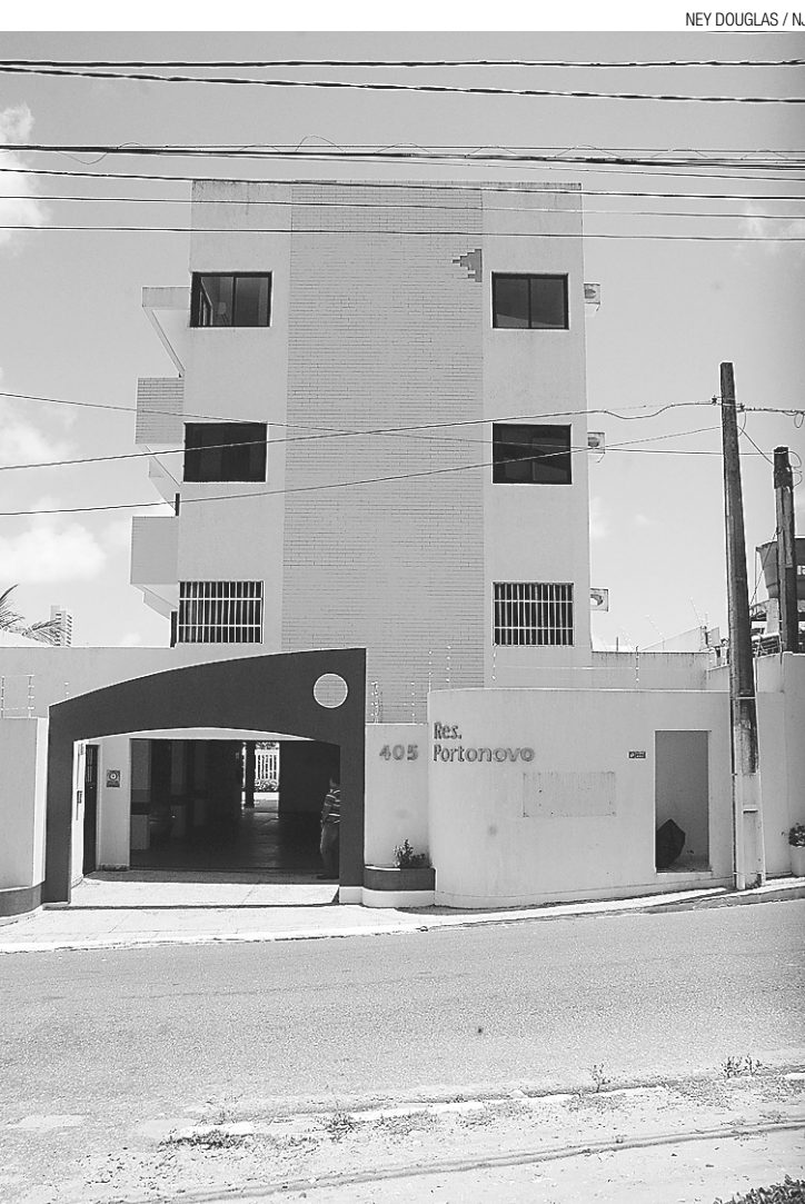
► Edifício Residencial Portonovo, palco do crime