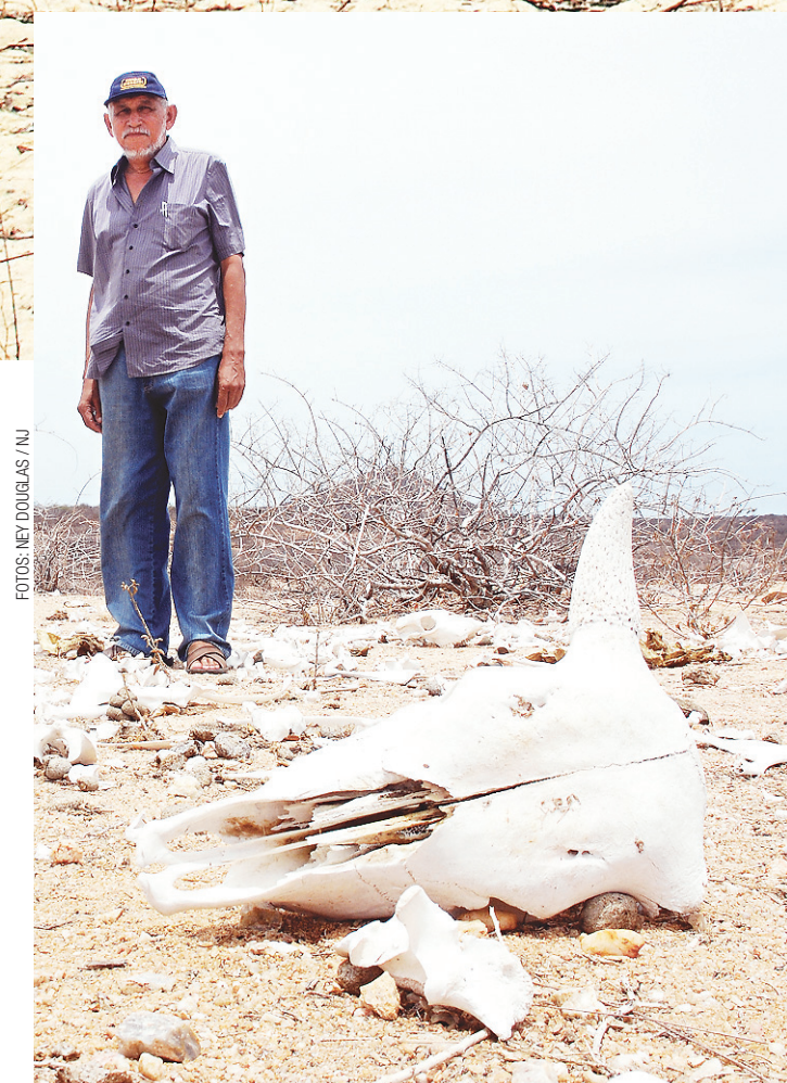
► Sítio Canto de Vara, em Apodi: o que restou de uma plantação de caju