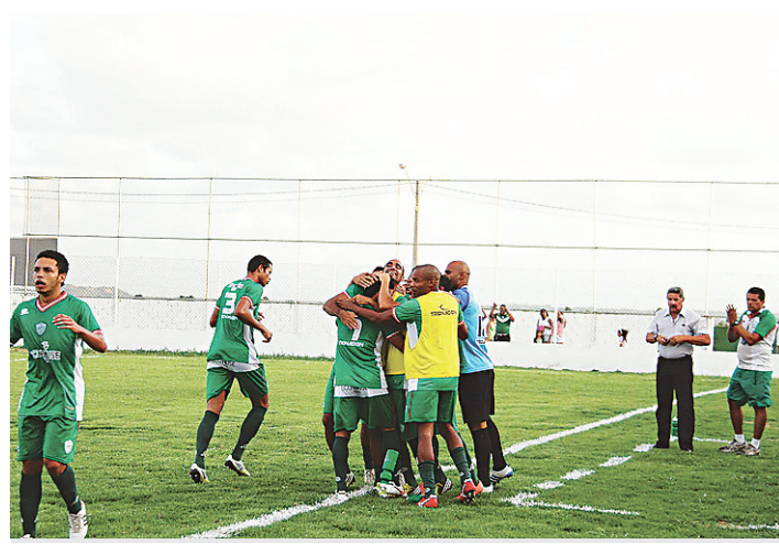
▶ Atletas do Periquito comemoram mais uma vitória