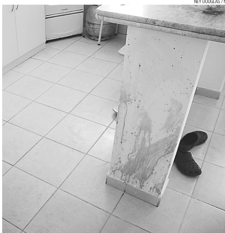
► No interior do apartamento, marcas de sangue

o marido costumava jogar pôquer com os amigos até tarde, chegando ao apartamento quase sempre só com o dia raiando. “Toda noite ele jogava e só chegava lá pras 4h. Ele era confiante, sempre achava que ia ganhar dinheiro”, relatou.