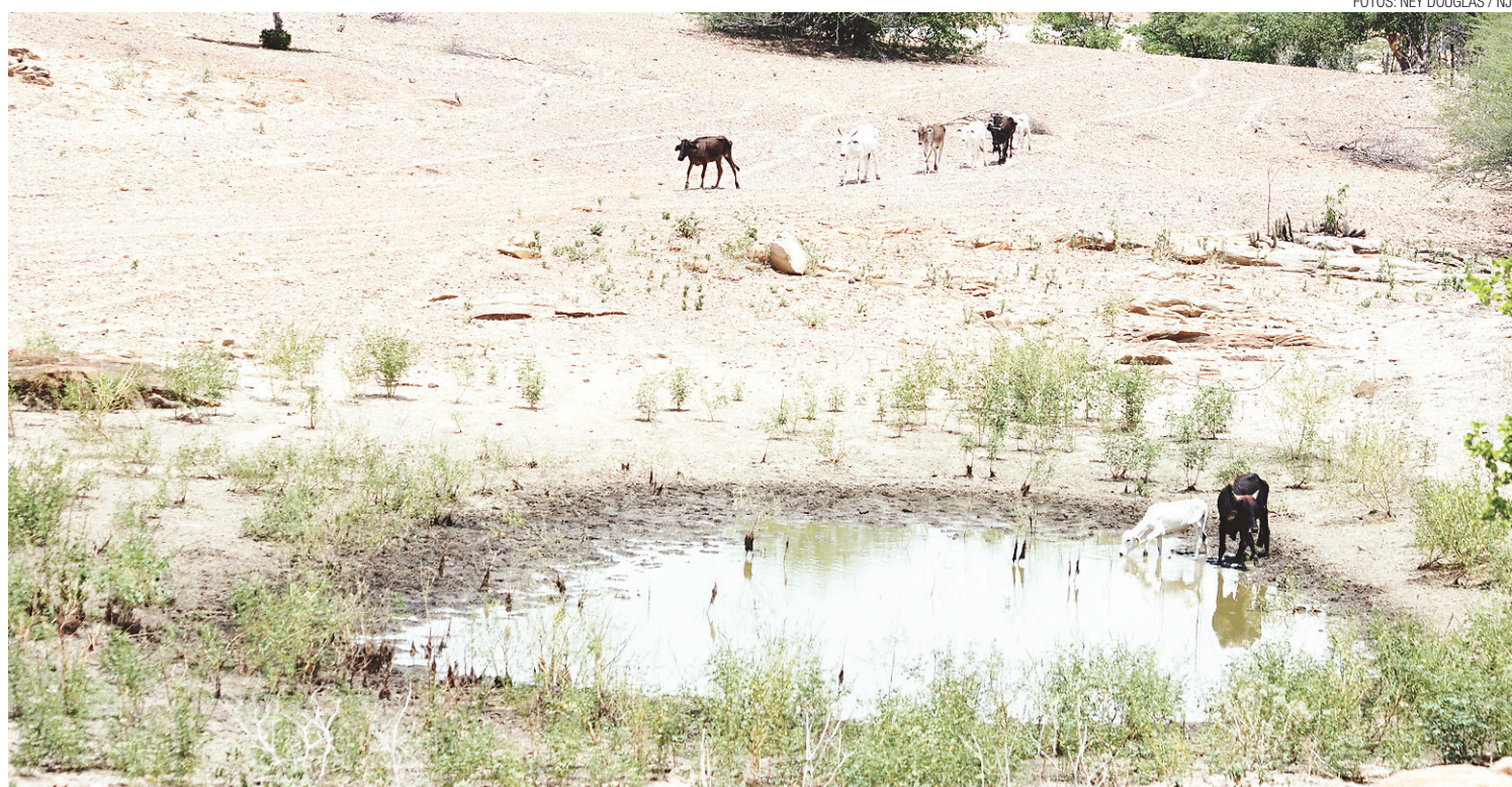
▶ Fazenda Pedreiras, em Caicó: o gado procura mas quase não encontra água

Ele também tem dificuldades para contratar pessoal. Os programas do governo federal, criticou, afastaram a mão-de-obra. Mesmo pagando R$ 30,00 por meio-dia de trabalho, é cada vez mais escassa a mão-de-obra para queimar sodoro.