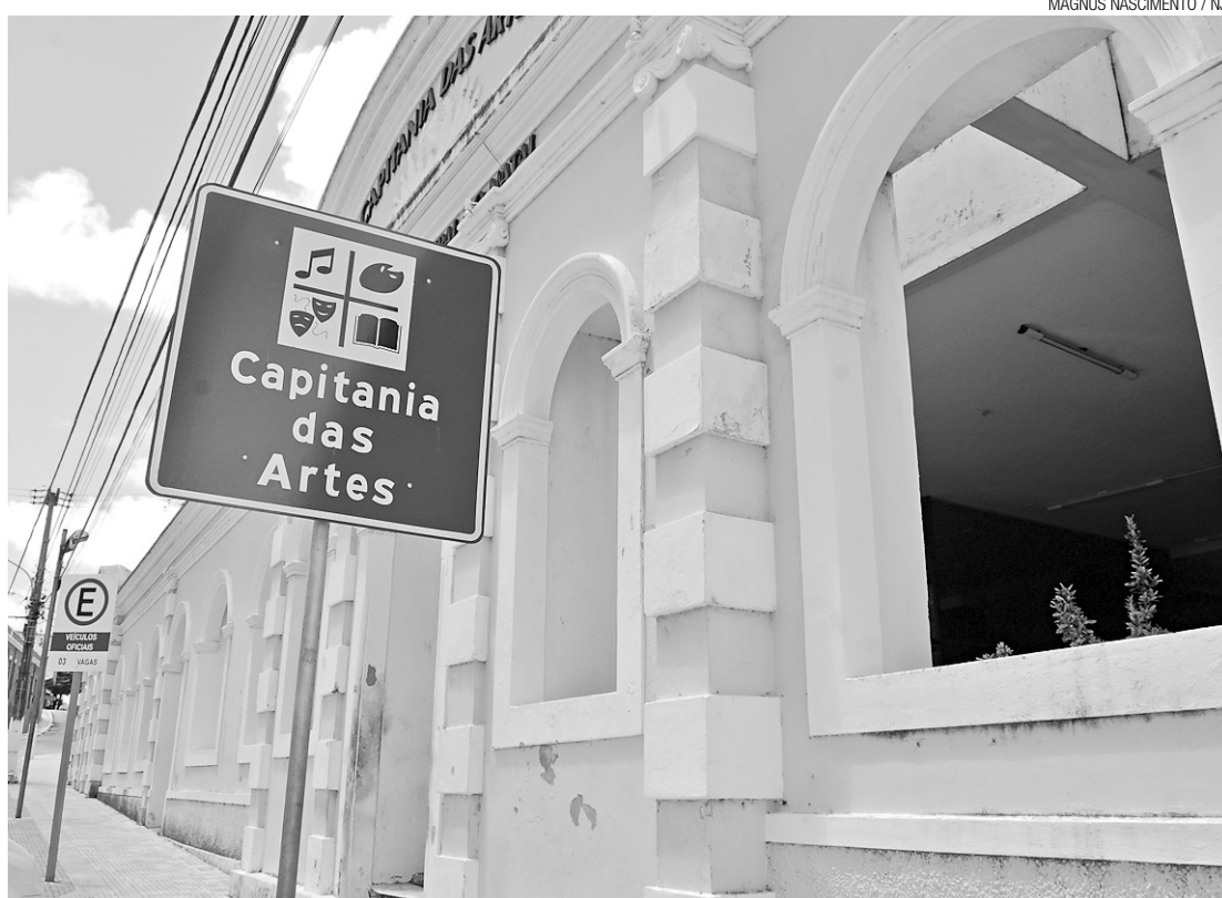
► Funcarte terá petista como secretário adjunto