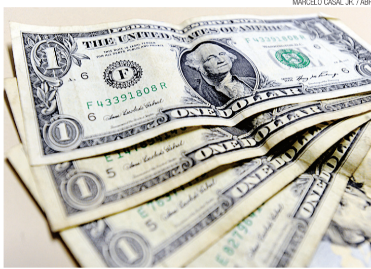
▶ Dólares americanos: flutuação controlada, mas não para conter preços

A nova atuação do BC neste mercado reflete a preocupação da autoridade em relação à forte saída de dólares do país, que tem sido muito maior do que a entrada. Foram divulgados ontem os dados da balança comercial