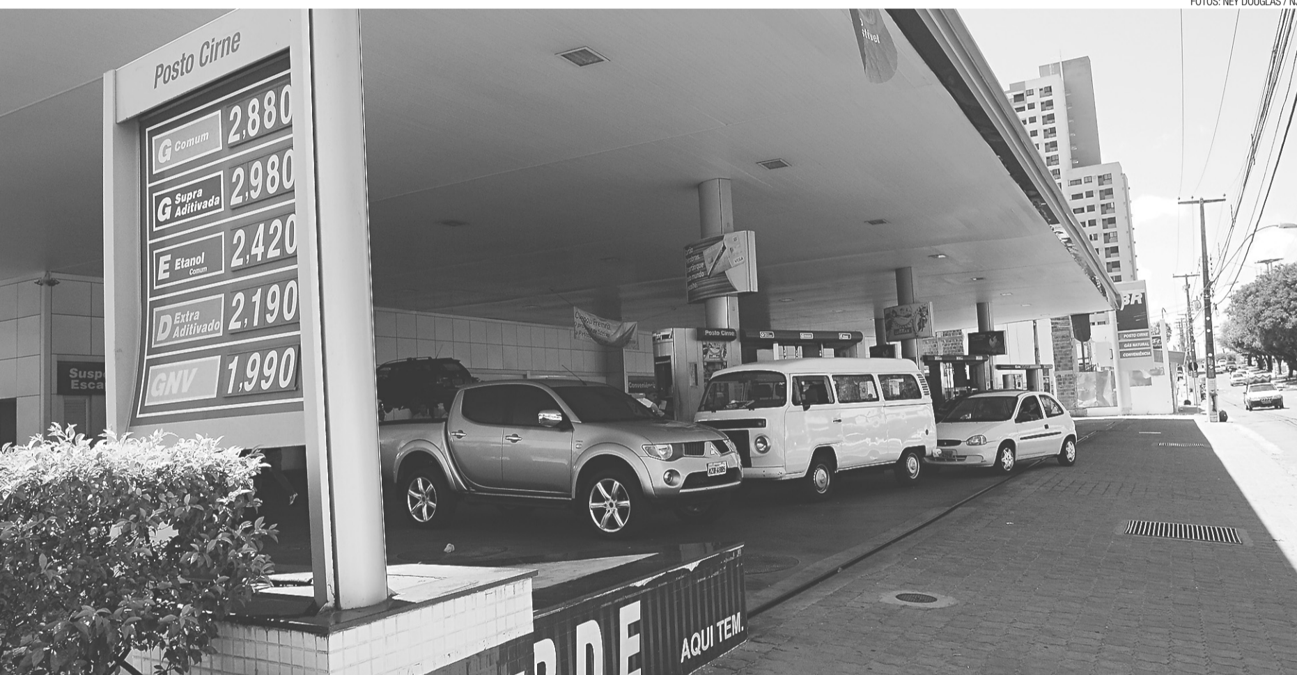
► Um dos postos onde o combustível já havia sido reajustado na manhã de ontem: R$ 0,10 a mais