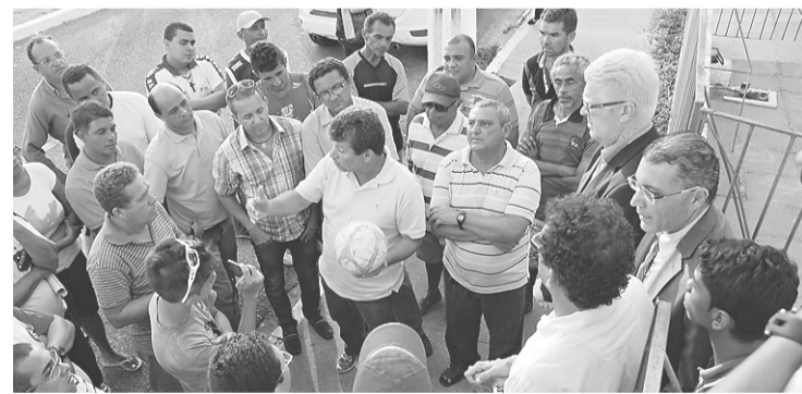
▶ Moradores do bairro acompanham resultado das reuniões

Ele conta que a ideia é manter o acesso da população ao local de forma gratuita, porém oferecendo uma estrutura melhor. Também há a expectativa de que os novos projetos do Instituto no eixo Ribeira-