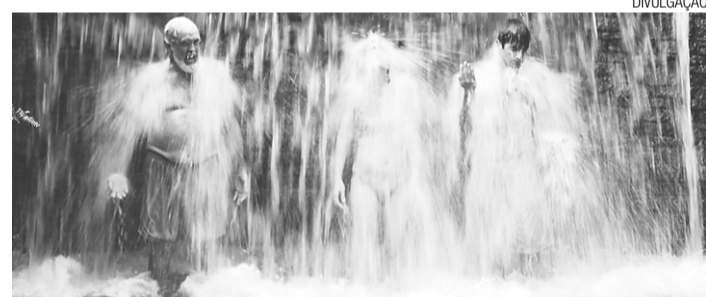
► "O Som ao Redor" contou com verba do Ministério da Cultura e Petrobras

"Não sou eu que estou inventando a roda, faço parte de outra geração e já tem uma galera nova surgindo. Acho que o que estamos tentando fazer é firmar esse segmento aqui porque não há trabalho coletivo em Natal e no RN. Na Paraíba, eles trabalham da seguinte forma: não tem verba? então todo mundo se junta para fazer o seu projeto e depois você ajuda a formar o projeto de todo mundo e isso vai gerando uma expansão", explica.