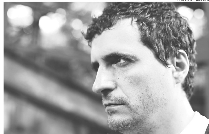
► Kleber Mendonça Filho, diretor do filme "O Som ao Redor"

"Eu acho que esse edital mostra um respeito muito grande pelo que está sendo feito aqui. E o maior retorno desse edital foi a repercussão de O Som ao Redor e de outros seis filmes pernambucanos no último Festival de Brasília", cita.