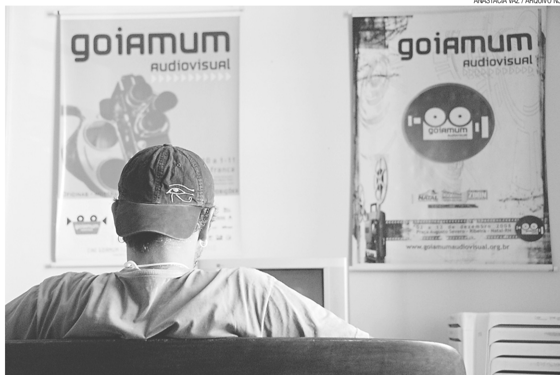
► Festival Goiamum tem tudo para acontecer novamente no final deste ano, mas depende de patrocinadores

"A gente está carente de incentivo municipal e estadual. Não existe um edital exclusivo para o audiovisual em nenhuma das duas esferas. O único municipal que tive conhecimento aconteceu há quatro anos, chamava-se Cine Cordel e o prêmio