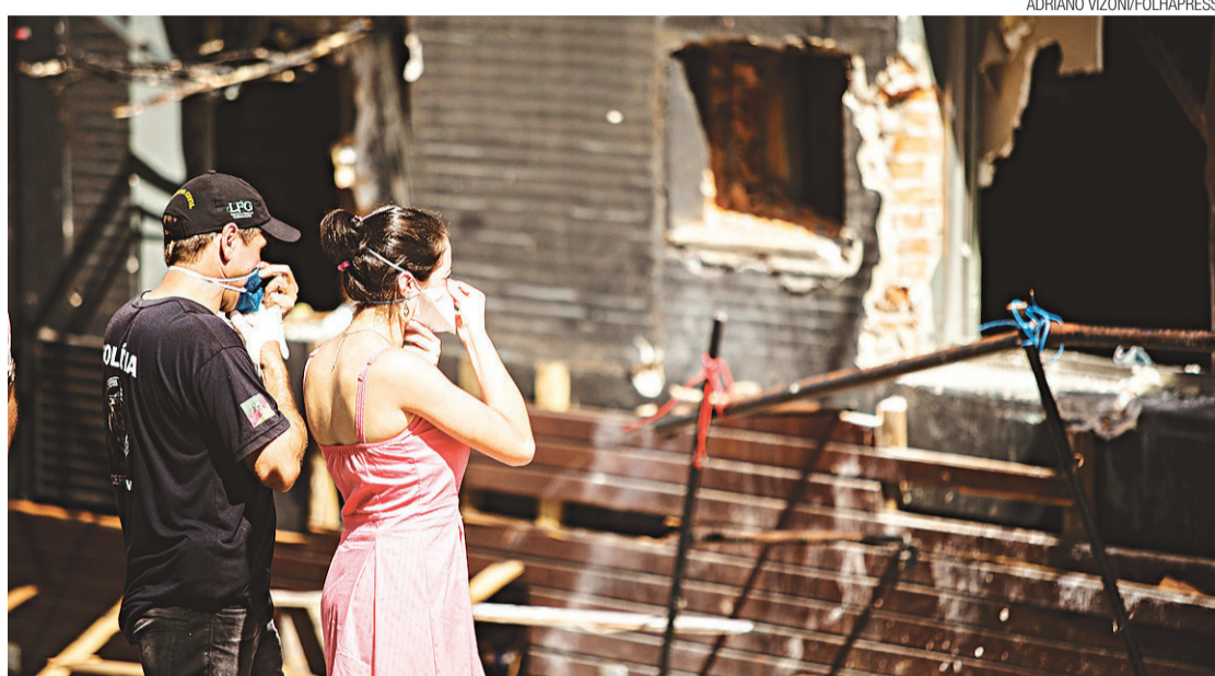
▶ Jovem participa de reconstituição na Boate Kiss, em Santa Maria/RS: reações em todo o país

mesmo uma borracharia que se transformava em danceteria à noite, no bairro do Rio Vermelho, o mais boêmio da cidade. O local não tinha alvará para funcionar como boate. Todos os três espaços interditados disseram que vão se regularizar nos próximos dias.