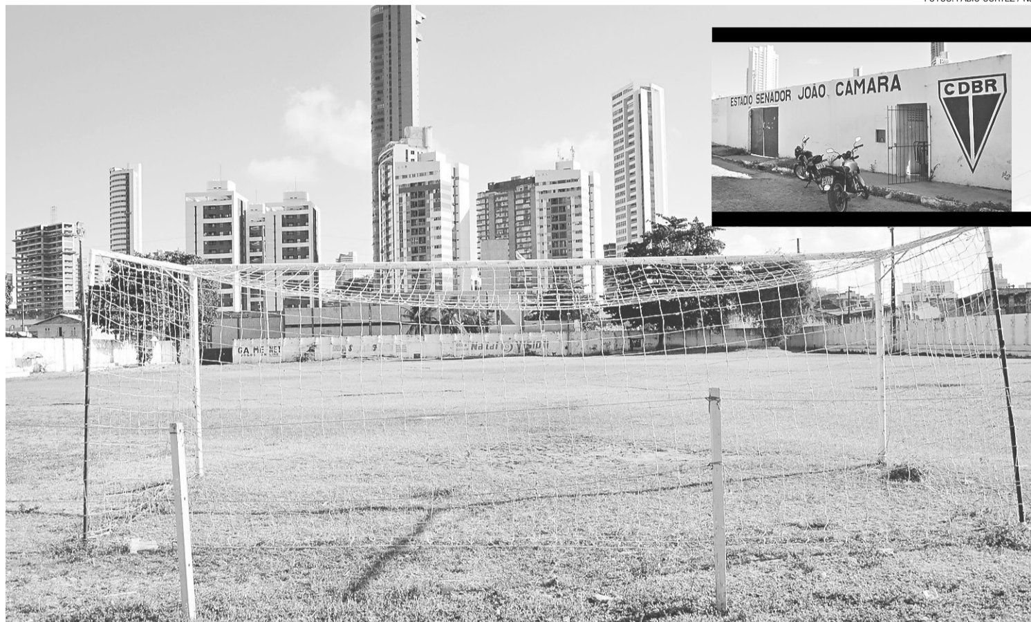
▶ Estádio João Câmara, na Ribeira, onde craques do passado despontaram para os grandes times da cidade