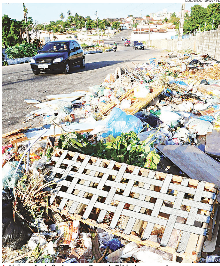
► Lixão na Av. do Contorno, no Passo da Pátria deve aumentar

A dívida milionária com as prestadoras de serviço na área de coleta de lixo não é o principal problema enfrentado pelo terceiro prefeito a assumir o palácio Felipe Camarão nos últimos 45 dias. A folha de pagamento de dezembro