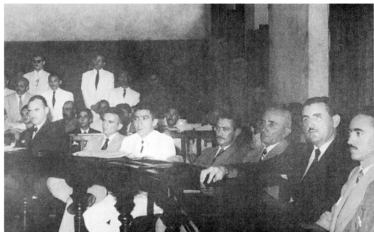
► Reunião do partido na antiga sede da Assembleia, na Getúlio Vargas

fazer um grande estrago no DEM, Kassab criou o PSD, mas totalmente pluripartidário", diferencia.