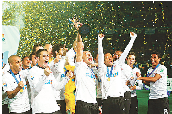
▶ Depois da alegria em campo...

Coincidentemente, foi na Alemanha que o Chelsea conquistou a Copa dos Campeões, que o credenciou para ir ao Mundial de Clubes. Após o título em Yokoha-