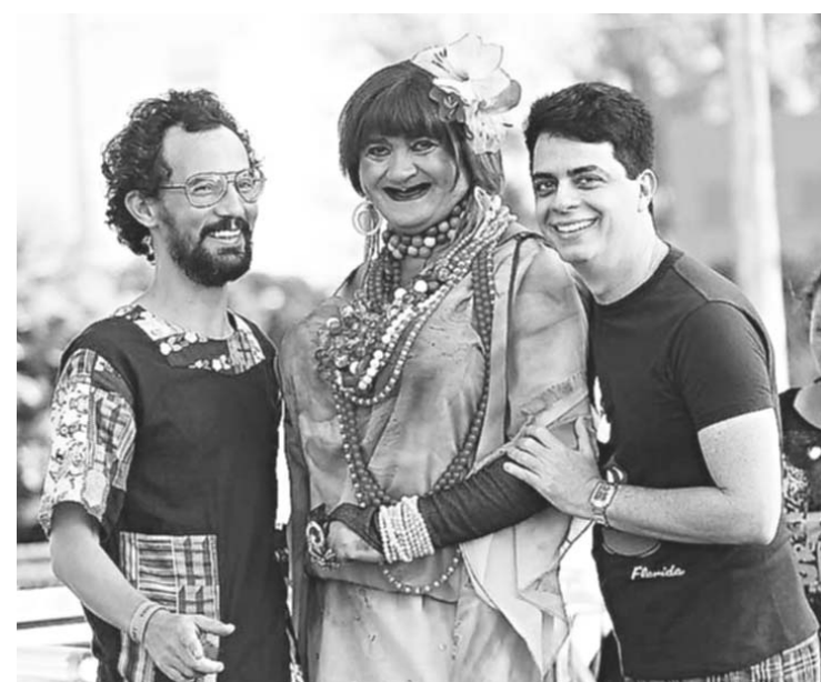
▶ Apesar do impasse, foliões brincaram a valer no último domingo

No mês passado, um túnel de três metros de extensão foi descoberto após uma operação batizada de "Pente Fino". A escavação estava sendo feita de uma cela localizada no pavilhão B. Quem fez parte dessa ação foi um grupo formado por agentes penitenciários e policiais militares.