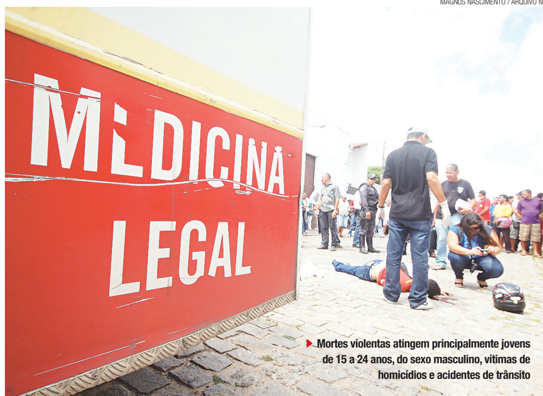
► Mortes violentas atingem principalmente jovens de 15 a 24 anos, do sexo masculino, vítimas de homicídios e acidentes de trânsito