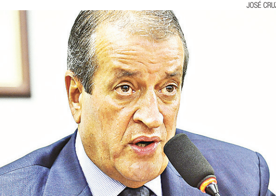
► Valdemar Costa Neto

"A interpretação proposta afirma que, nos casos mencionados de improbidade administrativa contida no tipo penal e em condenação superior a quatro anos, a suspensão dos direitos políticos poderá ser decretada pelo Judiciário, por outro lado, permanece às casas legislativas o poder de decidir sobre cassação em diversos outros casos, especialmente em condenações penais menores que quatro anos", disse.