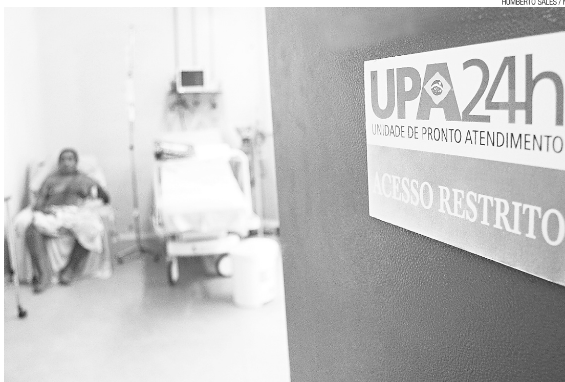
► Na próxima gestão, prefeitura vai gerir a UPA de Pajuçara e os Ambulatórios Médicos Especializados