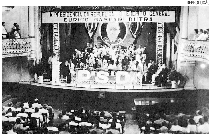
► A primeira convenção do PSD no Teatro Alberto Maranhão

Antes de prosseguir na conversa, Lauro faz questão de dizer que o PSD que ele apresenta em 242 páginas nada tem a ver com o PSD fundado por Gilberto Kassab, no ano passado, quando o ex-prefeito de São Paulo se desligou do Democratas [DEM]. "Aquele PSD foi extinto em 65, em um ato institucional nº 2 e está completamente ligado à reforma política do Estado Novo. Ano passado, depois de