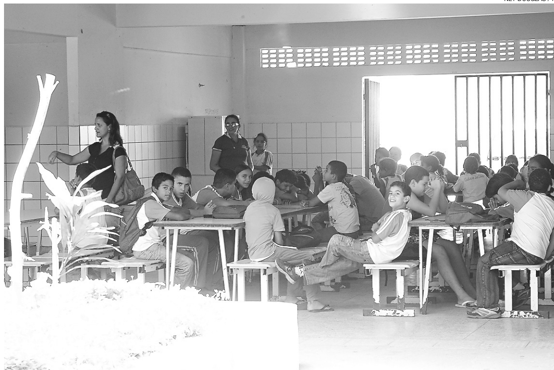
► Unidades da rede municipal de educação suspenderam o ano letivo por falta de condições estruturais

A futura secretária de Educação comenta ainda que, em princípio, não dá para falar em ampliação da rede para atender mais alunos no próximo ano. "Sei que há uma demanda reprimida. Quase cinco mil crianças sem matrícula nesse ano. Não sei se teremos espaço para já ampliar nesse ano", diz.