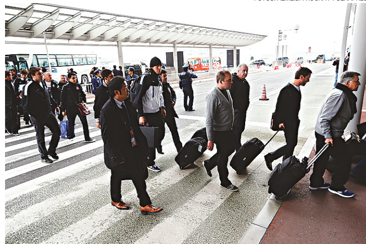
▶ ...jogadores e comissão técnica embarcam para a festa no Brasil

Se a festa de despedida feita pelos torcedores do Corinthians quando o time embarcou para o Japão já foi gigante, o Aeroporto de Guarulhos e a Polícia Militar esperam farra ainda maior na recepção ao elenco que conqui-