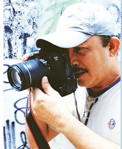
VANESSA SIMÕES / NU