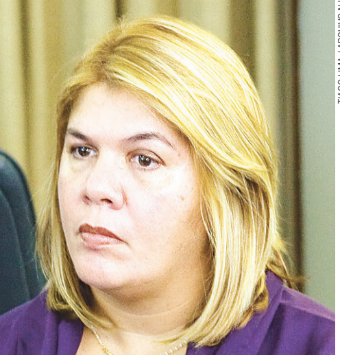
TAGO LIMA / ARQUIVO NU