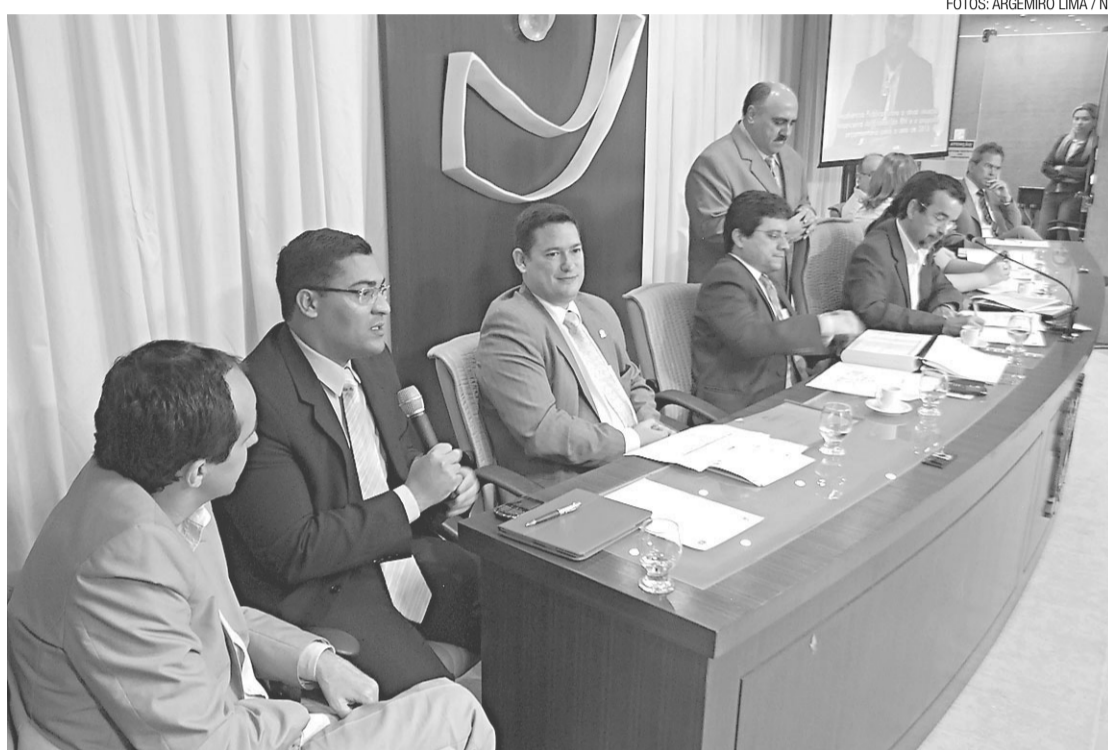
► Representantes dos três poderes discutiram situação financeira do governo

As sucessivas reivindicações para o cumprimento integral dos repasses de dotações orça-