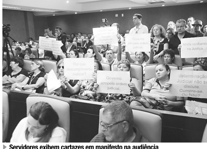
Servidores exibem cartazes em manifesto na audiência

As reclamações se concentraram na forma como o Governo tratou propostas enviadas pelo Ministério Público e Poder Judiciário, assim como previsões de repasses para áreas de saúde, educação e assis-