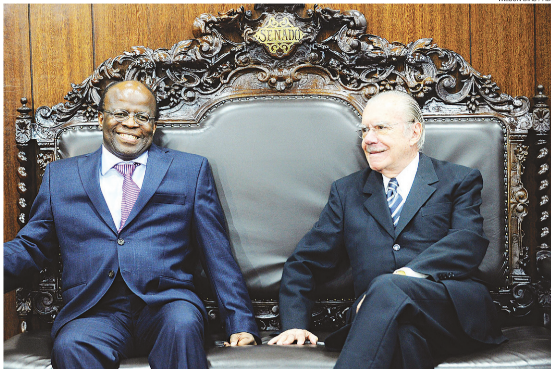
▶ Joaquim Barbosa, em visita ao Senado, explicou que prisão especial só vale para presos provisórios

Em seguida, acusou os "jornalões" de serem alinhados ao PSDB e disse que os meios de comunicação "não se tocaram até agora que a imprensa não dá a vitória [em eleições] a ninguém". Os advogados de Dirceu aguardam a publicação do acórdão do STF