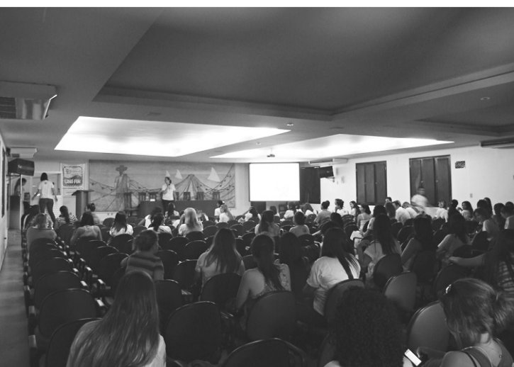
► I Encontro de Nutrição UNI-RN será realizado até hoje

É o número de estudantes do UNI/RN que realiza o estudo qualitativo “Educação nutricional nas escolas”