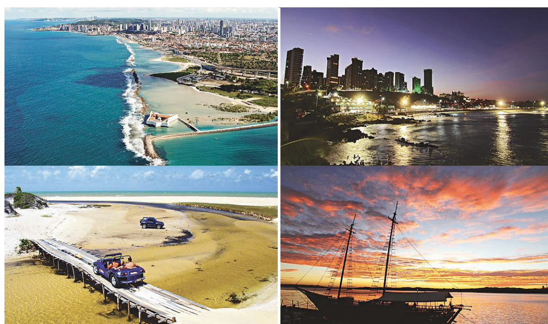
► A maioria das fotos foi produzida com máquinas Canon de três a 18 mega pixels