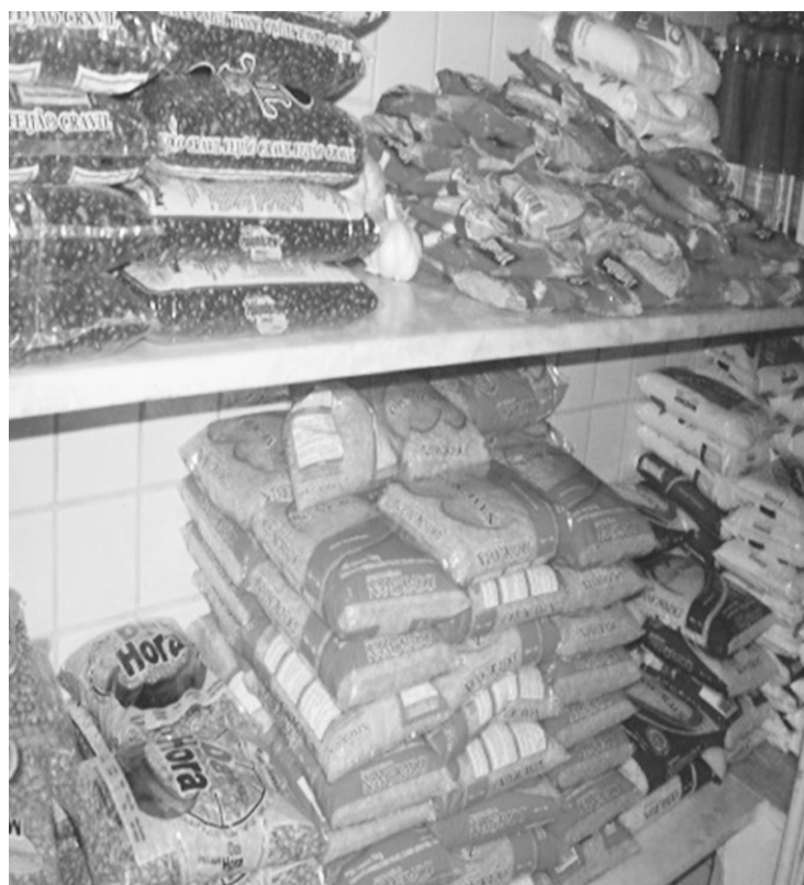
► Fotos tiradas pelos universitários mostram o armazenamento dos alimentos não perecíveis na dispensa e a única geladeira da escola: precariedades

Hoje, Rayra vê o outro lado da moeda. Cursando o segundo ano de Nutrição no Centro Universitário do Rio Grande do Norte (Uni-RN), ela integra o grupo de 42 estudantes que realiza o estudo qualitativo “Educação nutricional nas escolas”, reunindo informações sobre a merenda escolar na rede