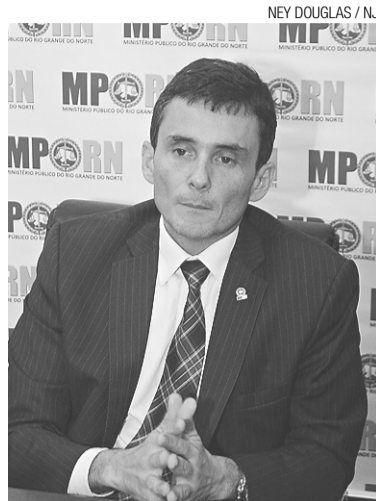
NEY DOUGLAS / NU

A ação aguarda pronunciamento conclusivo da juíza Tatiana Socoloski, relatora, numa das câmaras