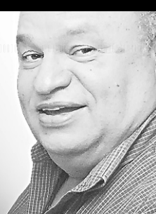
Roberto Guedes escreve nesta coluna às quartas-feiras