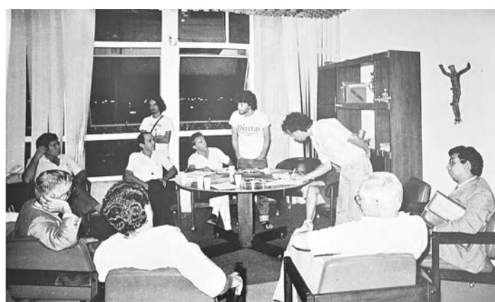
► Reunião de negociação entre dirigentes do DEC e da reitoria da UFRN