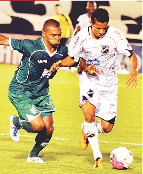
► Pardal fez um dos 3 contra o Guarani

ABC VENCE EM CASA E SE DISTANCIA DA 'ZONA BAIXA'