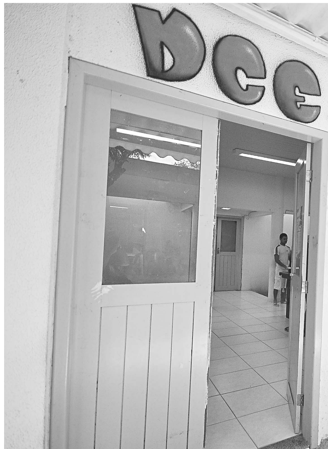
▶ Diretório Central dos Estudantes da Universidade Federal do Rio Grande do Norte, fundado em 1959, vai realizar no próximo mês sua 53ª eleição para a escolha da nova diretoria

/ UFRN / EMBORA MANTENHA PRESENÇA EFETIVA EM MOVIMENTOS POPULARES COMO O RECENTE #REVOLTADOBUSÃO, O DIRETÓRIO CENTRAL DOS ESTUDANTES - QUE FORJOU LIDERANÇAS PARA A POLÍTICA POTIGUAR - PASSA POR PROCESSO DE ESVAZIAMENTO