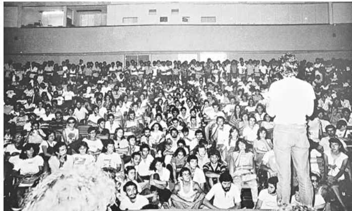
► Plenária dos estudantes antes da ocupação da reitoria em 1984