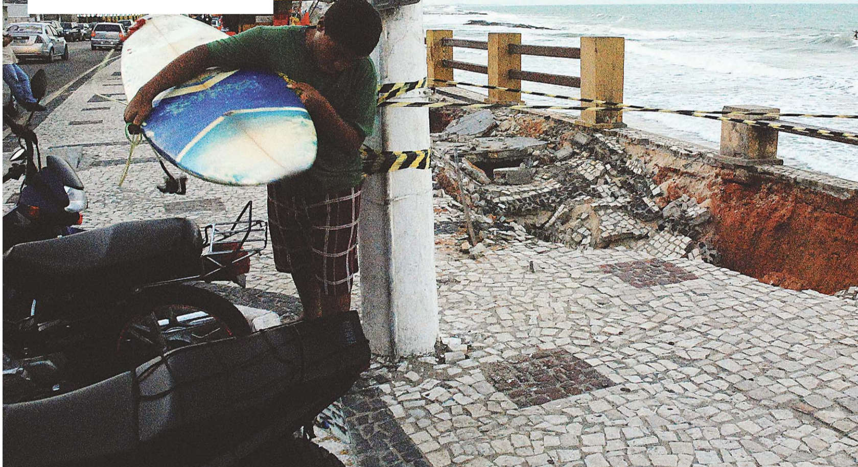
► Erosão que começou há cerca de um mês no calçadão da Praia dos Artistas aumenta e provoca transtornos. Recursos para restauração, só em 2013