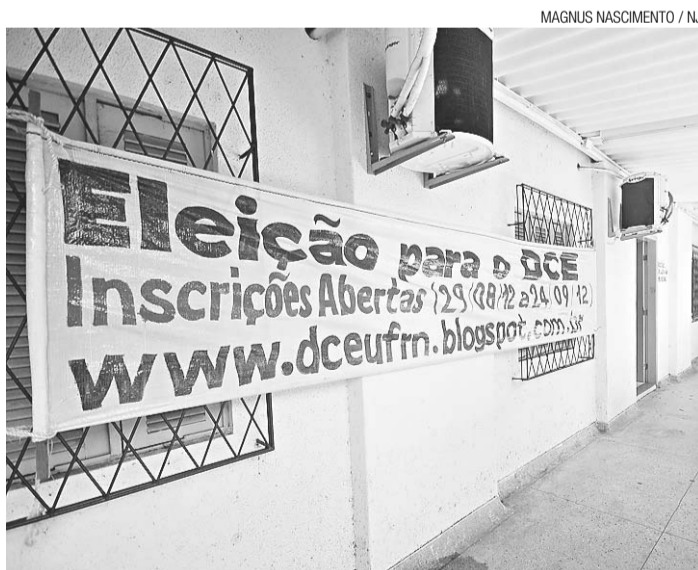
► Até o momento nenhuma chapa se inscreveu para as eleições