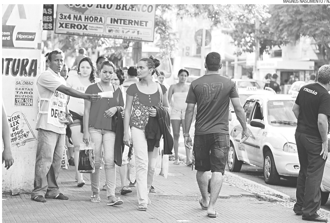
MAGNUS NASCIMENTO / NJ

A CONCENTRAÇÃO DE renda na mão de poucas pessoas é uma realidade no Rio Grande do Norte. De acordo com a Pesquisa Nacional por Amostra de Domicílio 2011, divulgada ontem pelo IBGE, somente 1,7% da população que mora no estado recebe mais de 20 salários mínimos. Em contrapartida, 55% dos potiguares sobrevivem com até dois salários. Ano passado, 80,2% da população morava na zona urbana. A pesquisa registra um comparativo entre 2009 e 2011. O estudo revela os principais indicadores sociais no RN. Se a concentração de renda chama a atenção, a taxa de desemprego no estado assusta. O Rio Grande do Norte é o estado com mais desempregados no Nordeste e o segundo do país, atrás apenas do Amapá. Quase 10% da população potiguar está fora do mercado de trabalho. A taxa de desemprego é de 9,6% contra 12,9% do Amapá. Por outro lado, a remuneração média mensal dos trabalhadores do estado é a maior da região Nordeste. No período analisado os potiguares receberam, em média, R$ 1.034 contra R$ 745 do Piauí, estado com o rendimento mais baixo da região. Mas há um detalhe significativo. Na zona urbana, a média foi