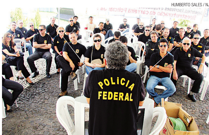
► Categoria está em greve há 11 dias

Os agentes e escrivãos da Polícia Federal estão em greve nacional - delegados não entram no