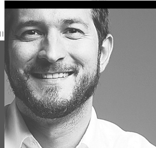
Carlos Fialho escreve nesta coluna aos sábados