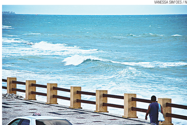
▶ A previsão é de ondas que causarão ainda mais destruição à orla

O aviso de mau tempo é dado quando ainda são feitas as buscas do barco Jefferson I e seus seis tripulantes, desaparecidos no do-