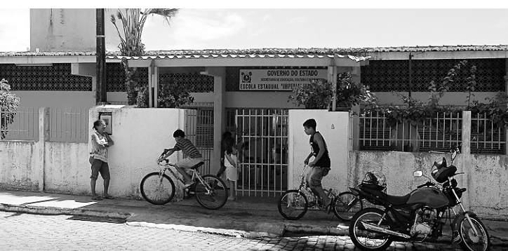
► Escola Estadual Imperial Marinheiro, no bairro Nordeste, e Escola Municipal Luiz Maranhão, em Cidade Nova: entre as piores na avaliação do Ideb