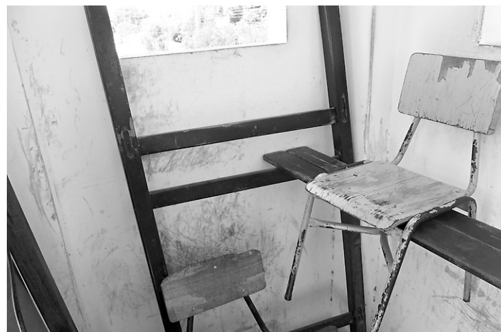
► Fotos cedidas pelos magistrados revelam as condições da Penitenciária Estadual do Seridó, em Caicó (no alto e esq) e do Complexo Penal de Pau dos Ferros (acima)