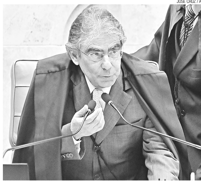
► Ayres Brito: atraso vai depender da extensão do voto de cada ministro

"Você segmenta o voto. Não faz um voto de ponta a ponta e sim por núcleos. O ministro relator seguiu a metodologia da denúncia. Toda ela é fatiada, seg-