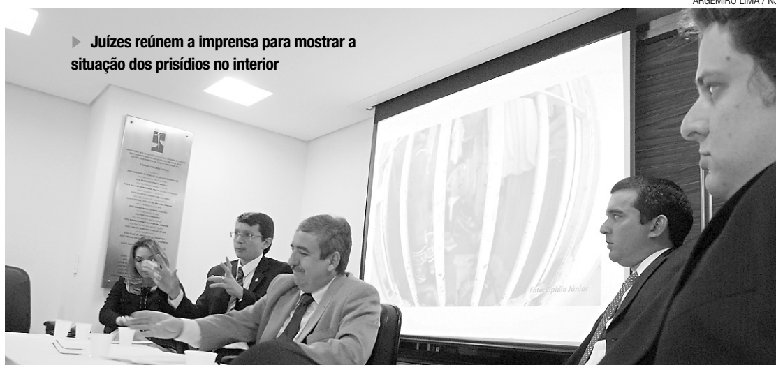
► Juízes reúnem a imprensa para mostrar a situação dos presídios no interior

"Além da estrutura, temos que buscar melhoria da parte operacional envolvendo a questão de armamento e fardamento para agentes prisionais. Peço um crédito para a sociedade, Ministério Público e o próprio judiciário para ofertar novas vagas. Hoje, as policiais militar e civil prendem bandidos e não temos onde colocar", concluiu.