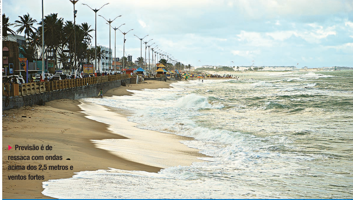
Previsão é de ressaca com ondas acima dos 2,5 metros e ventos fortes