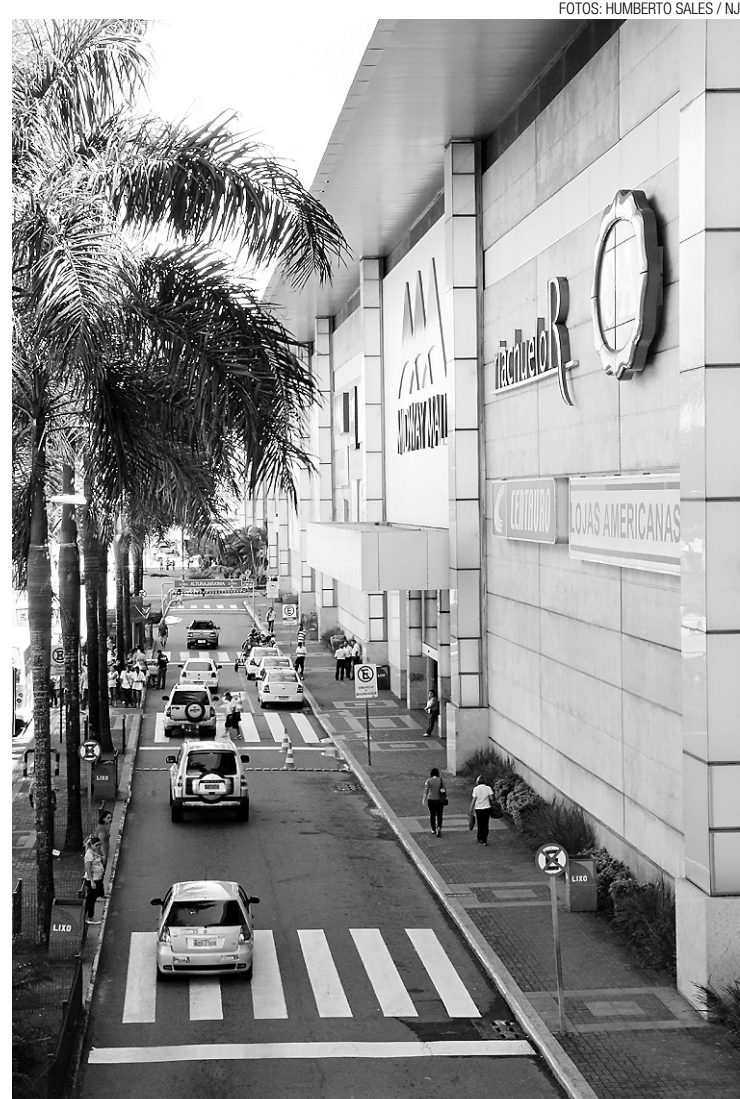
▶ Shopping Midway Mall: calçadas desobstruídas para os pedestres

O diretor ressalta que os que não conseguirem se regularizar não irão ficar na mão. a Secretaria Municipal do Trabalho e Assistência Social (Semtas) deverá encaminhá-los para o Programa de Incentivo à Educação Universitária (Proeduc), iniciativa da Prefeitura em parceria com universidades e faculdades particulares que garante descontos de 50% na mensalidade de cursos do Ensino Superior.